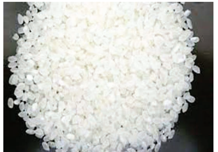
Mchele wa kitumbo