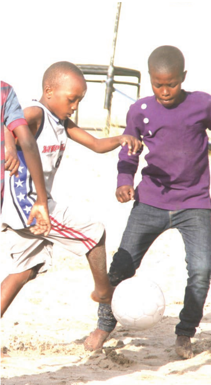
Vijana wakicheza mpira katika kiwanja cha mchanga ndani ya kituo cha michezo cha Jakaya Kikwete, jijini Dar es Salaam jana.

Bingwa kwenye michuano hiyo atak-wenda kuiwakilisha kanda ya CEFAFA, kwenye fainali ya Ligi ya Mabingwa zin-azotarajia kufanyika mwakani nchini Morocco.