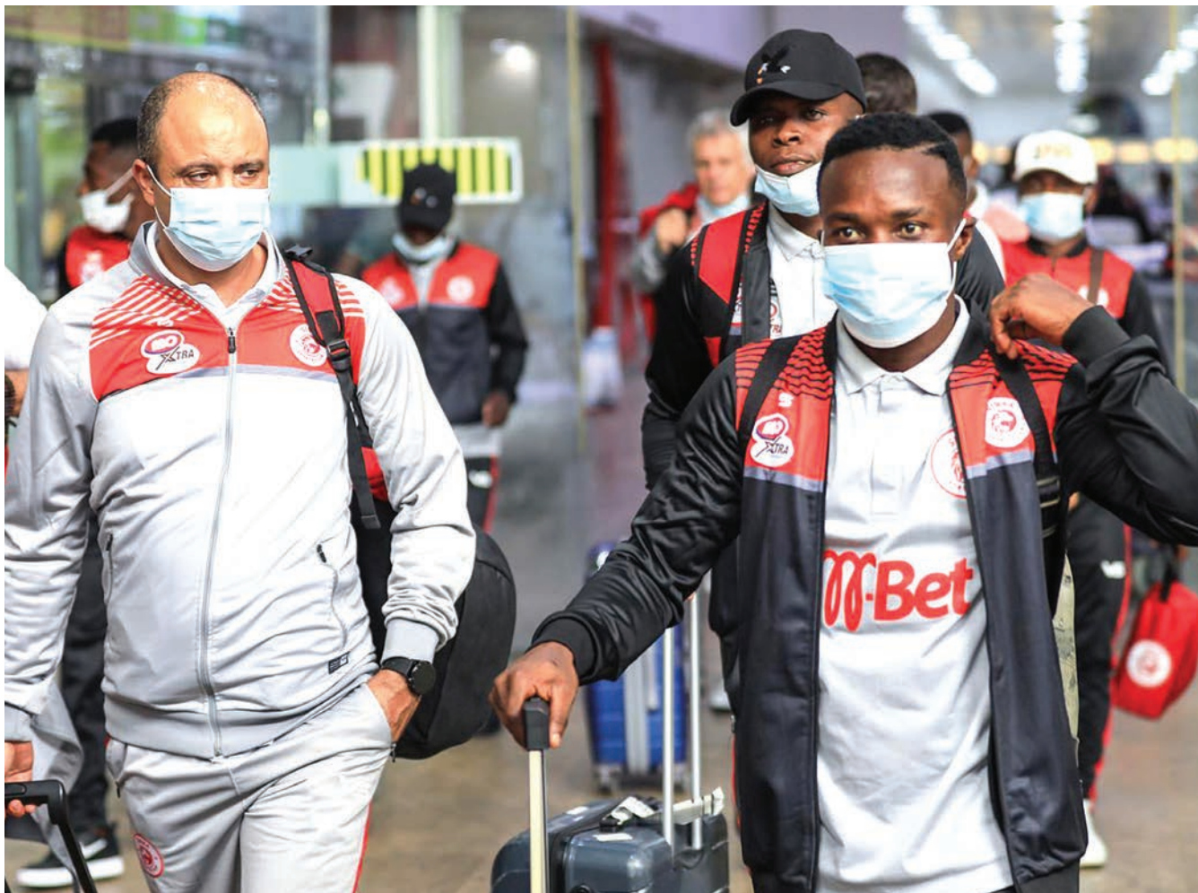
Kikosi cha wachezaji na viongozi wa Simba kikiwasili Uwanja wa Ndege wa Kimataifa wa Khartoum nchini Sudan jana.