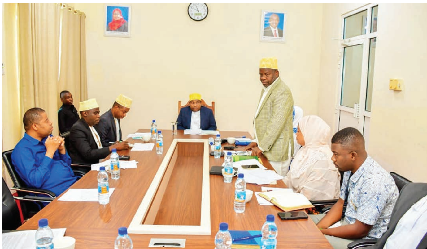
Makamu wa Kwanza wa Rais wa Zanzibar, Othman Masoud Othman (katikati), akizungumza na mawaziri, makatibu wakuu na watendaji wa taasisi zinazosimamia rasimili ya matofali ya mawe na mchanga, kuhusu kupata njia bora za matumizi na uhifadhi wake, ofisini kwake Migombani Zanzibar jana.

Alisema Oman haina dhamira ya kuhodhi nyaraka ama kumbukumbu zilizo hapa nchini na kusema kuwa Serikali ya Mapinduzi ya Zanzibar itaendelea kusimamia nyaraka zake.