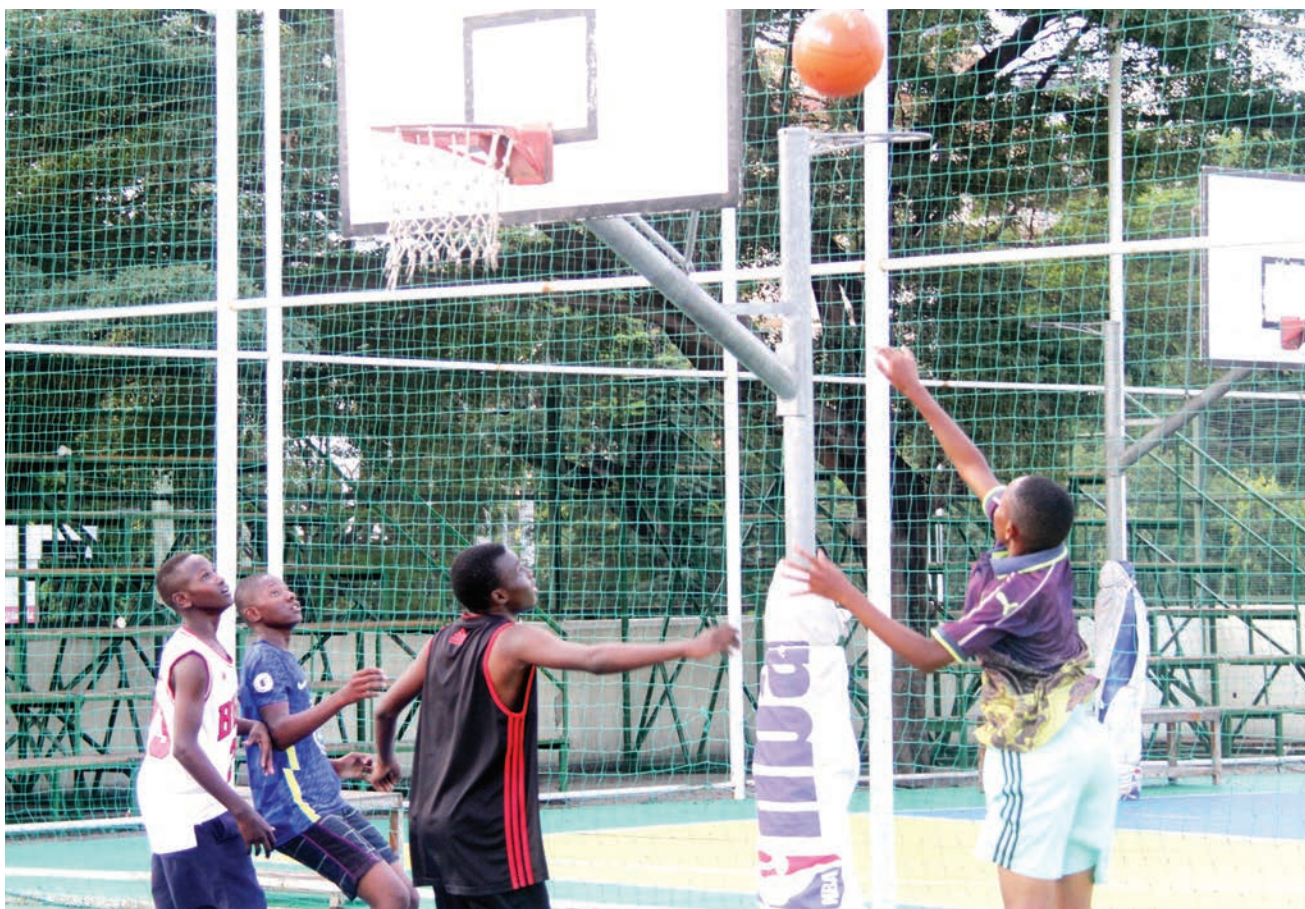
Vijana wakicheza mpira wa kikapu katika viwanja vya Jakaya Kikwete, jijini Dar es Salaam jana.

"Nimekiandaa kikosi changu kupata matokeo ndani ya dakika 45 za kipindi cha kwanza, hivyo tupo vizuri," alisema Mkoma.