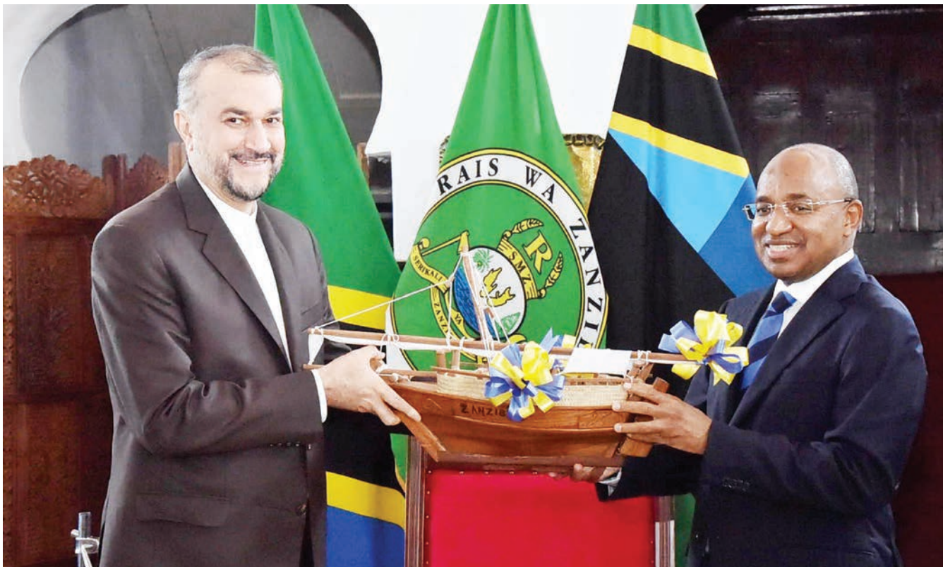
Rais wa Zanzibar, Dk. Hussein Ali Mwinyi (kulia), akikabidhi zawadi ya ngalawa kwa Waziri wa Mambo ya Nje wa Iran, Hossein Amir Abdollahian, baada ya mazungumzo yao na ujumbe wake ikulu jijini Zanzibar jana.

Pia, alisema kutokana na kubainika kuwa NEMC inafanya msako kwenye masoko sasa vifungashio hivyo vimepelekwa kwenye magulio na kuomba TAMISEMI kusaidia kwenye eneo hilo.