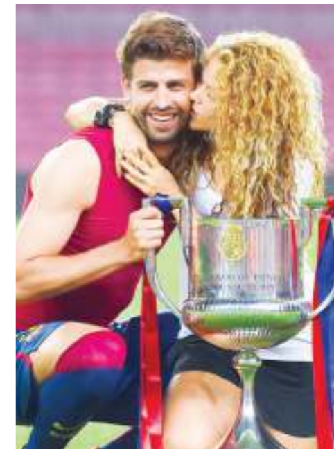
Gerard Pique na mkewe Shakira.

Aliuzwa kwenda Ligi Kuu ya China katika klabu ya Guangzhou Evergrande na kipindi cha majira ya joto cha mwaka 2017, aliuza Barcelona na alicheza kwa mwaka mmoja tu kabla ya kurudi China, ambako alifunga mabao tisa katika mechi 49.