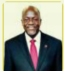
Mhe. Dkt John P. Magufuli Rais wa Jamhuri ya Muungano wa Tanzania 2015 -

Bodi, Menejimenti na Wafanyakazi wa Mfuko wa Maendeleo ya Jamii - TASAF tunaungana na Watanzania kukupongeza Rais wa Jamhuri ya Muungano wa Tanzania Mhe. Dkt. John Pombe Magufuli kwa kuadhimisha miaka 58 ya Uhuru wa Tanzania Bara