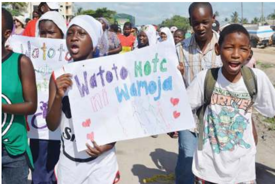
Watoto wakiwa kwenye matembezi ya hisani mwishoni mwa wiki yaliyoandaliwa na Shirika la Time To Help kwa ajili ya kusaidia watoto wenye ulemavu wa viungo na akili wanaolelewa kwenye kituo cha Baba Oreste Bunju B jijini Dar es Salaam.

Kutokana na hali hiyo, CCM ilimwahidi Majaliwa kuwa haitasita kuchukua hatua dhidi ya viongozi wake waliohusika.