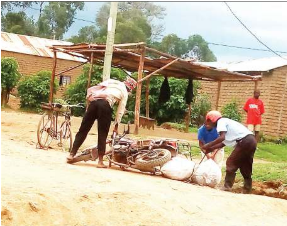
Baadhi ya wasamaria wema wakimsaidia dereva boda-boda kuinua pikipiki yake baada ya kuanguka katika eneo la Ndola Mji Mdogo wa Mbalizi mkoani Mbeya. Alikuwa aki-panda tuta lililowekwa na wananchi, ili kudhibiti mwendokasi wa madereva hao.

Aliwataka wananchi kulinda miundombinu ya REA, ambayo imeegeshwa au kusimikwa kwa ajili ya kupitisha mradi wa umeme okiwamo kukubali kupisha miundombinu hiyo ipite katika maeneo yao ili serikali ikamilishe kazi hiyo haraka kwa ajili ya maendeleo yao.