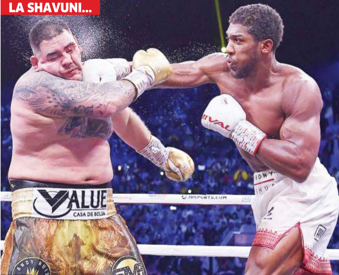
Bondia Anthony Joshua (kulia) akimpelekea konde la shavuni mpinzani wake, Andy Ruiz Jr katika pambano la uzito wa juu kuwania mikanda ya WBA, WBO na IBF lililofanyika katika Uwanja wa Ad Diriyah, mjini Saudi Arabia usiku wa kuamkia jana. Joshua alishinda kwa pointi. HARABARI UK. 29