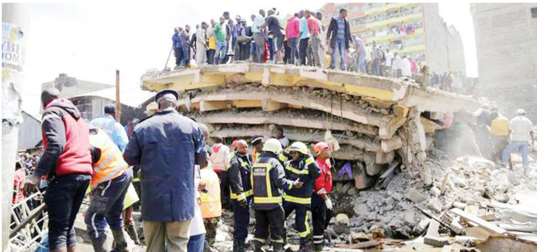
Waokoaji jijini Nairobi wakiwa katika uokoaji baada ya jengo lenye ghorofa sita kuporomoka jijini humo, nchini Kenya, watu kadhaa wanahofiwa kufunikwa na vifusi vyake. PICHA ALLIANCE

Miji ya India imekuwa ikikabiliwa na visa vibaya vya moto, huku mpanigilio mbaya wa makazi na kuzembea kwa maafisa katika suala la kuzingatia kanuni za usalama kama chanzo kuu cha mkasa huo. BBC