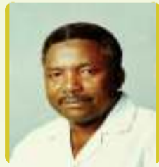
Mhe. Ali H. Mwinyi Rais wa Jamhuri ya Muungano wa Tanzania 1985 - 1995