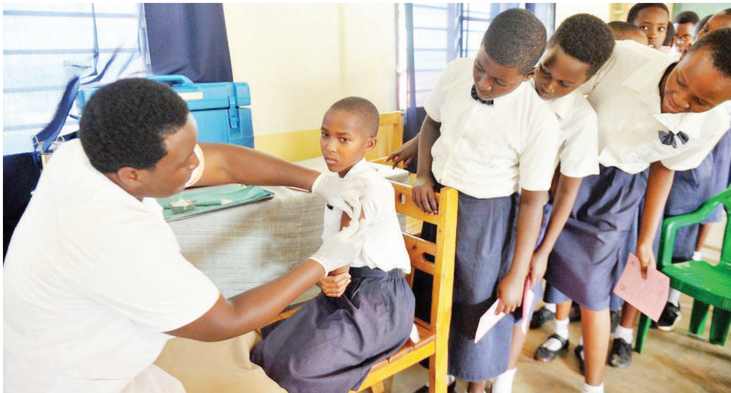
Wasichana wakipata huduma za kitabibu, ikiwamo uangalizi dhidi ya saratani ya shingo ya kizazi, katika moja ya nchi jirani.