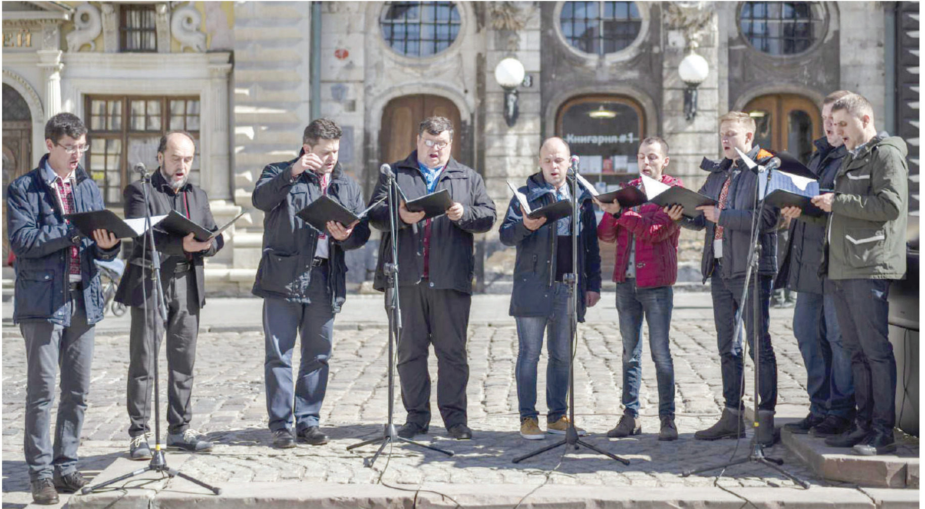
Bendi ya Lviv National Philharmonic ikifanya onyesho la burudani mubashara, kwenye mji wa Lviv, ambao haujaguswa na mapigano na kwa wengi waliokimbia makazi yao, kituo chao cha kwanza ndani ya Ukraine ni Lviv, katika mji huo uliopo Magharibi wenye urithi wa utamaduni.