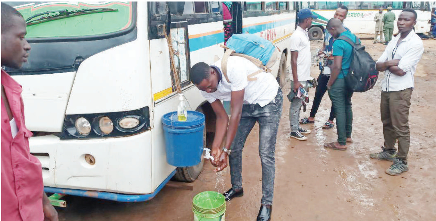
Abiria katika kituo kidogo cha Mabasi akinawa mikono kwa sabuni na maji tiririka kabla ya kuingia ndani ya basi kuanza safari.

• Wenyeji wakiri wameumwa sana kwa uchafu