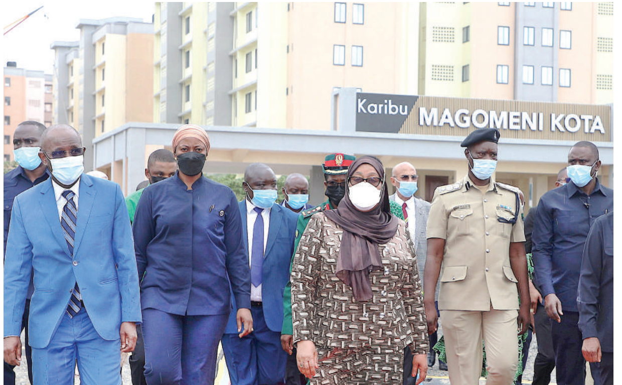
Rais Samia Suluhu Hassan akiwa na Waziri wa Ujenzi, Prof. Makame Mbarawa (kushoto), baada ya kuzindua mradi wa nyumba 644, zilizojengwa na serikali kupitia Wakala wa Majengo Tanzania (TBA), Magomeni Kota mkoani Dar es Salaam jana.