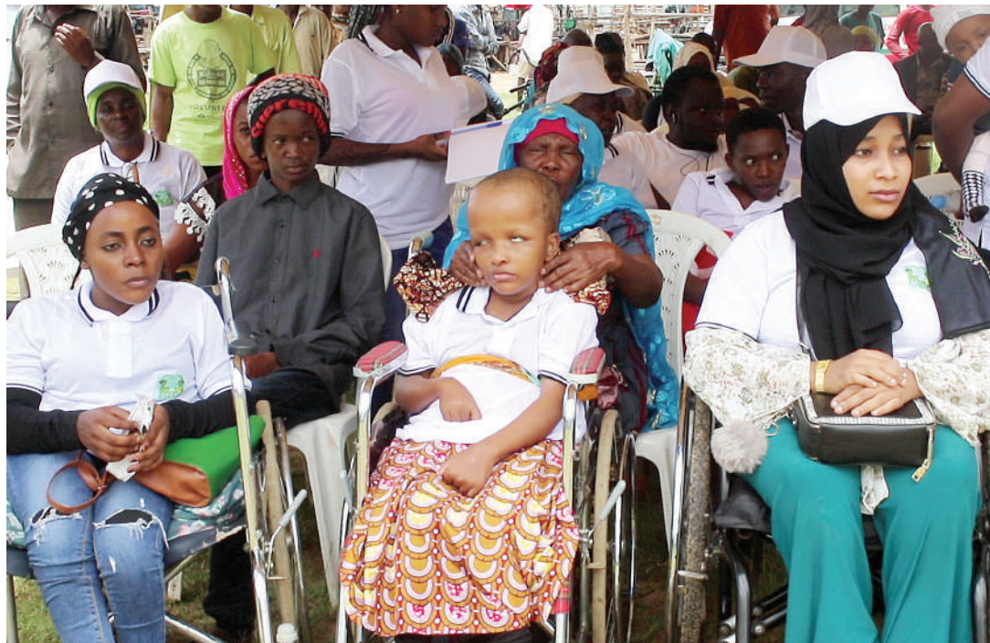
Jamii ya wenye ulemavu katika moja ya mjumuiko wao.

Umoya wa Mataifa mwaka 1948, ulipitisha azimio linaloeleza binadamu wote wamezaliwa sawa na huru na wana haki za kustahili heshima, hali kadhalika naye