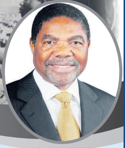
H.E. ALI MOHAMED SHEIN PRESIDENT OF THE REVOLUTIONARY GOVERNMENT OF ZANZIBAR