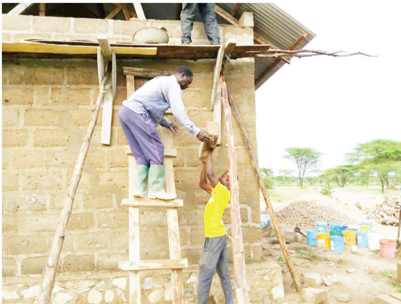
Mafundi wakijenga moja ya madarasa mapya ya Shule ya Msingi Nyamiyenga iliopo Kata ya Kiriba wilaya ya Musoma mkoani Mara juzi ikiwa ni uboreshaji wa miundombinu.