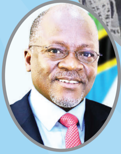
THE H.E. DR. JOHN POMBE MAGUFULI PRESIDENT OF THE UNITED REPUBLIC OF TANZANIA