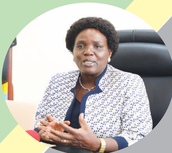
Mhe. Profesa Joyce Lazaro Ndalichako (Mb.) Waziri

HOTUBA YA WAZIRI WA ELIMU, SAYANSI NA TEKNOLOJIA, MHESHIMIWA PROF. JOYCE LAZARO NDALICHAKO (MB) AKIWASILISHA BUNGENI MAKADIPIO YA MAPATO NA MATUMIZI YA FEDHA KWA MWAKA 2020/21