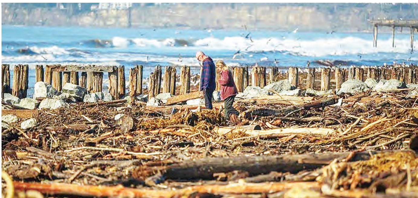
Wakazi wakiangalia masalia yaliyobaki katika fukwe ya Reo Del Mar, California nchini Marekani kutokana na kimbunga kupiga eneo hilo hivi karibuni na kuharibu makazi ya watu.