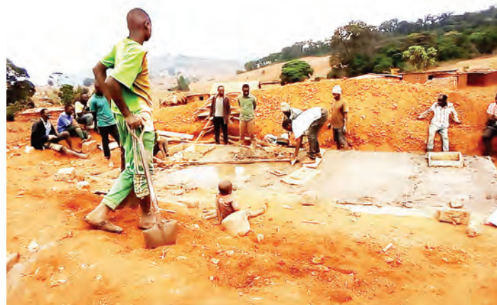
Mafundi wakiendelea na ujenzi wa vyoo shuleni Kiboriani juzi. Shule hiyo iliripotiwa na gazeti hili mnamo Agosti 7, mwaka jana kuwa na hali mbaya ya huduma hiyo pamoja na miundombinu ya madarasa, nyumba na ofisi za walimu.

Uamuzi huo wa serikali unajibu hoja ya Mdhambi na Mkaguzi Mkuu wa Hesabu za Serikali (CAG) ya Aprili 2017, alipofanya ukaguzi maalum wa miundombinu na samani za shule za msingi nchini na kubaini nyingi zina hali mbaya.