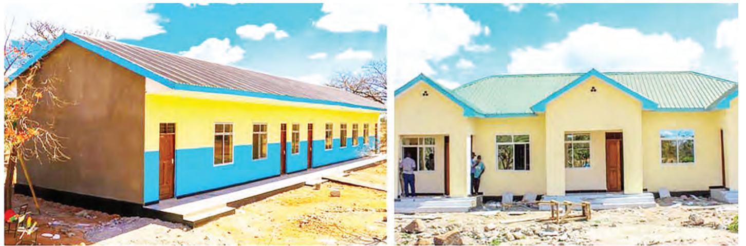
Picha elekezi ya madarasa na nyumba za walimu zinazotarajiwa kujengwa na serikali shuleni Kiboriani kukabili hali mbaya iliyothibitishwa baada ya kuripotiwa na gazeti hili.