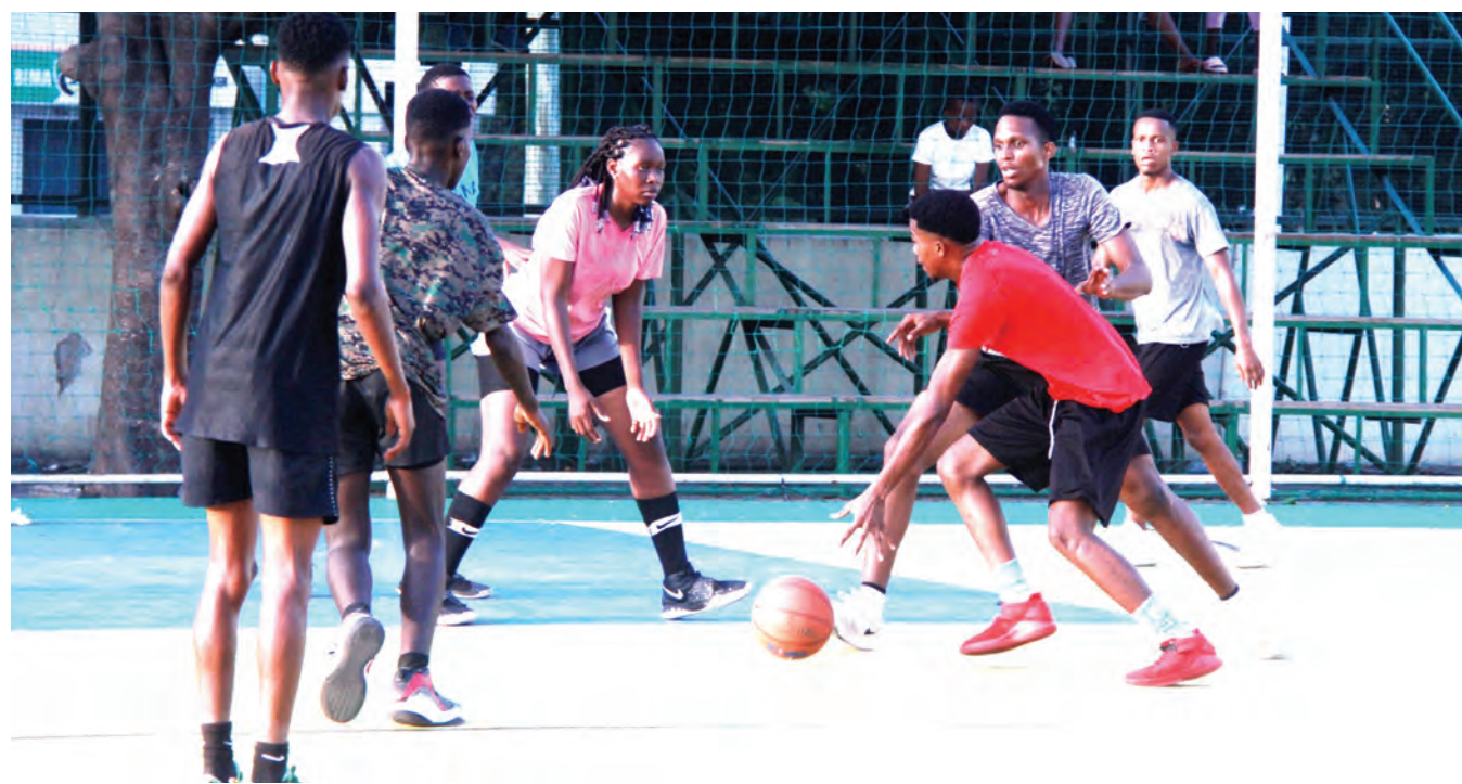
Wachezaji wa mpira wa kikapu kutoka timu mbalimbali Dar es Salaam wakifanya mazoezi kwa ajili ya kulinda viwango vyao katika viwanja vya Jakaya Kikwete Youth Park, Dar es Salaam jijini jana.

“Hatupo katika nafasi nzuri katika msimamo wa ligi, ndio maana tulifanya usajili mdogo kulingana na mahitaji ya kikosi, ninamatumaini makubwa kikosi chetu kitaanza kupata ushindi kutokana na kiwango kizuri walichokionyesha katika mechi hii ya kwanza,” Matu alisema.