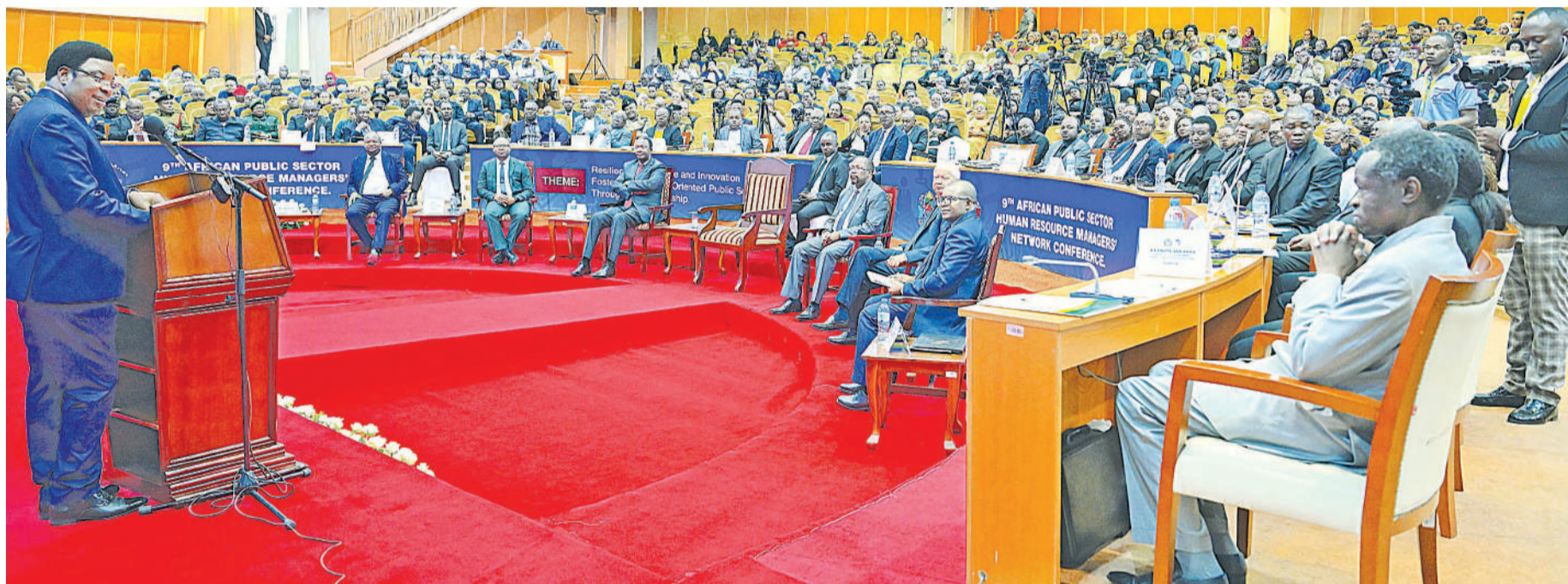
Waziri Mkuu, Kassim Majaliwa, akizungumza alipomwakilisha Rais Samia Suluhu Hassan katika ufunguzi wa Mkutano wa Tisa wa Mwaka wa Mtandao wa Wasi-mamizi wa Mameneja Rasilimali Watu katika Sekta ya Umma uliofanyika Kituo cha Kimataifa cha Mikutano Arusha (AICC) jana.

Mfumo wa elimu nchini wakosolewa hautoi majibu ya matatizo