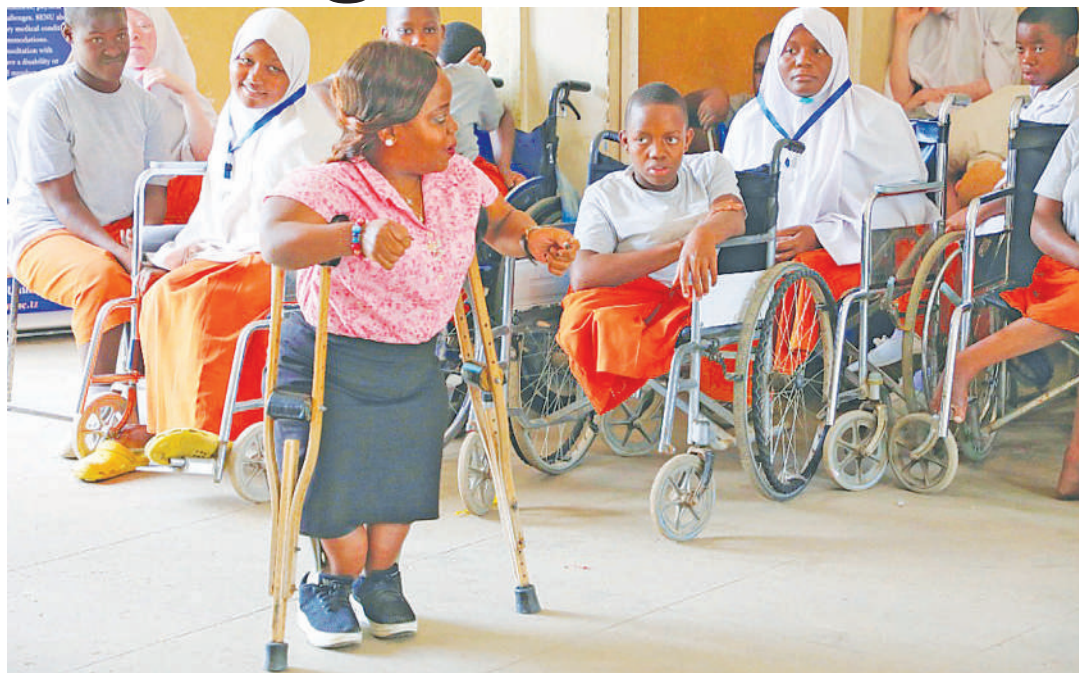
Wanafunzi wenye mahitaji maalumu wanahitaji mazingira na miundombinu rafiki kwenye elimu.

"Kituo hiki kitotoa nafasi kwa wanafunzi wote wenye ulemavu, aidha na wenye kuhitaji msaada wa kisaikolojia, na huduma nyingine kwa wanafunzi wa kawaida ili kukabiliana na ukatili wa kijinsia, tutahakikisha wanapata msaada unaostahili ili kuimarisha elimu na kufanikisha malengo yao ya kitaaluma, kituo hiki ni sehemu muhimu ya mpango wa chuo