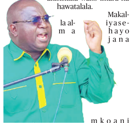
Makalla aliyasehaya jana

Mwenezi huyo pia amesema uchaguzi wa awamu hii hauna kupita bila kupingwa, hivyo wagombea na wanachama wa chama hicho wasibweteke, akisisitiza wako imara na hawatalala.