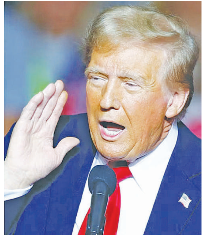
Wagombea urais wa Marekani Makamu Rais Kamala Harris na rais wa zamani, Donald Trump, wakizungumza katika mikutano yao ya kampeni.