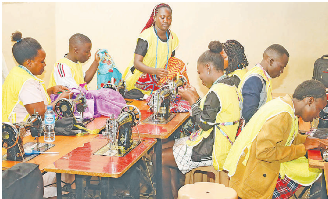
Kubuni mitindo na kushona ni moja ya stadi za kazi wanazojifunza mabinti shuleni.

Kadhali wanawake walioelimika wanachangia katika kukuza uchumi kwa kufanya kazi katika sekta mbalimbali. Elimu hiyo inawajengea uwezo wa kuanzisha biashara na hivyo kujikwamua kiuchumi, wanawake walioelimika wanajua umuhimu wa afya na hivyo kutunza afya zao na familia. Pia wanakuwa na uwezo wa kupanga familia zao na hivyo kuchagua idadi ya watoto wanay-