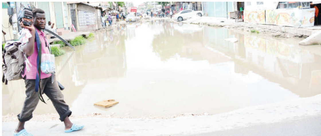
Mwananchi akipita kando ya barabara kutokana na maji yaliyotuma kujaa kwa sababu ya mvua iliyonyesha juzi katika mtaa wa Kigogo Ilala, jijini Dar es Salaam jana.

Kata zinazoguswa na mradi huo ni Pasua na Ngangamfumuni za Manispaa ya Moshi, Mabogini, Mwika Kusini, Mwika Kaskazini na Kirua Vunjo za Halmashauri ya Wilaya ya Moshi.