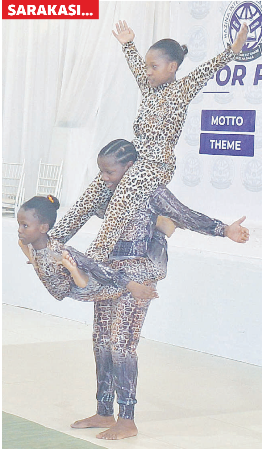
Wanafunzi wa Shule ya Msingi Hazina ya Magomeni, wakionesha umahiri wao wa michezo mbalimbali ikiwamo sarakasi wakati wa mahafali ya Shule ya Awali na Msingi mwishoni mwa wiki, Dar es Salaam.