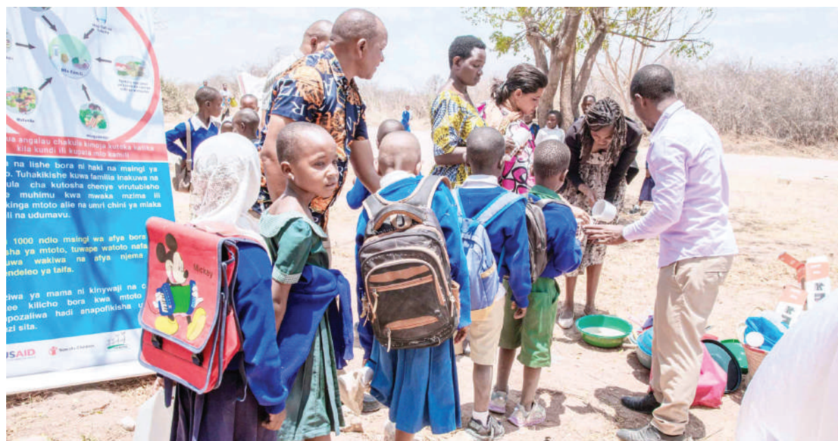
Wanafunzi wa Shule ya Msingi Chikole wakipatiwa uji wa lishe bora na walimu wao, siku ya maadhimisho ya lishe yalifanyika Kata ya Msalato Dodoma jana.