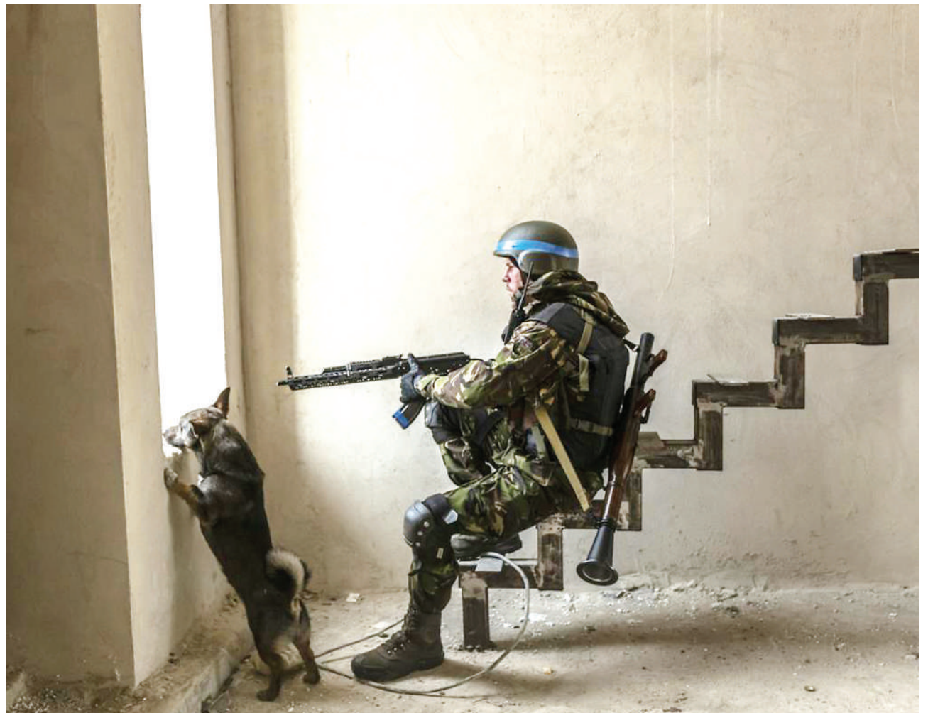
Mwanajeshi wa Ukraine akiwa na mbwa akiwa ndani ya nyumba iliyoteketezwa kwa mabomu wakati akipambana na vikosi vya Russia katika mji wa Irpin.