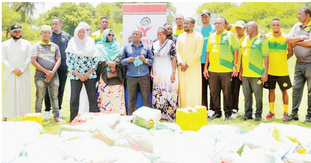
Klabu ya Yanga kwa kushirikiana na Kampuni ya GSM Foundation wakiwa katika picha ya pamoja na wawakilishi wa vituo vya watoto yatima ambavyo vimepata msaada wa chakula kwa ajili ya kuupokea mwezi wa Ramadhani.