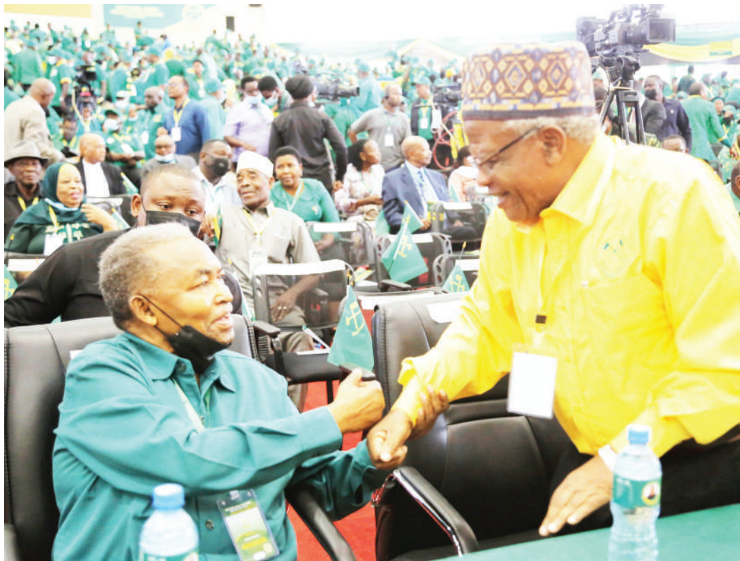
Waziri Mkuu mstaafu Cleopa David Msuya (kushoto), akisalimiana na Katibu Mkuu mstaafu wa CCM, Mzee Yusufu Makamba, walipokutana kwenye Mkutano Mkuu Maalumu wa CCM, jijini Dodoma jana.