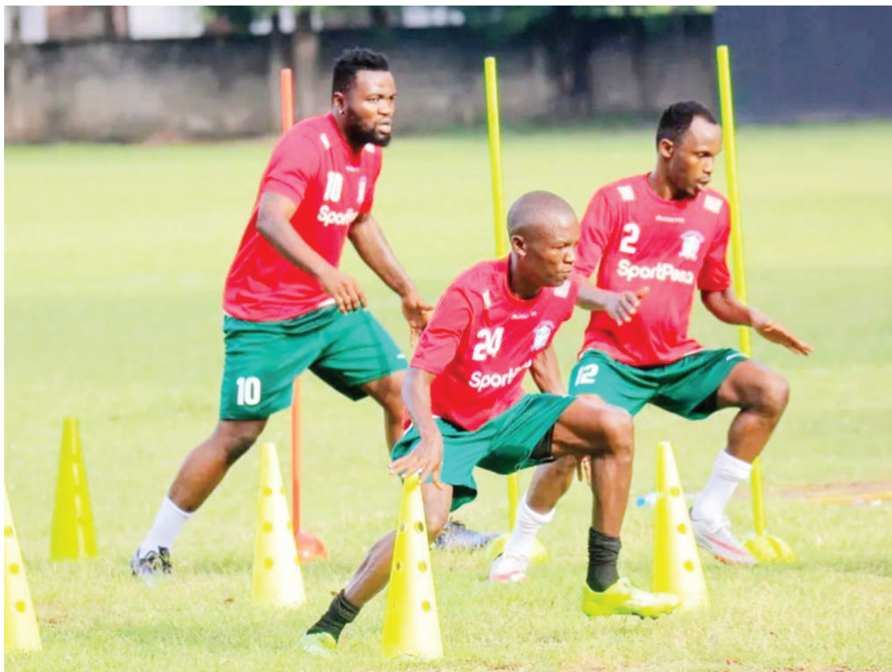
Wachezaji wa Namungo kutoka mkoani Lindi wakifanya mazoezi kwa ajili ya kujiandaa na mechi ya Ligi Kuu Tanzania Bara dhidi ya KMC FC itakayochezwa kesho kwenye Uwanja wa Azam Complex jijini Dar es Salaam.

Yanga yenye pointi 48 ndio vinara wa ligi hiyo inayoshirikisha timu 16 wakati Simba iliyoko katika nafasi ya pili ikiwa na pointi 37 mkononi ndio mabingwa watetezi wa ligi hiyo.