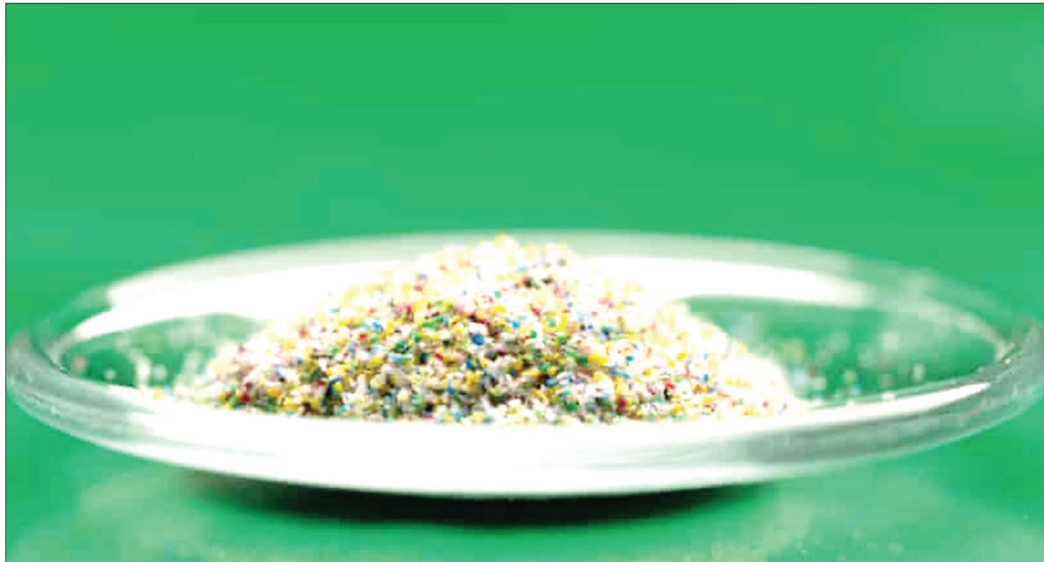
Chembechembe za plastiki zilizogundulika kuwa kwenye damu ya binadamu