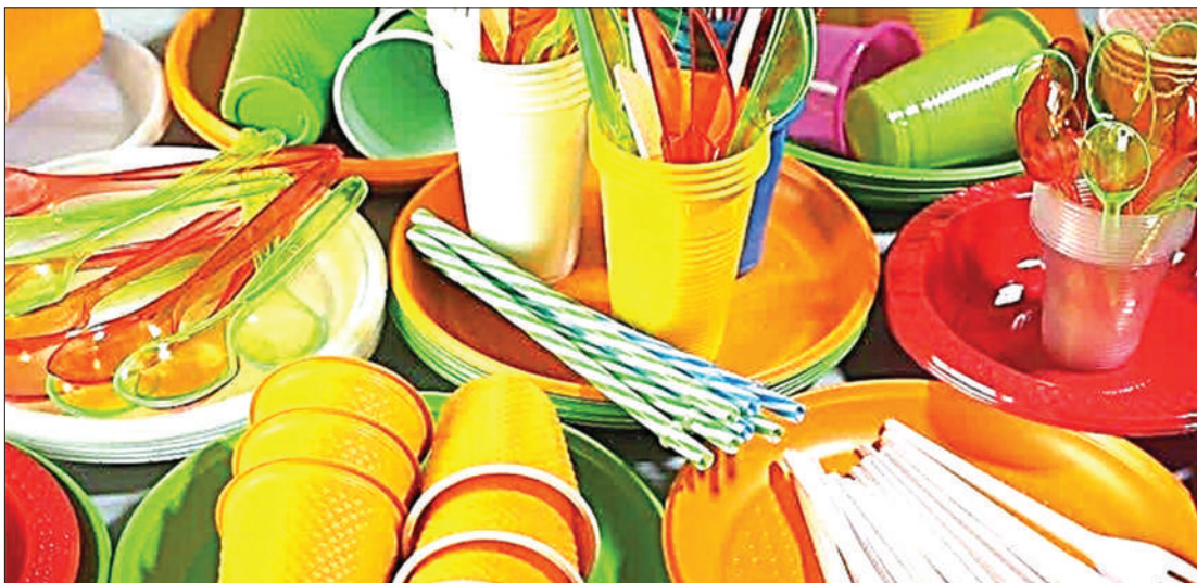
Baadhi ya vyombo vya plastiki vinavyosadikika kuchangia tatizo hilo

"Tatizo linakua kwa haraka zaidi kila siku," alitahadharisha.