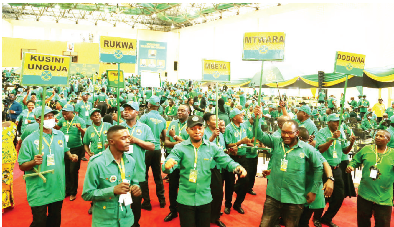
Wajumbe wa Mkutano Mkuu Maalumu wa CCM, kutoka mikoa mbalimbali nchini wakiserebuka kwa furaha, wakati wa mkutano huo, jijini Dodoma jana.

Makamba alihoji na kuibua vicheko ukumbini.