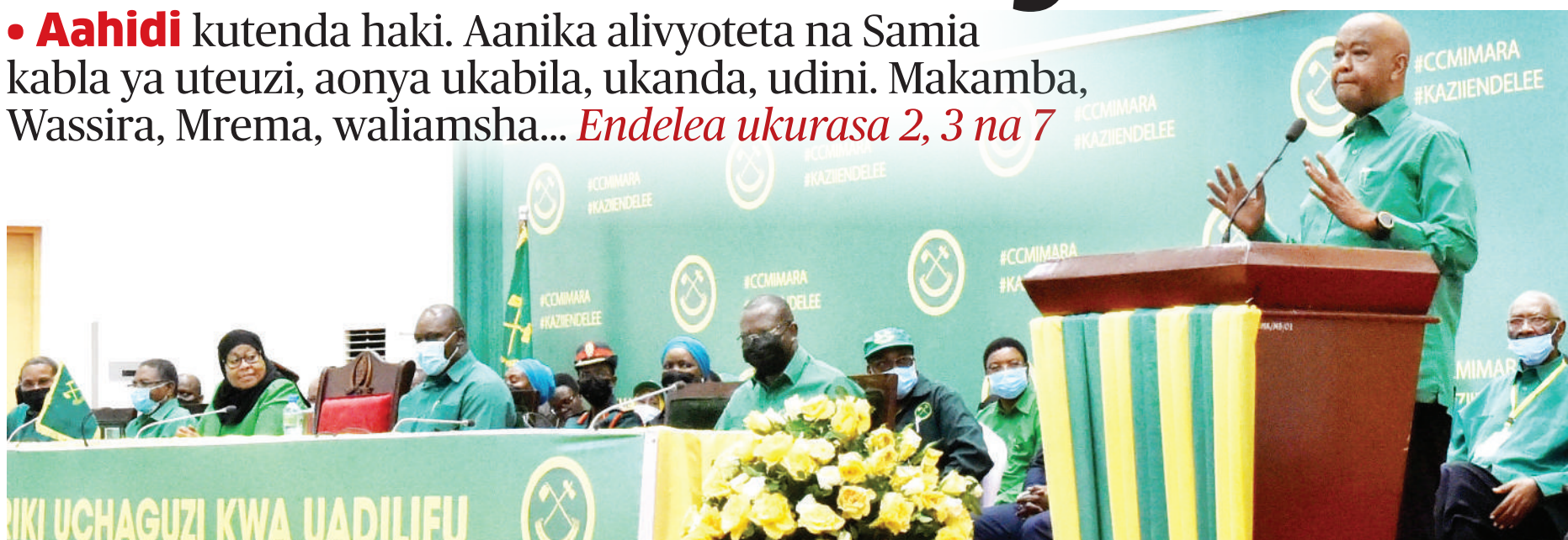
Makamu Mwenyekiti wa CCM, Abdulrahman Kinana, akizungumza wakati akitoa shukrani kwa Wajumbe wa Mkutano Mkuu Maalum wa chama hicho, kwa kumchagua kwa kura nyingi kushika nafasi hiyo, jijini Dodoma jana. Watatu kushoto ni Mwenyekiti wa chama hicho, Rais Samia Suluhu Hassan.

• Aahidi kutenda haki. Aanika alivyoteta na Samia kabla ya uteuzi, aonya ukabila, ukanda, udini. Makamba, Wassira, Mrema, waliamsha... Endelea ukurasa 2, 3 na 7