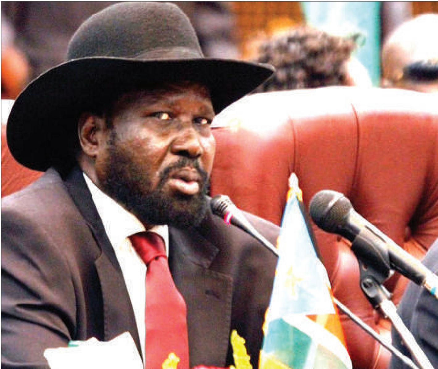
Rais wa Sudan Kusini, Salva Kiir, nchi yake inatikisa kwa mauaji ya wauguzi na madaktari wanaosaidia wagonjwa vijijini.