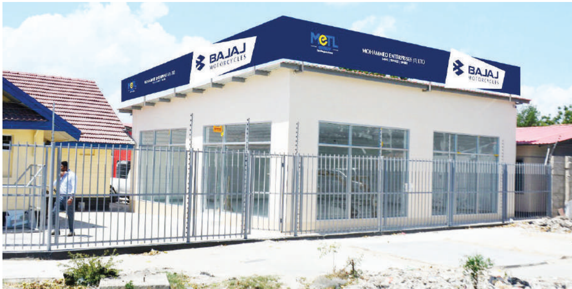
Jengo la ofisi ya Kampuni ya Mohamed Enterprises Limited (MeTL) inayouza bajaj na pikipiki.

Kampuni ya Bajaj Auto Ltd inauza bidhaa nyingi ikiwamo pikipiki za boxer