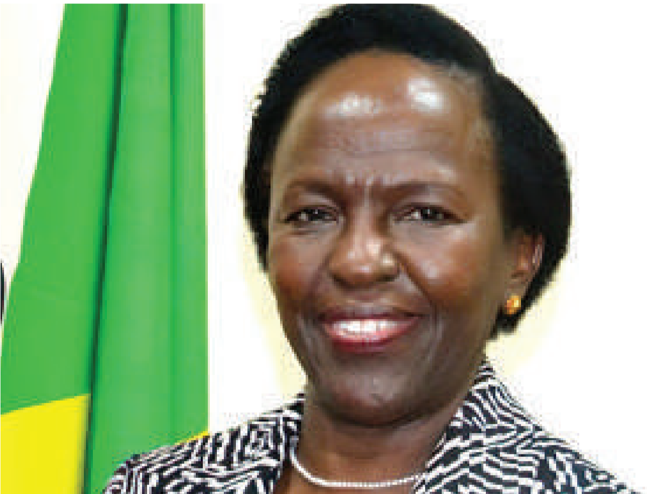
Waziri wa Mambo ya Nchi za Nje, Balozi Liberata Mulamula, majukumu yake ni pamoja na kushughulikia mikataba ya ushirikiano na masuala ya mtangamano wa Afrika.