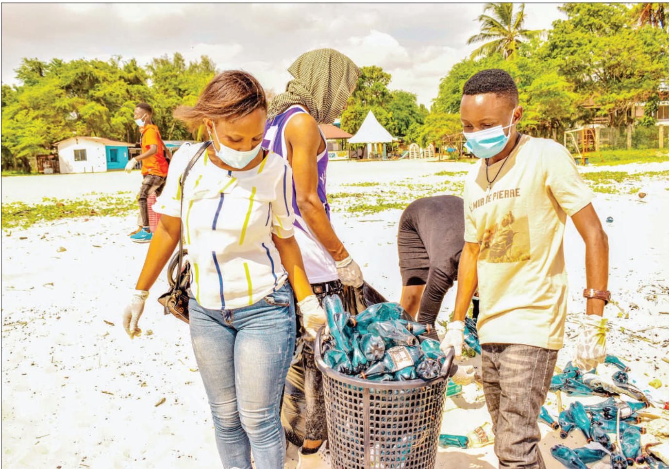
Wanafunzi wa Chuo kikuu cha Tumaini Dar es Salaam (TUDARCo), wakifanya usafi katika ufukwe wa Coco, eneo la Oysterbay jijini Dar es Salaam kama sehemu ya maadhimisho ya Siku ya Mazingira Duniani mwishoni mwa wiki.

Alisema uongozi wa kijiji hicho hawaitambui hati hiyo kutokana na mmiliki wa awali kutolalamika mahali popote.