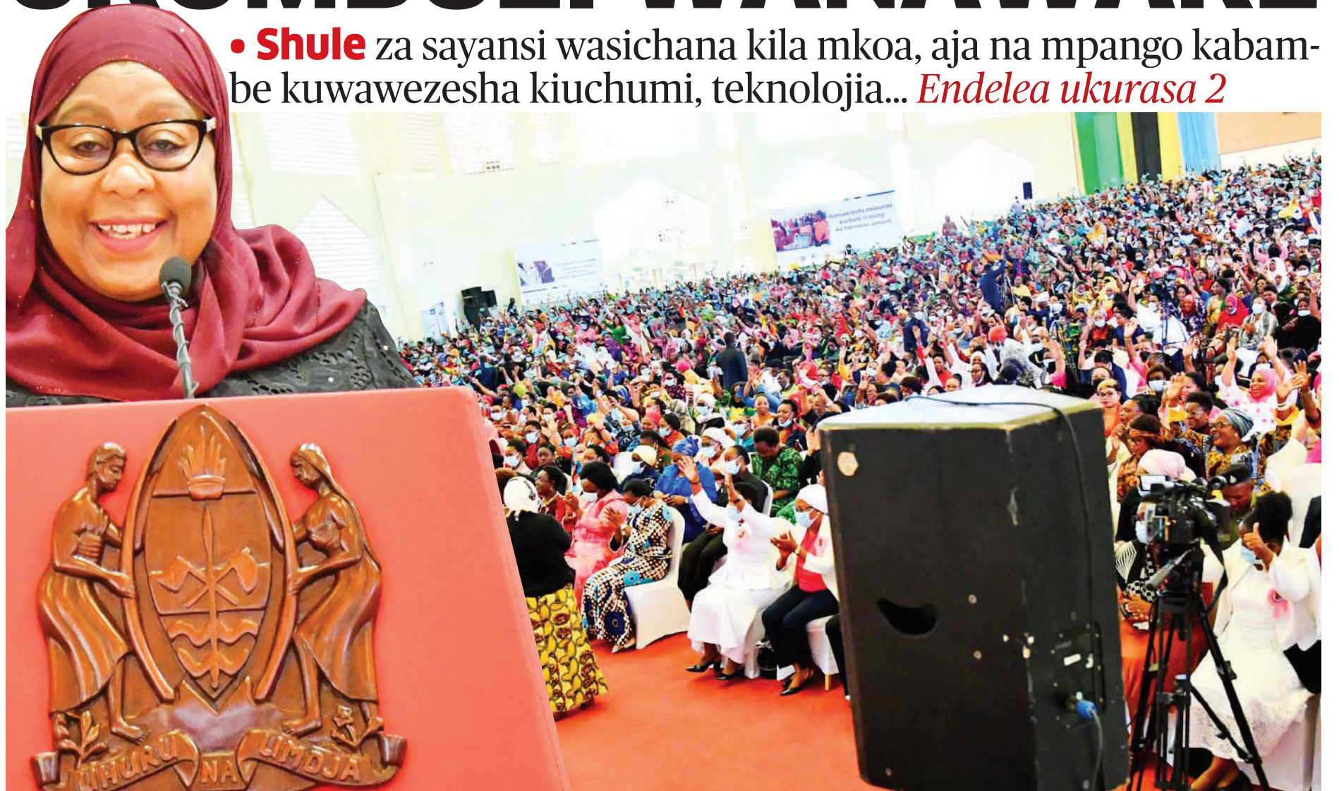
Rais Samia Suluhu Hassan akizungumza na wanawake wa Tanzania, jijini Dodoma jana.

• Shule za sayansi wasichana kila mkoa, aja na mpango kabambe kuwawezesha kiuchumi, teknolojia... Endelea ukurasa 2