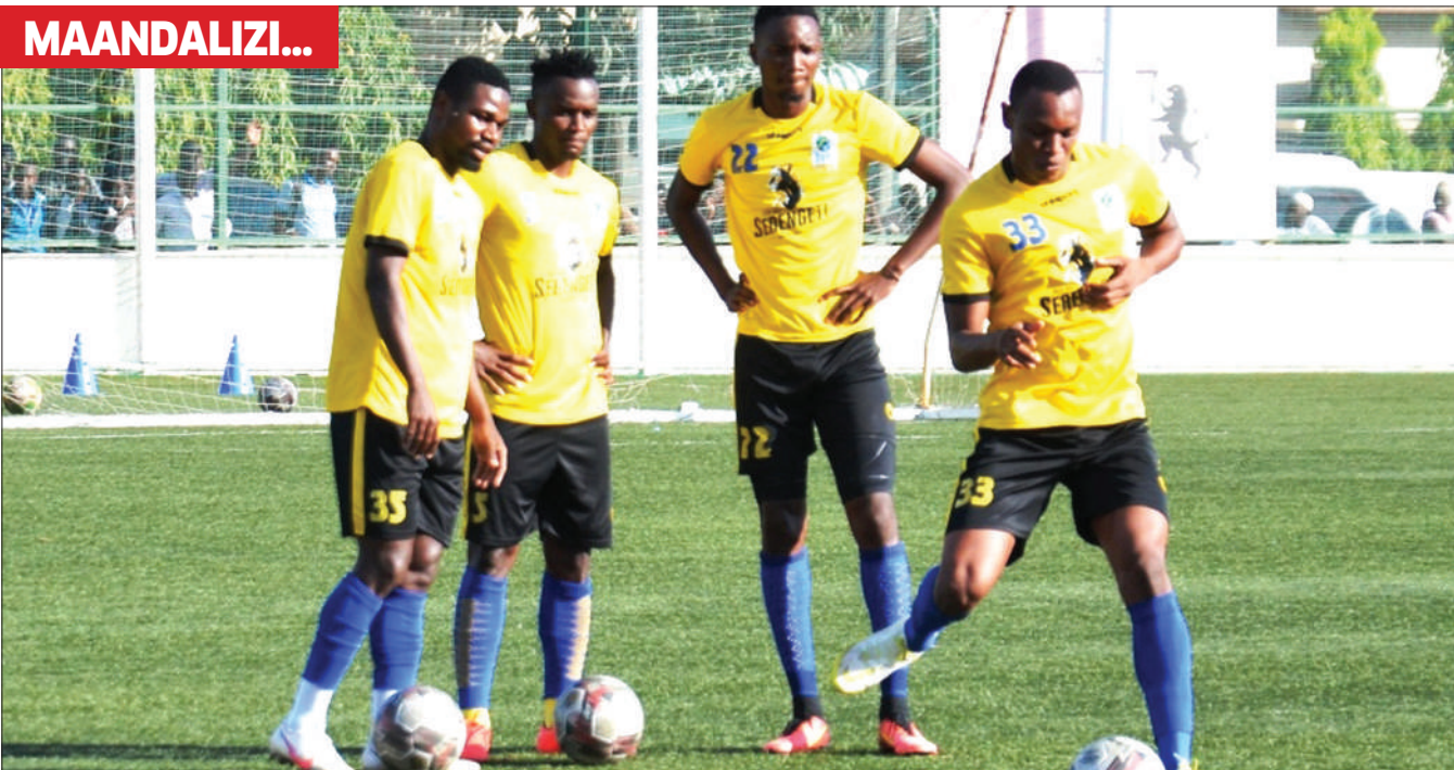
Wachezaji wa timu ya Taifa, Taifa Stars, wakifanya mazoezi katika viwanja vya Jakaya Kikwete jijini Dar es Salaam jana, kujiandaa na mchezo wa kirafiki dhidi ya Malawi.