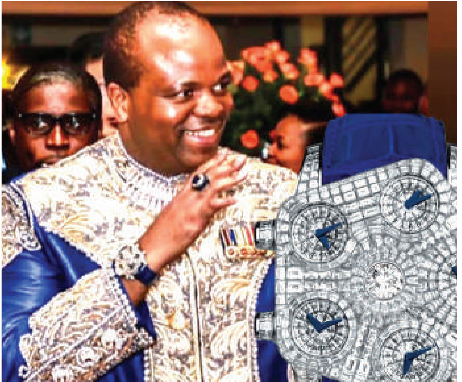
Mfalme Mswati katika shughuli za kitaifa.

Akisisitiza hoja ya kubadili jina anasema: "Jina la Swaziland lime-sababisha sintafahamu. "Kila wakati tunapozuru nje ya nchi watu wanasema tunatokea Swit-