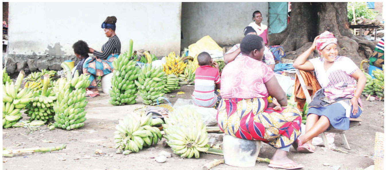
Baadhi ya wajasiriamali wa ndizi katika Soko la Matema, wilayani Kyela, mkoani Mbeya wakisubiri wateja mwishoni mwa wiki.

Alisema ili kutatua mgogoro huo ni vema wakatamia njia za kisheria ikiwemo kwenda mahakamani badala ya kuendelea kutishiana bila kupata suluhu ya kudumu.