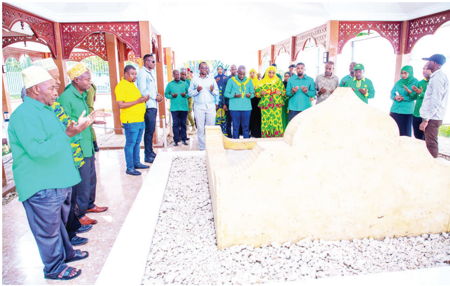
Naibu Waziri Mkuu na Waziri wa Nishati, Dk. Doto Biteko, akiomba dua katika kaburi la Rais wa Kwanza wa Zanzibar, Hayati Abeid Amani Karume lililopo Kisiwandui, Wilaya ya Mjini, Mkoa wa Mjini Magharibi.