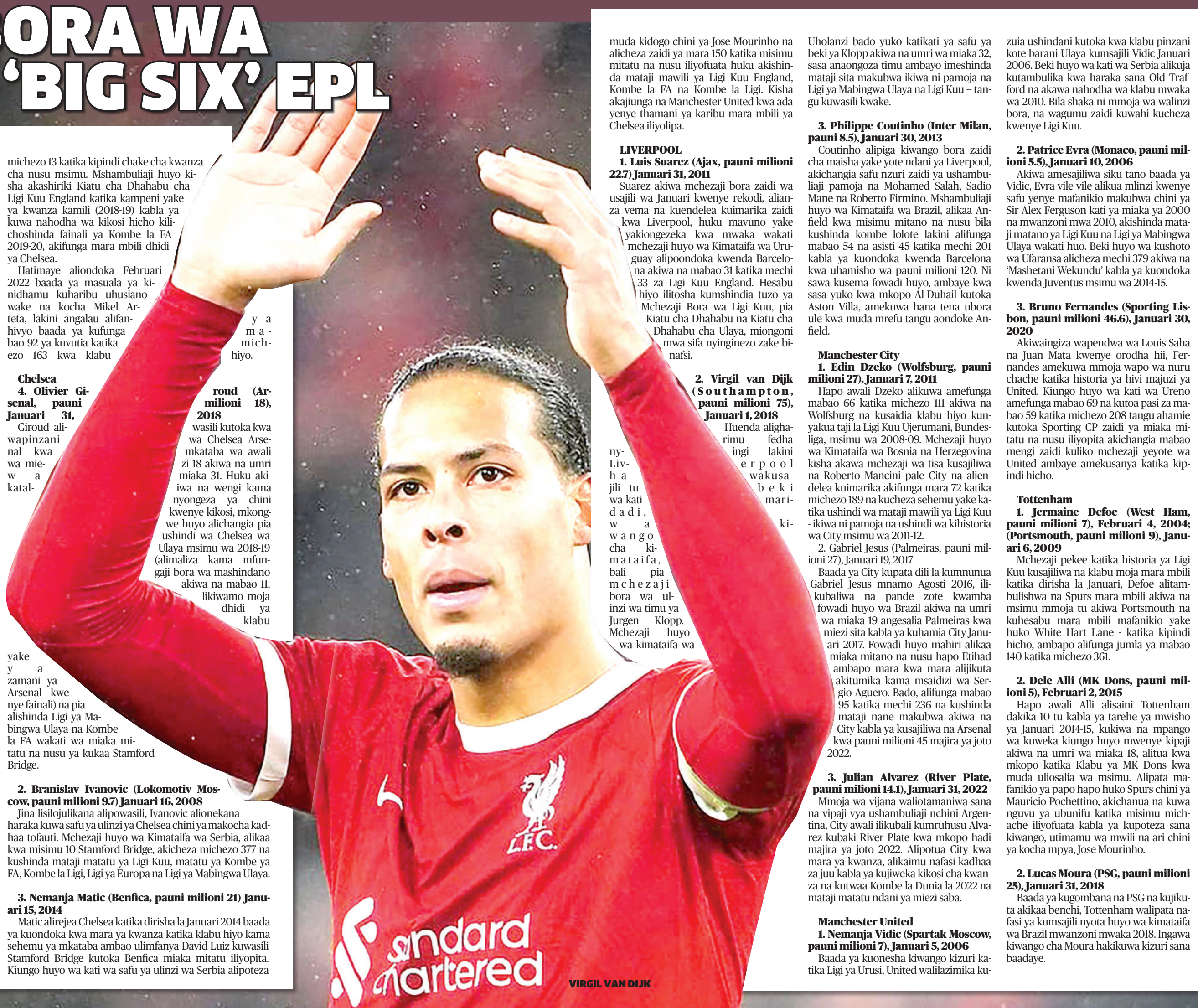
VIRGIL VAN DIJK