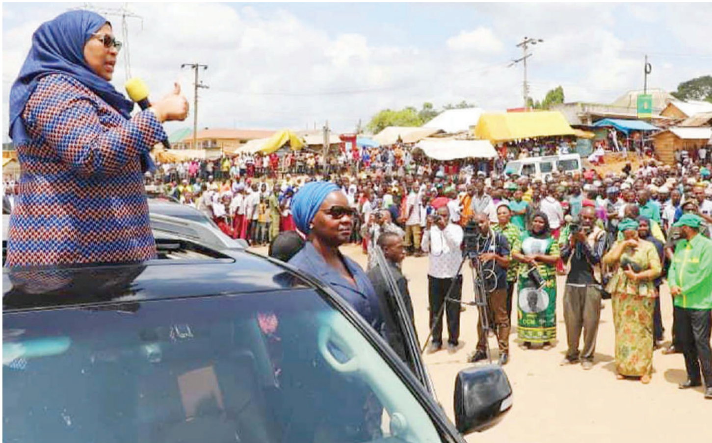
Makamu wa Rais, Samia Suluhu Hassan, akizungumza na wananchi wa Mkata, aliposimama kuwasalimia juzi Jumatatu, katika siku ya kwanza ya ziara yake mkoani Tanga.

Mwandishi wa makala haya ni Katibu Tawala wa Wilaya ya Handeni. Anapatikana kwenye simu namba +255 754691540