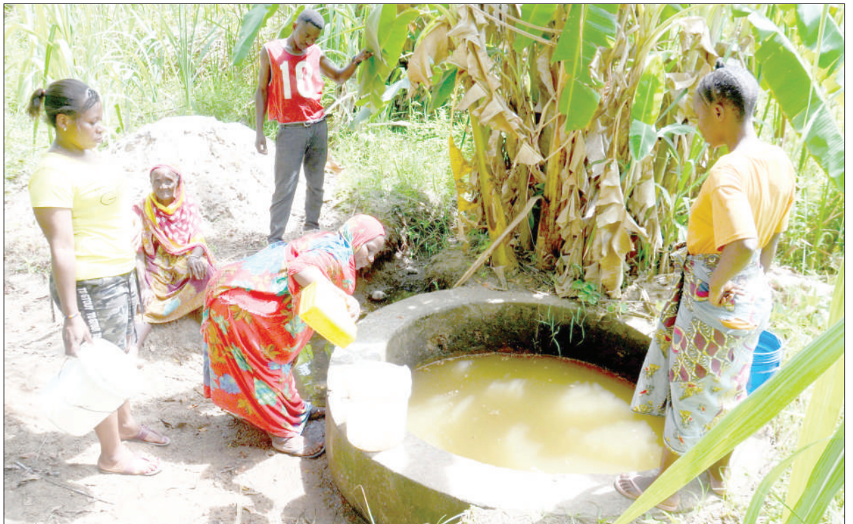
Wakazi wa Mtaa wa Kichangani, Kata ya Kisarawe Two, Manispaa ya Kigamboni, mkoani Dar es Salaam, wakichota maji yasiyo salama kwenye kisima kwa ajili ya matumizi ya nyumbani jana, ambapo wamelalamikia kiwanda cha kutengeneza maturubai, mika na vyombo vya plastiki cha Ruida, kwa kutiririsha maji machafu yanayoharibu mazingira ya wakazi wa eneo hilo.