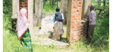
Kaburi la Chifu Nkosi Mharule Bin Zulu Gamu.

Maburi lake limebeba maajabu, ni kote wamiminika kuhiji • Atoka Afrika Kusini, azikwa na wawili hai