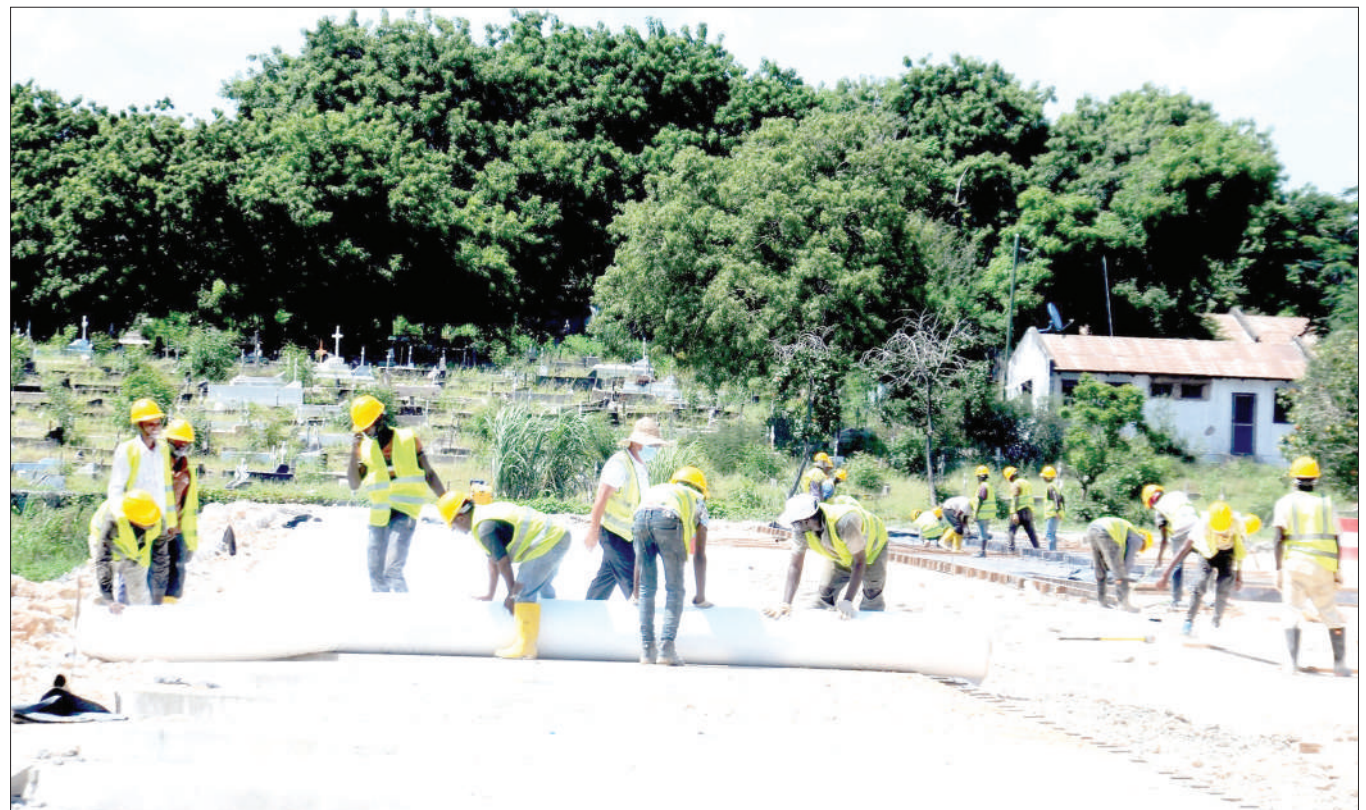
Mafundi wa kampuni ya CCECC, wakiendelea na ujenzi wa kituo cha maegesho ya magari cha Manispaa ya Temeke, eneo la makaburi ya Wailles Chang'ombe, mkoani Dar es Salaam mwishoni mwa wiki.

“Mnano Januari 23, mwaka huu, duka hilo liliuza Whisky ambayo huuzwa kwa gharama ya Sh. 35,000, lakini alitoa stakabadhi inayoonyesha kuwa ameua kwa bei ya Sh. 3,500 kwa chupa moja,” alisema.