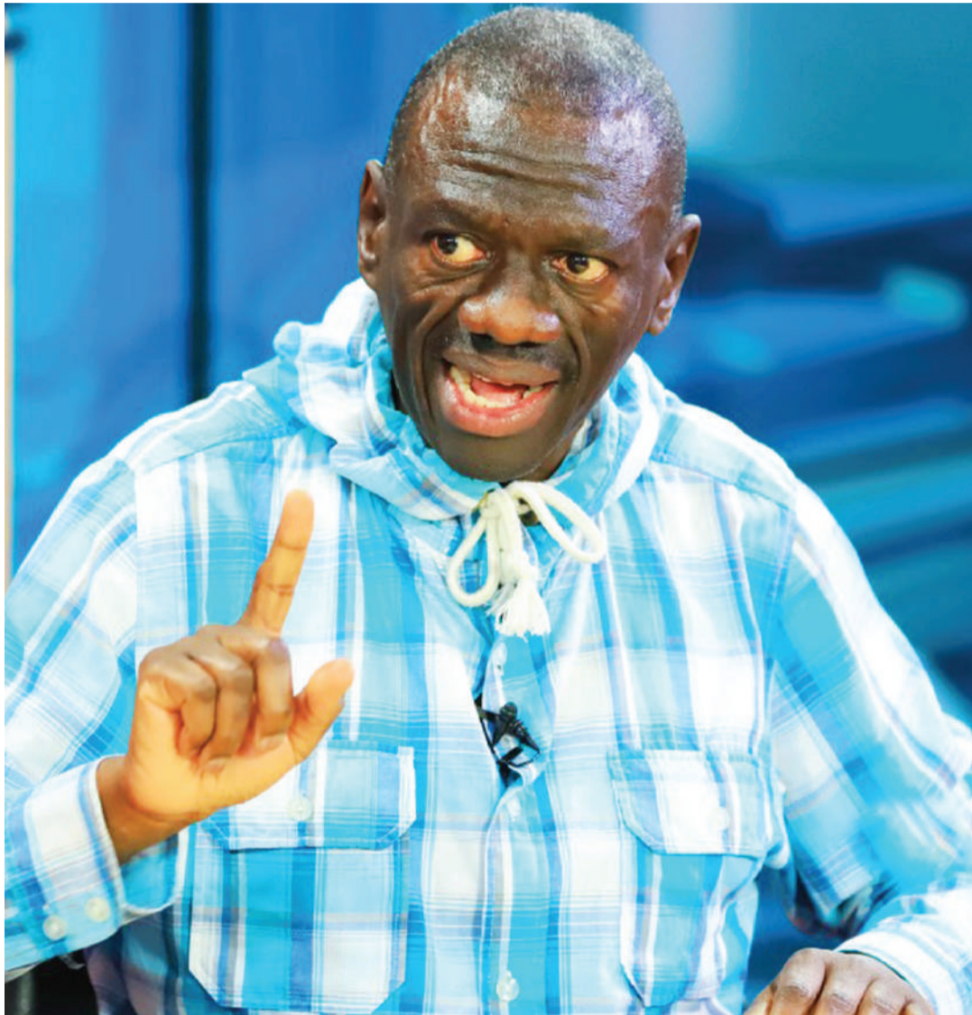
Dk. Kizza Besigye.

Nyendo za kijeshi za NRM ndizo baadaye zikabeba wasifu wa kuwa chama cha kisiasa, kin-