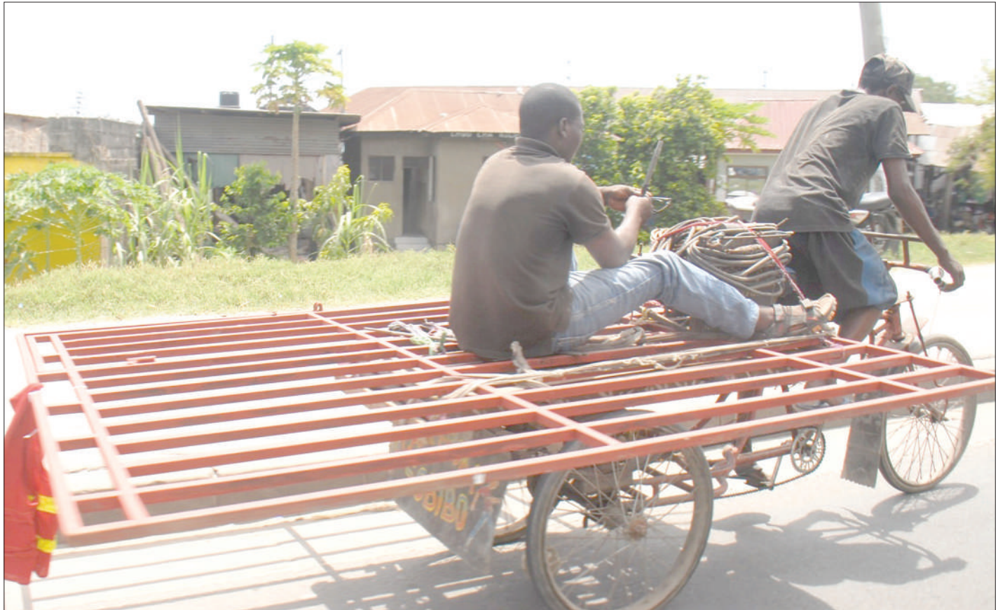
Mwendesha guta akiwa amebeba geti la chuma na abiria juu, katika eneo la Kigogo, jijini Dar es Salam juu, kitendo ambacho ni hatari kwa usalama barabarani.