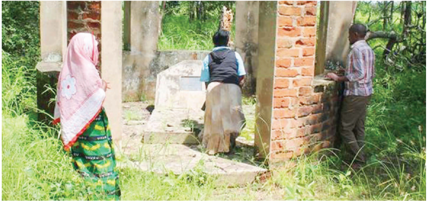
Kaburi la Chifu Nkosi Mharule Bin Zulu Gama.

ni wengi waliokuwa wanazikwa wakiwa hai na mfalme, ni wale ambao walikuwa wamezoeana na kufanya kazi naye kwa karibu.