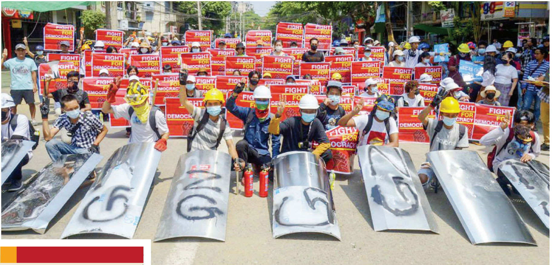
Waandamanaji wanaopinga mapinduzi ya kijeshi wakionyesha mabango walipokusanyika mjini Yangon, jana. Inakadiriwa maandamano hayo tangu yaanze nchini Myanmar yamesababisha vifo vya watu 138.

Serikali ya Msumbiji imeomba jamii ya kimataifa kuisaidia kukabili-ana na mashambulio ya wanamgambo. BBC