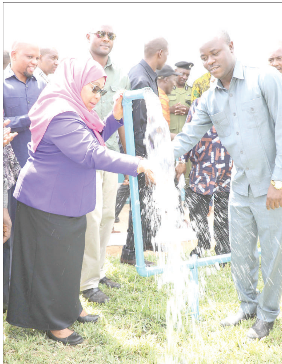
Makamu wa Rais, Samia Suluhu Hassan, akishika maji baada ya kuweka jiwe la msingi la mradi wa majisafi na salama katika Kijiji cha Pongwe, wilayani Muheza, mkoani Tanga jana. Kulia ni Waziri wa Maji, Jumaa Aweso.