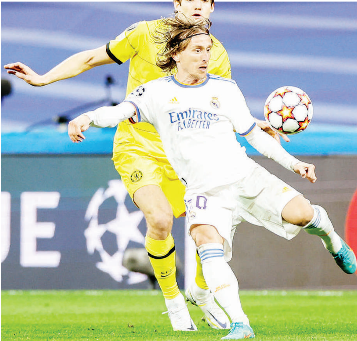
Kiungo wa Real Madrid, Luka Modric (mbele) akiwania mpira na mlinzi wa Chelsea wakati wa mchezo baina ya timu hizo kwenye robo fainali ya Ligi ya Mabingwa Ulaya katika uwanja wa Santiago Bernabeu mjini Madrid nchini Hispania, Jumanne.