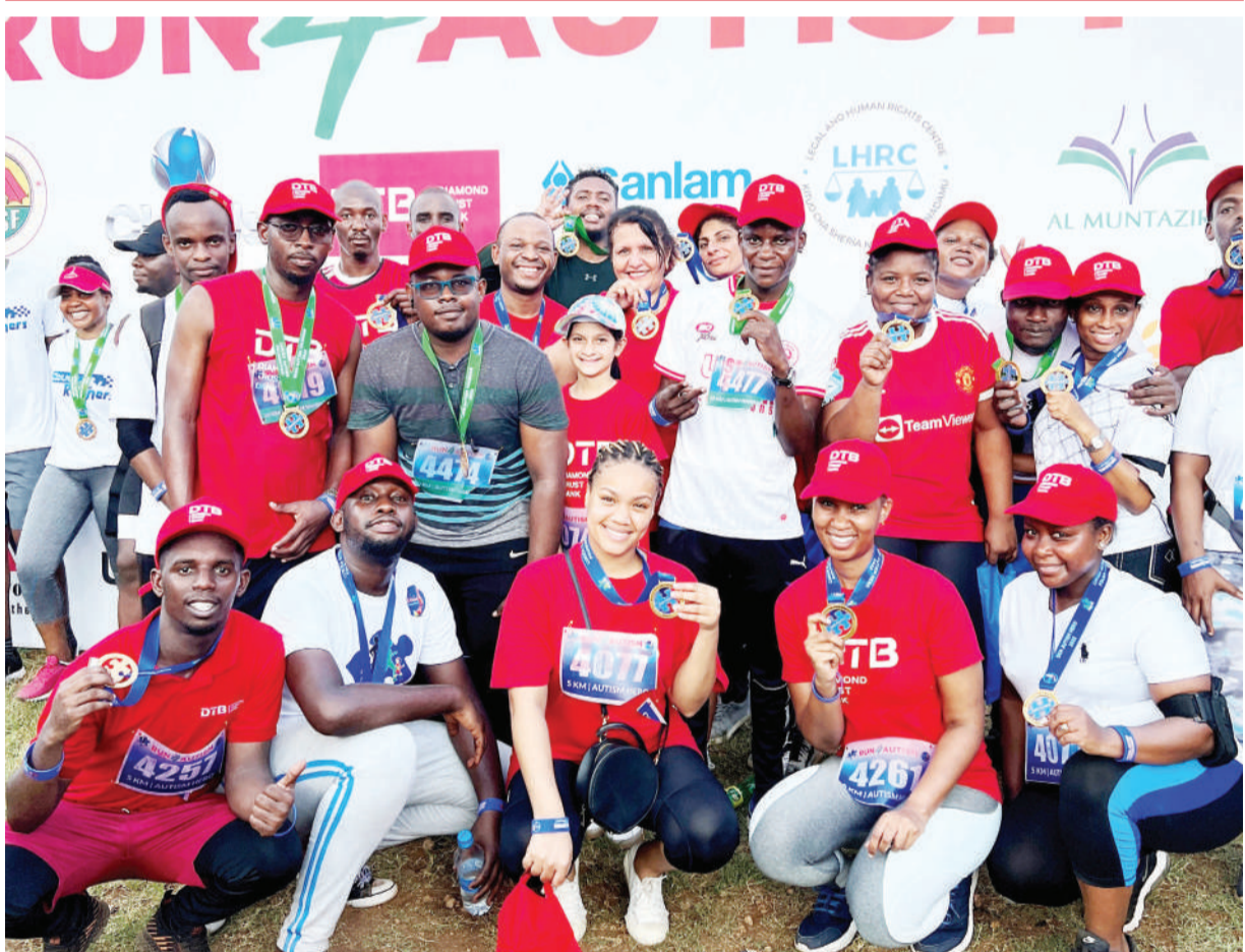
Wafanyakazi wa Benki ya Diamond Trust, wakiwa katika picha ya pamoja baada ya kushiriki kwenye mboji za "Run4Autism", zilizoandaliwa na taasisi ya Lukiza Autism Foundation, jijini Dar es Salaam mwishoni mwa wiki, kwa dhumuni la kuchangisha fedha za kuwasaidia watoto wenye usonji pamoja kuhamasisha jamii kuhusu matatizo yanayowakumba watoto hao.

Yanga ndio vinara kwenye msimamo wa ligi hiyo wakikusanya pointi 51 na kufuatiwa na watani zao Simba wenye pointi 41.