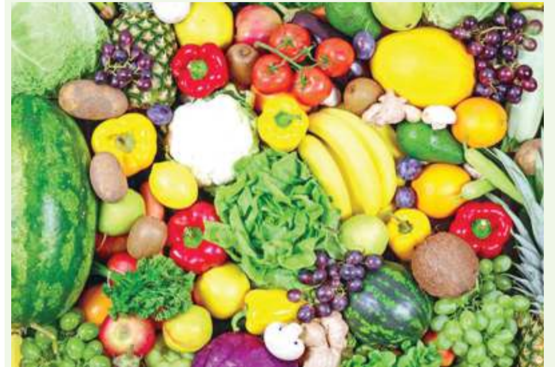
Vyakula vinavyoshauriwa na utafiti watu kuvitumia kwa ajili ya lishe bora.