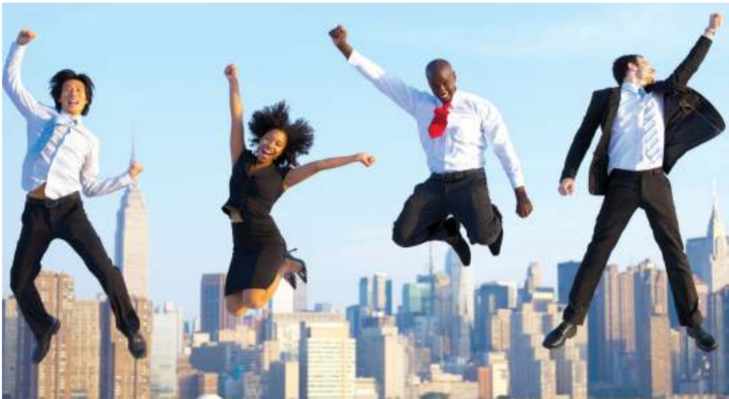
Kuishi maisha yenye furaha inawezekana kwa kufuata njia za kufikia ufanisi na kanuni zake.

Chagua aina ya muziki ambao unakupa hamasa ya kuchukua hatua na iwe ni sehemu ya maisha yako katika kupata hamasa ya kusonga mbele. Inawezekana katika gari lako au simu janja yako tumia kwa ajili ya kukupa utulivu na katika utulivu kuna ushindi.