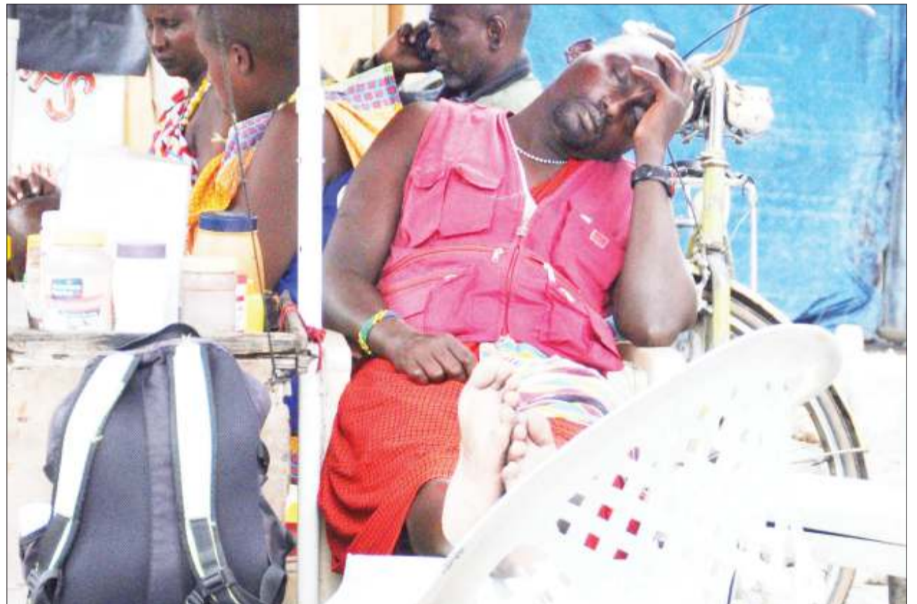
Mganga wa tiba asilia ‘akiuchapa’ usingizi wakati akisubiri wateja wa dawa zake, katika eneo la Ilala Mchikichini, jijini Dar es Salaam jana.

Kuhusu kusafirishwa wahamiaji kupitia Tanzania, Mroso alisema faini ni zaidi ya Sh. milioni 20 au kifungo kisichopungua miaka 20 na kwamba mahakama imepewa mamlaka ya kutaifisha mali au nyumba zilizotumika kuwasafirisha au kuwahifadhi wahamiaji haramu.