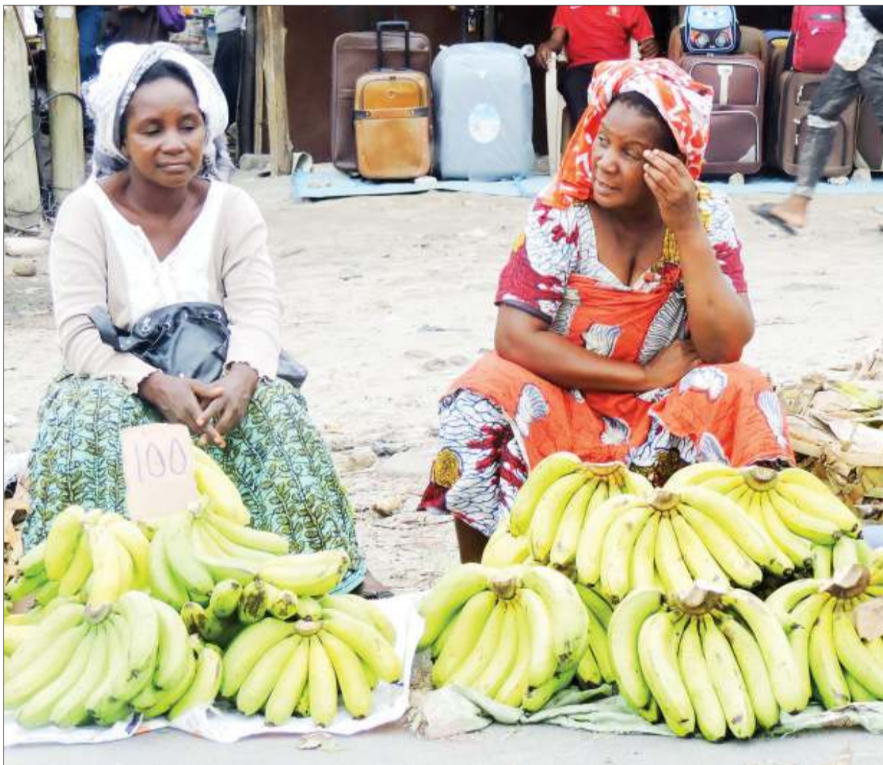
Wachuuzi wa ndizi wakisubiri wateja kando ya Barabara ya Uhuru, eneo la Ilala Mchikichini, jijini Dar es Salaam jana, ambapo ndizi moja iliuzwa kwa bei nafuu ya Sh. 100.

Ibara ya 143(6) ya Katiba ya Tanzania ya Mwaka 1977, inazuia CAG kufuata amri ya mtu au taasisi yoyote ya serikali, isipokuwa mahakama.