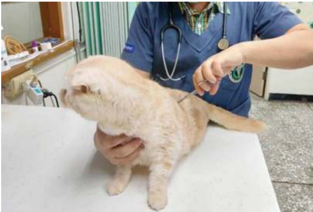
Daktari akimchunguza afya paka aliyetumwa kwa njia ya posta, kabla ya kukabidhiwa kwa mmiliki mpya.

Kutokana na kosa hilo, alilipishwa faini ya ziada ya NT$ 30,000 kwa kuvunja sheria ya kuzuia na kupambana na magonjwa ya kuambukiza