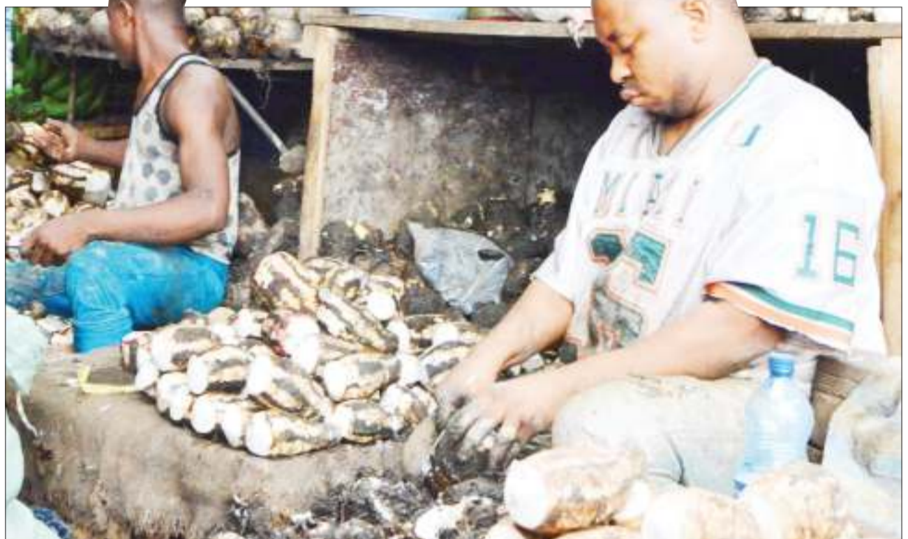
Mchuzi wa magimbi, akiyatoa matope kabla ya kuwauzia wateja wake, katika Soko la Buguruni, jijini Dar es Salaam jana.