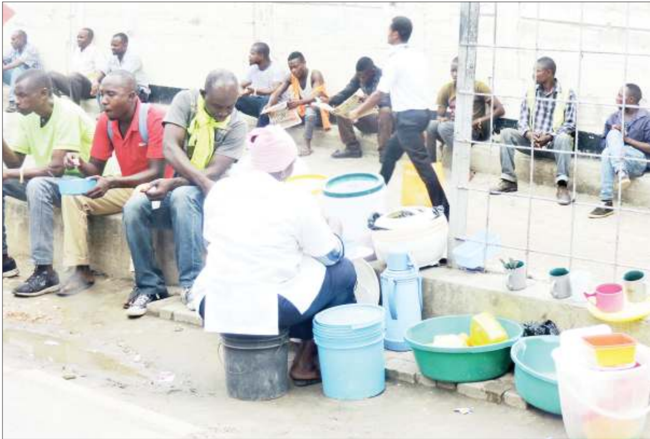
Mamalishe akihudumia wateja kando ya Barabara ya Sokoine, katikati ya Jiji la Dar es Salaam jana.

Chaki hizo zinatarajia kupunguza kwa kiasi kikubwa uagizaji kwa ajili ya shule za msingi na sekondari za mkoa wa Kilimanjaro kutoka maeneo tofauti au nje ya nchi.