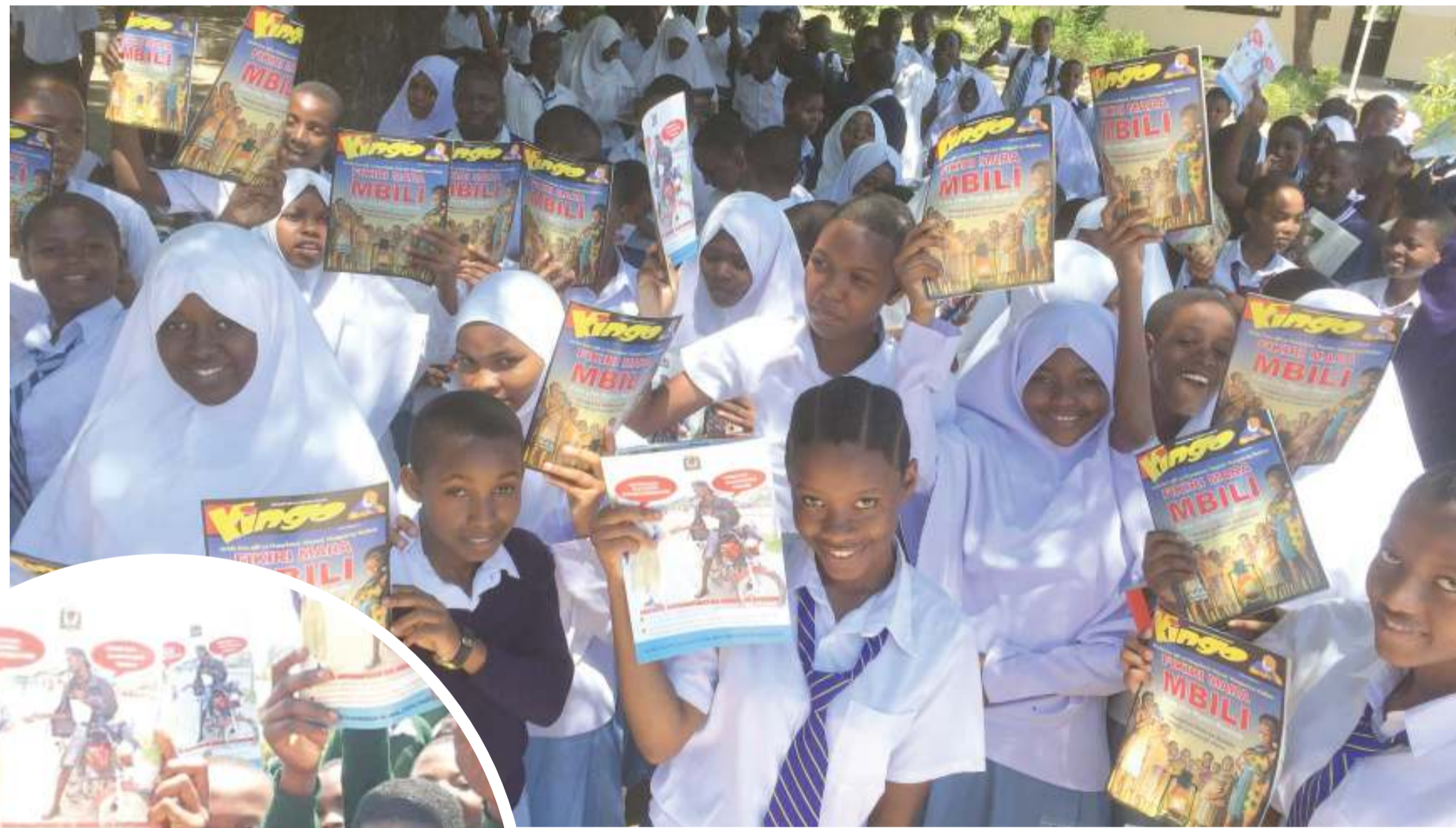
Wanafunzi wa Sekondari ya Chang'ombe, jijini Dar es Salaam, baada ya kupokea nakala za jarida la Fikiri Mara Mbili.