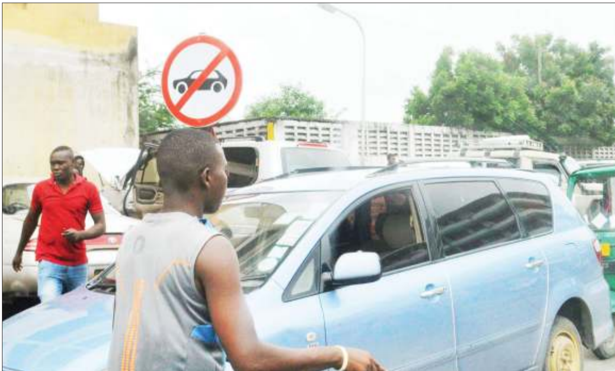
Wakazi wakionekana kukaidi kibao kinachozuia kugesha magari madogo, katika eneo la kituo cha mabasi cha Machilinga Complex, Manispaa ya Ilala, jijini Dar es Salaam jana.