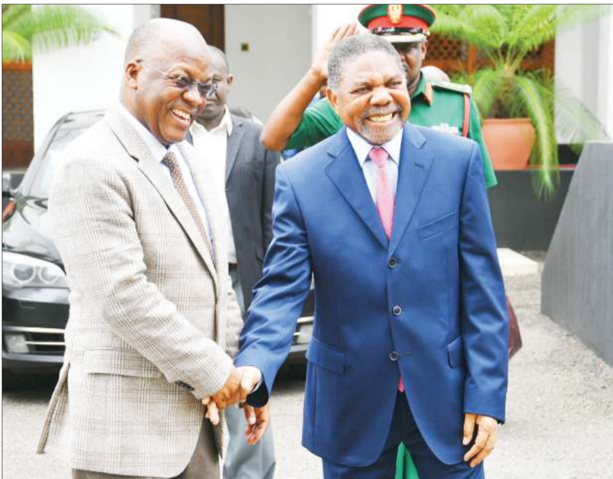
Rais John Magufuli, akifurahia jambo na Rais wa Zanzibar, Dk. Ali Mohamed Shein, baada ya kutoka kwenye kikao cha Baraza la Mawaziri, Ikulu, jijini Dar es Salaam jana.