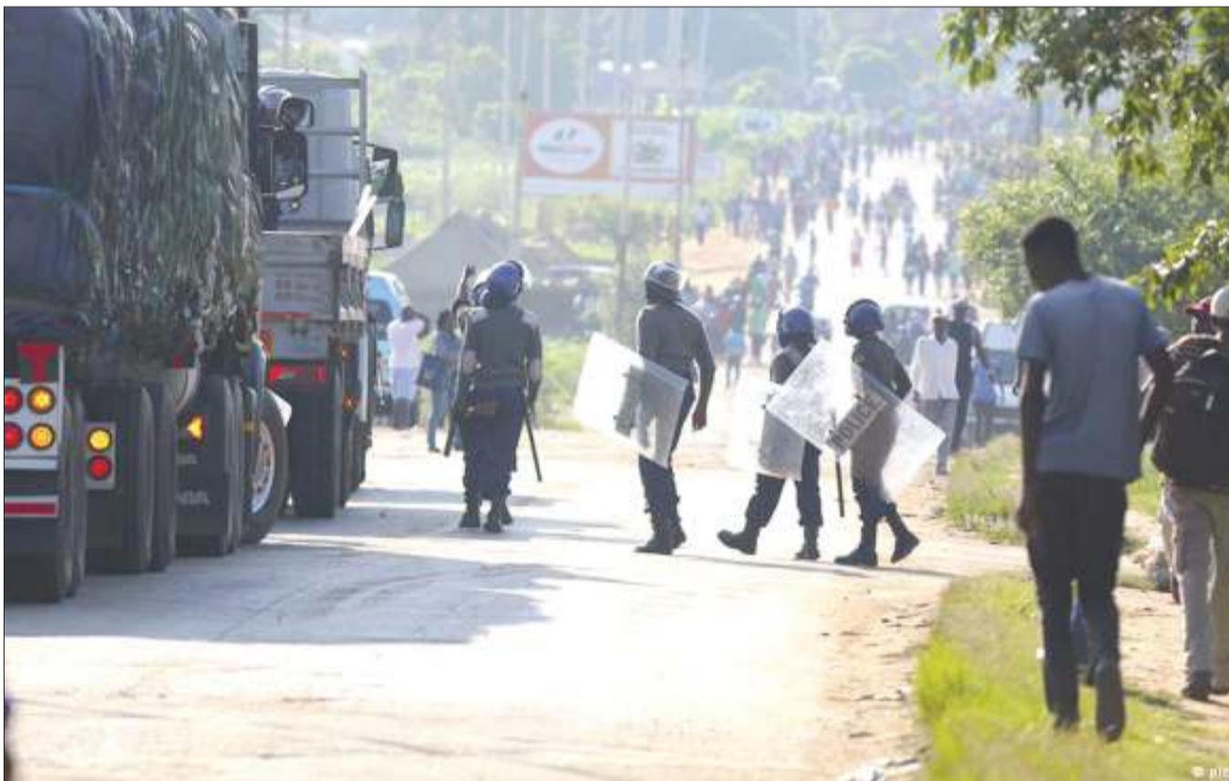
Jeshi la Polisi mjini Harare likikabiliana na waandamanaji.