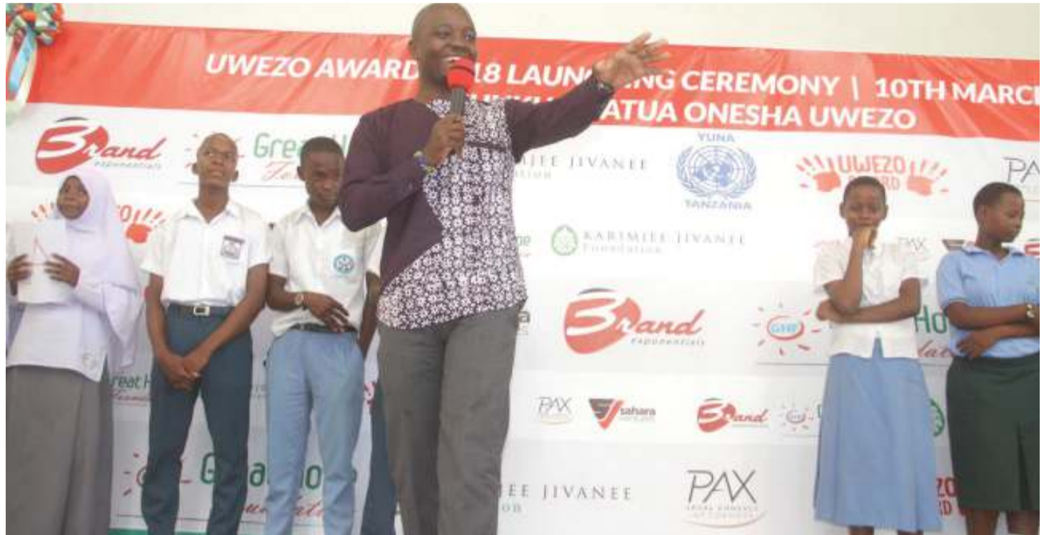
Mmoja ya majaji wa Tuzo za Uwezo kwa wanafunzi kwa ajili ya mashindano ya kupima uwezo, akieleza vigezo vitakavyowafanya wanafunzi wa shule mbalimbali kushinda alama.

Ilitaja nchi kadhaa za Afrika kuwa ndizo zenye IQ ndogo zaidi duniani, yaani Equatorial Guinea, Cameroon,