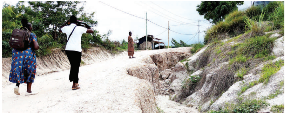
Wananchi wakipita kwenye Barabara ya King'azi, iliyoharibiwa kwa mvua na kuhitaji ukarabati katika Kata ya Kwembe, Manispaa ya Ubungo, Dar es Salaam jana.

Kwa maoni: +255 677 020 701 Email: customerrelations@guardian.co.tz