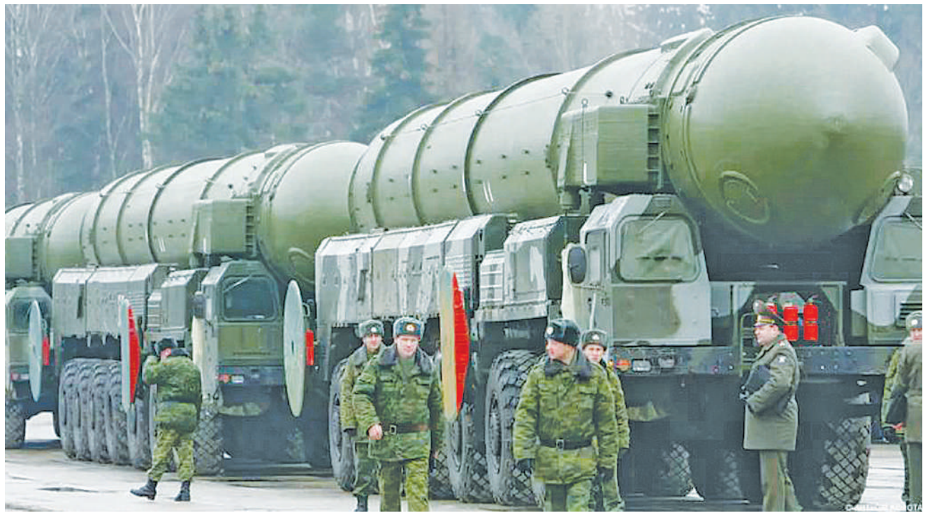
Wanajeshi wa Russia wakiwa na makombora ya kuvuka mabara aina ya Topol-M, hivi karibuni.