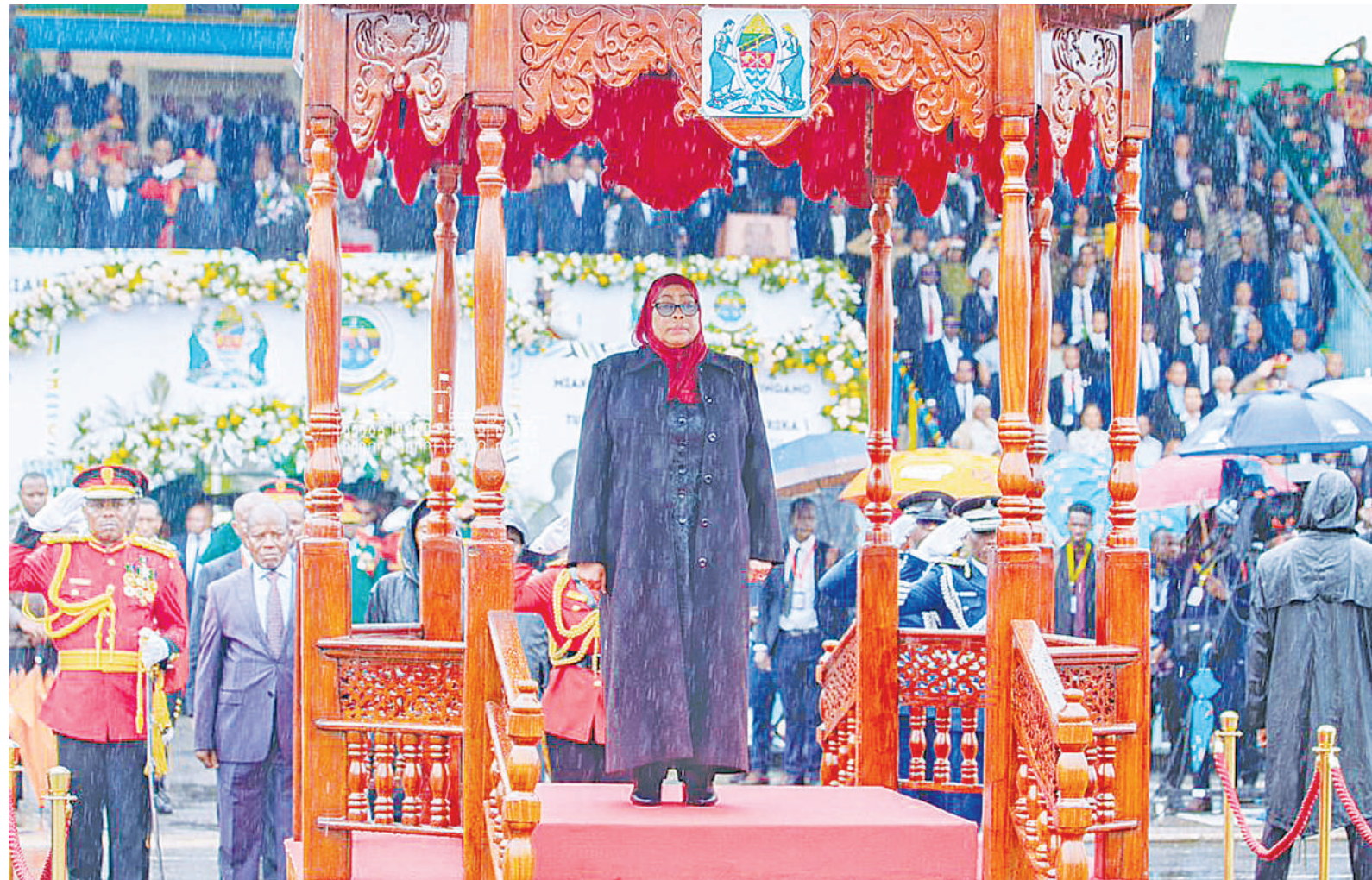
Rais Dk. Samia Suluhu Hassan, katika tukio la kuadhimisha miaka 60 ya Muungano wa Tanganyika na Zanzibar, mwaka huu jijini Dar es Salaam.

“Aidha, magonjwa kama vile UKIMWI, Kipindupindu, Homa ya mafua ya ndege, na hivi karibuni Uviko 19, nayo yalitiki-sa Taifa letu.