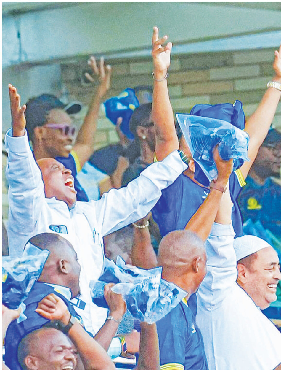
Waziri wa Utamaduni, Sanaa na Michezo, Dk. Damas Ndumbaro (mwenye shati jeupe), akishangilia baada ya Timu ya Soka ya Tanzania (Taifa Stars), kufuzu kushiriki Fainali za Kombe la Mataifa ya Afrika (AFCON 2025), zitakazofanyika mwakani nchini Morocco. Stars ilipata nafasi hiyo baada ya kuifunga Guinea bao 1-0.

Kocha huyo amewaomba viongozi wa Bodi ya Ligi na Kamati ya Waamuzi kuwaangalia kwa ‘karibu’ waamuzi baada ya kuwakabidhi majukumu ya kusimamia michezo ya ligi.