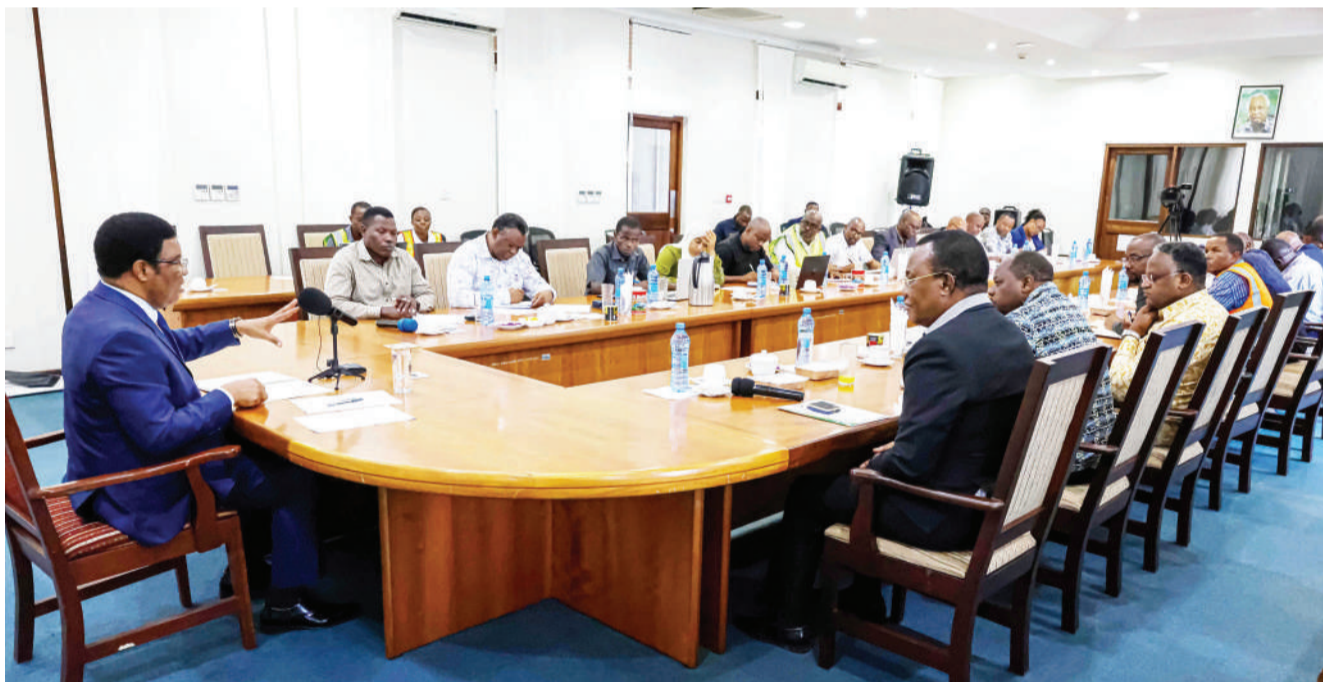
Waziri Mkuu, Kassim Majaliwa akizungumza na Kamati ya Wataalamu wa Uchunguzi wa Jengo lililoporomoka eneo la Kariakoo, baada ya kuizindua, jijini Dar es Salaam jana.