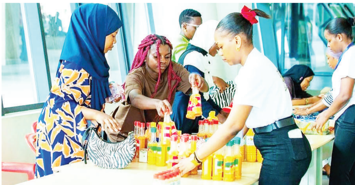
Wajasiriamali wakionesha bidhaa mbalimbali wanazozalisha kwenye mkutano uliowakutanisha wajasiriamali, serikali, pamoja na wadau kupitia Jukwaa la Panda 2024, katika Chuo Kikuu cha Dar es Salaam, mapelelele.

Alisema wafamasia nao wanatakiwa wasitoe dawa ya kuuu (sumu) bila cheti cha daktari na watoe maelekezo ya kutumia dawa kwa usahihi.