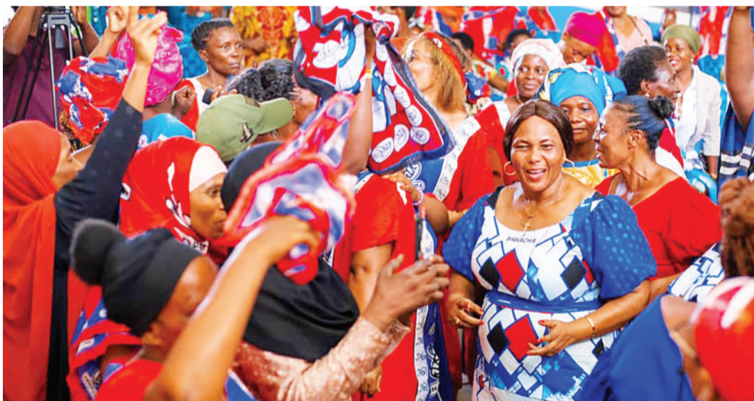
Baadhi ya wanachama wa Baraza la Wanawake la Chama cha Demokrasia na Maendeleo (BAWACHA) mkoa wa Kilimanjaro wa Ilala, Dar es Salaam, wakiwa katika kongamano la kuwajengea uwezo wagombea wanaojiandaa kushiriki uchaguzi wa serikali za mitaa, mapema wiki hii.