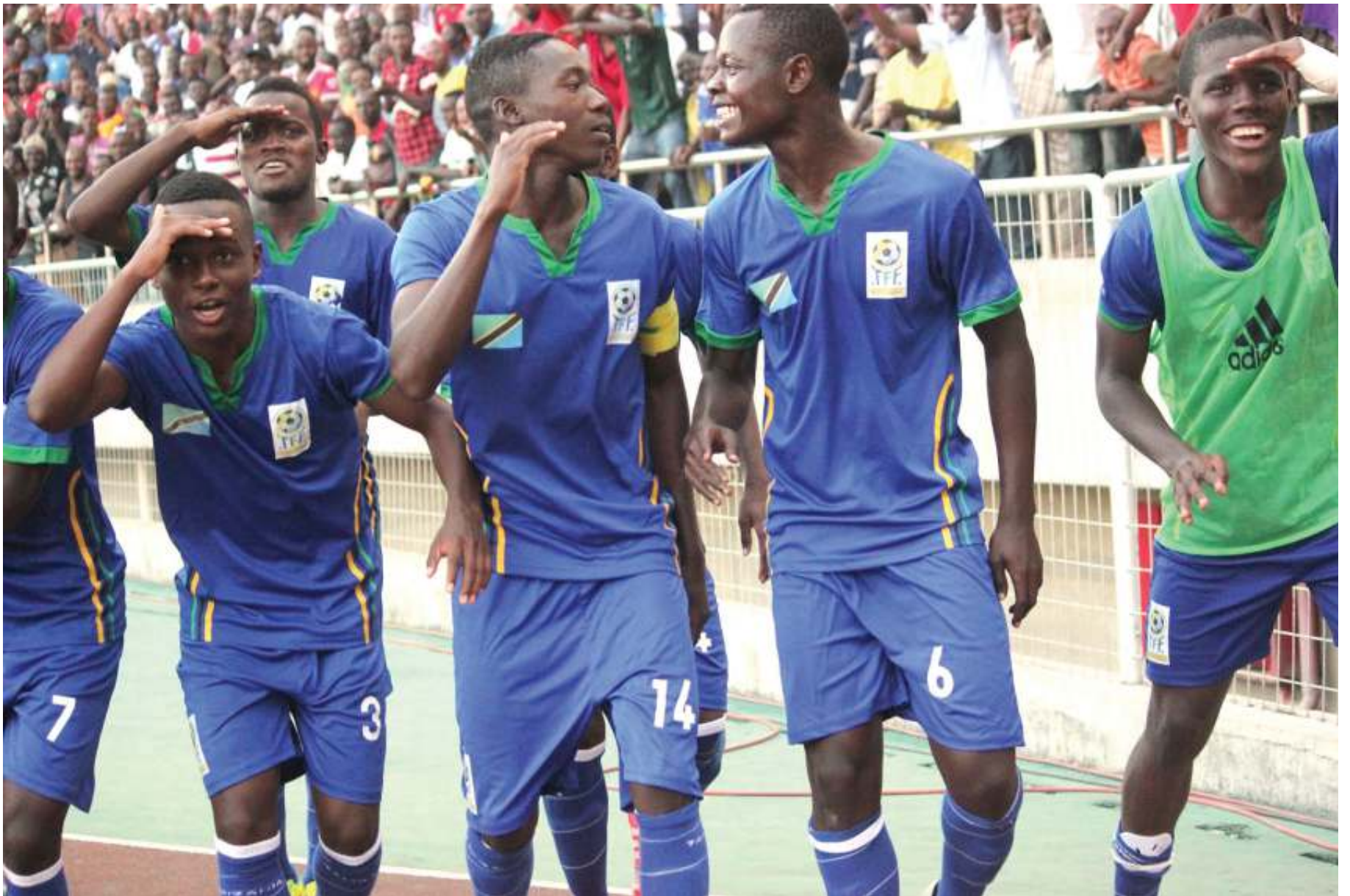
Baadhi ya wachezaji wa Serengeti Boys wakishangilia kwa staili ya aina yake kwenye moja kati ya mechi zao zilizofanyika Uwanja wa Taifa.