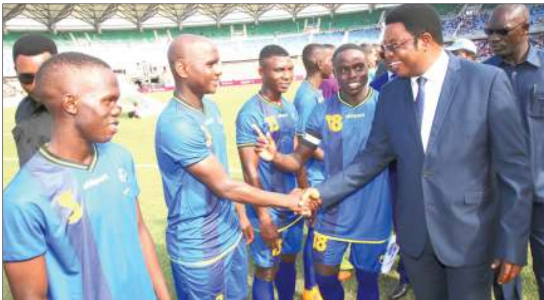
Waziri Mkuu, Kassim Majaliwa akikagua wachezaji wa Timu ya Taifa ya Vijana, Serengeti Boys kabla ya kuanza mechi ya michuano ya Afcon U-17 dhidi ya Nigeria katika Uwanja wa Taifa jijini Dar es Salaam jana. Habari UK. 32.