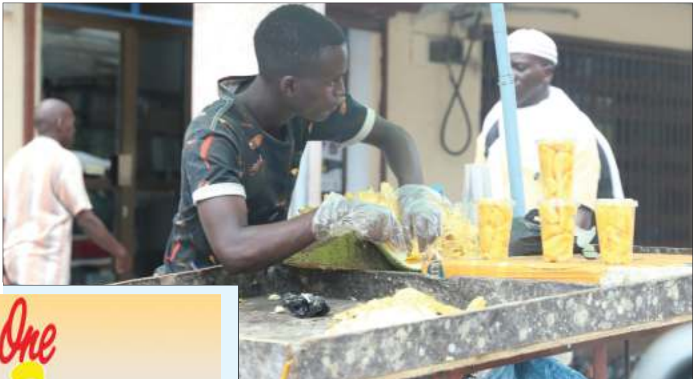
Muuzi matunda aina ya mafenesi akichambua tunda tayari kwa kuwekwa katika chupa maalum kwa ajili ya kuwauzia wateja wake katika Mtaa wa Samora jijini Dar es Salaam jana.