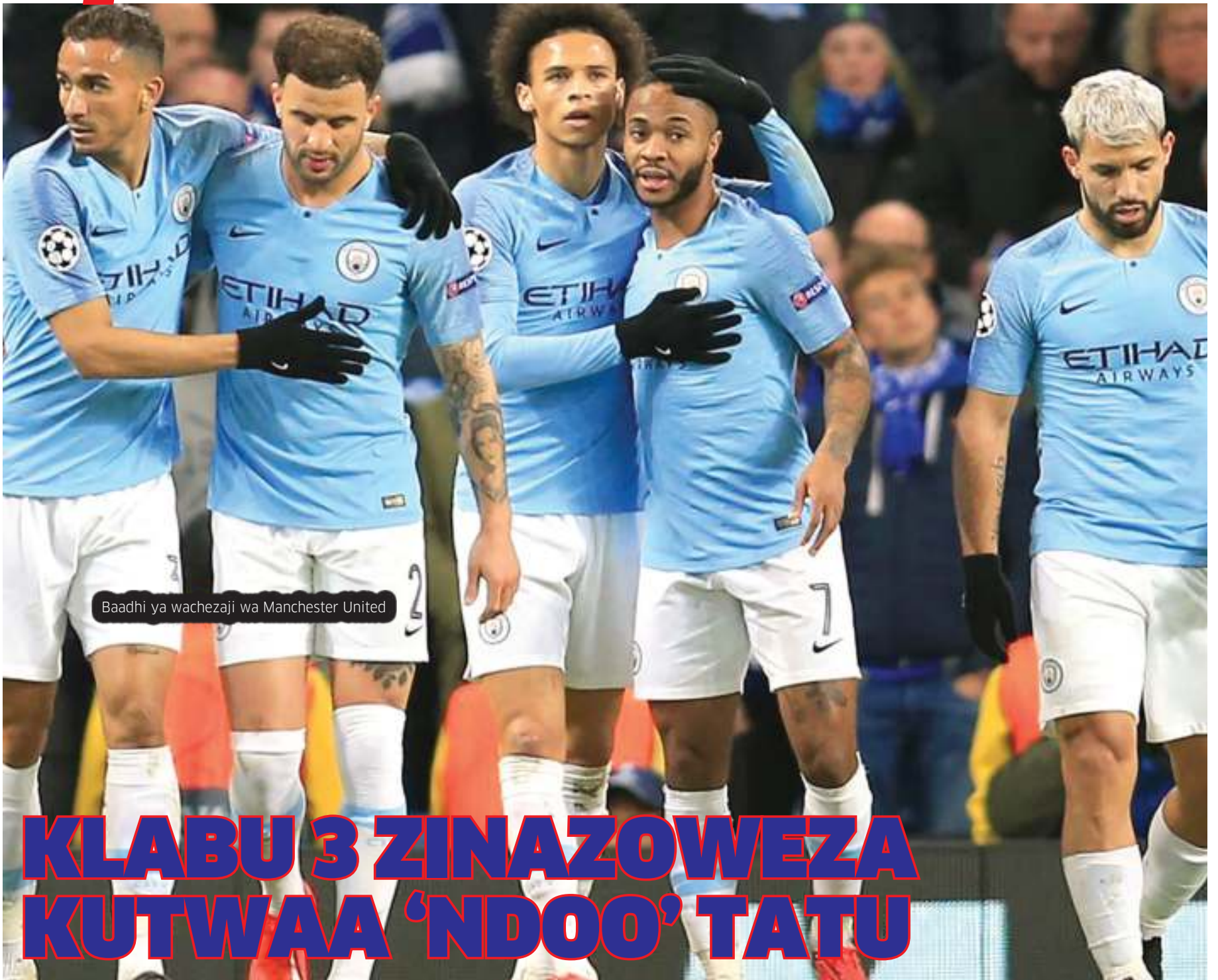
Baadhi ya wachezaji wa Manchester United