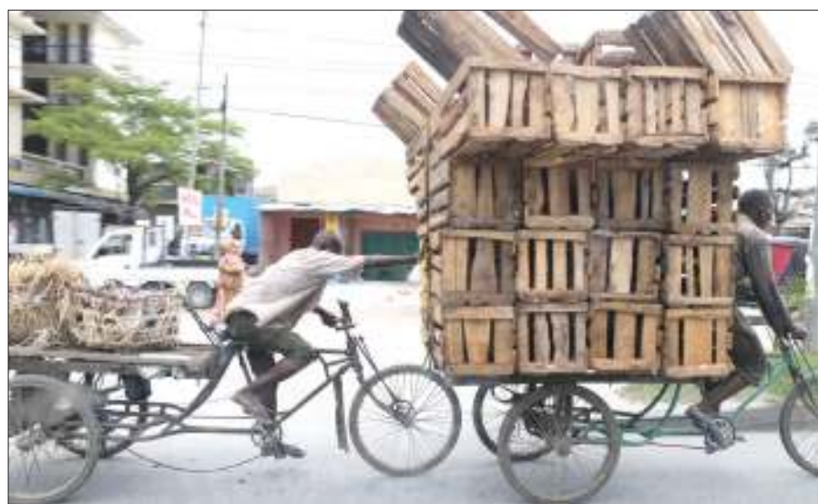
Mwendesha guta akitoa msaada wa kumsukuma mwenzake kupanda kutokana na uzito wa mzigo aliochukua jijini Dar es Salaam jana.

Nao, wakusanyaji wa vyuma chakavu waliomba serikali kuangalia mitaji yao ambayo haizidi Sh. milioni 3 na kuwapa vitambulisho vilivyotolewa na Rais John Magufuli kwa Sh. 20,000 kwa mwaka.