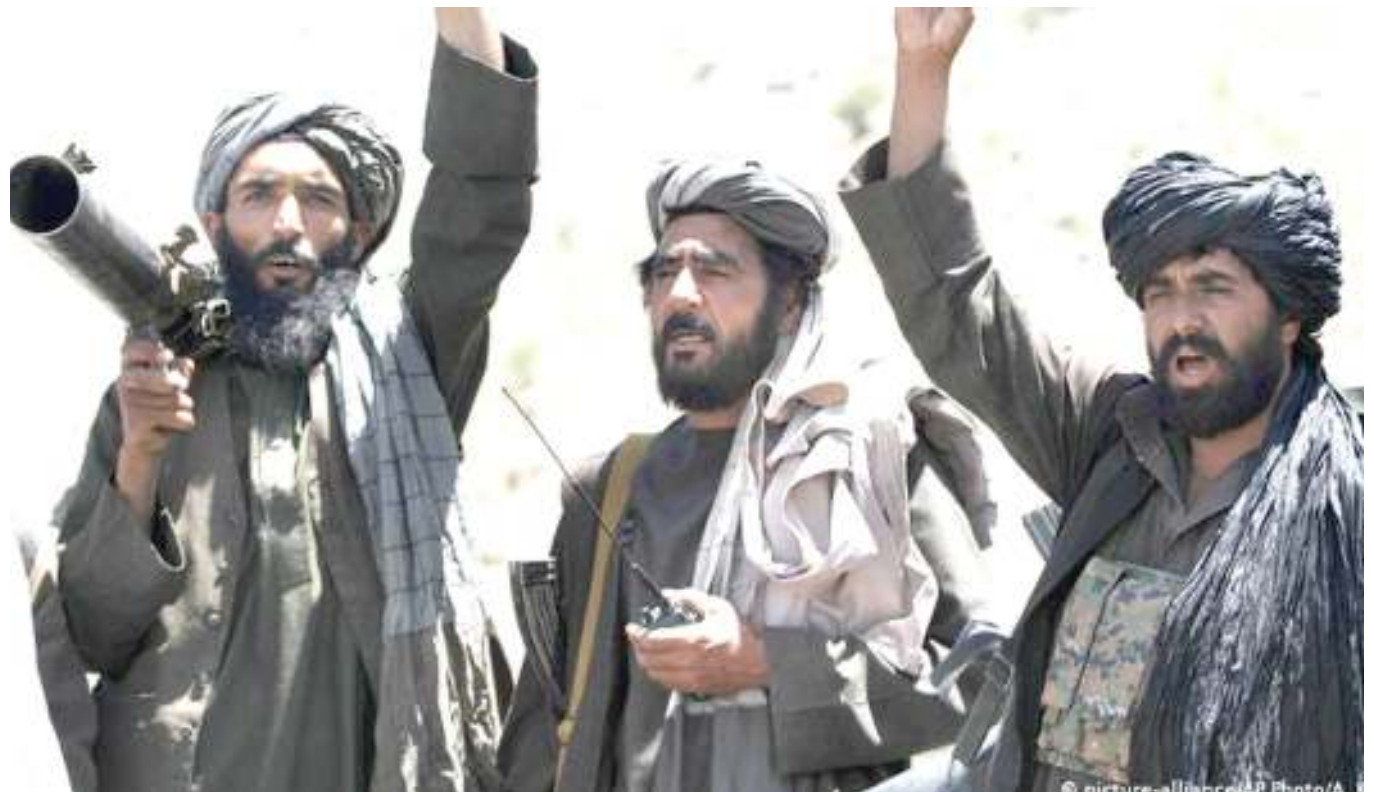
Wapiganaji wa Taliban wakiwa wamebeba silaha, kundi hilo limetangaza kuanza mashambulio licha ya kufanya mazungumzo ya kuleta amani na Marekani.