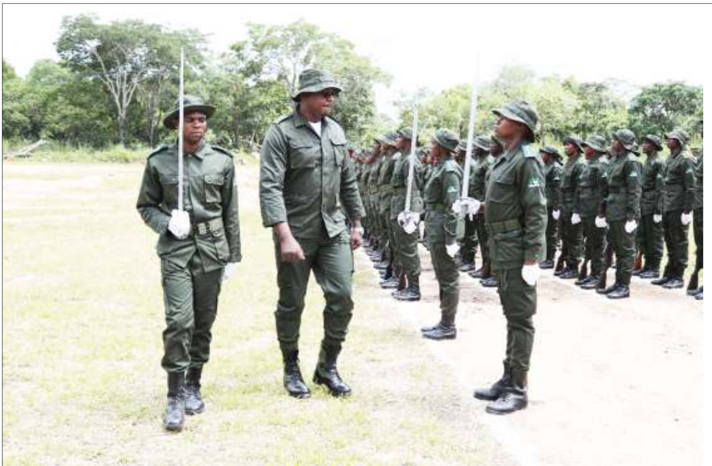
Naibu Waziri wa Maliasili na Utalii, Constantine Kanyasu, akikagua gwaride kabla ya kufunga mafunzo ya kijeshi kwa askari 140 wa Wakala wa Huduma za Misitu Tanzania (TFS) katika kambi ya mafunzo ya kijeshi Mlele mkoani Katavi.