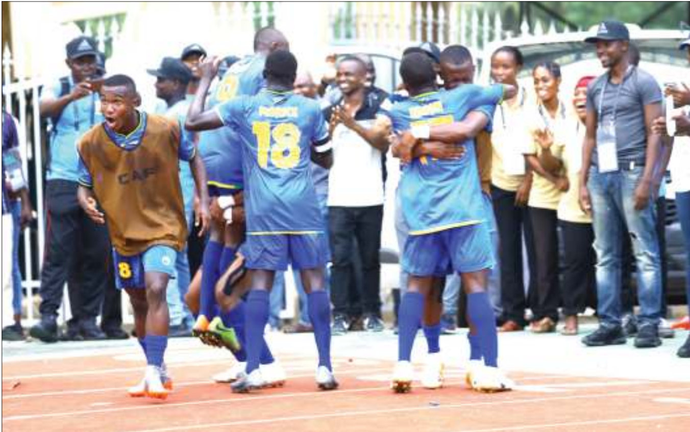
Wachezaji wa Serengeti Boys wakishangilia moja ya mabao yao kwenye mechi ya ufunguzi ya michuano ya Afcon U-17 dhidi ya Nigeria iliyopigwa Uwanja wa Taifa jana na wenyeji hao kufungwa 5-4.