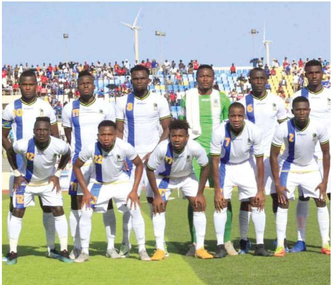
Baadhi ya wachezaji wa timu ya soka ya Taifa Stars.

"Mambo mengi yalitokea kwa sababu tulicheza kwa mfumo mpya, kwa kutumia wachezaji watatu nyuma. Uwanja ulikuwa mkavu, na mpira haukukimbia, pamoja na mambo mengine, lakini hatukupoteza, kitu ambacho kilikuwa muhimu."