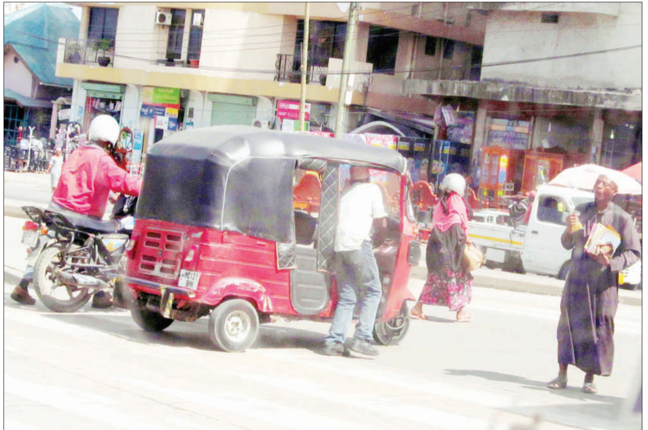
Madereva wa bajaj na bodaboda wakivuka alama za pundamilia kwa kukokota vyombo vyao, eneo la Manzese Bakhresa, jijini Dar es Salaam juu, ikiwa ni sehemu ya utii wa sheria za usalama barabarani.

TOSCI wametu-saidia sana kwa hiyo unanunua mbegu ambazo una uhakika hauvunji taratibu zilizowekwa na serikali.