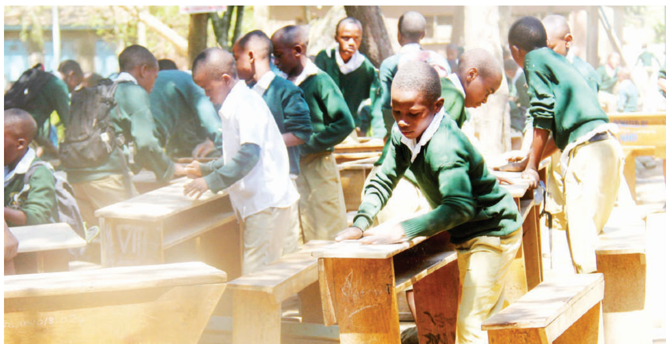
Baadhi ya wanafunzi wa darasa la saba katika Shule ya Msingi Them, jijini Arusha, wakisafisha madawati, shuleni hapo jana, kwa ajili ya maandalizi ya mitihani ya kuhitimu elimu ya msingi, inayoanza leo.

• Adaiwa kuvamia uwanja wa CCM, kupiga muziki wa kampeni, mwenyewe ajitetea... Endelea ukurasa 2