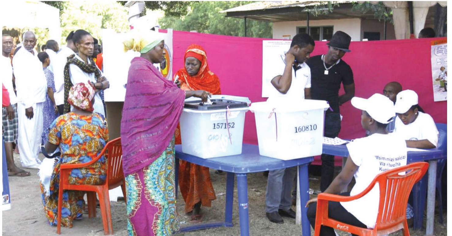
Namna ilivyokuwa upigaji kura na uangalizi katika uchaguzi mkuu wa mwaka 2015. PICHA: MTANDAO.

Kibamba anasema waangalizi wa uchaguzi kutoka nje, kazi yao kubwa ushuhuda wa macho zaidi na kila wanaloliona ambalo pengine hawakuridhika au wa-