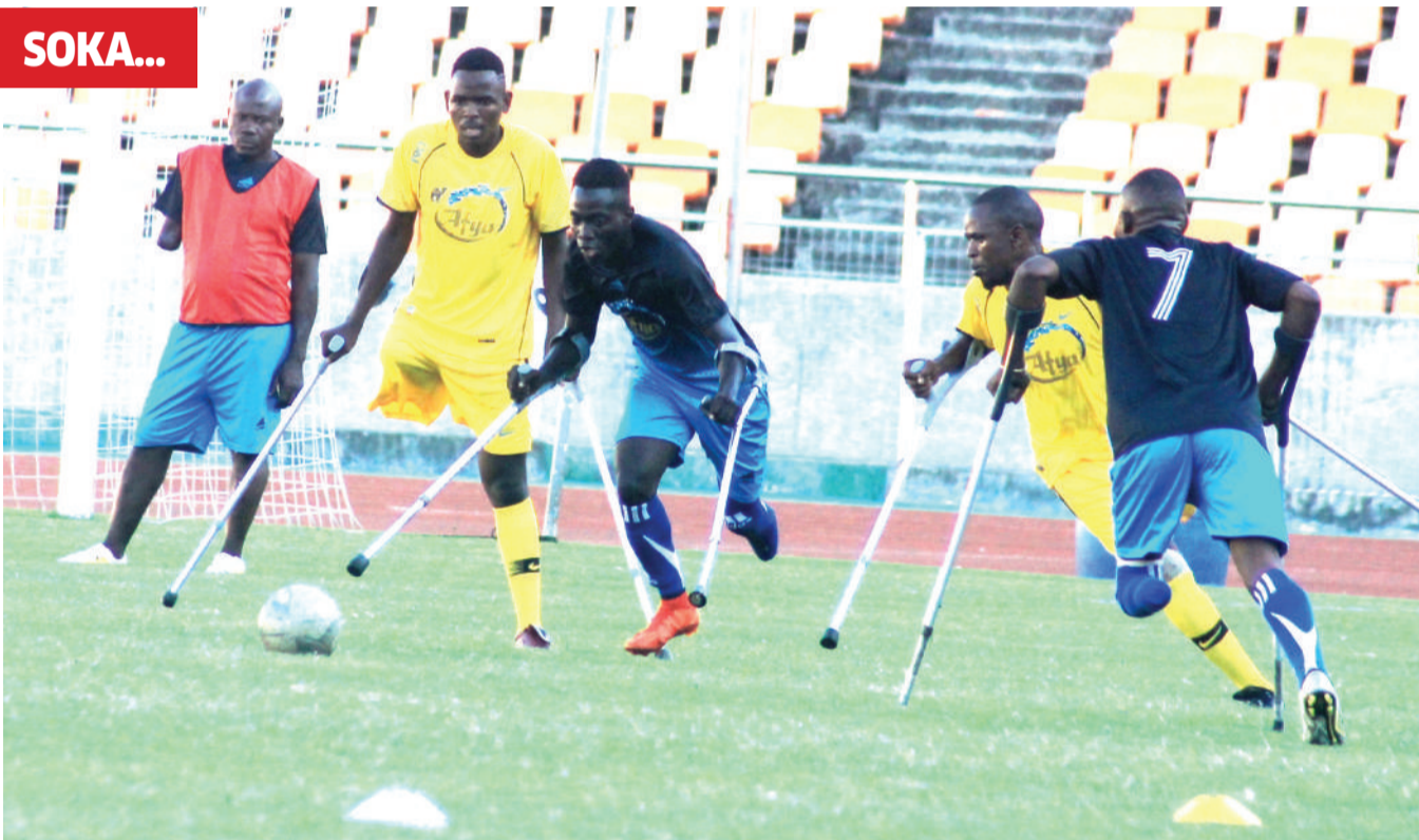
Wachazaji wa timu ya Ballmun (jezi za njano) wakiwania mpira dhidi ya wapinzani wao, River Valley, wakati wa mechi ya Ligi ya Walemavu iliopigwa Uwanja wa Mkapa jijini Dar es Salaam juzi.