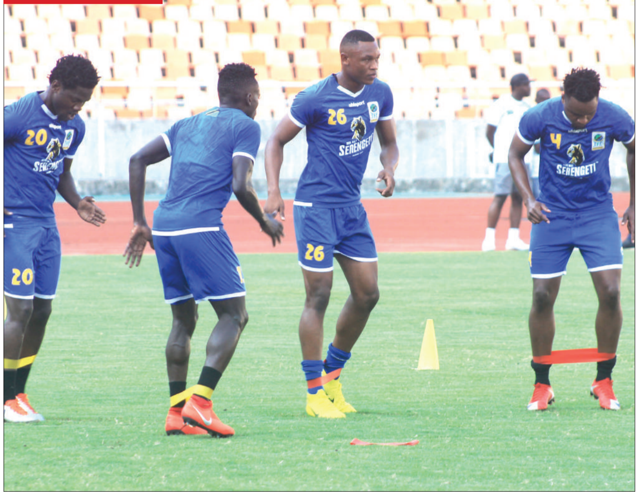
Baadhi ya wachezaji wa Taifa Stars, wakifanya mazoezi katika Uwanja wa Mkapa jijini Dar es Salaam jana, kujiandaa na mechi ya kirafiki dhidi ya Burundi itakayopigwa uwanjani hapo Jumapili wiki hii.