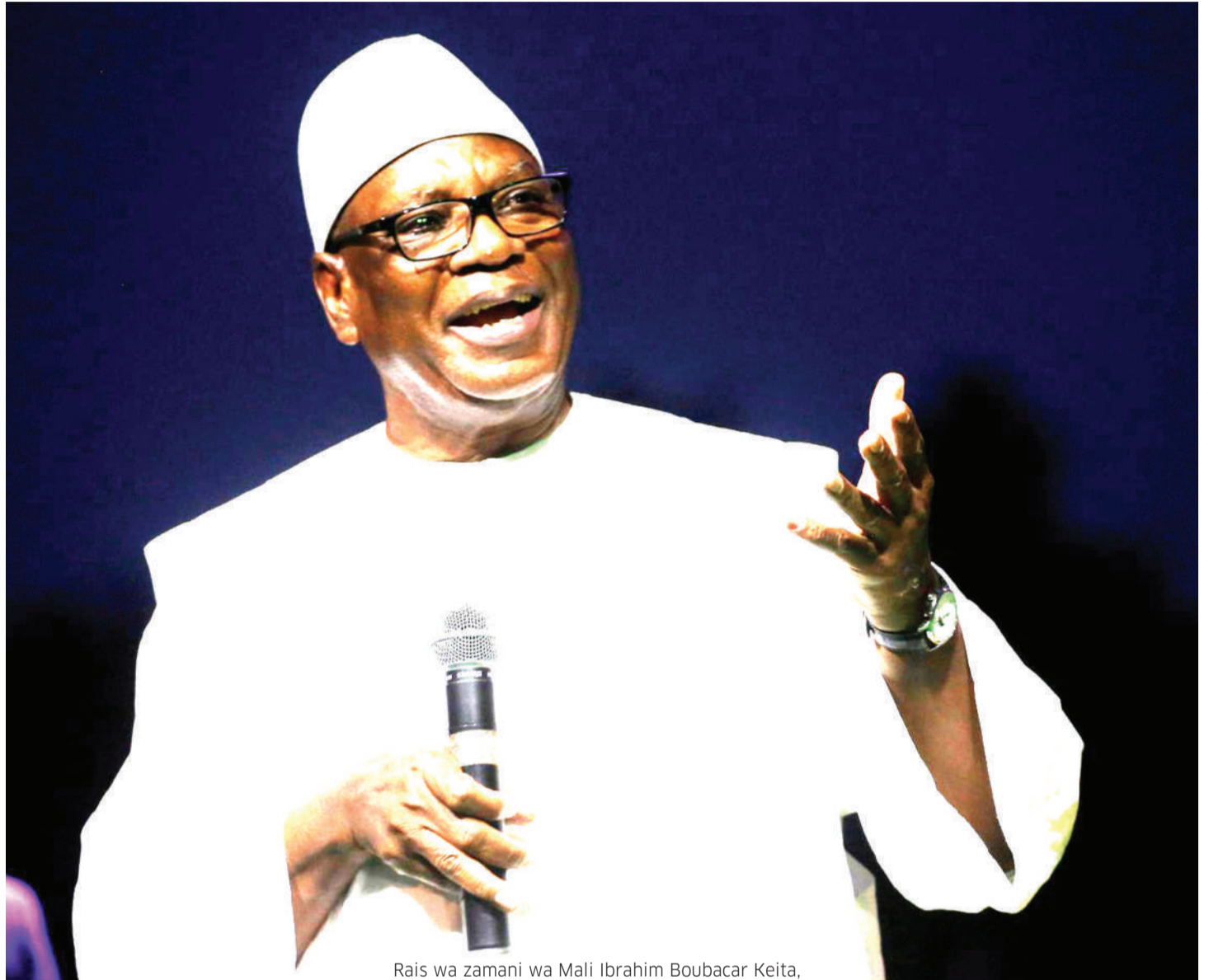
Rais wa zamani wa Mali Ibrahim Boubacar Keita,

Licha ya kuwapa machafuko na migogoro iliyoitosa Mali kwa miaka mingi sasa, lakini katika miezi ya hivi karibuni kulikuwa na maandamano makubwa huku vyama vya upinzani vikitaka Rais Boubac-