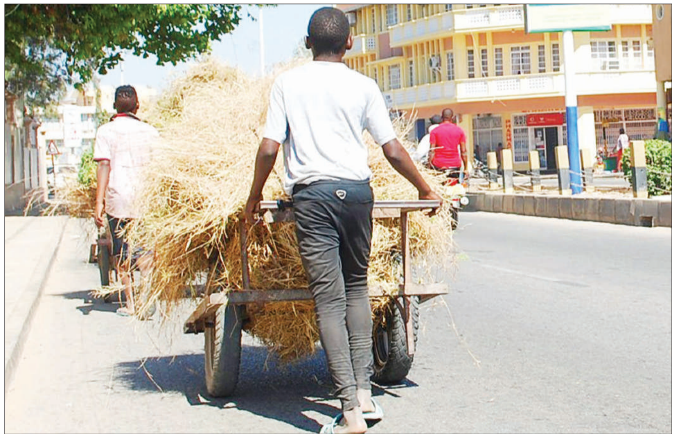
Vijana wakisaka wateja wa nyasi za kulisha mifugo katika eneo la Jamatini, jijini Dodoma jana, ambapo toroli moja la nyasi linauzwa kwa bei ya 3,000/-.

Katika hatua nyingine, aliwataka wagombea mbalimbali wa nafasi zote za urais, ubunge na udiwani, kutumia mikutano ya kampeni kunadi sera za vyama vyao na kuacha kutumia lugha za matusi au kuchafuana.