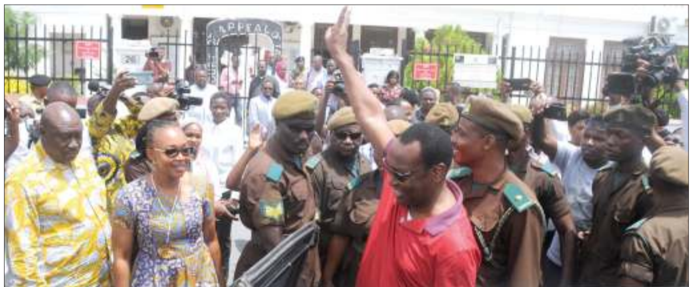
Mwenyekiti Taifa wa Chama cha Demokrasia na Maendeleo (Chadema), Freeman Mbowe, akiwapungia wanachama na mashabiki wa chama hicho, wakati yeye na Mbunge wa Tarime Mjini, Esther Matiko (wa pili kushoto), wakijiandaa kuingia kwenye gari la Magereza kurudi rumande, baada ya shauri kusikilizwa katika Mahakama ya Rufani Tanzania, jijini Dar es Salaam jana.