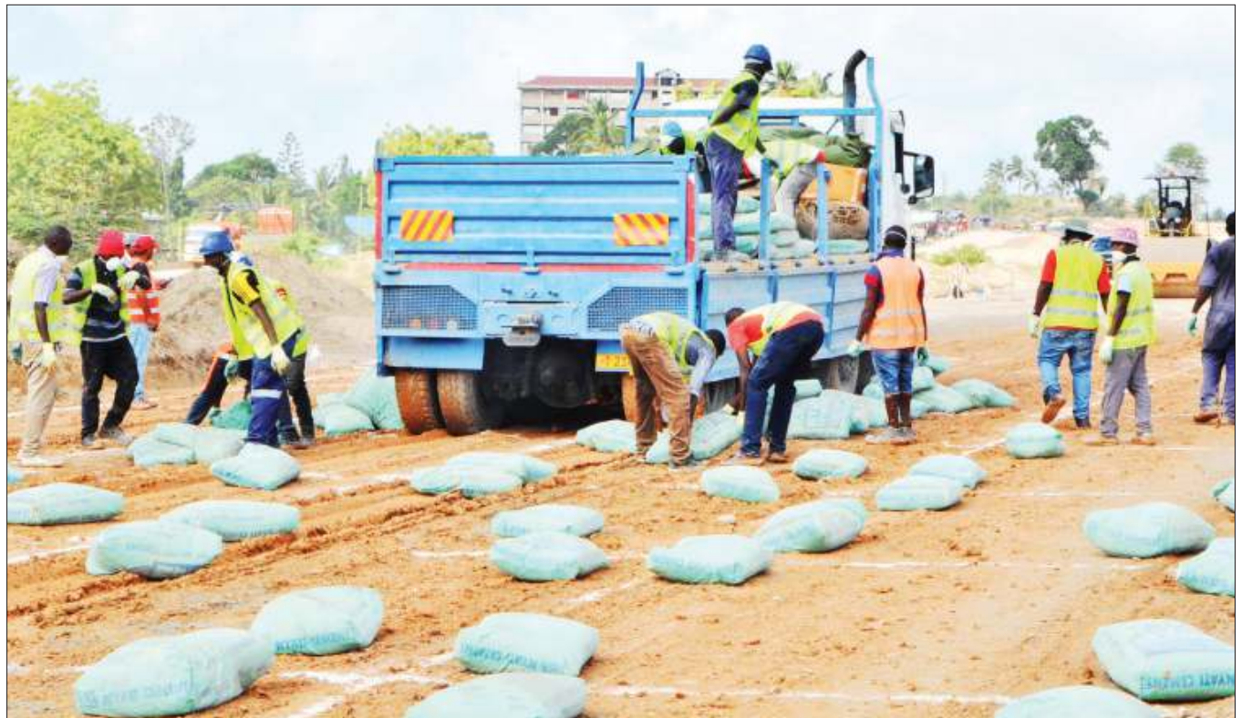
Mafundi wakiendelea na awamu ya kwanza ya upanuzi wa Barabara ya Morogoro inayoanzia Kimara mwisho hadi Kibaha, jijini Dar es Salaam jana.