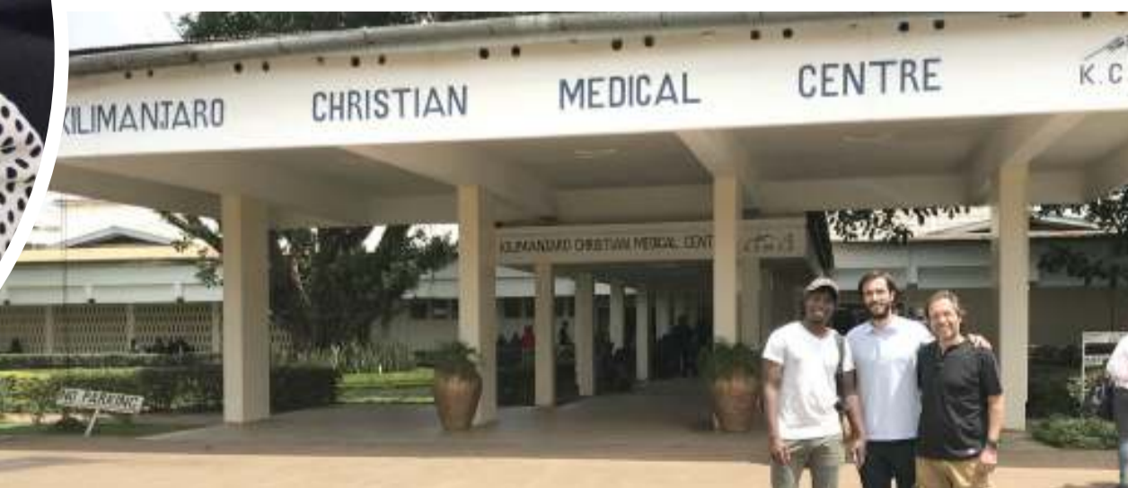
Hospitali ya Rufaa ya KCMC, inayotarajia kujenga jengo la saratani.

kwenye uvimbe katika shingo ya kizazi ambacho hupelekea maabara kuchunguzwa kama kuna saratani au la.