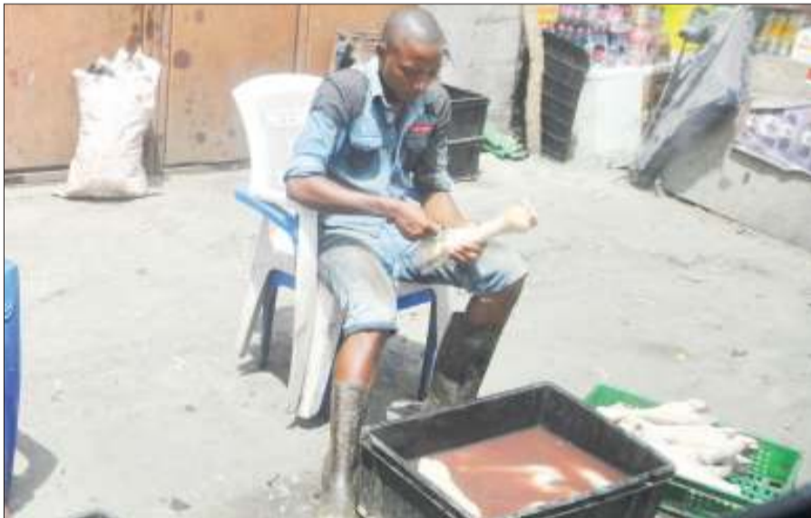
Mkazi wa jiji akiandaa miguu ya ng'ombe kwa ajili ya kuwauzia wafanyabiashara wa supu ya kongoro, katika eneo la machinjioni Vingunguti, jijini Dar es Salaam hivi karibuni.

Pia, alisema lengo ni kuwafikia mamilioni ya Watanzania ambao hawana akaunti kwa ajili ya kujiweka akiba kwa njia rahisi na isiyo na gharama.