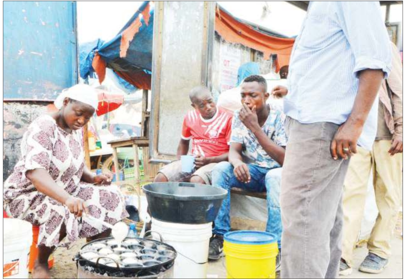
Mjasiriamali akiandaa vitumbua kwa ajili ya wateja wake, katika eneo la Tazara Vetinari, jijini Dar es Salaam jana.

Aliwataka wazazi kutumia vyema fursa zinazotolewa na serikali na kushirikiana nayo ili kufanikisha dhana ya uimarishaji wa sekta ya elimu nchini.