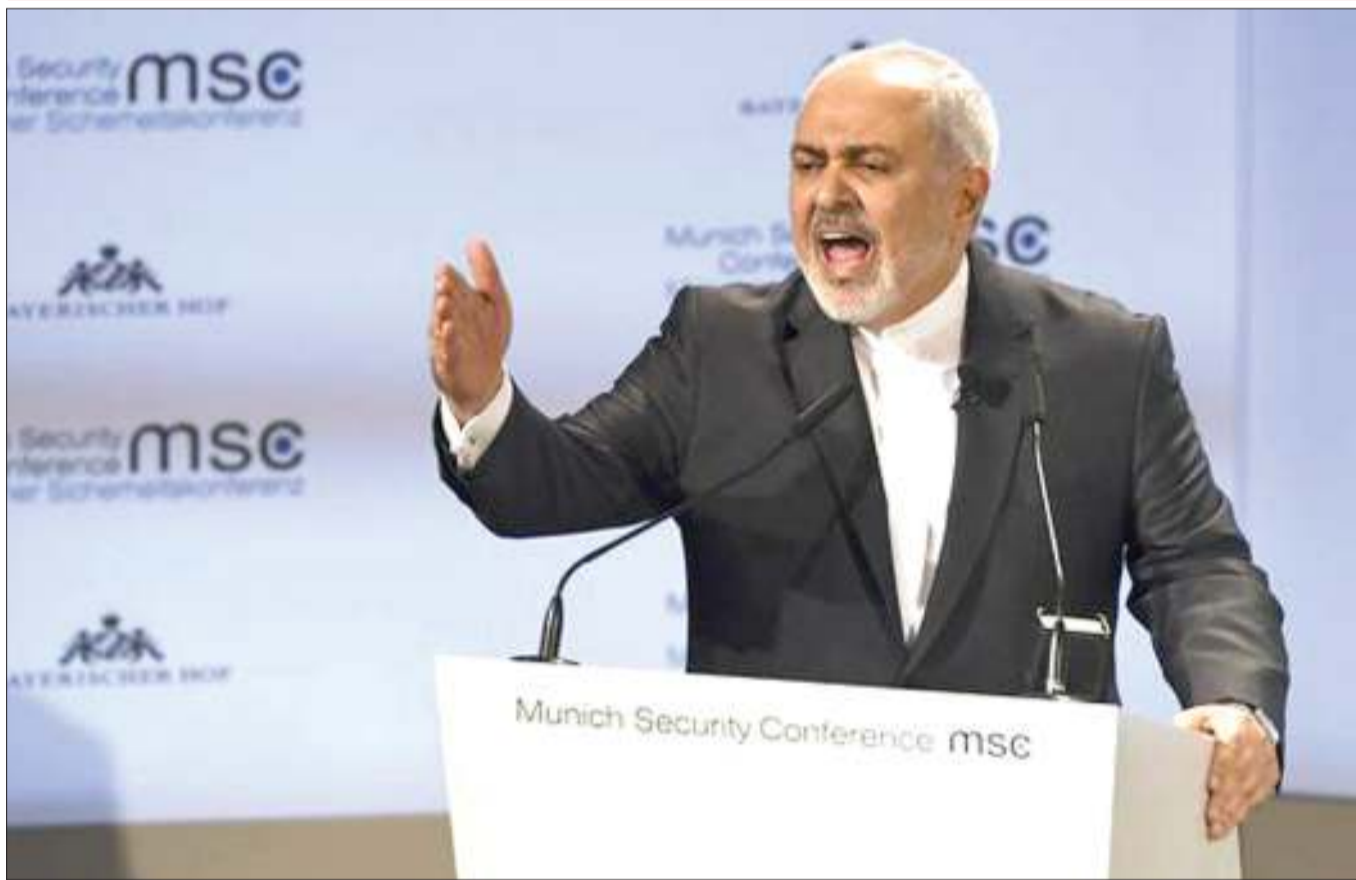
Waziri wa Mambo ya Nje wa Iran, Mohammad Javad Zarif, akiwa kwenye mkutano wa usalama mjini Munich.