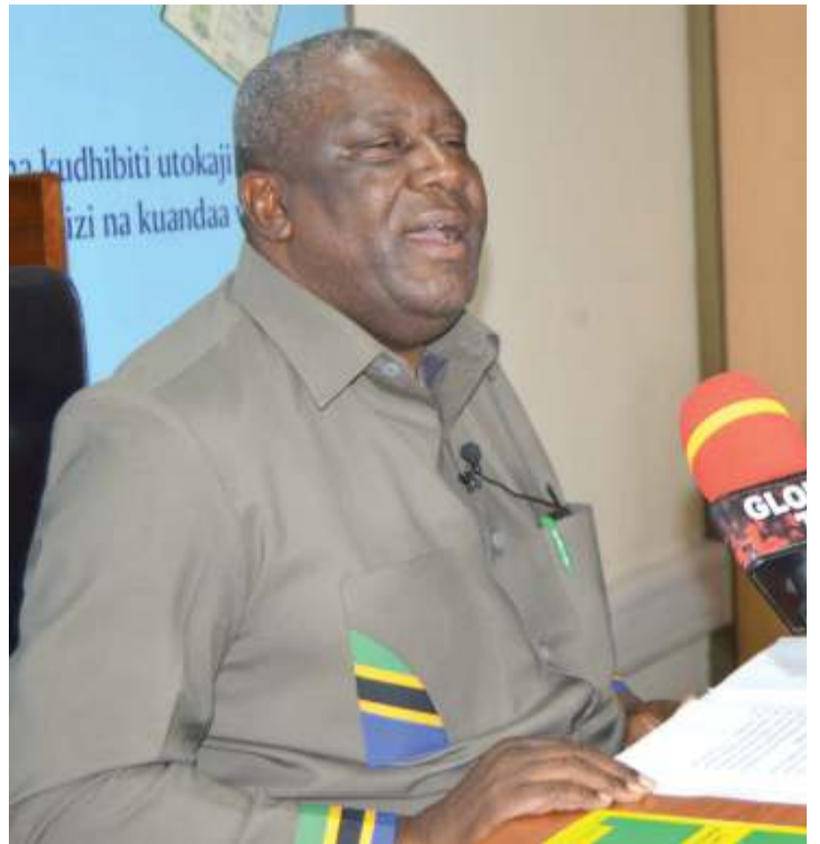
Waziri wa Mambo ya Ndani, Kangi Lugola.