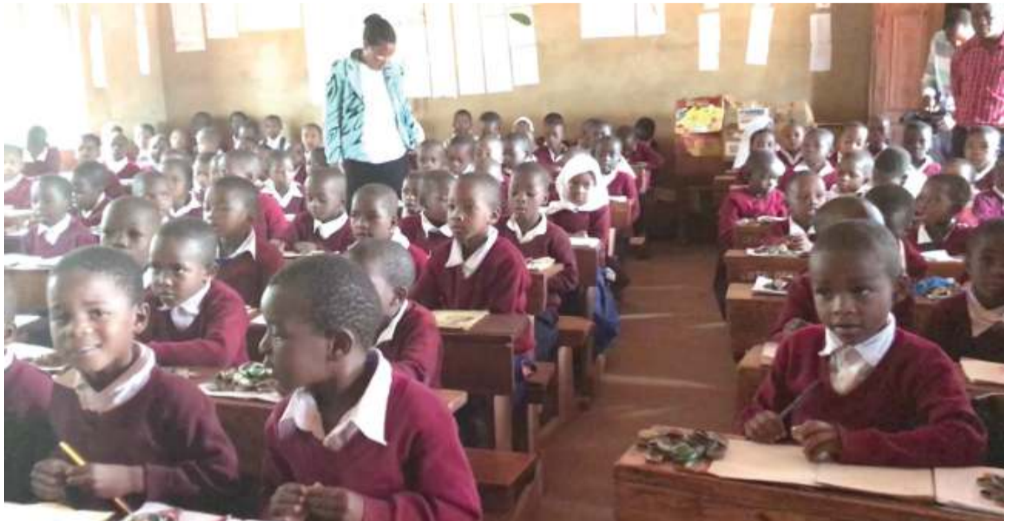
Wanafunzi kama hawa wanahitaji uwekezaji mkubwa ili kunyanyua ubora wa elimu.

Ni muhimu mwalimu ajue pia kwamba ana kazi tatu ngumu shuleni. Kwamba mwanafunzi ajue somo jina lake kikamilifu, lakini pia mwanafunzi anyoke kama mwanadamu kwenye