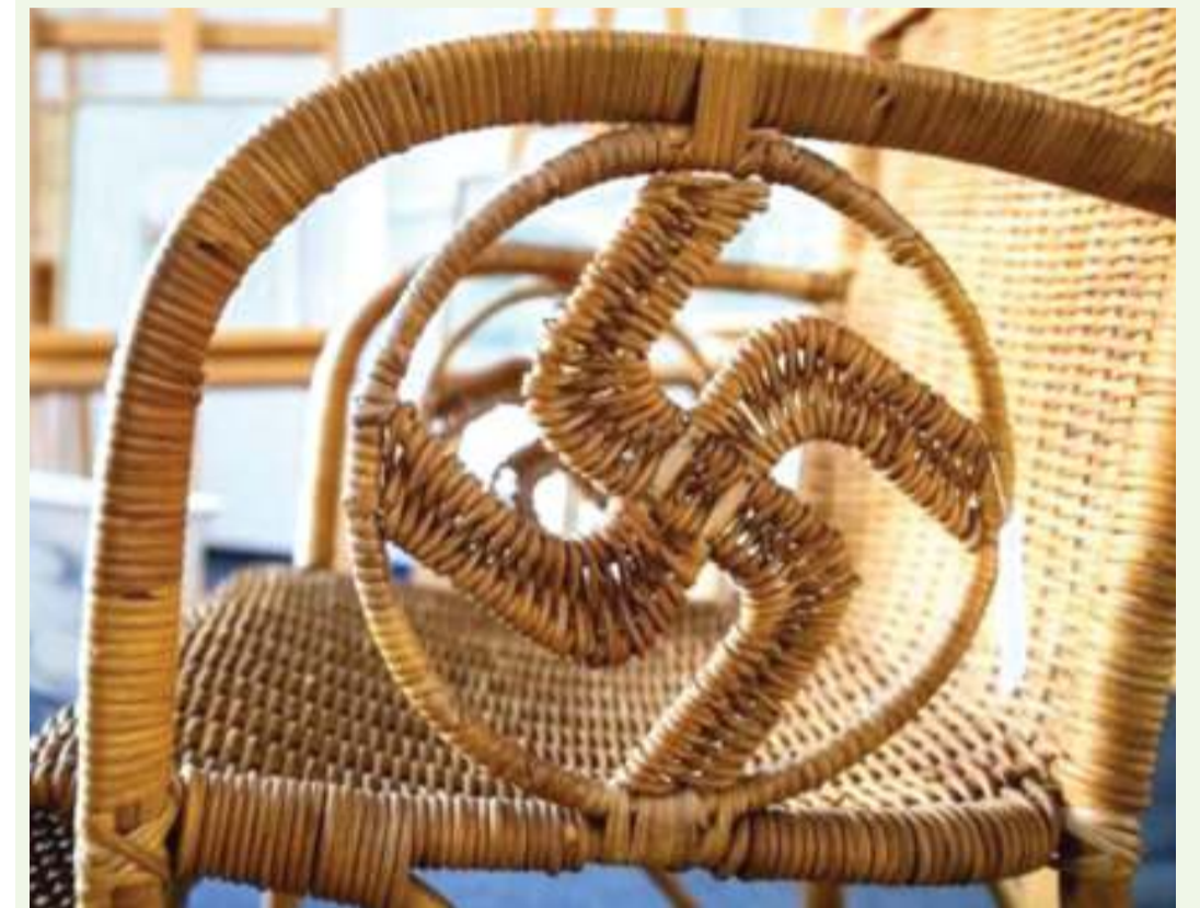
Kiti kilicho na alama ya nazi katika mikono yake.