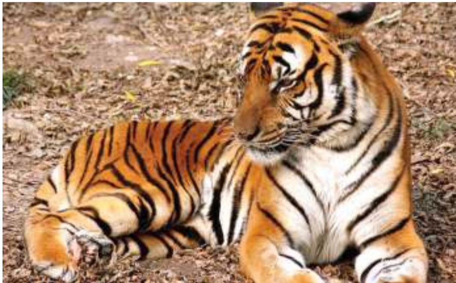
Chui aina ya Tiger aliyekutwa ametelekezwa katika jumba lisilokaliwa na watu nchini Marekani.