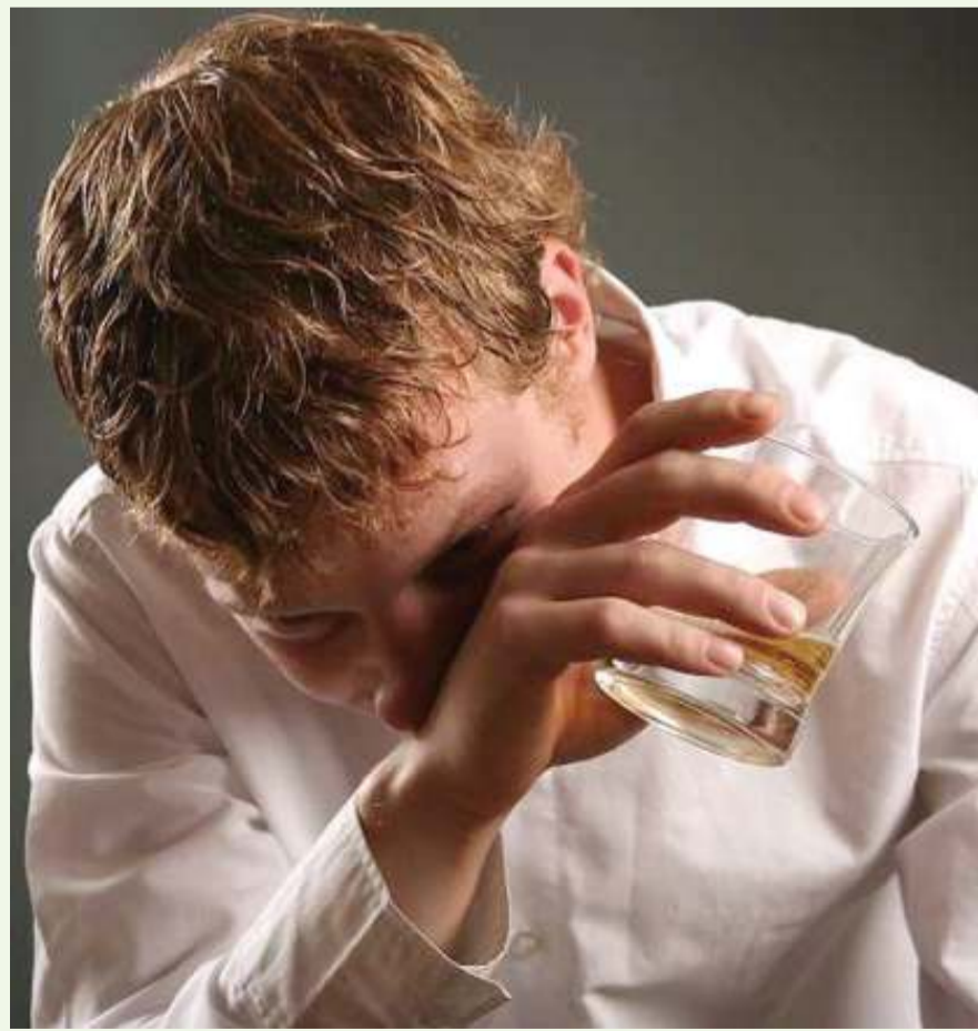
Utafiti unaonyesha kwamba unywaji pombe kama huu unaathiri chembechembe za mtu za DNA na kumfanya ahisi anataka kunywa zaidi.

"Lakini pia tatizo jingine ni la uchumi duni miongoni mwa wananchi unaowakwamisha kina mama wengi kufika katika Hospitali ya Rufani ya KCMC kufanya vipimo vya awali," anasema.