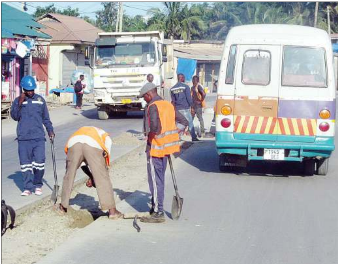
Mafundi wakiandaa sehemu inayotenganisha barabara inayoelekea kituo cha daladala cha Mawasiliano, jijini Dar es Salaam jana. Kabla ya kujengwa kwa kiwango cha lami, ilikuwa na mashimo mengi yaliyosababisha usumbufu kwa madereva wa magari.

Kadhalika, aliiitaka Bodi hiyo kuweka mkakati mahususi ya kukamata masoko mapya ya watalii kutoka nje ya nchi kutoka nchi za Marekani, Hispania, Urusi na nchi za Falme za Kiarabu zikiwamo za Dubai na Oman ambazo watu wake wakiwamo wasomi, wafanyabiashara, wanamichezo na watu maarufu wanapenda kwenda mapumziko ya muda mrefu na kutumia fedha nyingi kwa shughuli za utalii.