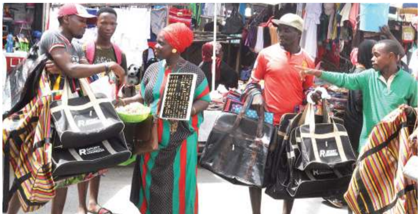
Wachuuzi wa mifuko mbadala, wakiendelea na shughuli zao katika Mtaa wa Congo, Kariakoo, jijini Dar es Salaam jana, bila ya kuwa na vitambulisho vya biashara vilivyotolewa na Rais John Magufuli.

Mafao ya muda mrefu ni pensheni ya uzeeni, fao la ulemavu na fao la warithi.