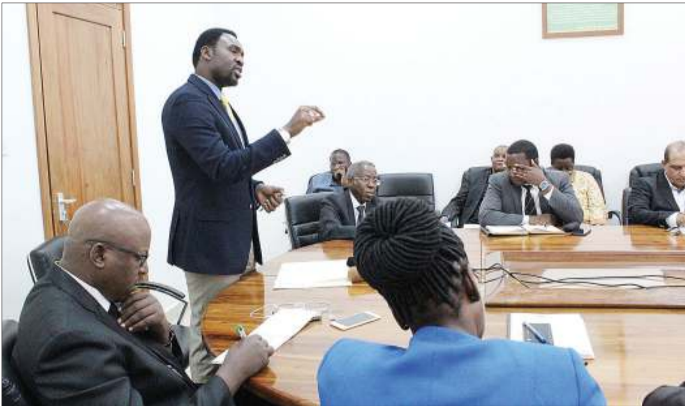
Waziri wa Maliasili na Utalii, Dk. Hamisi Kigwangalla, akizungumza wakati akizindua rasmi Bodi ya Utalii Tanzania (TTB), jijini Dodoma juzi. Bodi hiyo iliongezwa muda wa miaka 3 na Rais, Dk. John Pombe Magufuli Aprili 23 mwaka huu.