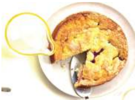
Mlo uliojaa sukari. PICHA: MTANDAO.