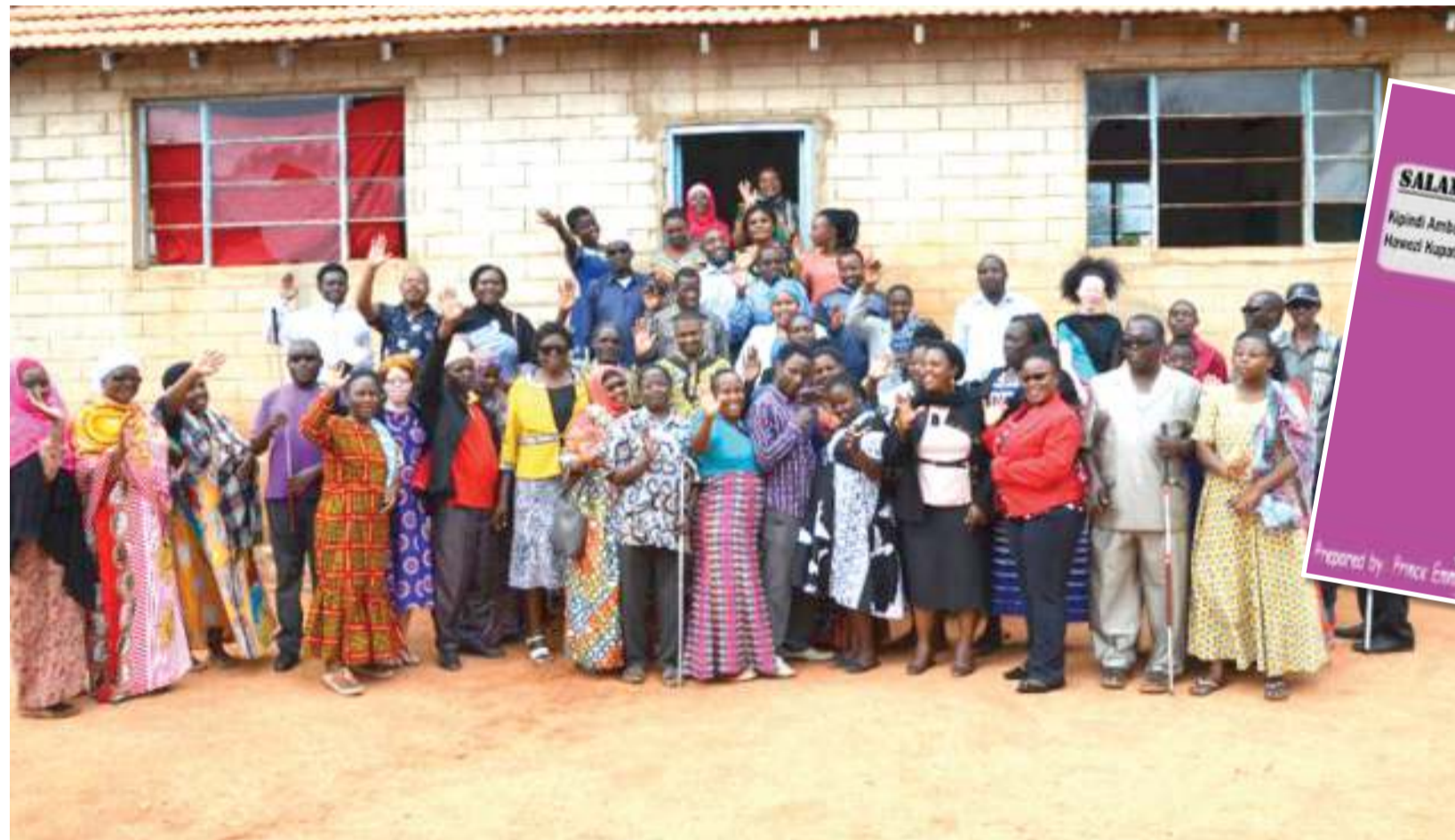
Walemavu wasioona walipohudhuria mafunzo ya hedhi salama wilaya ya Chamwino, jijini Dodoma.

■ Matundu ya vyoo vya wanafunzi hayatoshi