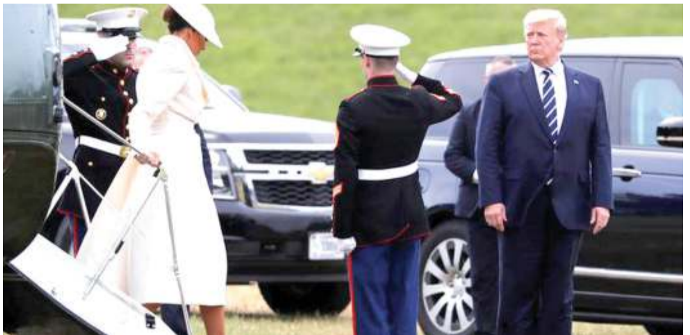
Rais wa Marekani, Donald Trump, akiwasili nchini Uingereza.