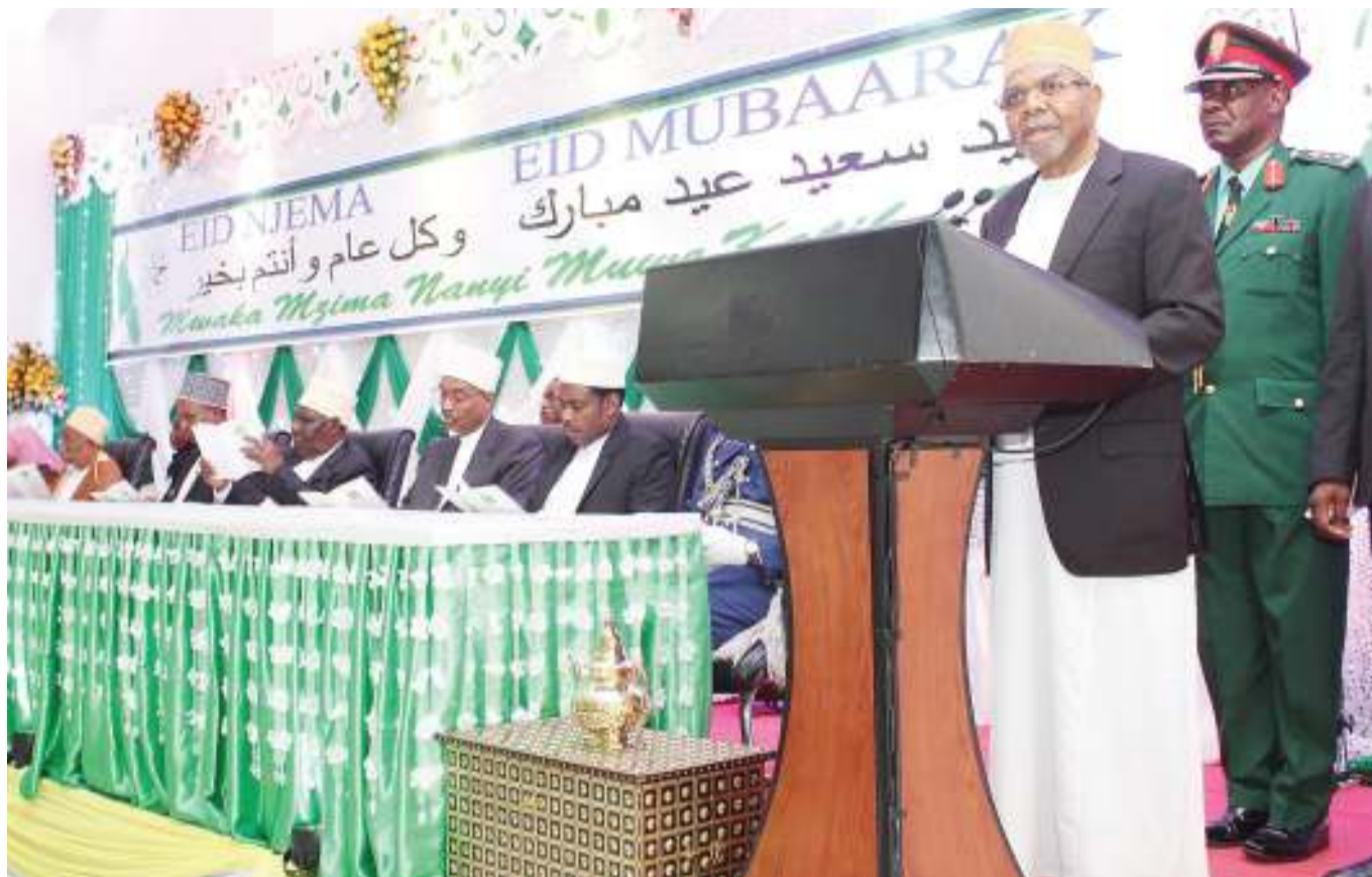
Rais wa Zanzibar na Mwenyekiti wa Baraza la Mapinduzi, Dk. Ali Mohamed Shein, akihutubia Baraza la Eid El Fitr katika ukumbi wa Sheikh Idrissa Abdulwakil Kikwajuni Zanzibar jana.