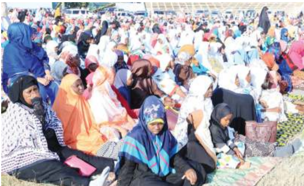
Sehemu ya kinamama wakishiriki swala ya Eid El Fitr katika viwanja vya Jamhuri jijini Dodoma jana.