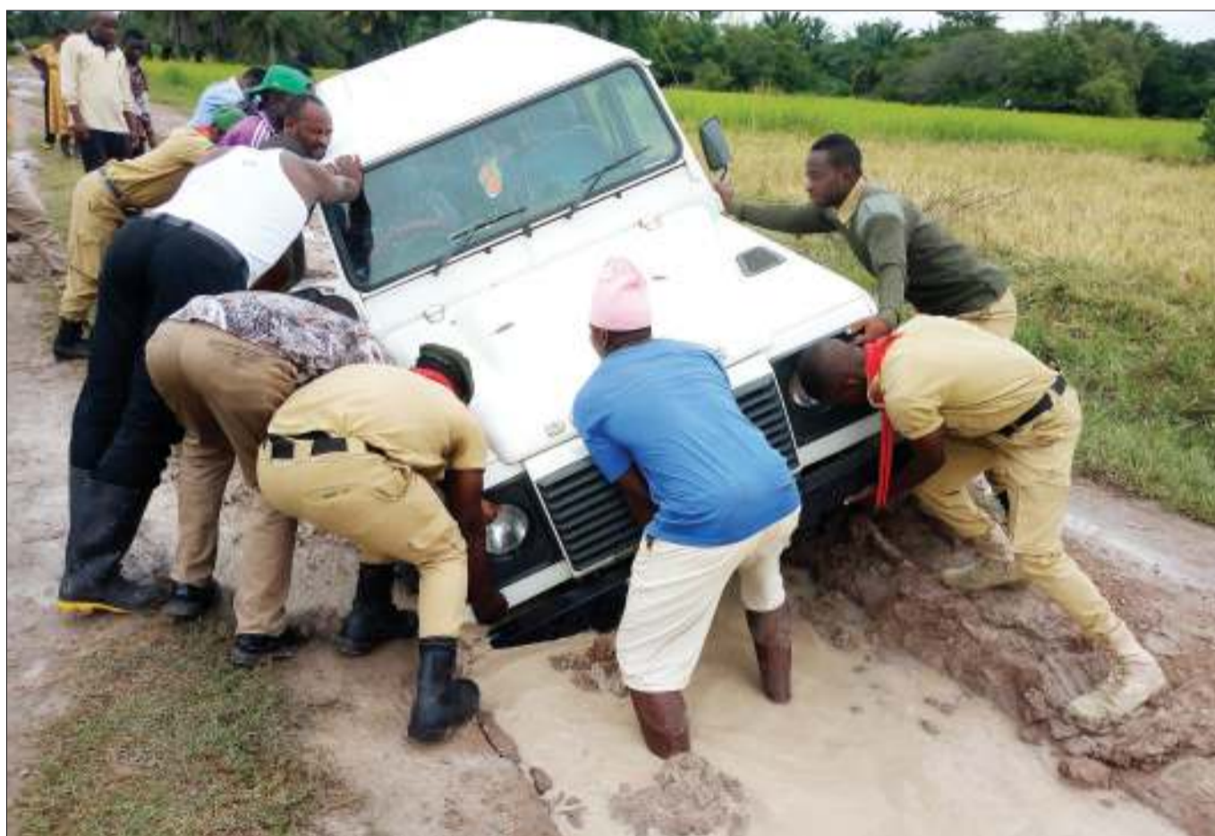
Wananchi wakisaidia kulikwama gari la serikali lililokwama kwenye matope kufuatia mvua zinazoendelea kunyesha wilayani Kyela, Mkoa wa Mbeya juzi na kusababisha baadhi ya barabara kutopitika.

Mwambigija alisema kinachofanyika ni mbinu za CCM kuwarubuni baadhi ya viongozi wa Chadema ili kukidhoofisha chama hicho kikuu cha upinzani, lakini akaeleza kuwa bado chama chake kitashinda kwenye uchaguzi zijazo.