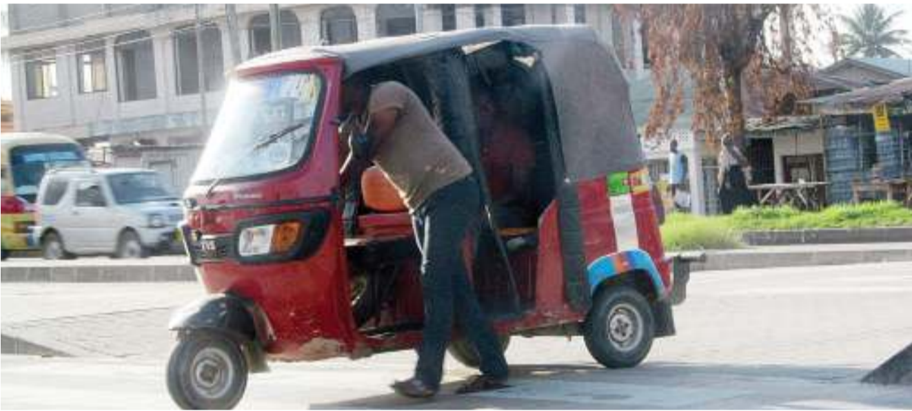
Dereva wa bajaj akionyesha utii wa sheria za usalama barabarani kwa kusukuma chombo chake, wakati akivuka kwenye alama ya pundamilia katika Barabara ya Morogoro, eneo la Magomeni Kagera, jijini Dar es Salaam jana.

Kwa mujibu wa BBC, Mama Nyerere amekuwa akisafiri kwenda hadi Namugongo Uganda kwa miaka 13 mfululizo kwa ajili ya sherehe za kuwakumbuka mashahidi wa Uganda.