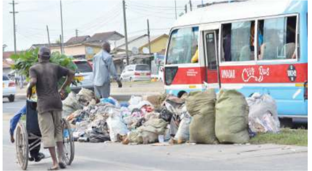
Lundo la takataka likiwa limetelekezwa katika kituo cha daladala cha magomeni Mwambechai, jijini Dar es Salaam jana na kusababisha usumbufu kwa abiria na wakazi wa eneo hilo.

Tayari serikali ya Uganda imeshatangaza kuzuia michezo hiyo nchini mwake, ikibainisha kuwa wale wenye leseni za kuiendesha hawataongezwa muda baada ya muda wa leseni zao kufika kikomo.