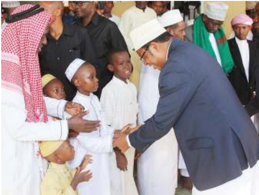
Waziri Mkuu Kassim Majaliwa, akisalimiana na watoto baada ya kushiriki Ibada ya Eid El Fitr kwenye Msikiti wa Anwar, Msasani jijini Dar es Salaam jana.