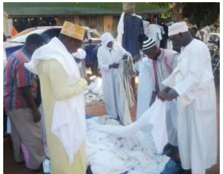
Baadhi ya waumini wa dini ya Kiislam wilayani Muheza, Mkoa wa Tanga, wachagua vazi kanzu baada ya kutoka katika swala ya Eid El Fitr katika Msikiti Mkuu wa Ijumaa, wilayani humo jana.