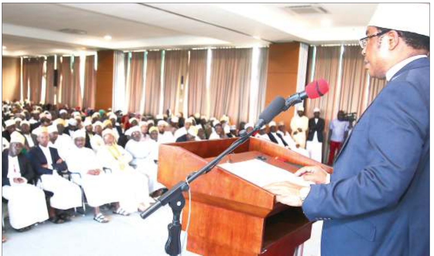
Waziri Mkuu, Kassim Majaliwa, akihutubia Baraza la Eid El Fitr jijini Tanga, jana.

YAPUNGUZWA kwa bil. 7.8/- kulinganisha na mwaka 2018/19, mishahara, matumizi mengineyo vyapigwa panga... Endelea uk. 2