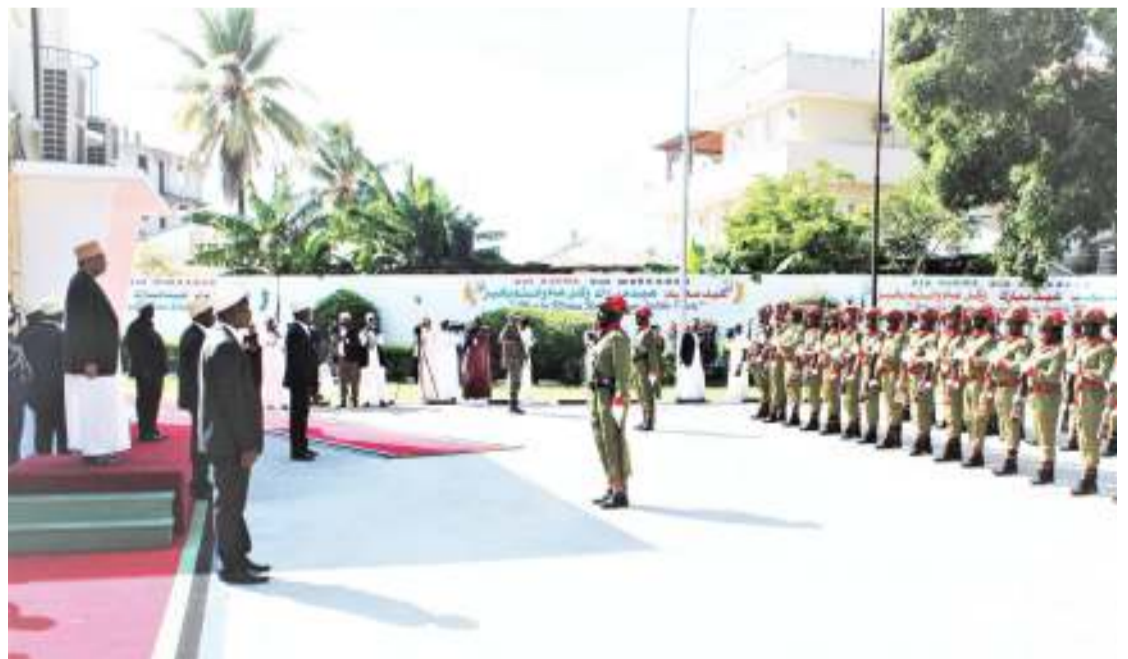
Rais wa Zanzibar na Mwenyekiti wa Baraza la Mapinduzi, Dk. Ali Mohamed Shein, akipokea heshima za Baraza la Eid El Fitr kwa gwaride Maalum la Jeshi la Polisi Kikosi cha FFU, katika viwanja vya Ukumbi wa Sheikh Idrissa Abdulwakil Kikwajuni Zanzibar jana.