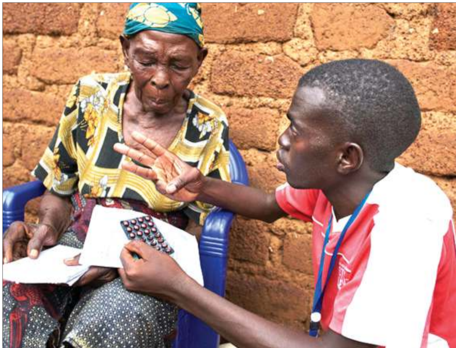
Mgonjwa akipatiwa huduma nyumbani.

hali inayochangia wagonjwa kupata vipimo na matibabu ya haraka, kabla ya kufikia usugu wa maradhi yanayowakabili.