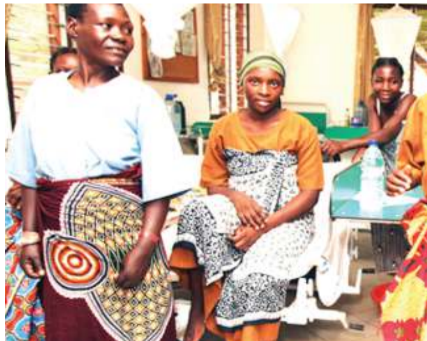
Baadhi ya wagonjwa wanaopata matibabu ya fistula katika Hospitali ya CCBRT, Siku ya Fistula, hospitalini hapo.

“Kila siku wanawake 800 hupoteza maisha duniani kutokana na matatizo ya ujauzito,” anasema na kuongeza kwamba wapo wengine 100,000 wanaopata tatizo jipya la ugonjwa huo kila mwaka