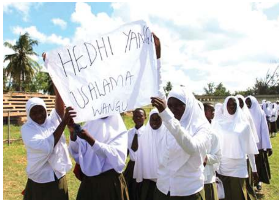
Wanafunzi katika harakati na mafunzo ya kutetea hedhi salama.