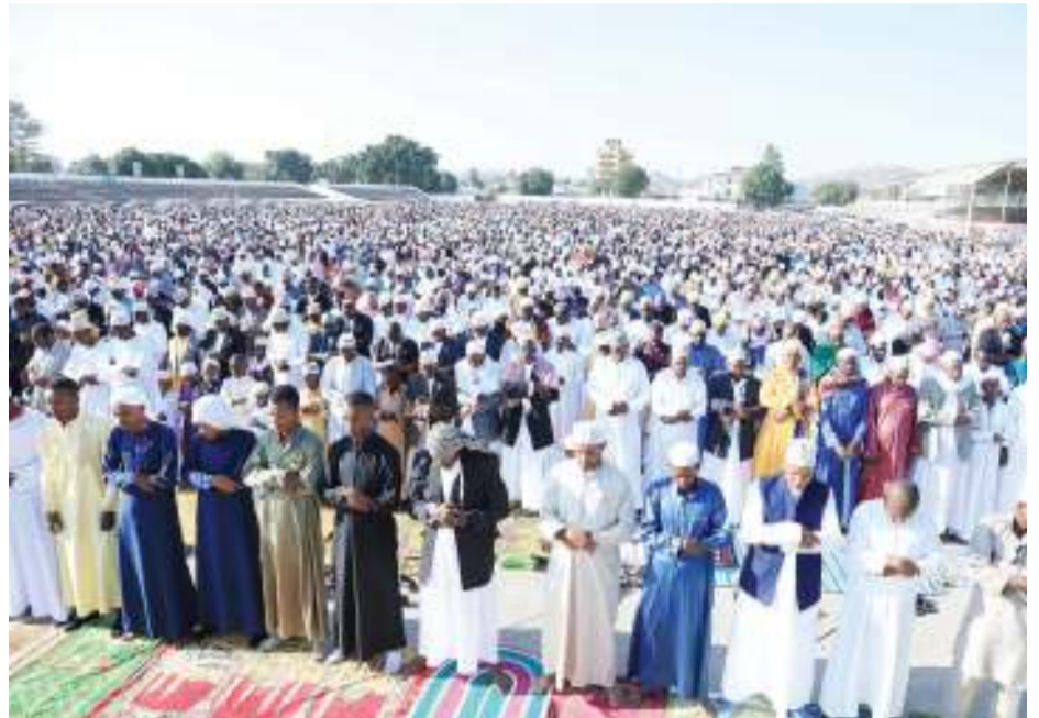
Sehemu ya waumini wa dini ya Kiislamu Mkoa wa Dodoma, wakishiriki swala ya Eid El Fitr, iliyo-fanyika katika Uwanja wa Jamhuri jijini humo jana.