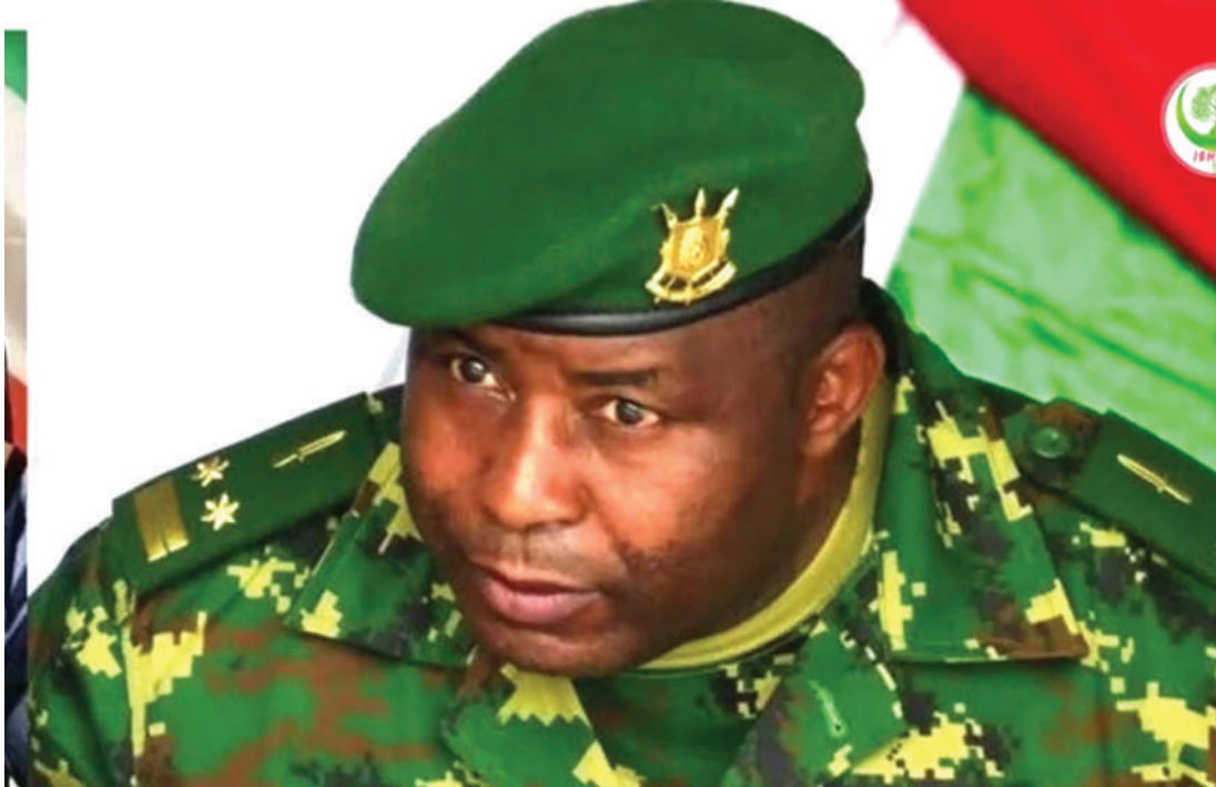
Mwenyekiti wa Jumuiya ya Afrika Mashariki, Rais Evariste Ndayishimiye wa Burundi.

Mbali na suala la M23, mkutano huo umetaka kikosi hicho cha jumuiya, kati ya mwishoni na mwezi Machi na Aprili kuanza kukusanya taarifa kuhusu kundi la FDLR na kuyasaka makundi mengine ya waasi kama ADF, RED Tabara, FNL na NAS.