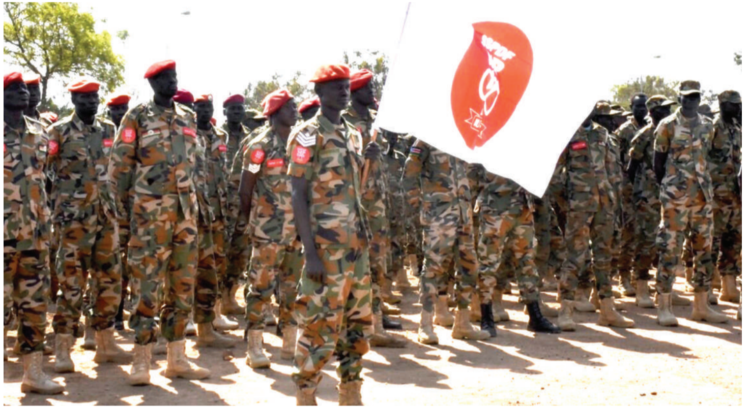
Kikosi cha askari 750 kutoka Sudan Kusini kikijiandaa kwenda DRC kujiunga na majeshi ya kikanda kuwakabili M23