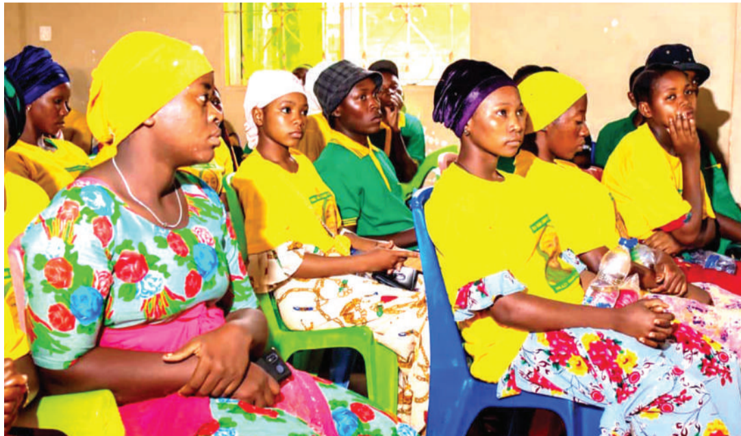
Vijana wa UVCCM wakifuatilia hotuba ya mjumbe huyo.

"Zama za ugomvi, kupigana na kutukanana katika siasa, ziishe, twendeni na hoja za maana, hoja za kujenga. Tuvumiliane tulete maendeleo ya kweli na yenye tija ili tujenge Tanzania mpya yenye maendeleo endelevu," anasema.