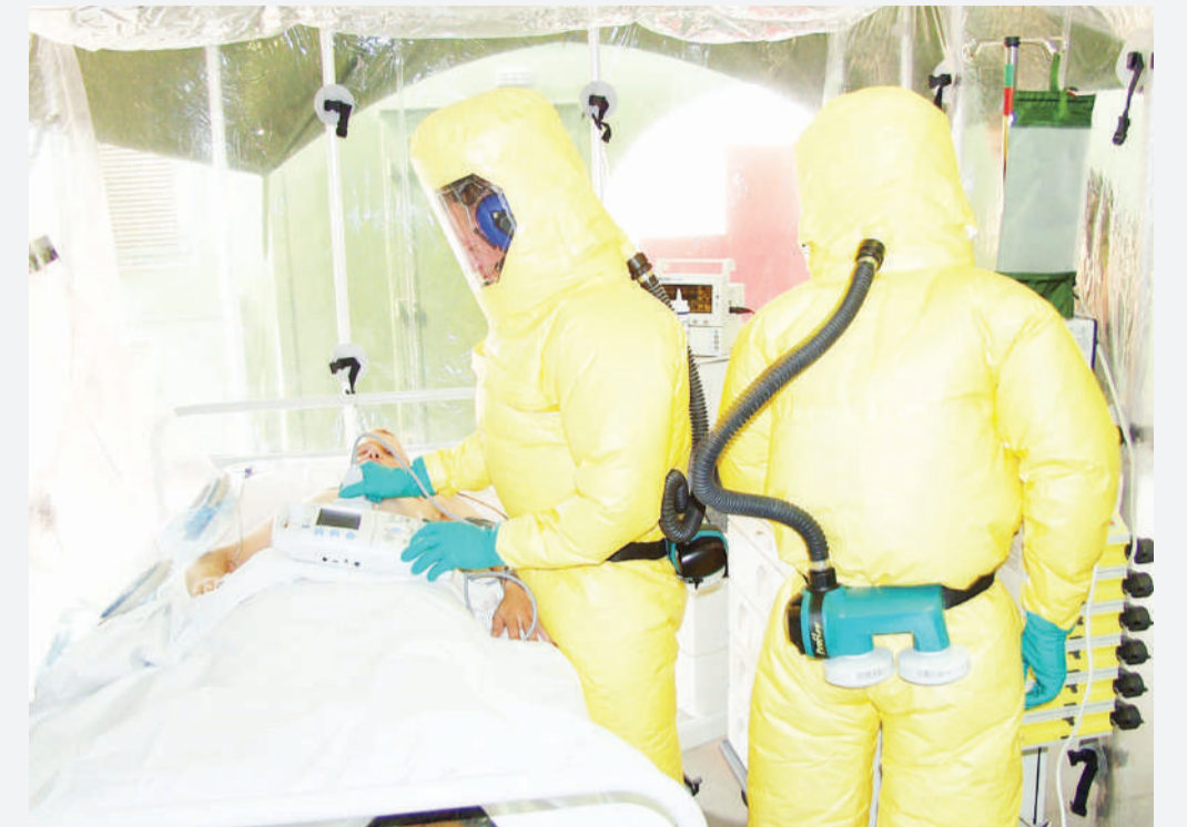
Madaktari wakitibu mgonjwa wa ebola Congo.

NCHINI Jamhuri ya Kidemokrasia ya Congo (DRC) imethibitishwa kuwa hakuna kisa chote cha ebola kilichoripotiwa katika siku 7 zilizopita mwezi Februari na hii ni mara ya kwanza tangu mlipuko wa ebola ulipoanza Agosti mwaka 2018 nchini humo.