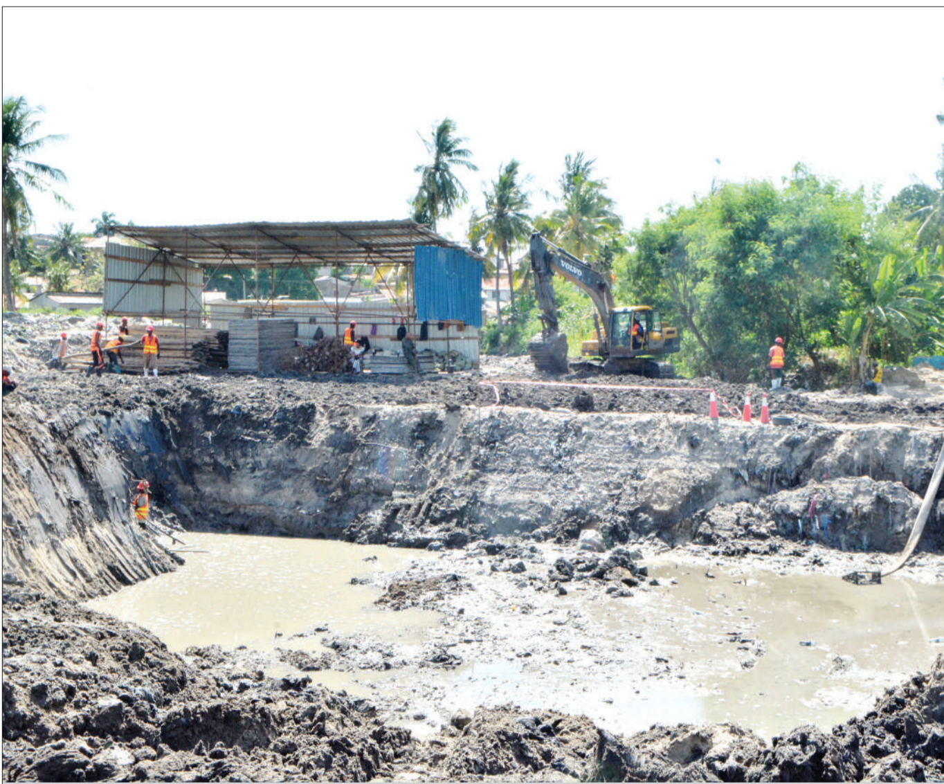
Mafundi wakiendelea na ujenzi wa daraja linalounganisha eneo la Magomeni Kwa Harubu na Mwananyamala, Manispaa ya Kinondoni, jijini Dar es Salaam jana.

Akifafanua alisema, kwa uzoefu waliopata katika visiwa vya Zanzibar na Comoro, dawa hiyo ya kiuatifu ya kunyunyiza majumbani na kuangamiza mazalia ya mbu inaweza kusaidia kudhibiti ugonjwa huo katika visiwa 38 vya wilaya hiyo.