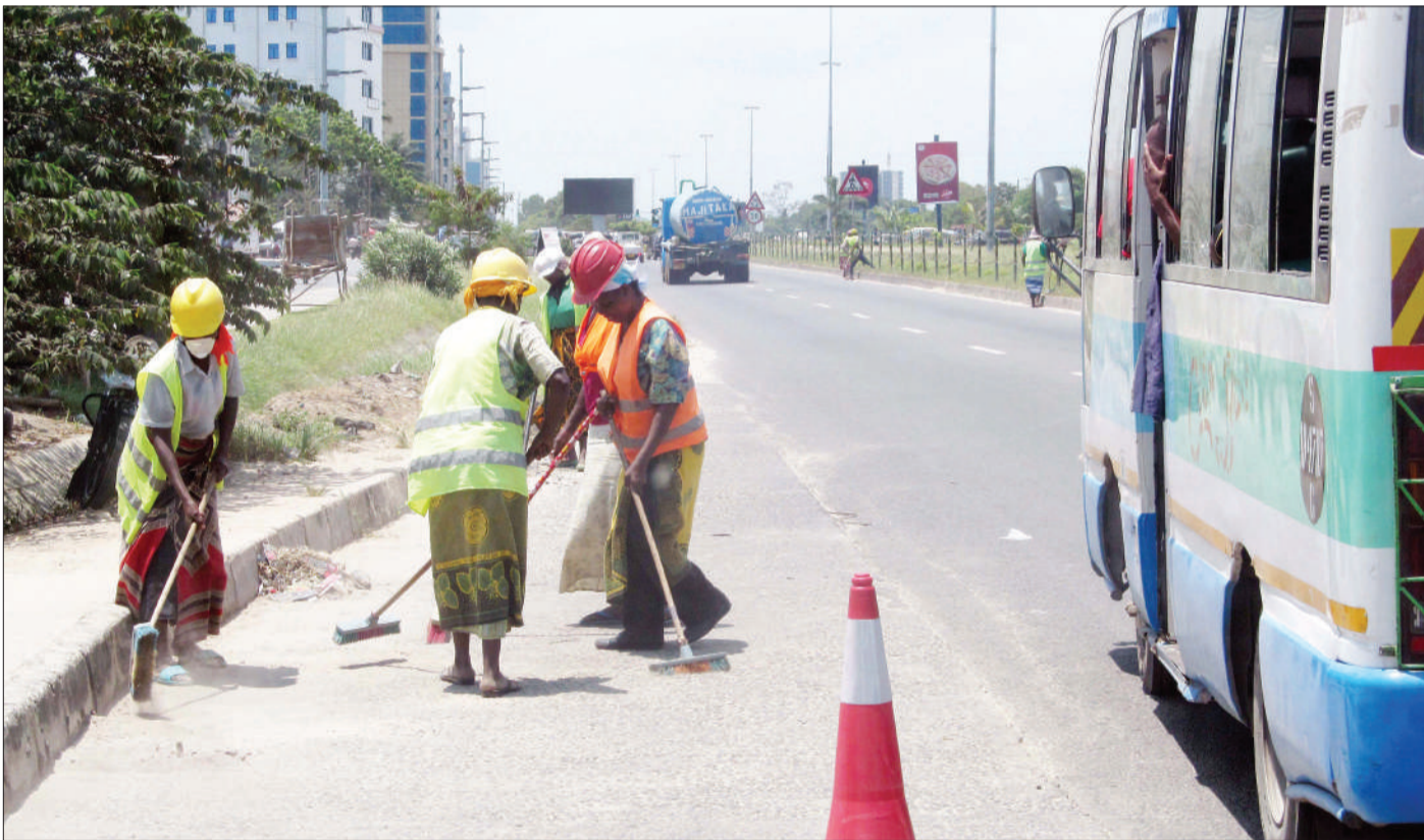
Wafagiaji wa barabara wakiwa kazini eneo la Mwenge, jijini Dar es Salaam jana, huku wameweka alama ya tahadhari kwa vyombo vya moto kwa ajili ya usalama wao.

Alisema serikali inataka watumishi wa umma wawajibike na waishi katika vituo vyao vya kazi. “Nawataka watumishi wote wa wilaya hii wanaoishi jijini Tanga wawe wamehamia hapa ifikapo Machi 20, mwaka huu na wasiohamia waendeleo kubaki huko huko.”