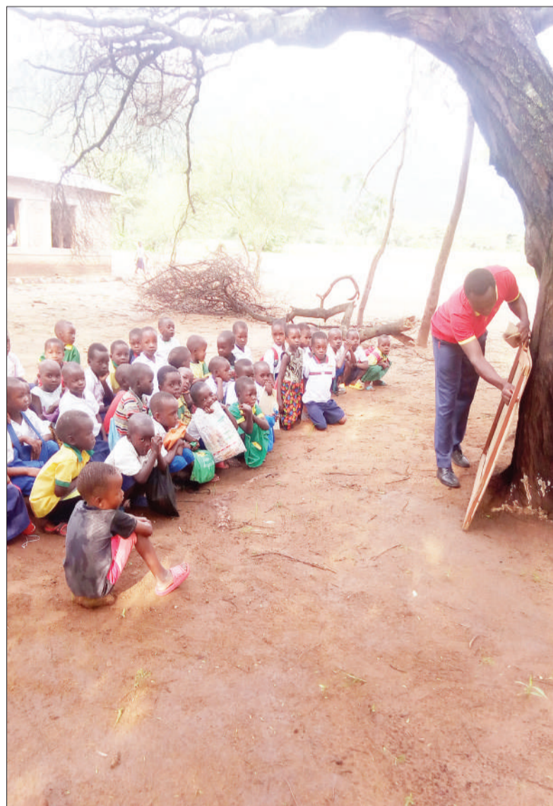
Hali ya usomaji ilivyo kwa wanafunzi wa madarasa ya awali katika Shule ya Msingi Mgowelo wilayani Kilolo mkoani Iringa.

Naibu Waziri huyo pia alitoa angalizo kwamba kwa mujibu wa taratibu, mamlaka ya wizara yake ni kuibua madai na wenye mamlaka ya kuajiri walimu ni Ofisi ya Rais, Tawala ya Mikoa na Serikali za Mitaa (Tamisemi), lakini alisisitiza matarajio ya utekelezaji wa suala hilo la ajira kwa walimu.