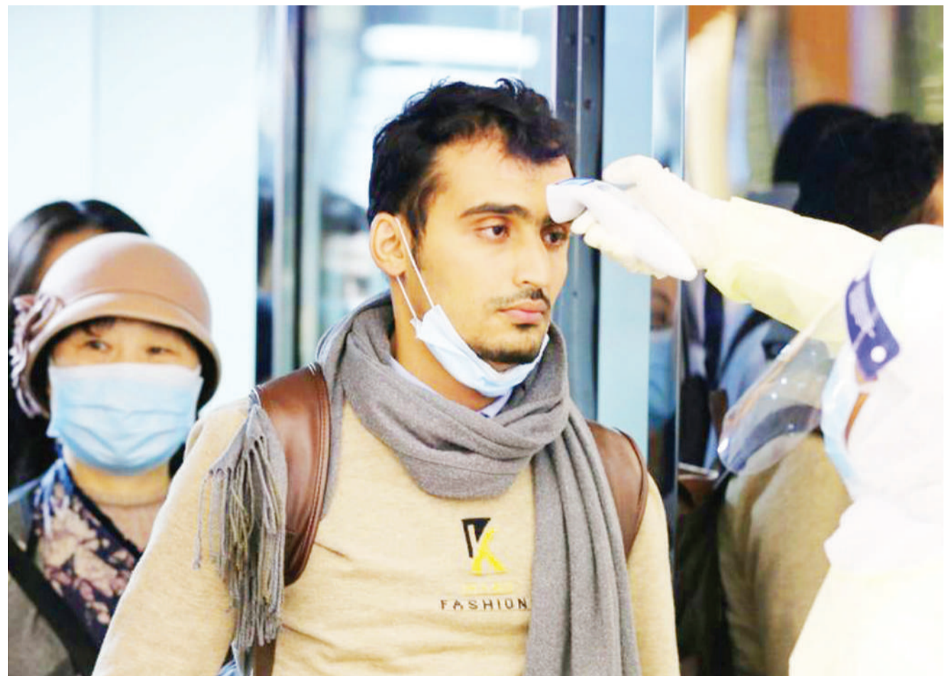
Abiria wakiwasili katika Uwanja wa Ndege wa Kimataifa wa King Khalid, Riyadh Saudi Arabia, kutoka China na maafisa wa afya wakiwapima kuhakikisha hawana kirusi cha corona.

Maofisa wa afya wa China walise-ma kuna maambukizi mapya 202 ya maambukizi ya virusi vya ugonjwa wa corona na kufanya idadi ya walioambukizwa kufikia 80,026.