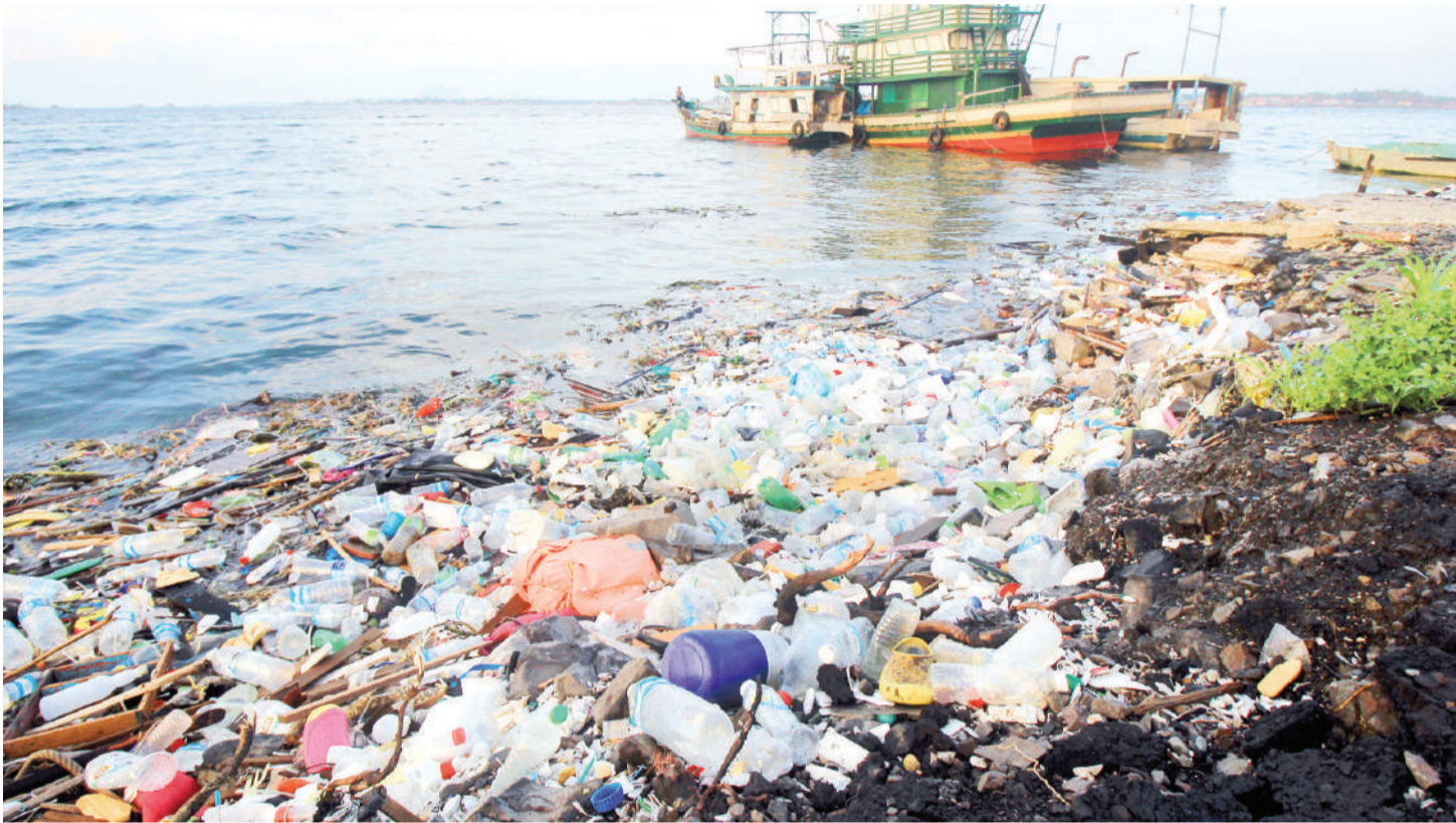
Plastiki na vifaa vya kielektroniki vinavyohatarisha uhai baharini.

S HIRIKA la Umoja wa Mataifa la Kuhifadhi Mazingira (UNEP), linakumbusha hatua zaidi kuchukuliwa kila wakati ili kuepusha madhara yatokanayo na ongezeko la taka za kielektroniki ambazo zinaiweka dunia hatarini.