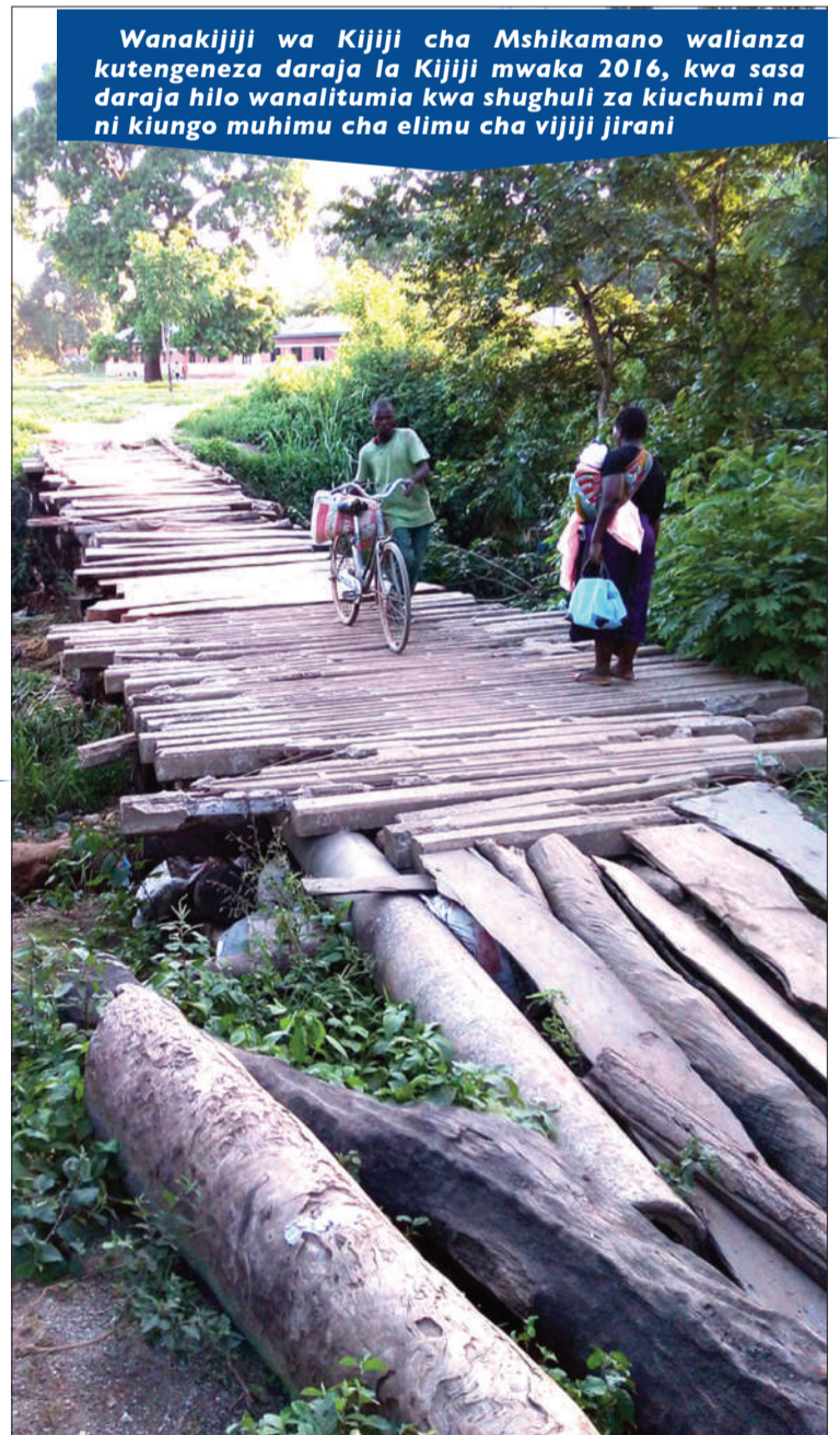
Ujenzi wa daraja ukiendelea Kijiji cha Mshikamano

Wanakijiji wa Kijiji cha Mshikamano walianza kutengeneza daraja la Kijiji mwaka 2016, kwa sasa daraja hilo wanalitumia kwa shughuli za kiuchumi na ni kiungo muhimu cha elimu cha vijiji jirani