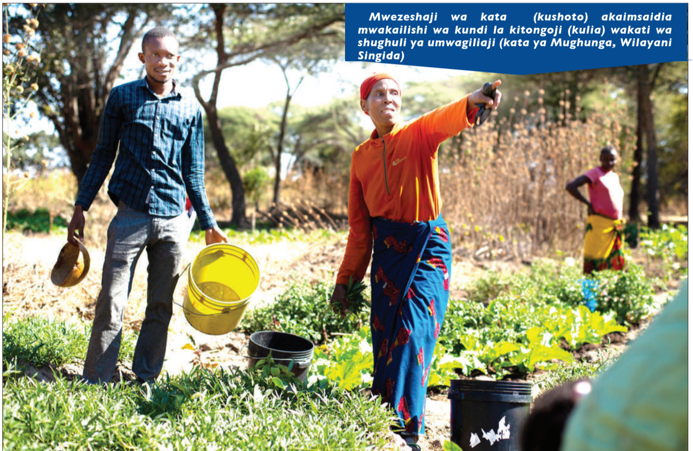
Mwezeshaji wa kata (kushoto) akaimsaaidia mwakailishi wa kundi la kitongoji (kulia) wakati wa shughuli ya umwagiliaji (kata ya Mughunga, Wilayani Singida)

“O&OD Iliyoboreshwa” inalenga kukumbuka na kuhushia utamaduni huu mzuri wa Taifa ulioffia.