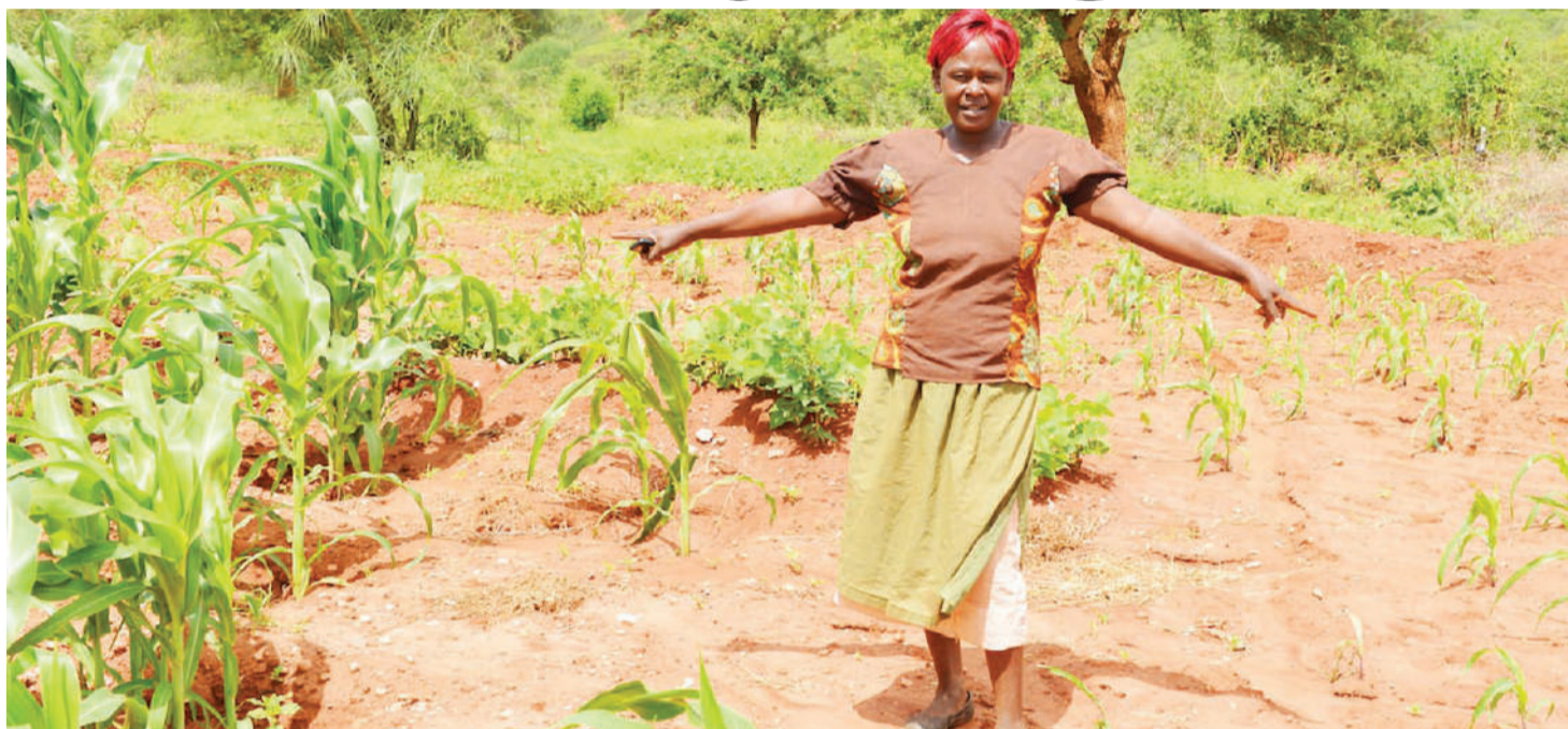
Lengo la 5 linahimiza usawa wa kijinsia ili kutimiza azma ya kuondoa njaa ni lazima sheria, mila na taratibu zinazokandamiza wanawake ambao ni wakulima wakuu nchini kumiliki ardhi na mazao wanayozalisha zirekebishwe.

Mambo mengine yanayoonyesha kuwa kiwango cha ukatili dhidi ya wanawake (VAW) kipo juu ni maambukizi ya Virusi Vya Ukimwi (VVU), wanawake wengi wameambukiwa na hasa mabinti wenye umri wa kuanzia miaka 14 hadi 25, kwa mujibu wa Taarifa ya Tume ya Taifa ya Kudhibiti Ukimwi ya mwaka 2019.