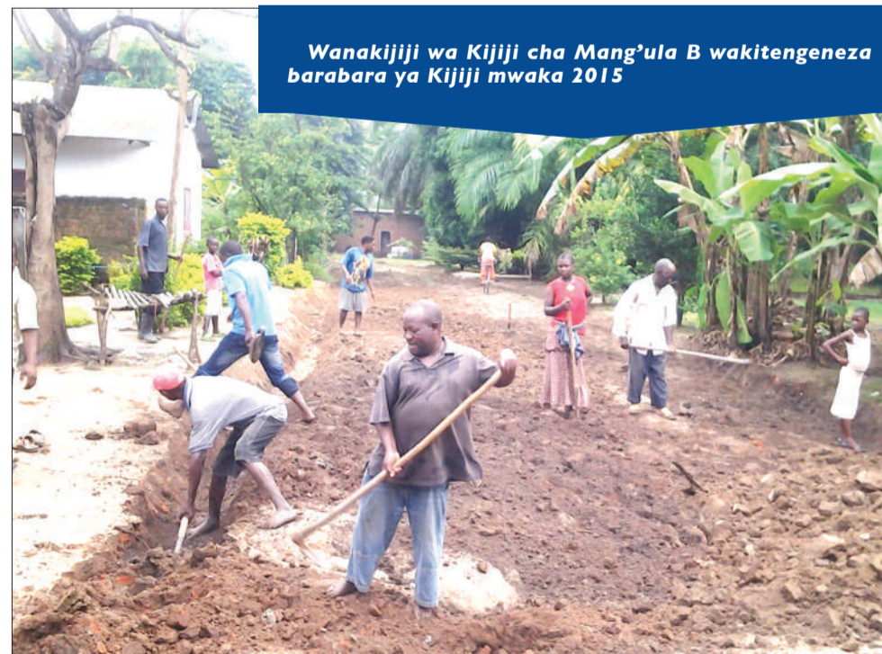
Wanakijiji wa Kijiji cha Mang'ula B wakitengeneza barabara ya Kijiji mwaka 2015

OR-TAMISEMI na JICA walitambua wazi kuwa njia sahihi na ya ufanisi ya kuleta maendeleo katika nchi hii ni kutumia kikamilifu faida ya utamaduni mzuri uliopo wa “Jitihada za Jamii” ili kuongezea nguvu za Serikali kuelekea maendeleo ya kijamii na kitaifa na kuboresha maisha ya watu.