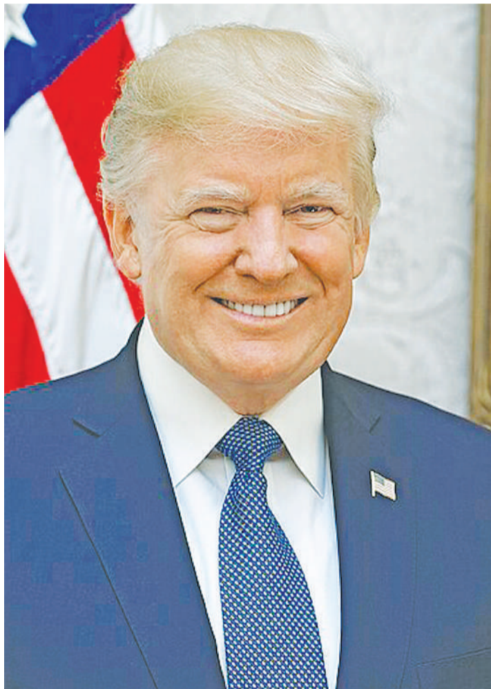
Rais mteule wa Marekani, amepona sikio akitarajia kuingia ikulu Januari 20. PICHA ZOTE MTANDAO