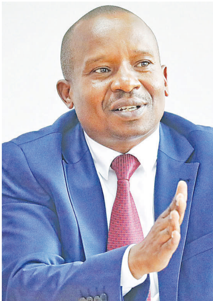
Kithure Kindiki Naibu Rais wa Kenya baada ya mapinduzi ya GEN Z.

Ni jirani Kenya, Rais William Ruto, akikimbizwa mchakamchaka na maandamano ya miezi kadhaa, yaliyopewa jina maarufu Gen Z au Generation Zero, kwa maana kizazi