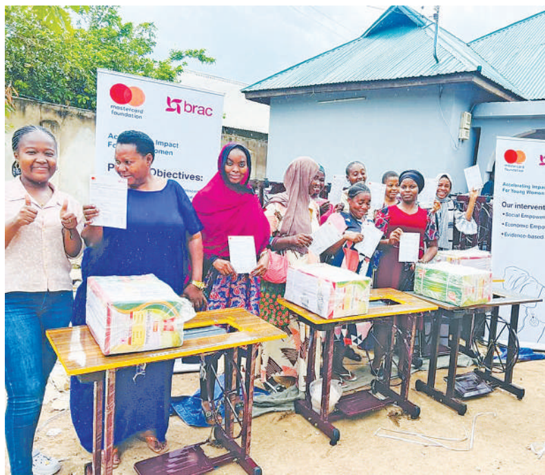
Wanawake wajasiriamali kutoka Halmashauri ya Wilaya ya Iramba mkoani Singida wakiwa na vyerehani ambavyo walipewa juzi na Shirika lisilo la kiserikali la Brac Maendeleo Tanzania (BMT) kupitia mradi wake wa kuwawezesha wanawake na mabinti balehe kiuchumi (AIM).

Mfano makundi ya shule na vyo huwa hayana dhamira ya kutaka kusalimiana na kujuliana hali, bali yapo pale maalum kupima mafanikio ya walio kwenye kundi.