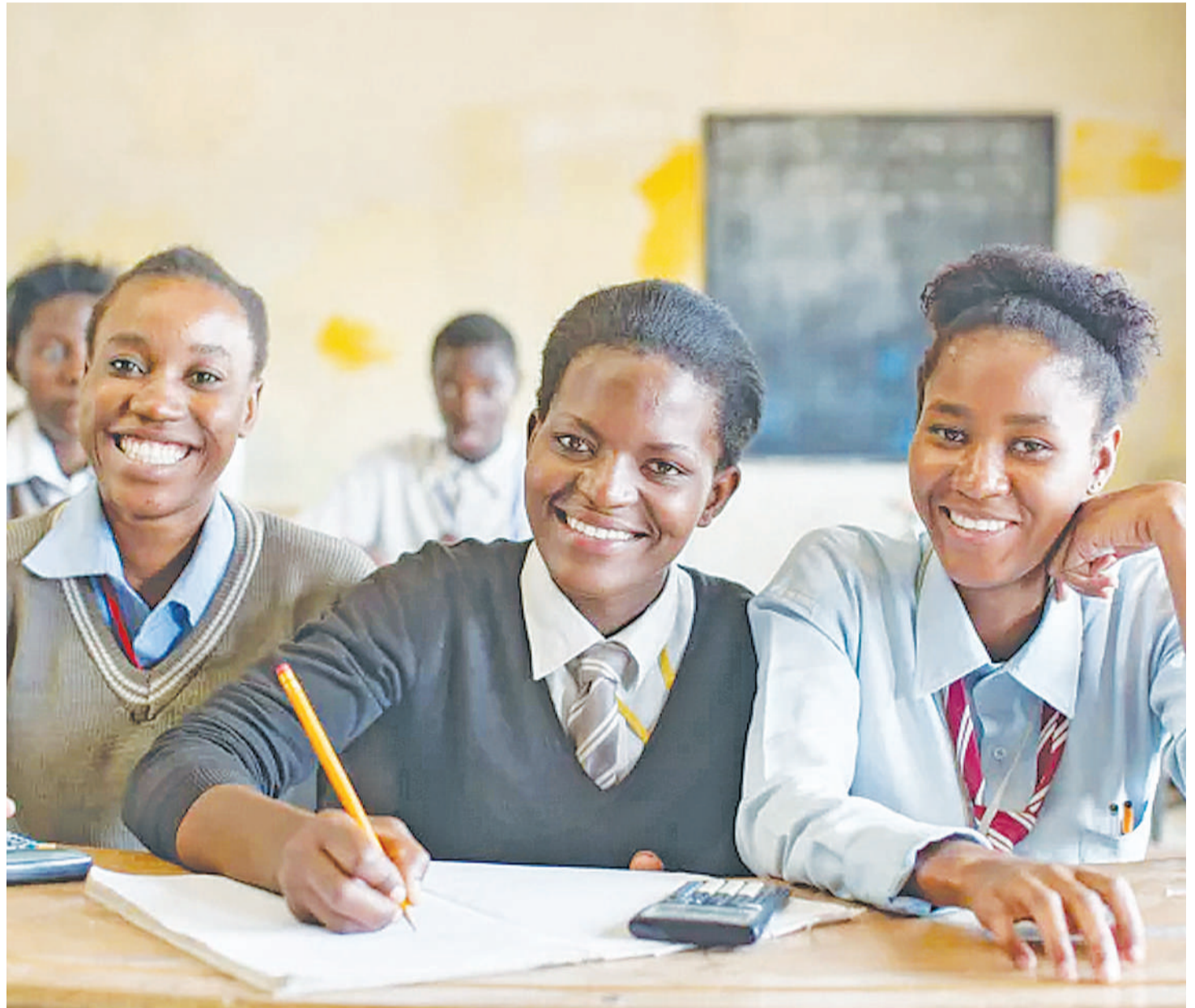
Dira na demokrasia ni muhimili kwa ustawi wa taifa linaloathamini usawa wa kijinsia.

mpana wa demokrasia. Mara kadhaa tafsiri ya demokrasia imetolewa na kuna umuhimu wa kuikumbusha tena kuwa ni neno la Kigiriki.