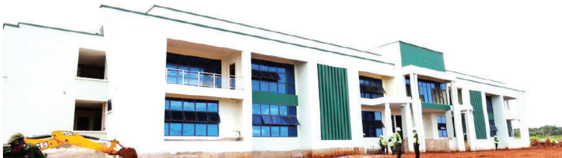
Jengo la makao makuu ya NCAA linalojengwa Karatu

Zabuni hiyo ilipata mshindi Machi 9, 2022 baada ya kupitia mchakato wa kisheria kutekeleza mradi wenye gharama ya Sh. bilioni 9.8.