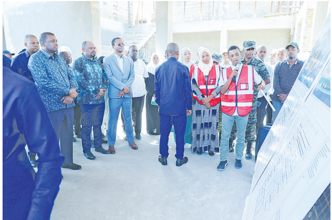
Makamu wa Pili wa Rais wa Zanzibar, Hemed Suleiman Abdulla, akipata ufafanuzi kuhusu ujenzi wa Kituo cha Afya Kiuyu Minungwini, Mkoa wa Kaskazini Pemba ikiwa ni shamrashamra za Miaka 61 ya Mapinduzi Matukufu ya Zanzibar ya mwaka 1964 baada ya kuweka jiwe la msingi jana.

Alisema uchunguzi ukikamilika, watahiniwa watakopatikana na hatia watafutwa na wasimamizi wa mitihani kuchukuliwa hatua.