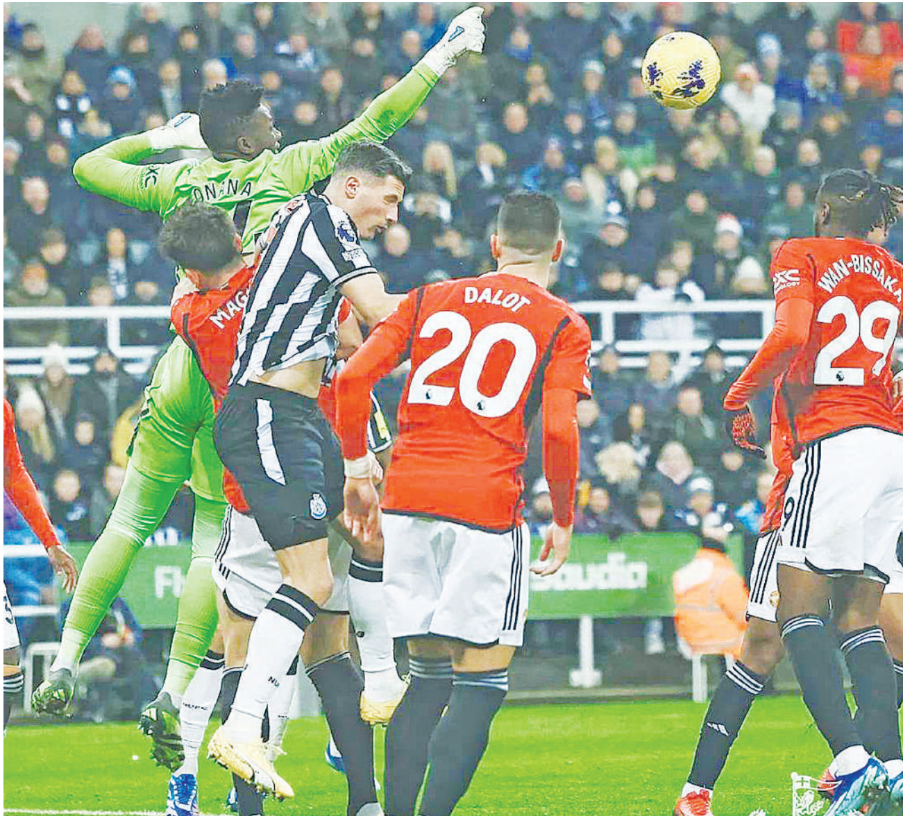
Golikipa wa Manchester United, Andre Onana, akiruka juu kuzuia mpira kwenye msitu wa watu wakati wa mchezo wa Ligi Kuu ya England dhidi ya Newcastle juzi kwenye Uwanja wa Old Trafford, United ilifungwa mabao 2-0.