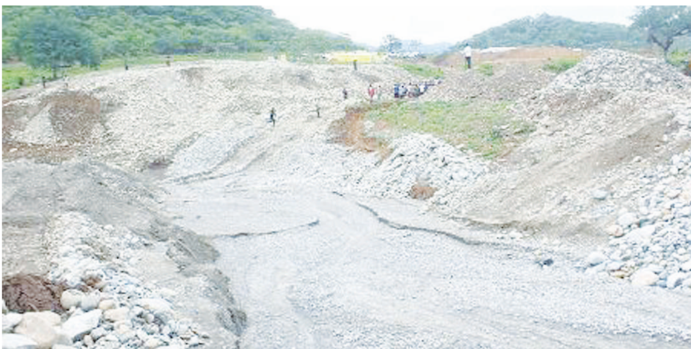
Baadhi ya wakazi wa Kata ya Ifumbo katika Halmashauri ya Wilaya ya Chunya mkoani Mbeya, wakiendelea kuchimba madini ya dhahabu kwenye mkondo wa Mto Zira juzu, hali inayosababisha uharibifu wa mazingira kwenye mto huo.

Katika uzinduzi huo ulioudhuriwa na viongozi wa taasisi mbalimbali za umma na wafanyabiashara binafsi Njombe umechang-ia Shilingi bilioni 2.3.