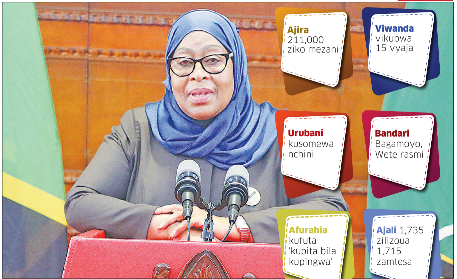
Rais Samia Suluhu Hassan