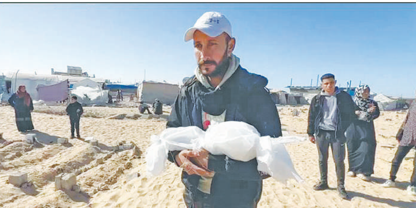
Baba wa mtoto aliyefariki kutokana na baridi kali Ukanda wa Gaza akibeba mwili kwenda kuzika jirani na kambi yao.