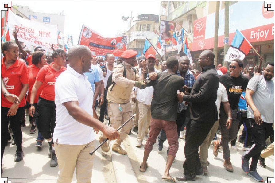
Walenzi wa chama hicho, wakimdhibiti mtu aliyetaka kumvamia Mwenyekiti wa chama wakati wa maandamano hayo.