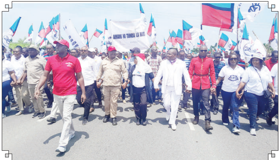
Makamu Mwenyekiti wa Chadema Taifa, Tundu Lissu na Katibu Mkuu wa chama hicho, John Mnyika wakiongoza maandamano yaliyoanzia eneo la Mbezi Mwisho jana.