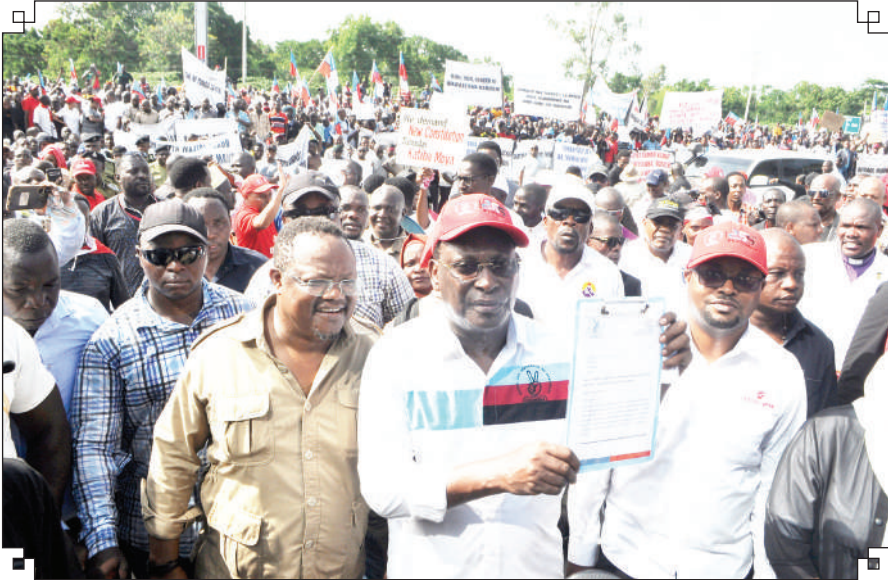
Mwenyekiti wa Chama cha Demokrasia na Maendeleo (CHADEMA) Taifa, Freeman Mbowe, Makamu Mwenyekiti wa chama hicho, Tundu Lissu na Katibu Mkuu, John Mnyika wakihitimisha maandamano ya amani katika Ofisi za Umoja wa Mataifa (UN) Sinza, Dar es Salaam jana.