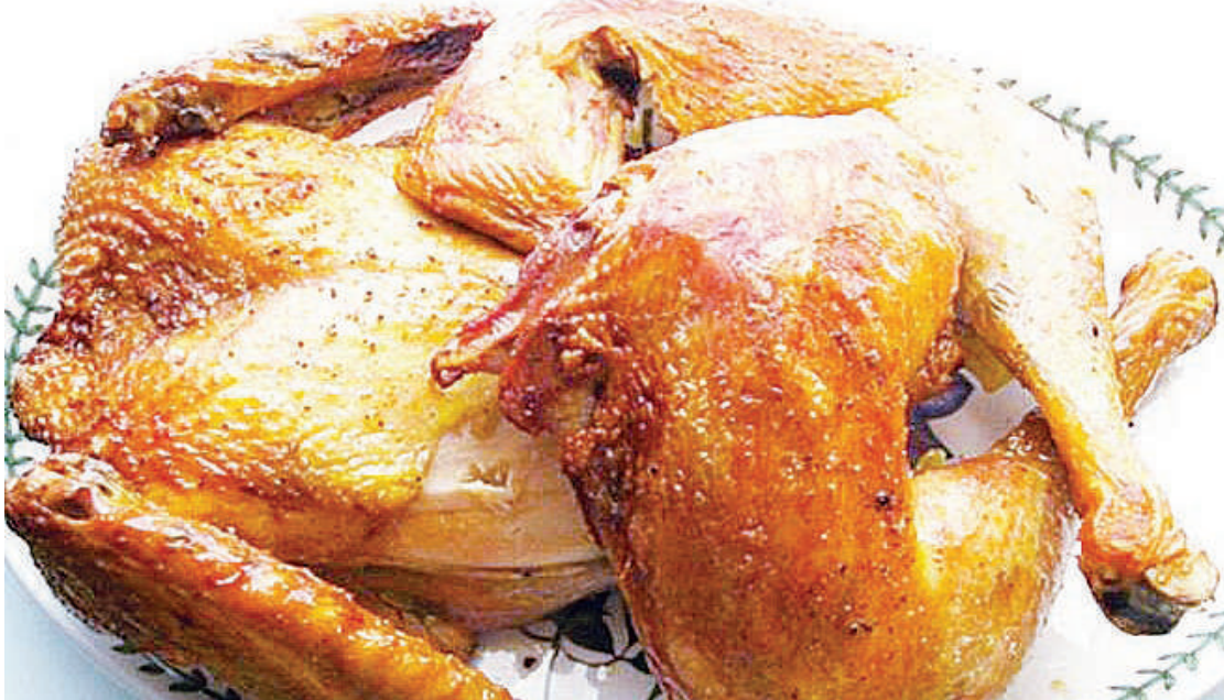
Nyama ya kuku waliokwishaandaliwa.