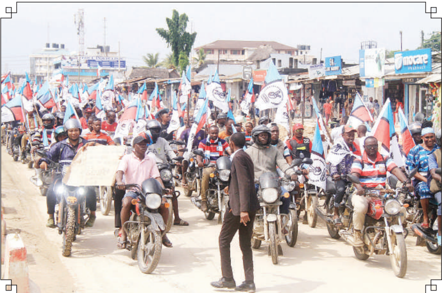
Wandeshwa Bodaboda wakishiriki maandamano hayo.