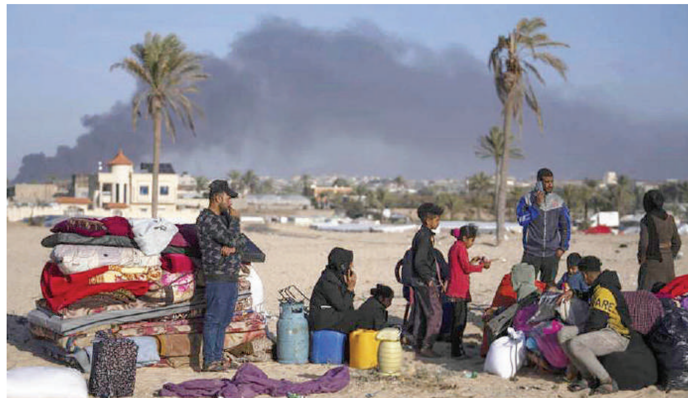
Raia wanaokimbia mapigano katika mji wa Khan Younes, wakijiandaa kuelekea eneo la Rafah jana.

Hadi sasa Hamas imeshaachia mateka 105 wakati wa usitishaji mapigano ya kipindi cha wiki moja mwisihoni mwa Novemba mwaka jana. DW