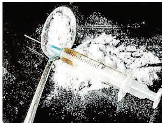
XXX. PICHA: MAKTABA