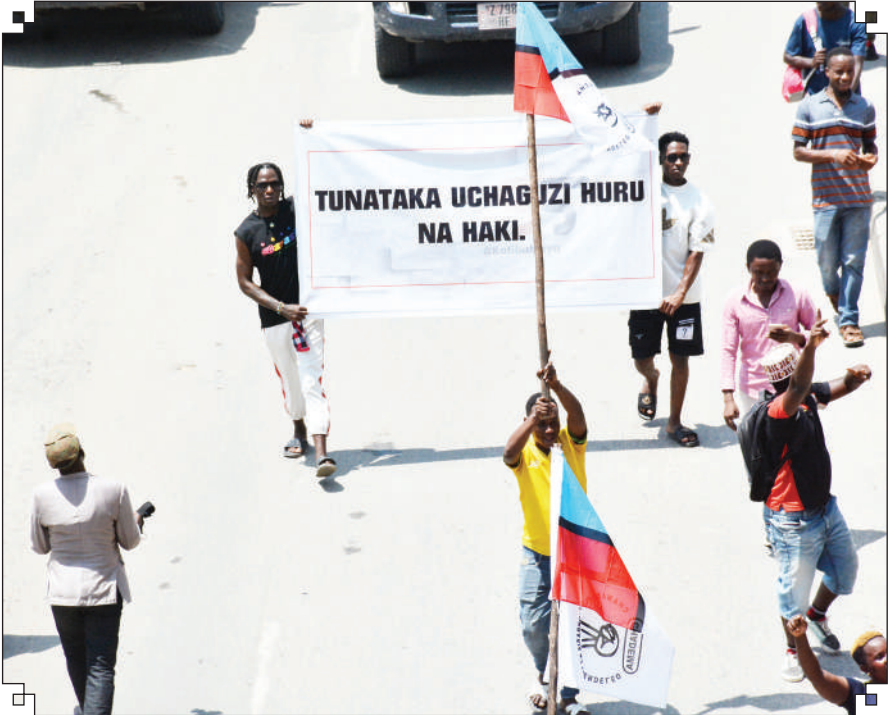
Wanachama wa Chadema wakiwa kwenye maandamano yaliyoanzia Mbezi Mwisho, jana.