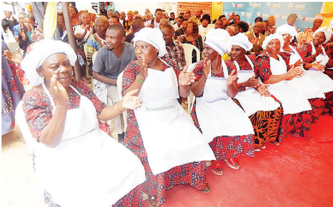
Wanufaika wa mradi Hebu Tuyajenge, katika matukio yao tofauti.

Kupitia elimu waliyoipata hadi sasa, anasema kikundi kimeanzisha kiwanda cha kutengeneza mikate kilichopo kata ya Mwangata, Manispaa ya Iringa, ikiwaongezea kipato, pia kuwapa lishe bora, kusomesha watoto wao na kuwarahisishia