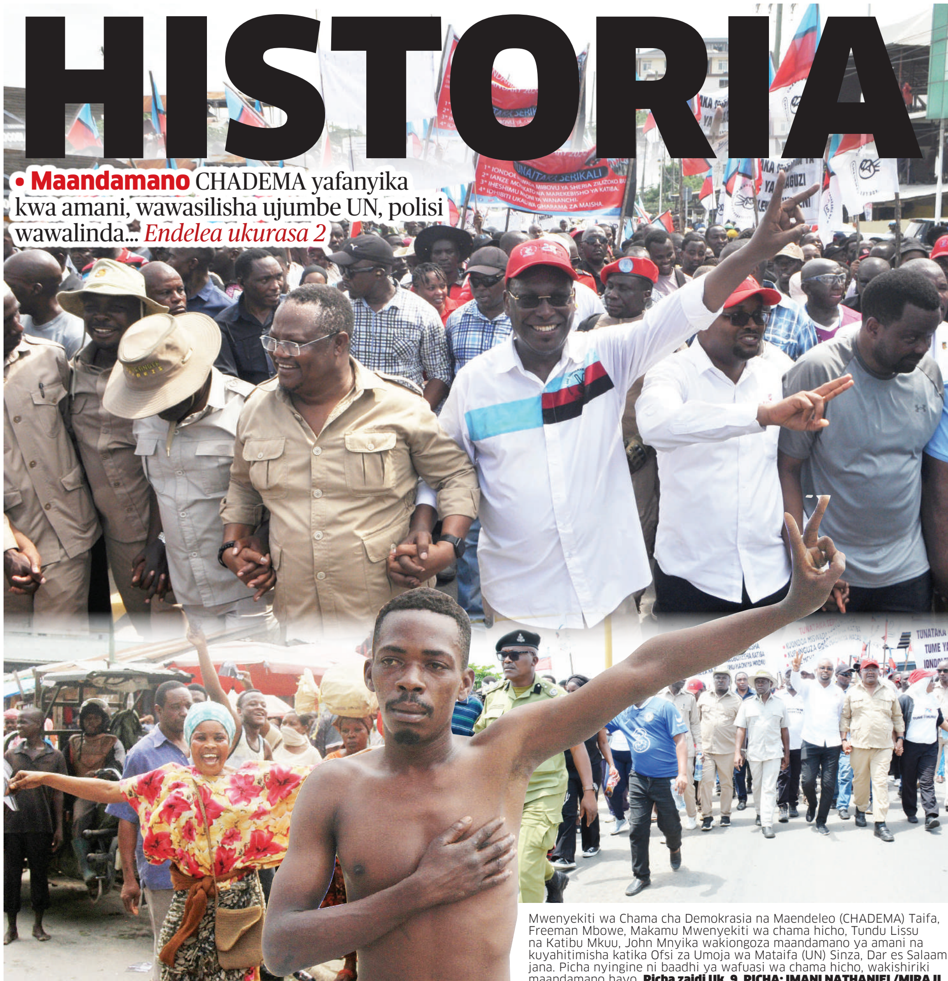
Mwenyekiti wa Chama cha Demokrasia na Maendeleo (CHADEMA) Taifa, Freeman Mbowe, Makamu Mwenyekiti wa chama hicho, Tundu Lissu na Katibu Mkuu, John Mnyika wakiongoza maandamano ya amani na kuyahitimisha katika Ofisi za Umoja wa Mataifa (UN) Sinza, Dar es Salaam jana. Picha nyingine ni baadhi ya wafuasi wa chama hicho, wakishiriki maandamano hayo. Picha zaidi Uk. 9.

• Maandamano CHADEMA yafanyika kwa amani, wawasilisha ujumbe UN, polisi wawalinda... Endelea ukurasa 2