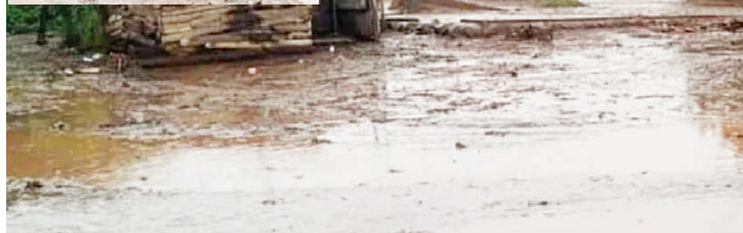
Hali ilivyokuwa katika mafuriko ya Katesh, wilayani Hanang.