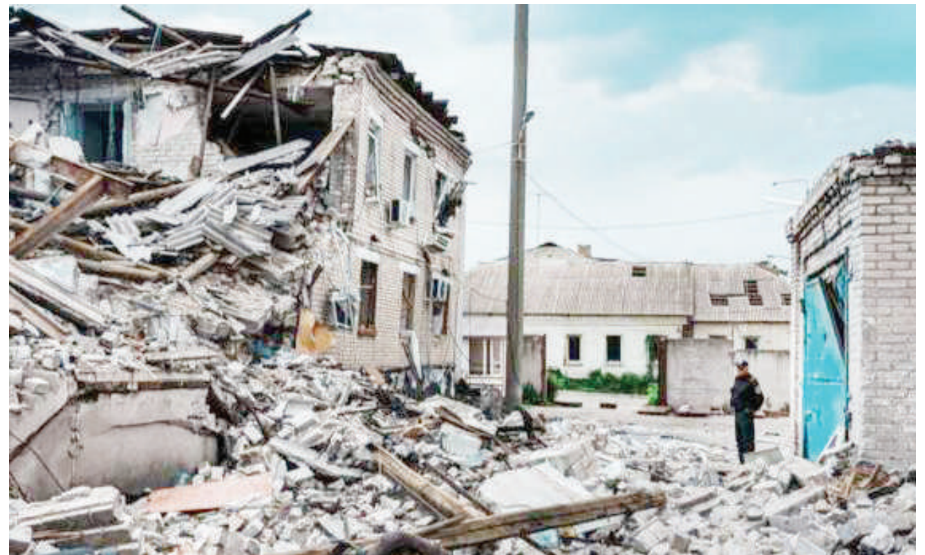
Mwonekano wa jengo lililoharibiwa vibaya katika mji wa mashariki wa Lysychansk nchini Ukraine ambao umetekwa na Russia kutokana na vita inayoendelea baina ya nchi hizo.

Pia taarifa zinasema zaidi ya wiki moja iliyopita wanajeshi wa Urusi waliteka Severodonetsk, jiji lililokuwa na magofu kwa siku kadhaa ya mashambulizi ya Russia. BBC