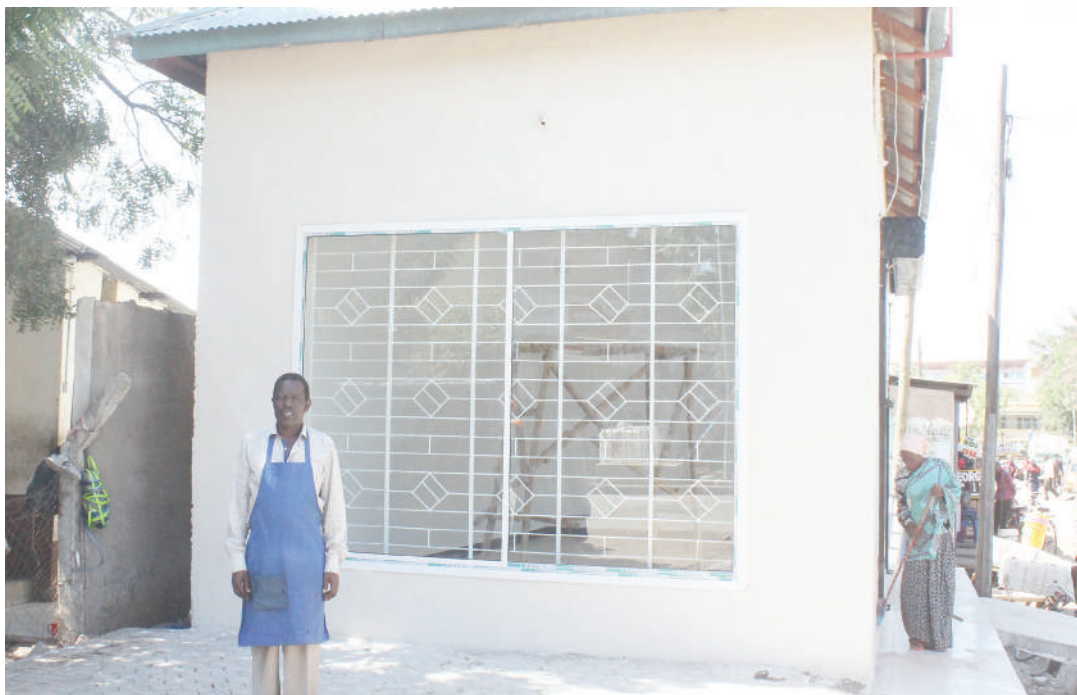
Ni kibanda cha taka Mtaa wa Mapinduzi kikiwa katika mwonekano wa sasa. Hapo awali kabla ya marekebishi ndivyo taka zilivyokuwa ‘zinapamba’ eneo hilo.

Anafanua kuwa wananchi na wafanyabiashara kwenye maeneo ya masoko taka wanazozalisha zinahifadhi kwenye mifuko kisha wakala ambaye amepewa kazi ya kuzikusanya hupita na magari na