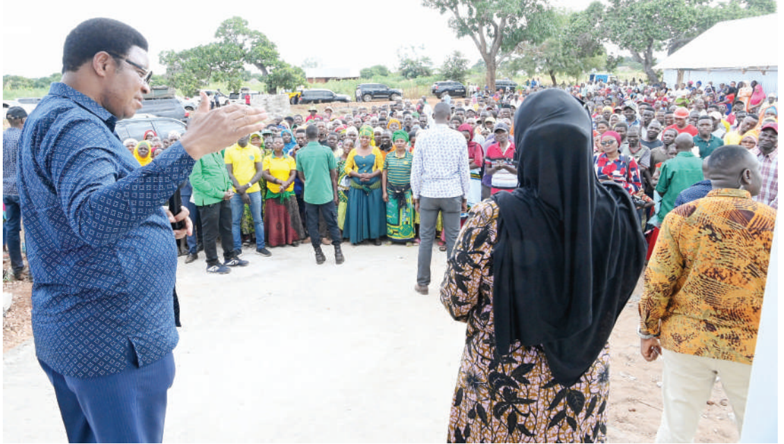
Waziri Mkuu, Kassim Majaliwa, akizungumza na wananchi baada ya kukagua ujenzi wa Kituo cha Afya Nangumbu wilayani Ruangwa, akiwa katika ziara ya kikazi wilayani humo.