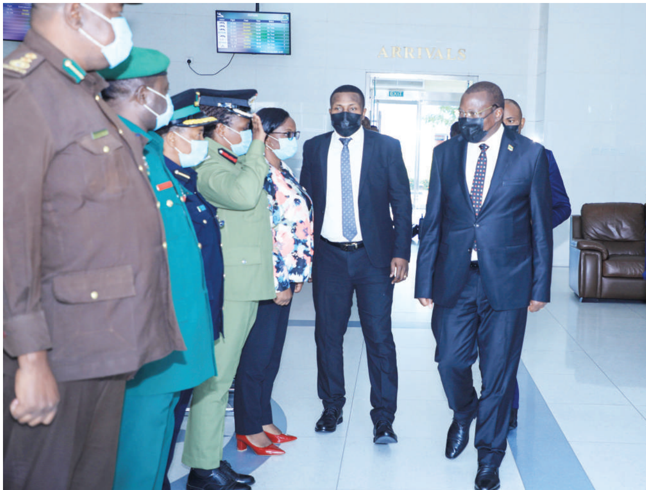
Makamu wa Rais, Dk. Philip Mpango, akiwasili Uwanja wa Ndege wa Kimataifa wa Julius Nyerere Dar es Salaam kutoka Lisbon nchini Ureno alipomwakilisha Rais Samia Suluhu Hassan katika mkutano wa pili wa Umoja wa Mataifa kuhusu Uhafadhi wa Bahari na Rasilimali zake.