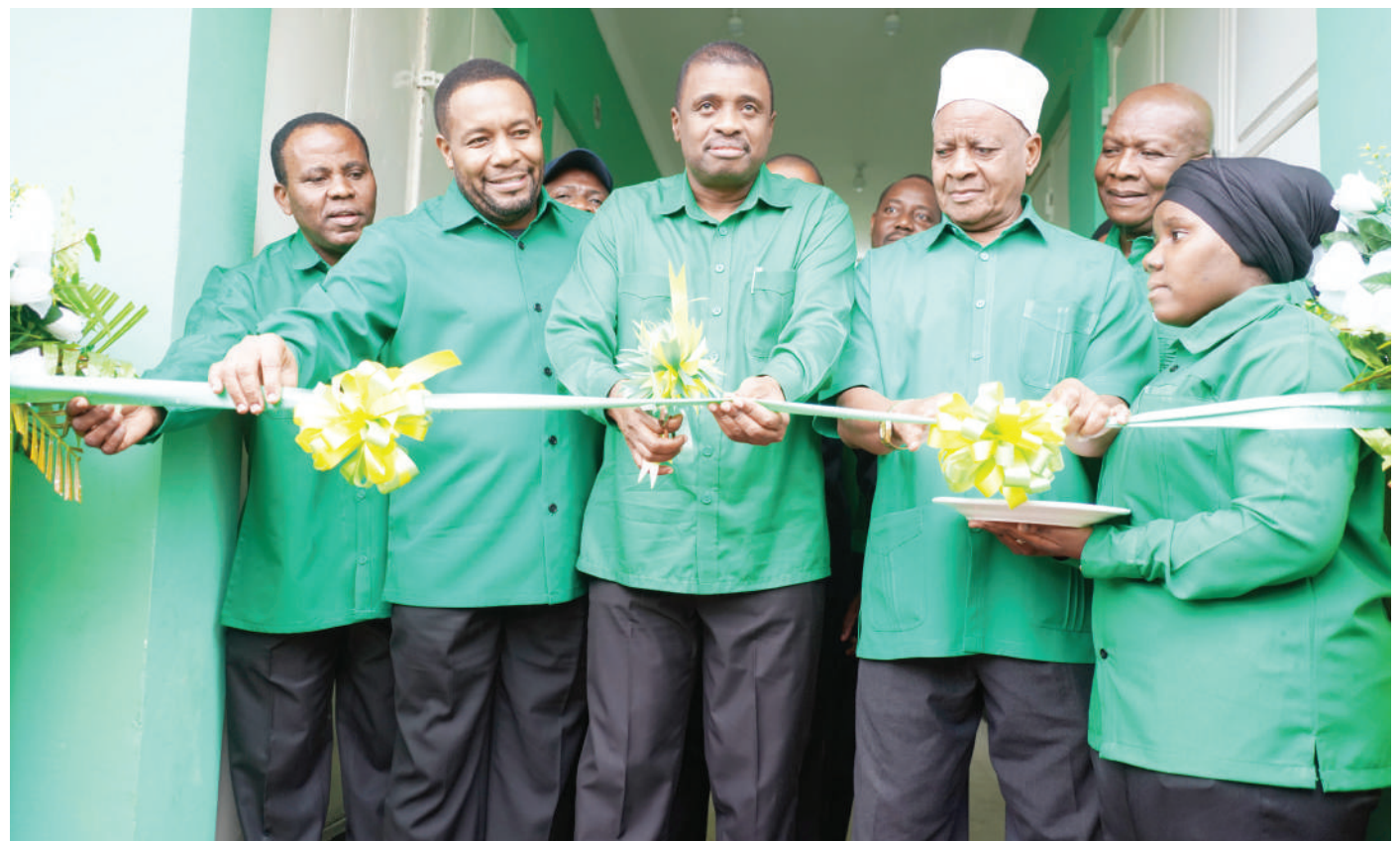
Mjumbe wa Kamati Kuu ya CCM Zanzibar ambaye ni Makamu wa Pili wa Rais wa Zanzibar, Hemed Suleiman Abdulla, akikata utepe kuashiria ufunguzi wa jengo la maduka ya biashara Ofisi Kuu ya CCM Kisiwandui Zanzibar kwa niaba ya Mjumbe wa Kamati Kuu ya Halmashauri Kuu ya CCM Taifa na Rais wa Zanzibar, Dk. Hussein Mwinzi.

Maadhimisho ya tatu ya wiki ya msaada wa kisheria yanatarajiwa kuadhimishwa Julai 9, mwaka huu na mgeni rasmi anatarajiwa kuwa Makamu wa Pili wa Rais Zanzibar Hemed Abdulla na kaulimbiu ni: "Paza sauti jitolee wawakilishe wasio na uwezo".