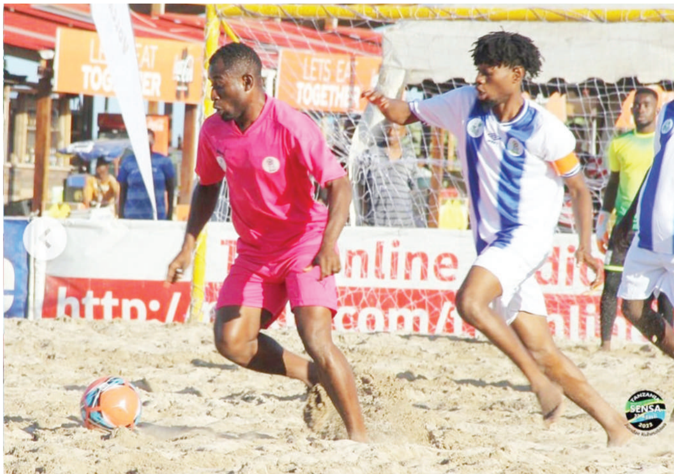
Mshambuliaji wa Mburahati FC akimtoka beki wa Ilala FC katika mashindano ya Ligi ya Ufukweni iliyochezwa kwenye ufukwe wa Coco jijini Dar es Salaam juzi. Ilala FC ilishinda mabao 3-2.

Timu itakayopata matokeo mazuri ya jumla itasalia katika Ligi Kuu Tanzania Bara na ile itakayopoteza itakutana na JKT Tanzania inayoshiriki Ligi ya Championship kwenye mechi nyingine mbili za mtoano.