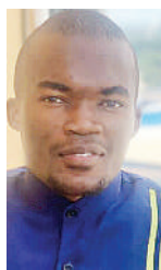
Na Golden Kisapile, Tudarco