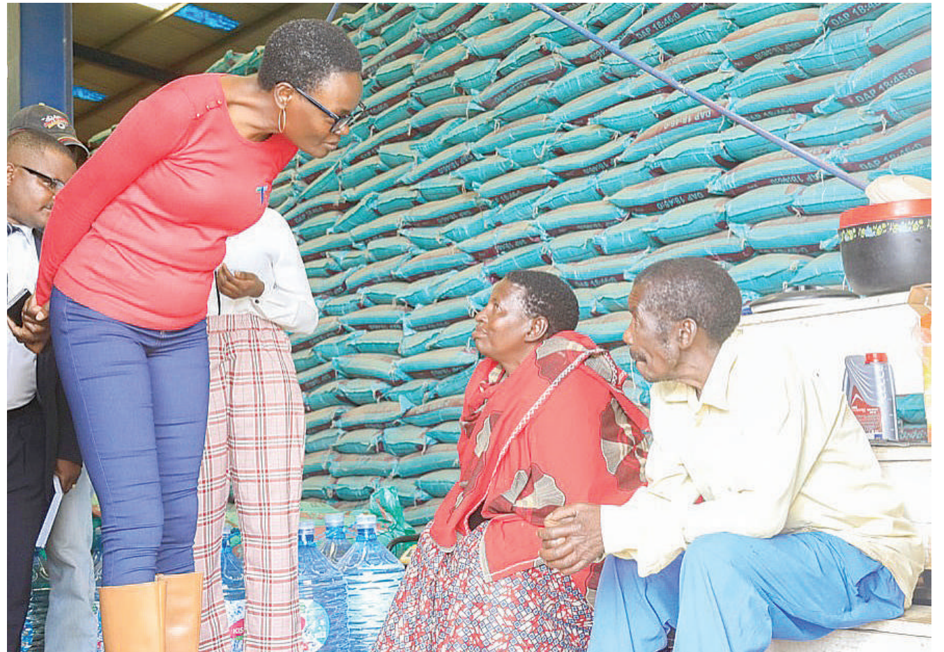
Spika wa Bunge, Dk. Tulia Ackson, akizungumza na baadhi ya wananchi kwenye moja ya maghala ya kusambazia mbolea za ruzuku jijini Mbeya juzi mwishoni mwa wiki.

Hivyo aliwatahadharisha watu wote wanaopanga kufanya matukio ya uhalifu kuacha mara moja kwa maelezo kuwa jeshi hilo limejipanga kuwashughulikia.