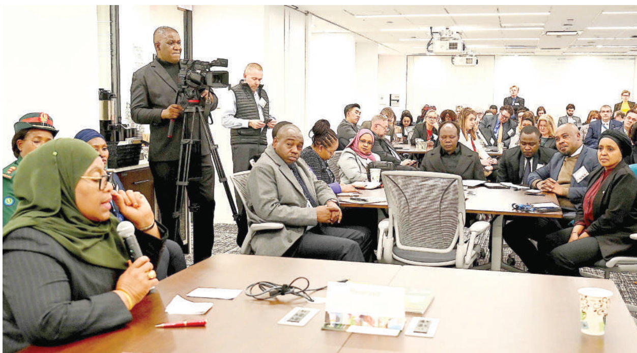
Rais Samia Suluhu Hassan akizungumza na viongozi mbalimbali kuhusu kilimo katika Mkutano wa AGRA uliofanyika Ofisi za Taasisi ya Bill na Melinda Gates, jijini Washington Marekani jana.