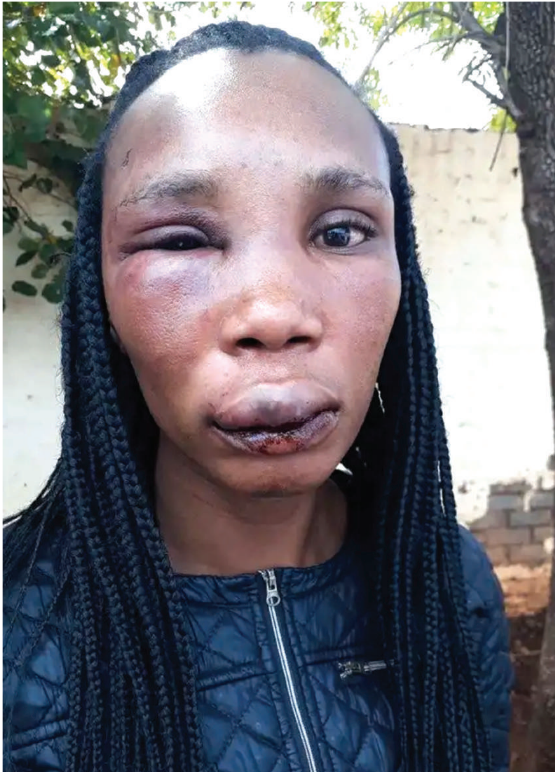
Mateso na ukatili kama vipigo kwa wanawake na wasichana vinaongezeka na kinamama wanajiuliza wakimbilie wapi?.

“Utafiti uliofanywa na Shirika la Afya Duniani (WHO), ulionyesha kuwa asilimia 35 ya mauaji ya wanawake duniani yamefanywa na wenza. Katika kulinganisha utafiti huo ilibainika kuwa ni asilimia tano tu ya mauaji ya wanaume yanayosababishwa na wenza wao,” anasema.