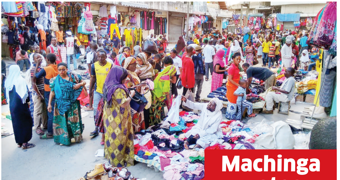
Wafanyabiashara wadogo, maarufu kama machinga, wakiuza bidhaa zao huku Mamlaka ya Mapato Tanzania (TRA) ikiwataka kujisajili na kutoa risiti za kielektroniki (EFD).

Machinga watoa msimamo kauli TRA kulipa kodi, matumizi ya EFD