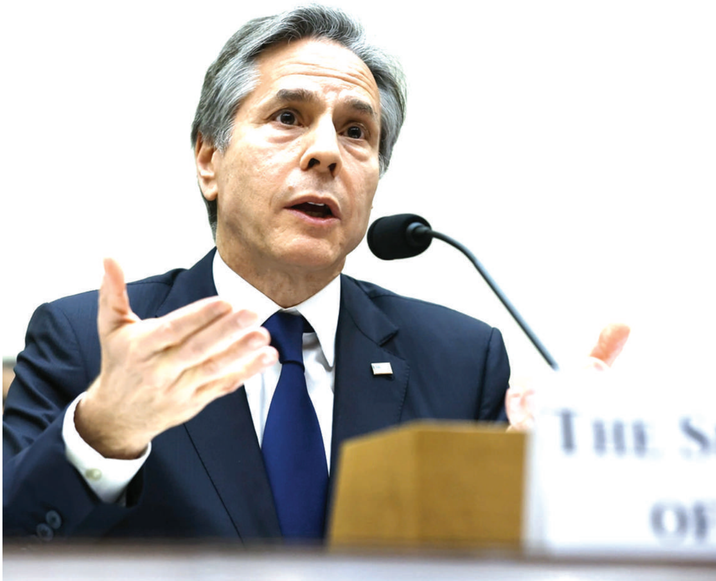
Waziri wa Mambo ya Nje wa Marekani Anthony Blinken, akionyesha msimamo wa kupinga uwepo wa M23 DRC..

• Msemaji wao atubu kuahidi wataacha vita