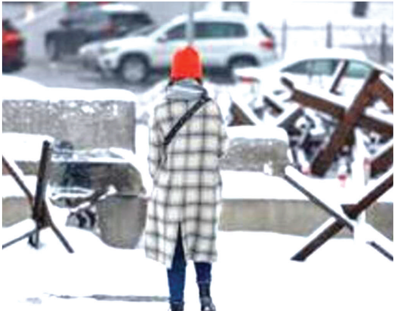
Hali ya ubaridi ilivyokithiri nchini Ukraine.