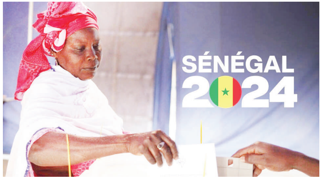
Mwananchi raia wa Senegal akipiga kura katika uchaguzi wa kumchagua rais uliofanyika jana nchini humo.

Uchaguzi huo ulikumbwa na migogoro mingi baada ya awali bunge kupanga kufanyika uchaguzi Desemba 15, mwaka huu, jambo lililokataliwa na Baraza la Katiba, pamoja na kusababisha maandamano yaliyozua taharuki nchini humo. RFI