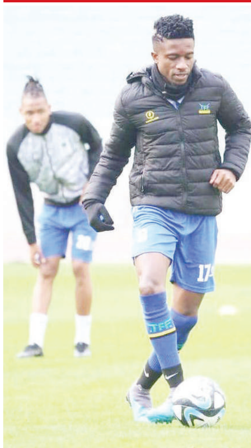
Wachezaji wa Taifa Stars wakiwa mazoezini nchini Azerbaijan jana kujiandaa na mechi ya Fifa Series 2024 dhidi ya Mongolia itakayopigwa leo nchini humo.