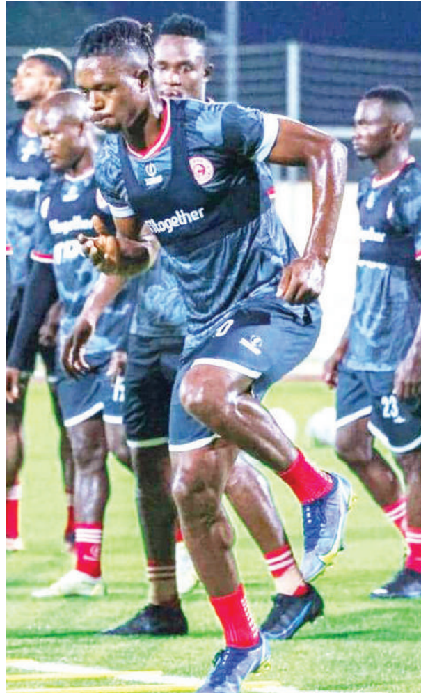
Wachezaji wa Simba (kulia) na wa Yanga (kushoto), wakifanya wakiwa mazoezini. Timu hizo Ijumaa na Jumamosi zitavaana dhidi ya Al Ahly kwa Simba na Mamelodi kwa Yanga mechi zikipigwa Uwanja wa Benjamin Mkapa.