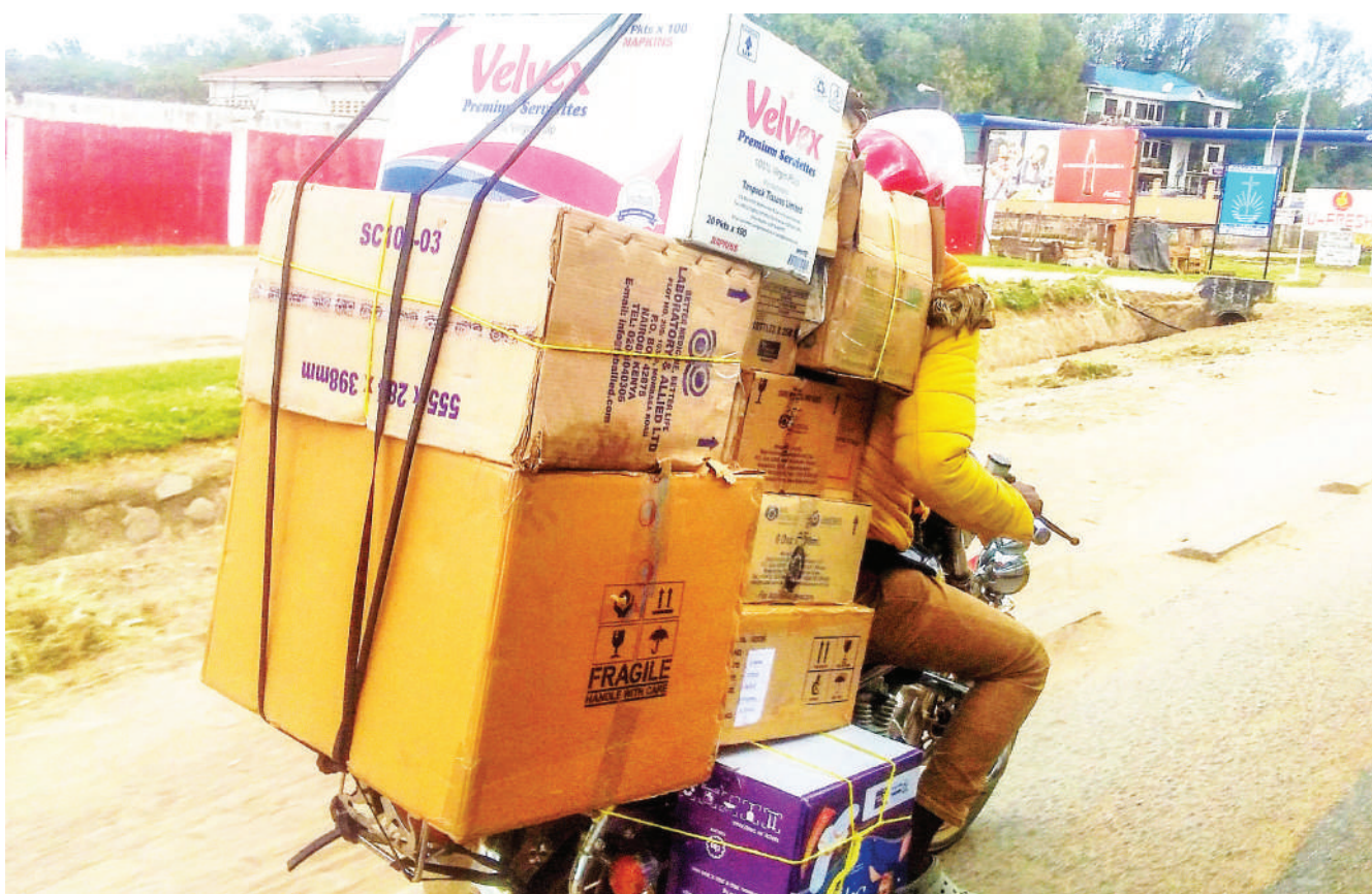
Dereva wa bodaboda, akiwa ameisheheni mzigo mkubwa katika barabara ya Mwanza-Musoma, eneo la Ndama, wilayani Nyamagana jana, kitendo ambacho ni hatari kwa usalama barabarani.