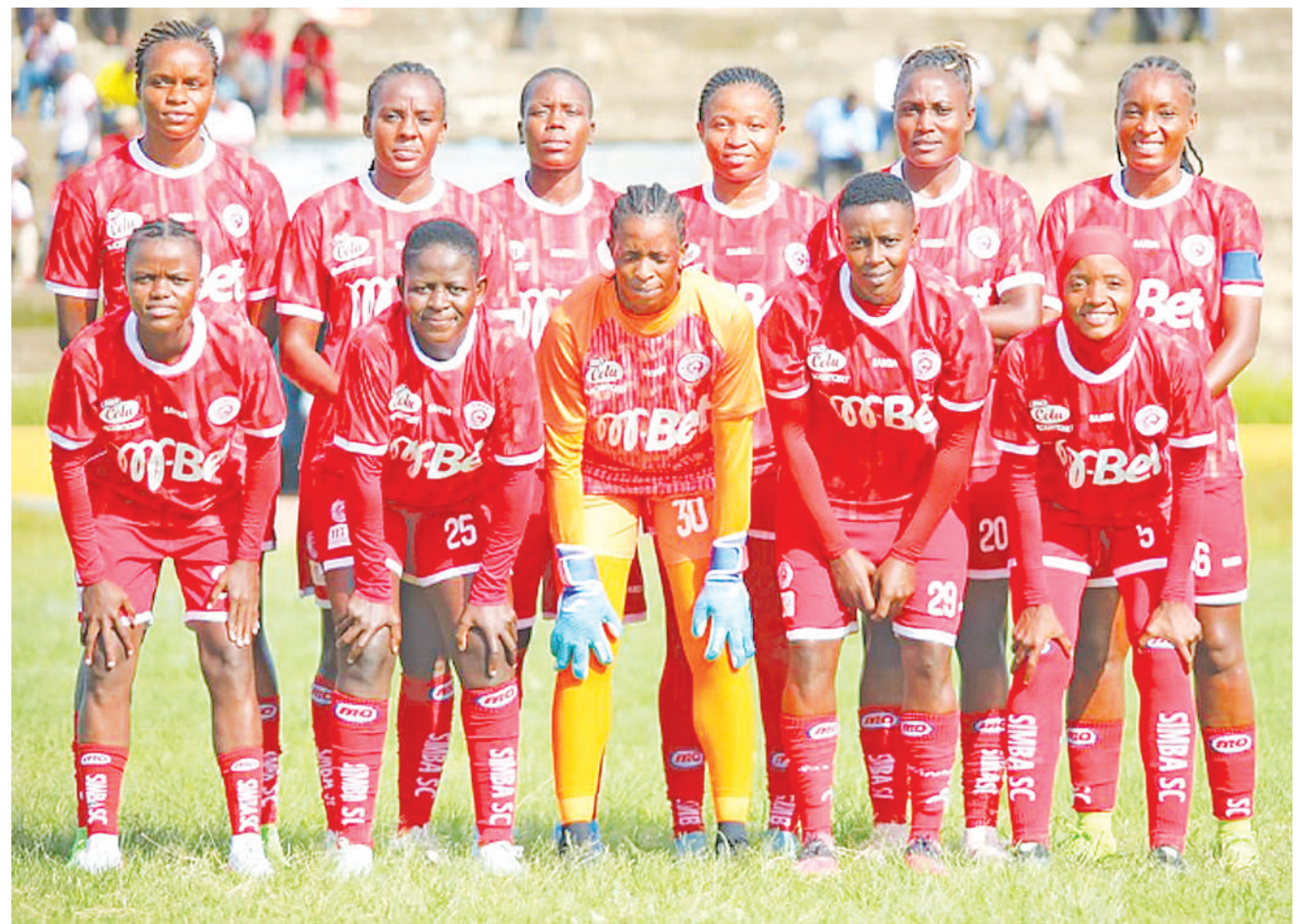
Kikosi cha Simba Queens