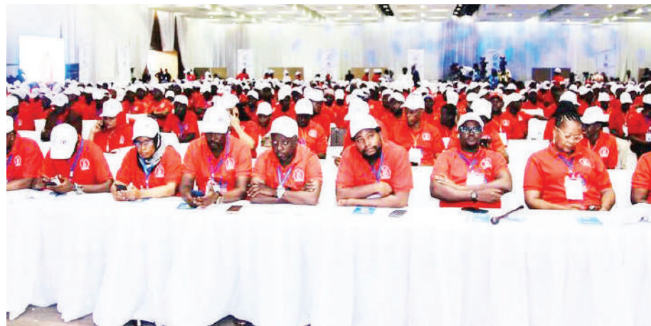
Wajumbe wakiwa kwenye Mkutano Mkuu wa chama hicho, Dar es Salaam jana.

Kwa maoni kuhusu habari hii: Piga/sms / WhatsApp : +255 677 020 701 Email: customerrelations@guardian.co.tz