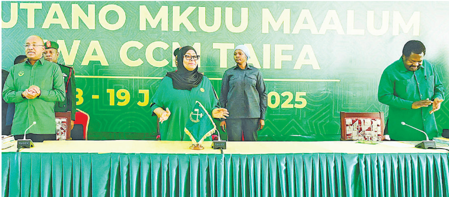
Mwenyekiti wa Chama Cha Mapinduzi (CCM) Taifa, Rais Samia Suluhu Hassan akiongoza Kikao cha Halmashauri Kuu ya CCM Taifa (NEC), jijini Dodoma. Kushoto ni Makamu Mwenyekiti wa CCM Visiwani na Rais wa Zanzibar, Dk. Hussein Ali Mwinyi na kulia ni Katibu Mkuu wa CCM, Balozzi Dk. Emmanuel Nchimbi.