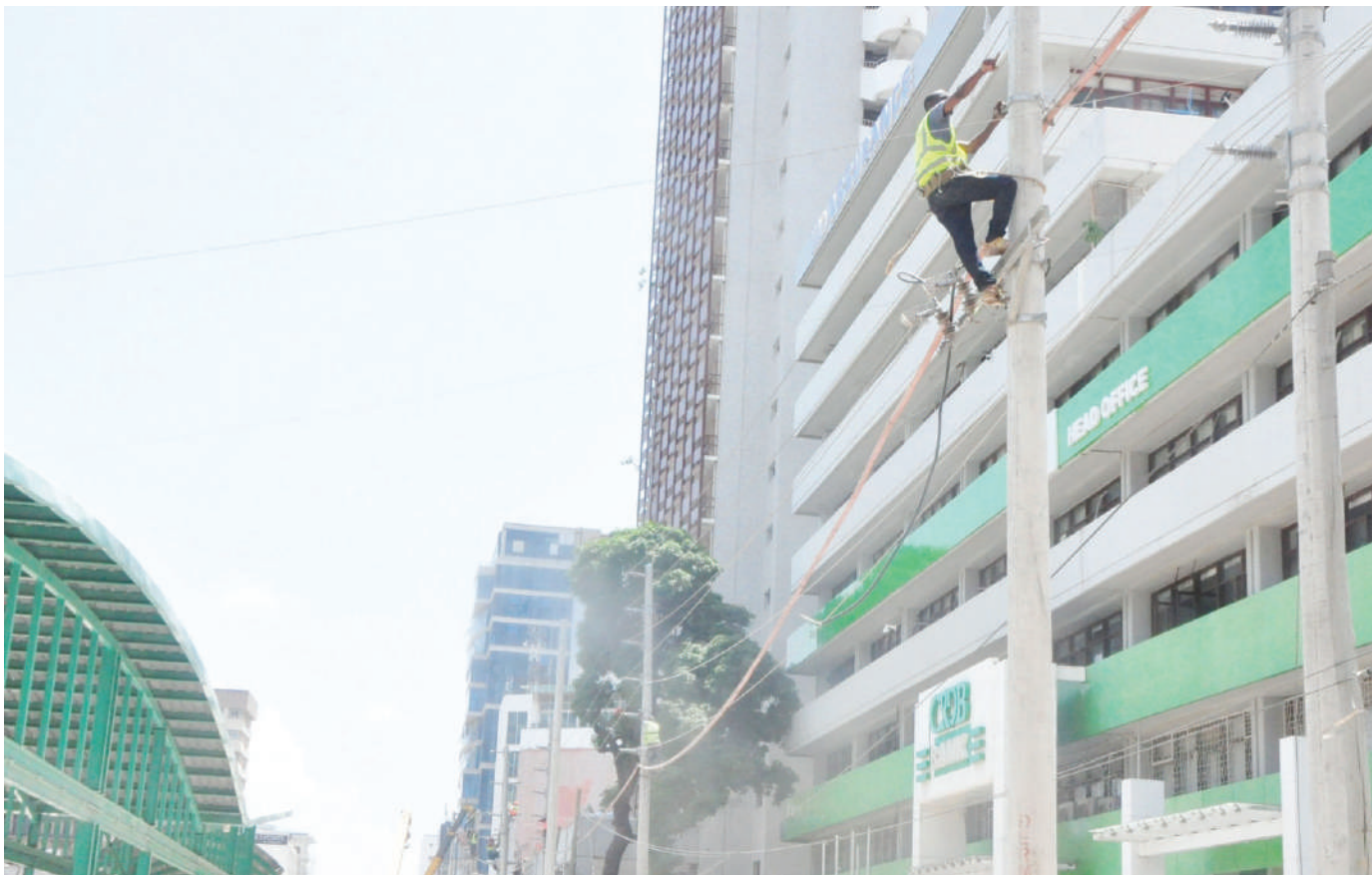
Mafundi wa umeme wakibadilisha nguzo, eneo la Posta Mpya, jijiji Dar es Salaam jana.

Baraza la Taifa la Hifadhi na Usimamizi wa Mazingira (NEMC) litaendelea kuhakikisha kuwa miradi yote chini inatekelezwa kwa kuzingatia Utunzaji na Uhifadhi wa Mazingira kwa manufaa ya kizazi cha sasa na baadaye.