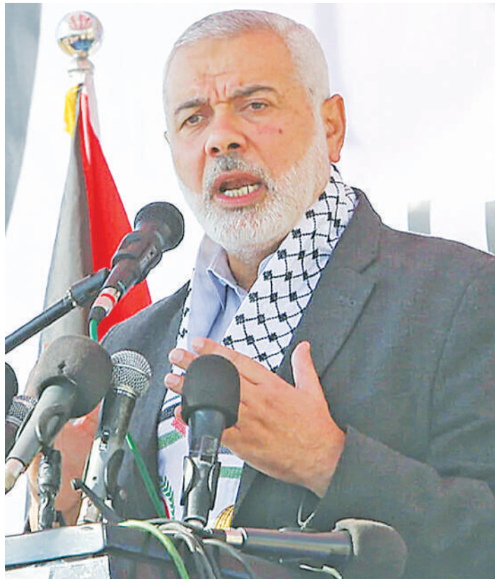
Viongozi wa Hamas, Yahya Sinwar (kushoto) na Ismail Haniyeh waliouliwa na Israel mwaka jana.