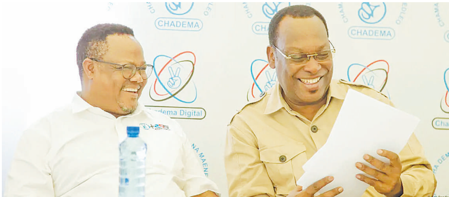
Viongozi wa Chadema, Freeman Mbowe (kulia) na Tundu Lissu.