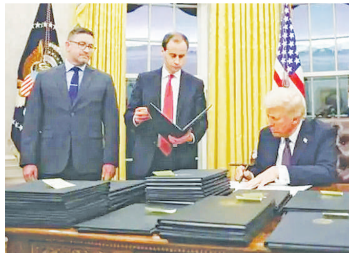
Rais wa Marekani, Donald Trump, akitia saina mikataba mbalimbali baada ya kuapishwa.

kani itaanza tena uchimbaji wa mafuta na gesi baada ya hatua hiyo kusitishwa na rais aliyeyondoka mamlakani Joe Biden.