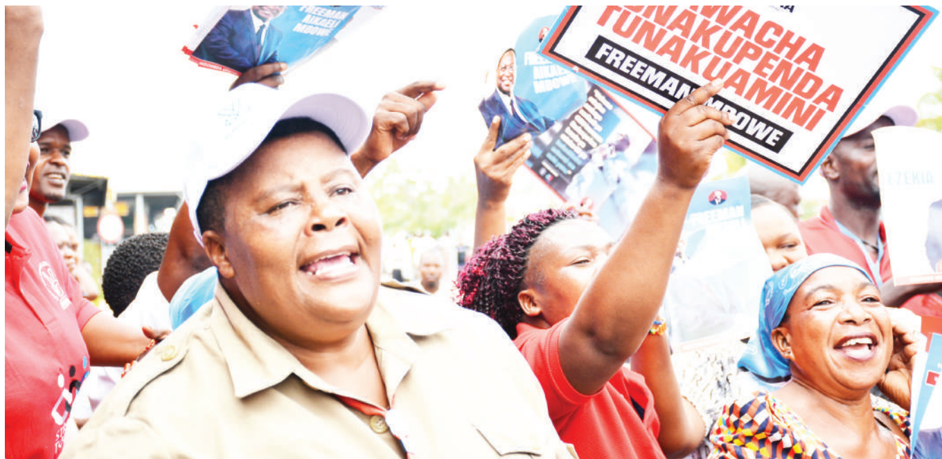
Baadhi ya wanachama wa CHADEMA, wakiwa na mabango ya kuwapigia kampeni wagombea wao, nje ya Mkutano Mkuu wa chama hicho, Dar es Salaam jana.

Katika uendeshaji Bahati Nasibu ya Taifa, zaidi ya Dola za Marekani milioni 3.5 zimetengwa kwa ajili ya masoko na matangazo katika vyombo vya habari, ikijumuisha fursa za kipekee za maudhui.