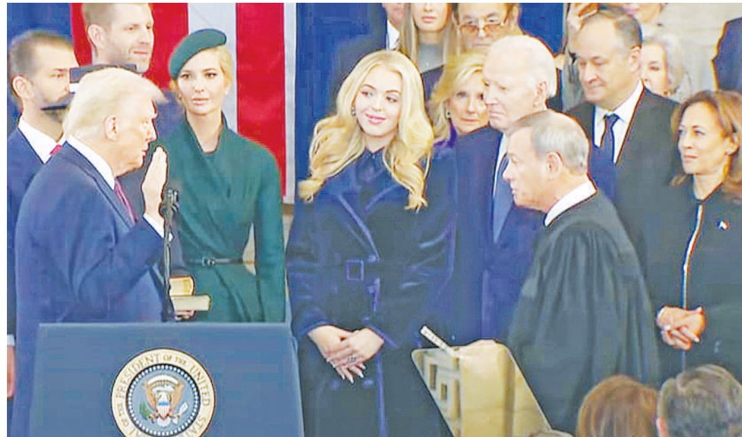
Rais wa Marekani, Donald Trump, akila kiapo mbele ya Jaji Mkuu, John Roberts.

Katika hatua nyingine, Rais Trump alisema kwamba Mare-