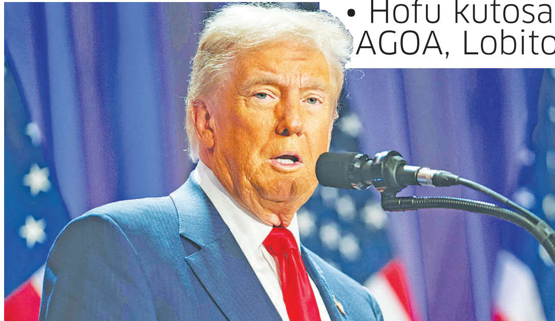
Rais Trump wa Marekani.

mtazamo wa kulinda zaidi maslahi ya nchi yake, usio wa kawaida kuliko Biden moja ya kauli mbiu za muhula wake wa kwanza ili-kuwa "Amerika Kwanza".