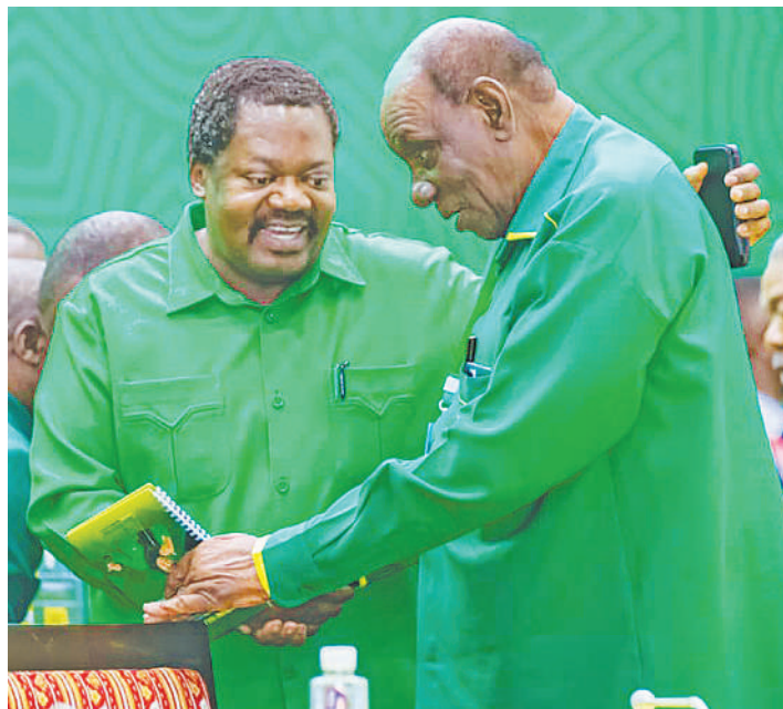
Makamu Mwenyekiti wa CCM Bara, Stephen Wasira (kulia), akipokea Ilani ya Uchaguzi ya CCM kutoka kwa Katibu Mkuu wa chama hicho, Balozzi Dk. Emmanuel Nchimbi.

Kabla ya kuwa Katibu Mtendaji wa TANU wa wilaya, nilianza kazi katika Idara ya Maendeleo ya Jamii wilayani Ukerewe mkoani Mwanza kwenye Kijiji cha Mriti.