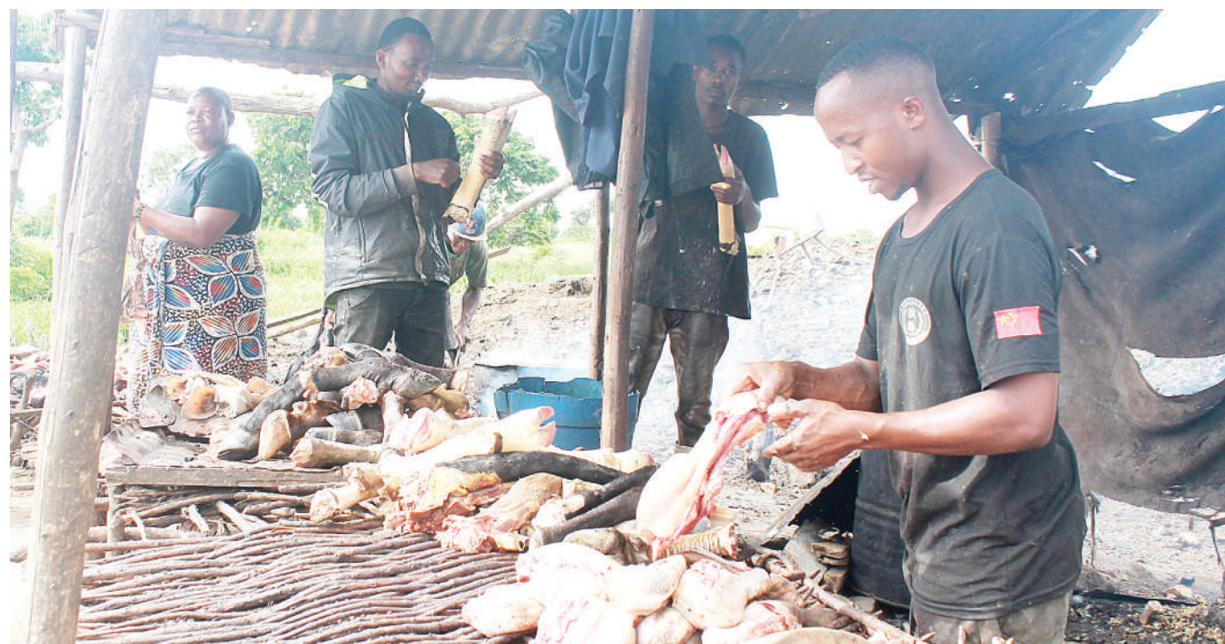
Wafanyabiashara wa makongoro, ulimi, mikia na vichwa vya ng'ombe wakiandaa bidhaa zao, wakati wakisubiri wateja katika soko la Mbuyuni, Kata ya Kizota, jijini Dodoma jana.