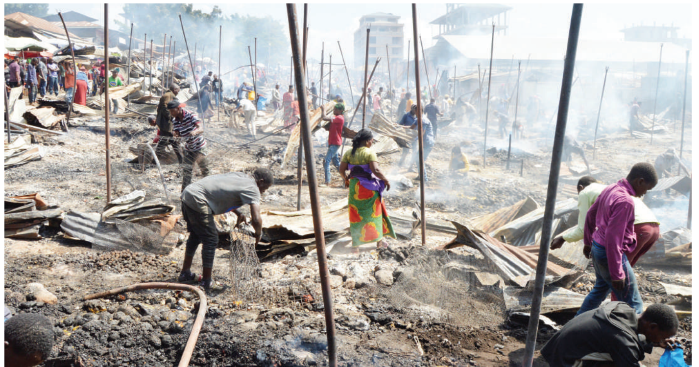
Baadhi ya wafanyabiashara wakikusanya baadhi ya mabaki ya vitu baada ya Soko Kuu la Mbuyuni kuteketea kwa moto katika Manispaa ya Moshi, mkoani Kilimanjaro usiku wa kuamkia jana na kuteketeza vibanda 2000.