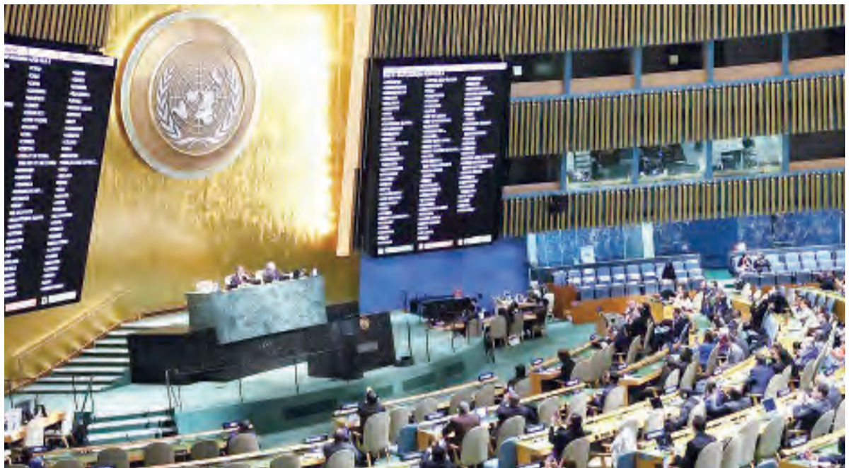
Mkutano wa Baraza Kuu la Umoja wa Mataifa (UN), ukiendelea New York nchini Marekani. PICHA: MTANDAO

Ilibainishwa kuwa katika kipindi cha wiki nzima wakati mikutano inapoendelea, waan- damanaji walikusanyika kwenye eneo hilo la mkutano lililowekewa vizuizi kupaza sauti zao kuhusu dhuluma katika nchi zao. VOA/DW