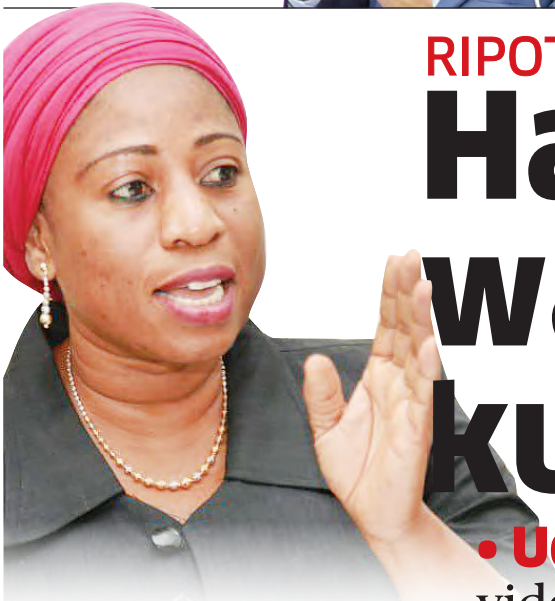
Waziri wa Afya, Umy Mwalimu

Dhamira ya Samia kuvutia uwekezaji yaundiwa mkakati