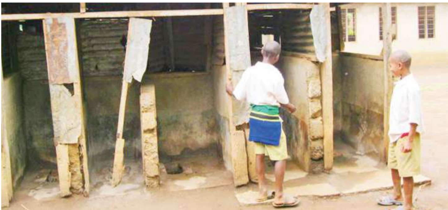
Vyoo vya umma vinavyoonekana ambavyo ni moja ya vyanzo vya kichocho. Picha ndogo; mgonjwa wa utapiamlo akipatiwa matibabu.