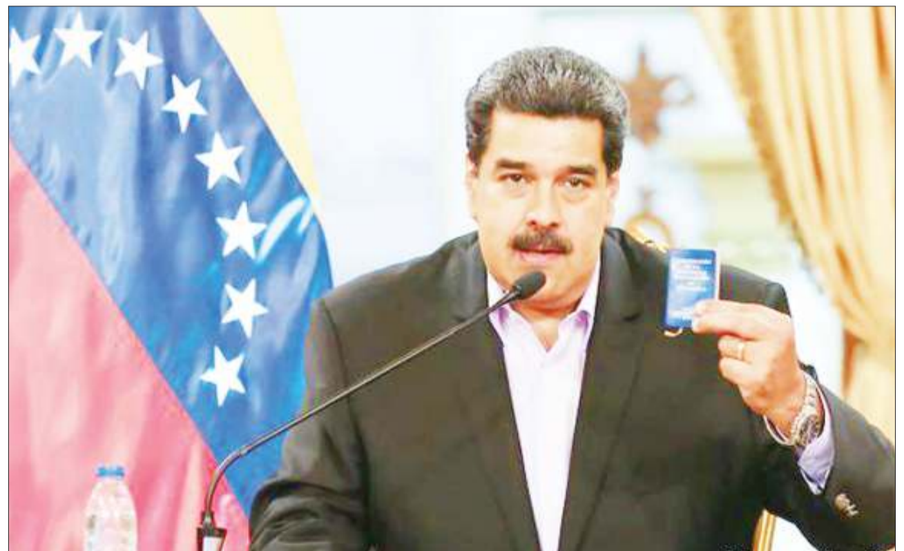
Rais wa Venezuela, Nicolas Maduro, ambaye kwa sasa amekataa kuitisha uchaguzi nchini humo. PICHA: REUTERS

Kwa upande wa serikali ya Zimbabwe, unaushtumu upinzani kuandaa maandamano hayo na kuchochea vurugu. RFI