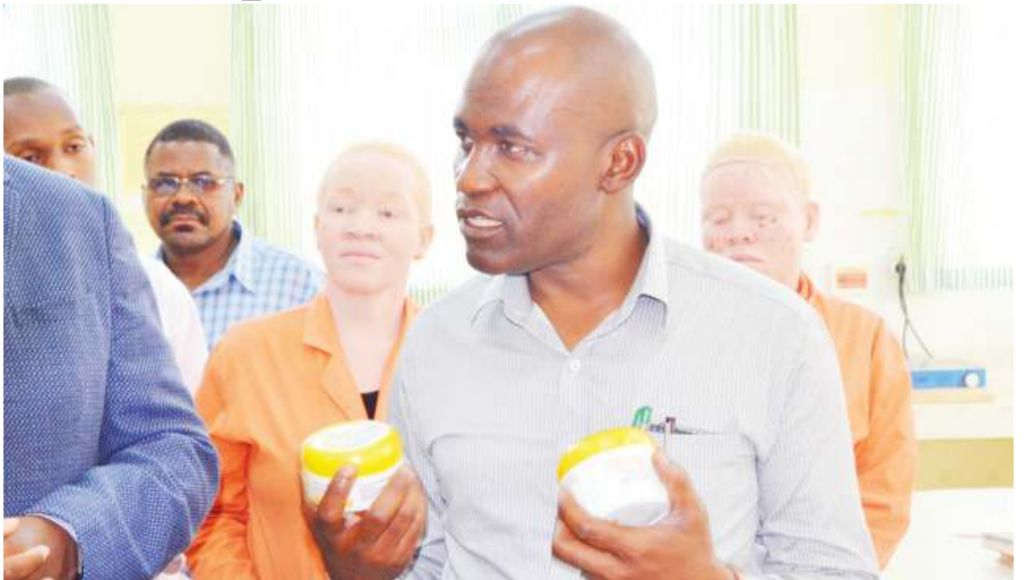
Naibu Waziri wa Afya, Maendeleo ya Jamii, Jinsia, Wazee na Watoto, Dk. Faustine Ndugulile, akikagua dawa za ngozi, zinazotengenezwa hospitalini KCMC, Moshi.