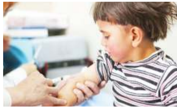
Mtoto akipatiwa chanjo. PICHA: MTANDAO.

Inaelezwa kuwapo athari chache za chanjo kama vile kuchoka na kuumwa kichwa.