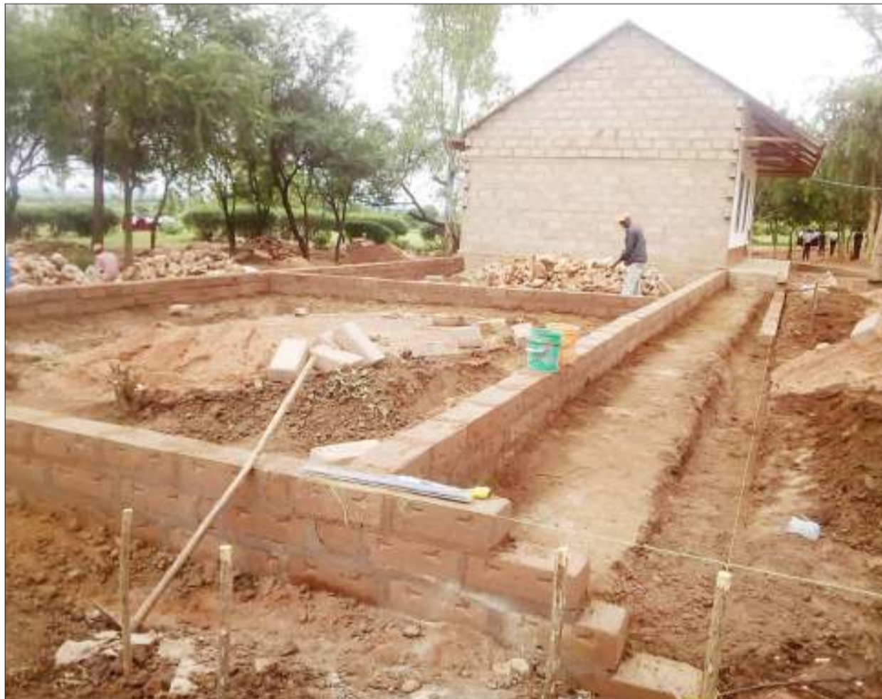
Madarasa mapya kwa ajili ya wanafunzi wa kidato cha kwanza katika Shule za Sekondari za Kata, Jimbo la Musesa Viji-jini mkoani Mara, yanaendelea kujengwa ili kuhakikisha wanaanza masomo haraka iwezekanavyo. Huu ni msingi wa moja ya madarasa yanayojengwa katika Shule ya Sekondari Nyambono.