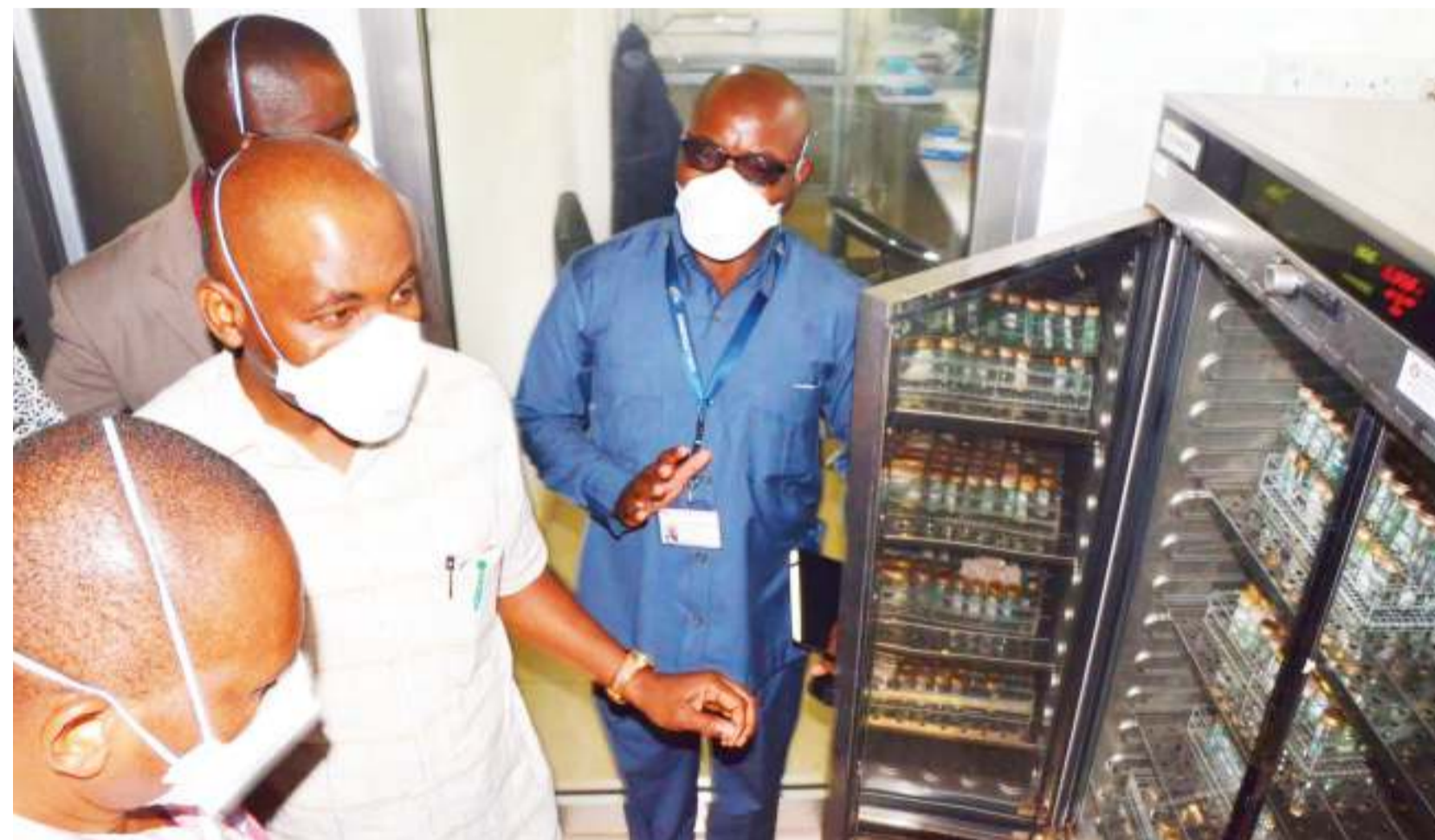
Naibu Waziri wa Afya, Maendeleo ya Jamii, Jinsia, Wazee na Watoto, Dk. Faustine Ndugulile, akikagua huduma za hospitali ya Kibong'oto iliyoopo wilayani Hai. Katika picha nyingine, akizungumza na watumishi wa hospitali hiyo.