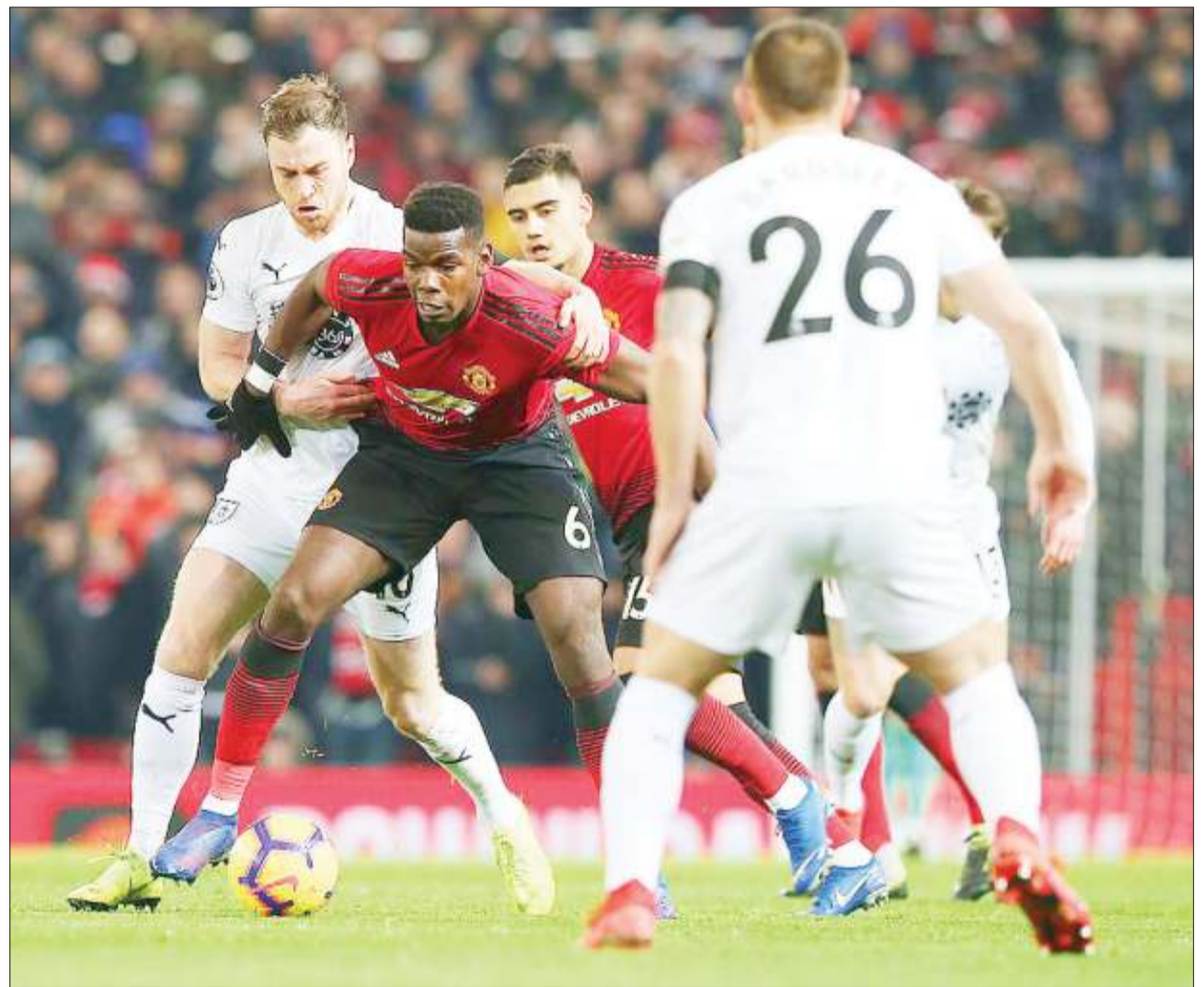
Kiungo wa Manchester United, Paul Pogba, akipambana kumiliki mpira dhidi ya wachezaji wa Burnley kwenye mechi ya Ligi Kuu England iliyopigwa katika Uwanja wa Old Trafford juzi na kumalizika kwa sare ya mabao 2-2.

Mechi nyingine ya kundi hilo kati ya AS Vita ya Jamhuri ya Kidemokrasia ya Kongo dhidi ya JS Saoura ya Algeria pia itachezwa kuanzia saa 1:00 usiku mjini Kinshasa.