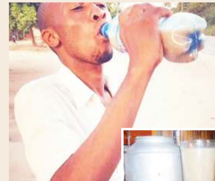
Kijana akipata kinywaji cha togwa.

Pia, kuna suala la ute-shaji wa mbegu, ili kukipata kimea hicho, ni jambo