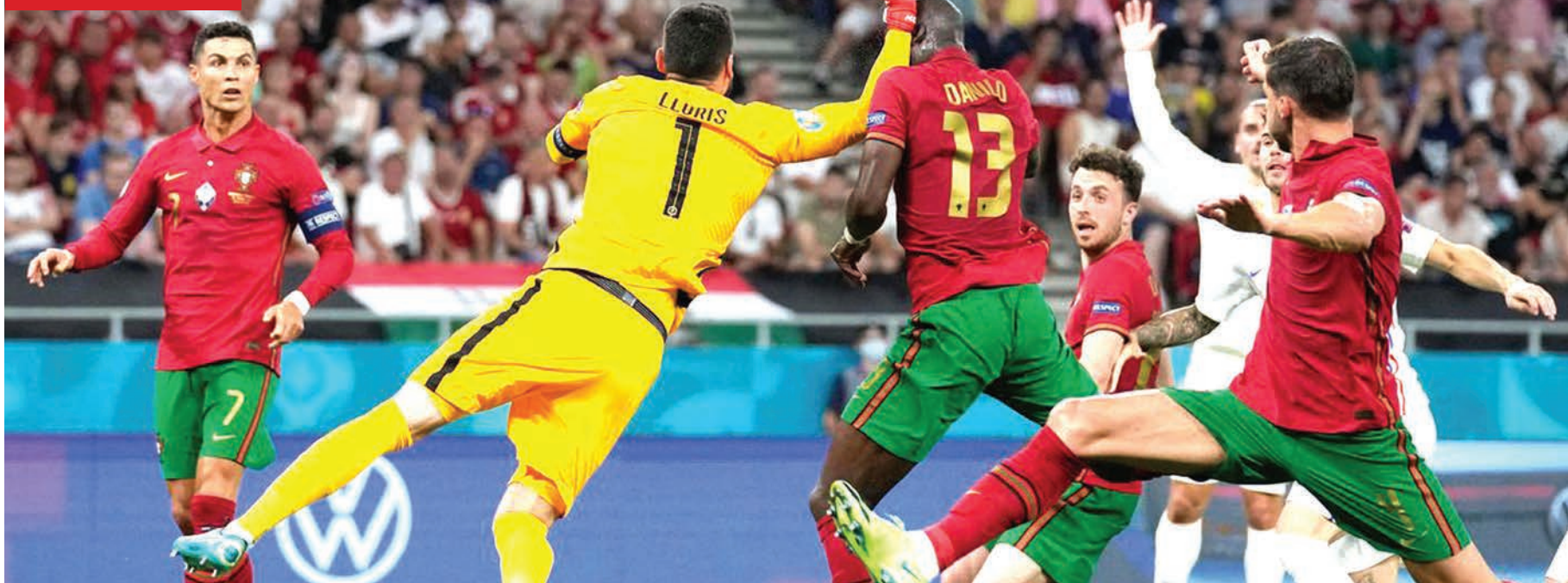
Kipa wa Ufaransa, Hugo Lloris, akiokoa 'mchomo' wa mshambuliaji wa Ureno, Cristiano Ronaldo (kushoto), wakati timu hizo zikitoka sare ya mabao 2-2 kwenye mechi ya Kundi F ya michuano ya Euro 2020 iliyopigwa Uwanja wa Ferenc Puskas jijini Budapest, Hungary juzi.