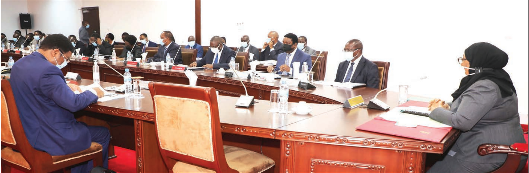
Rais Samia Suluhu Hassan, akiongoza kikao cha Baraza la Mawaziri Ikulu ya Chamwino, mkoani Dodoma jana.

SERIKALI yakiri kuandika barua kuomba chanjo... Endelea Ukurasa wa 2