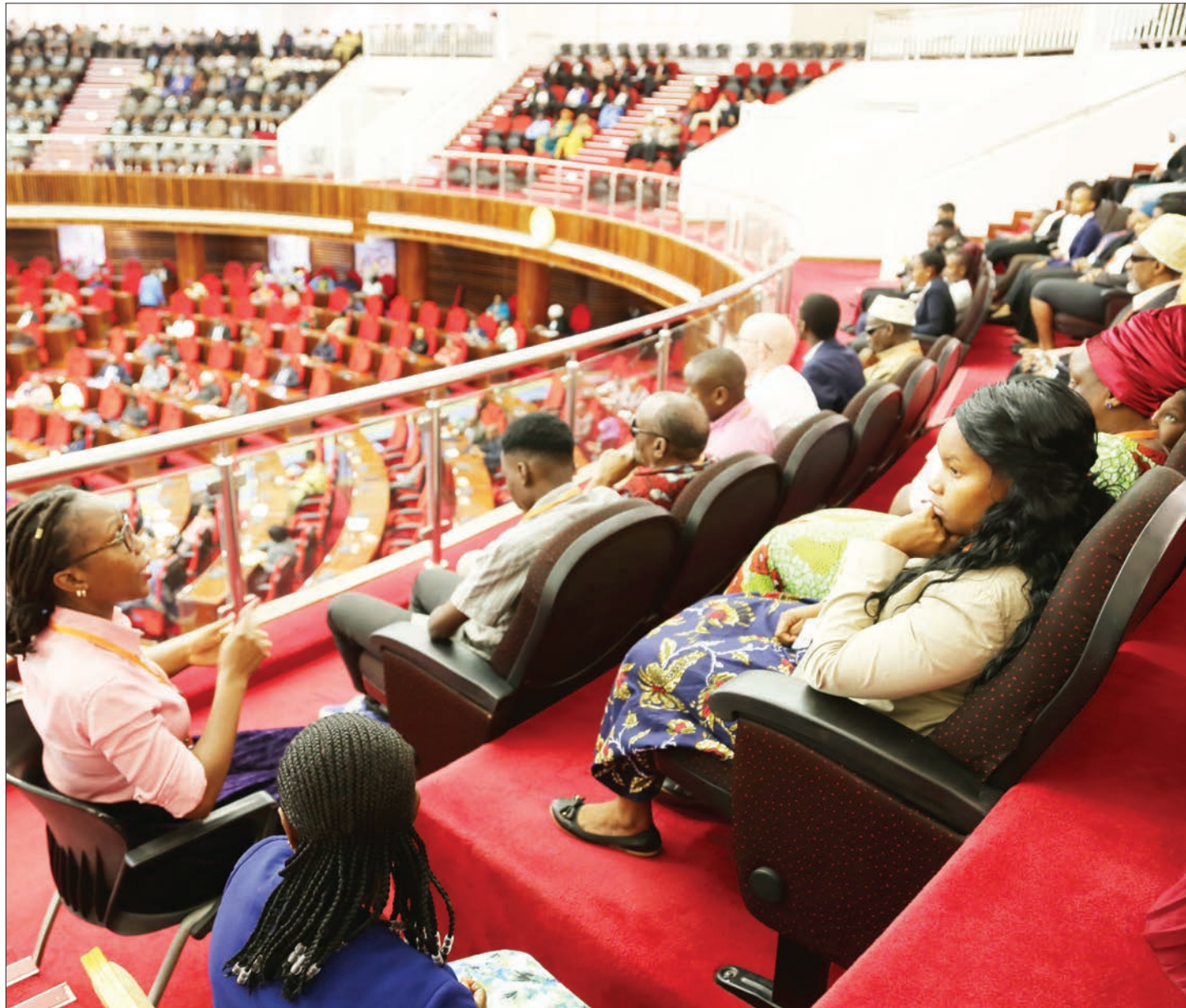
Mkalimani wa lugha za alama (kushoto), akiwatafsiria baadhi ya wenye ulemavu wa kusikia (viziwi), waliotembelea Bungeni, jijini Dodoma jana, kujifunza shughuli za bunge.

"Nimhakikishie mbunge kuwa barabara hii itaendelea kujengwa kadri ya upatikanaji wa fedha. Kwa hiyo haijafutwa na hakuna mpango wa kuifuta," alisema.