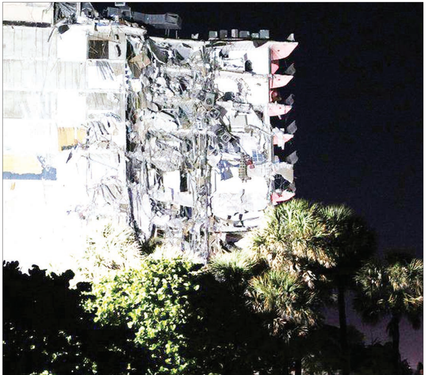
Uokoaji ukiendelea baada ya jengo lenye makazi ya watu, kuporomoka jana, jimbo la Miami-Dade, jijini Florida, nchini Marekani na kuua mtu mmoja. Haikufahamika mara moja idadi ya watu waliokuwamo ndani wakati jengo hilo likiporomoka. PICHA: BBC

zi unaendelea. Haijabainika ikiwa ni wauguzi wa kienyeji kutoka jamii ya eneo hilo. Baadhi ya Wanigeria hasa kutoka maeneo ya mashambani, wanategemea tiba za kienyeji kutokana na ukosefu wa kujua kusoma na kuandika, imani ya kitamaduni na umasikini. Mfumo wa afya wa nchi hiyo pia unakabiliwa na changamoto kadhaa. BBC