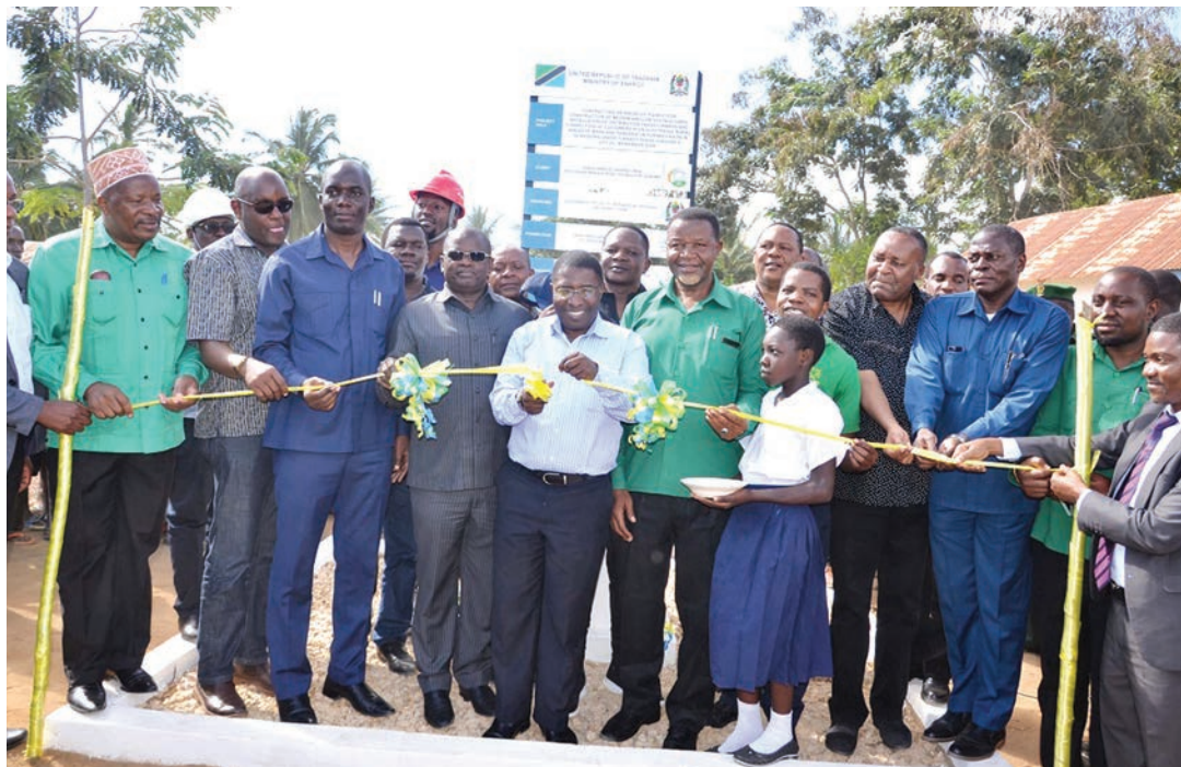
Waziri wa Nishati Dk. Medard Kalemani (katikati), akikata utepe kuashiria kuzindua rasmi Mradi wa Kusambaza Umeme Vijijini Awamu ya Tatu Mzunguko wa Pili katika Mkoa wa Mtwara. Uzinduzi huo ulifanyika katika kijiji cha Namtumbuka, Mtwara Vijijini, Juni 19, 2021.