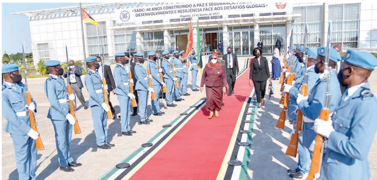
Rais Samia Suluhu Hassan akiondoka katika Uwanja wa Ndege wa Kimataifa wa Maputo, nchini Msumbiji juzi, baada ya kushiriki Mkutano wa Dharura wa Wakuu wa Nchi na Serikali wa Jumuiya ya Maendeleo Kusini mwa Afrika (SADC).

amke, ikibeba historia ya kipekee tangu uhuru wa nchi mwaka 1961 na tayari ameshafanya mengi kuimarisha umoja na misingi ya uwajibikaji kitaifa.