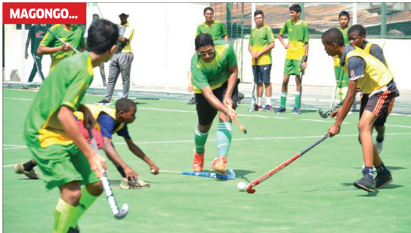
Wanafunzi wa Al-Madrasa Tus Saifen ya Upanga jijini Dar es Salaam (jezi za njano na kijani), wakiwania mpira na wanafunzi wa Sekondari ya Buza jana katika mchezo wa mpira wa magongo kwenye Michuano ya Likizo Cup inayofanyika katika viwanja vya Jakaya Kikwete na kudhaminiwa na T.H.A Tanzania Hockey Association.

"Tunakusudia kuwa na mazoezi ya mapema pale tu ZFF kupitia kamati yake ya mashindano pamoja na Bodi ya Ligi itakapotoa kalenda yake ya ligi kwa msimu mpya wa 2021/22, ili tufanye vizuri lazima tuwe na maandalizi ya mapema," alisema.