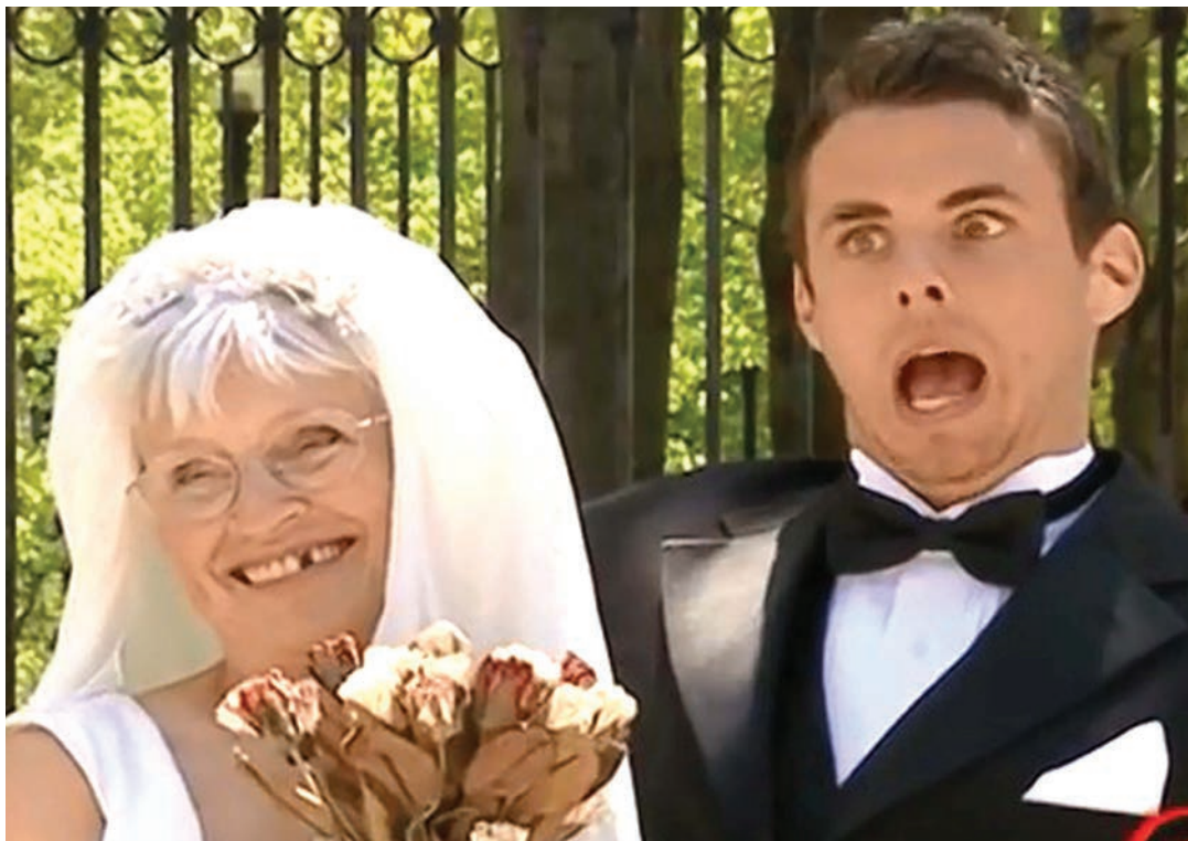
Namna zilivyo ndoa za umri tofauti.

Hapo ndipo dhana ya maisha rahisi kupitia kulelewa na kinamama inapozaliwa. Anasema, ingawaje jambo geni katika jamii