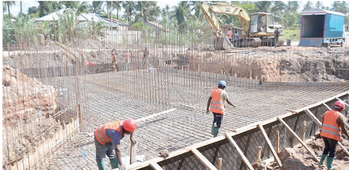
Mafundi wa kampuni ya ujenzi ya Maski and Sons Ltd, wakien-delea na ujenzi wa daraja katika eneo la Kitunda, jijini Dar es Salaam jana.

Pia alisema wamefanya ujenzi wa miundombinu ya elimu katika shule za msingi na sekondari na shule mbili za wenye ulemavu kwa kuwajengea madarasa.