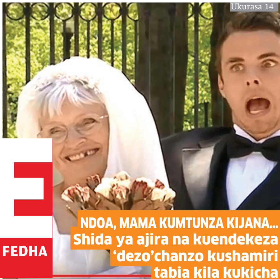
NDOA, MAMA KUMTUNZA KIJANA... Shida ya ajira na kuendekeza 'dezo' chanzo kushamiri tabia kila kukicha