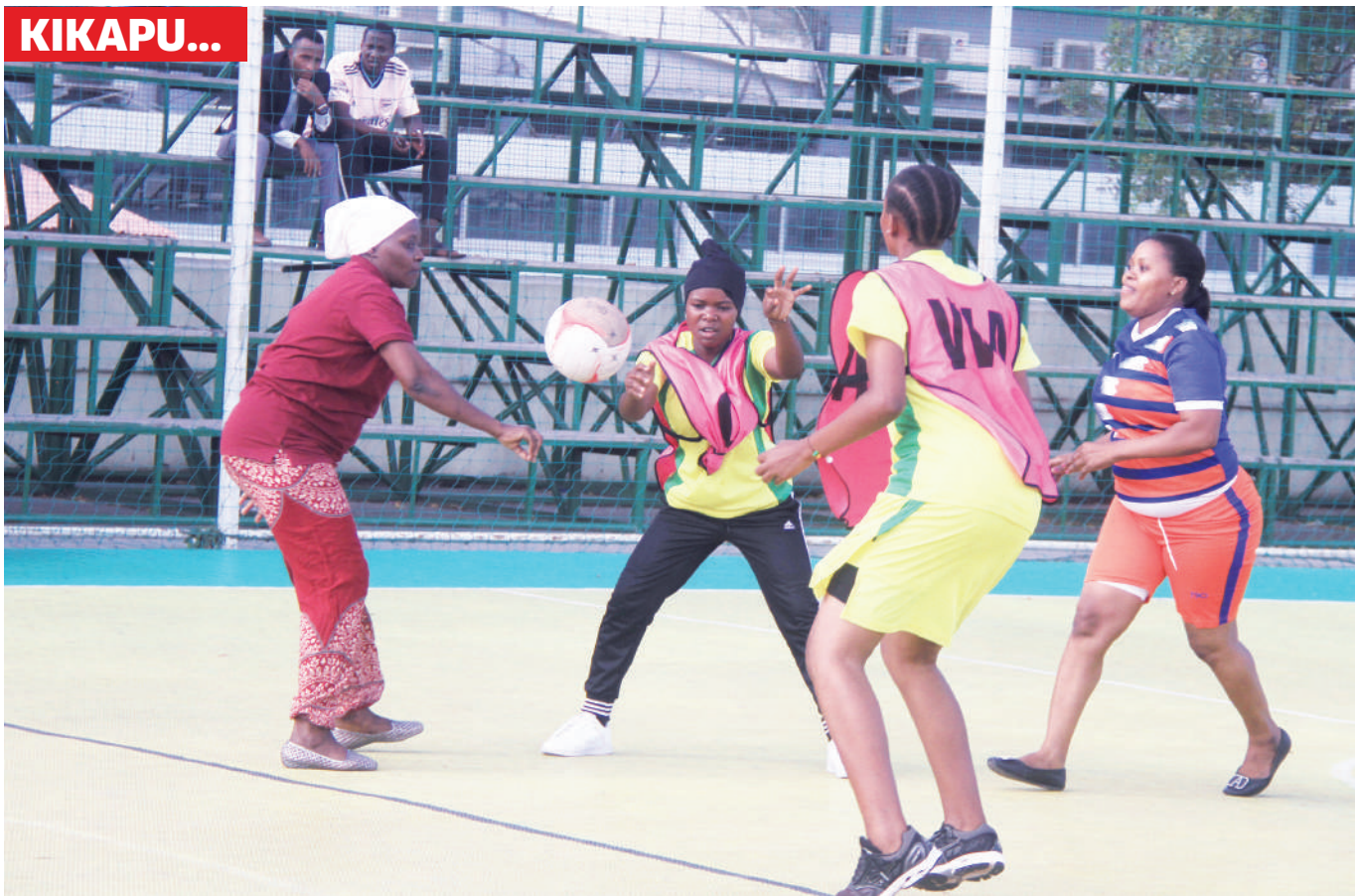
Timu ya Wafanyakazi wa Mohamed Enterprises ya Mpira wa Kikapu, wakifanya mazoezi katika viwanja vya Jakaya Kikwete jijini Dar es Salaam hivi karibuni.