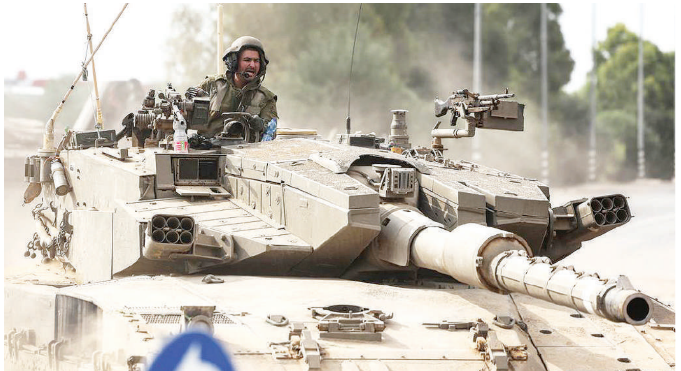
Mwanajeshi wa Israel akiendesha kifarua katika eneo la mpaka wa Gaza kusini mwa Israel, ikiwa ni juhudi za kuimarisha ulinzi katika eneo hilo, jana.