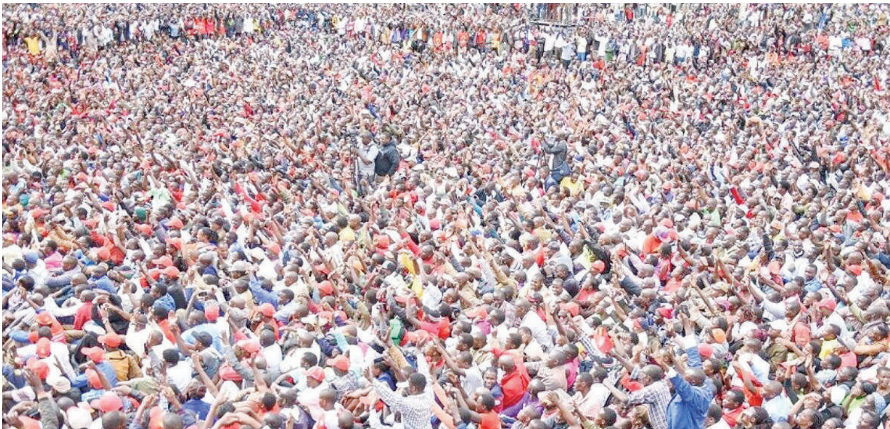
Baadhi ya wananchi wakifuatilia mikutano ya kisiasa.