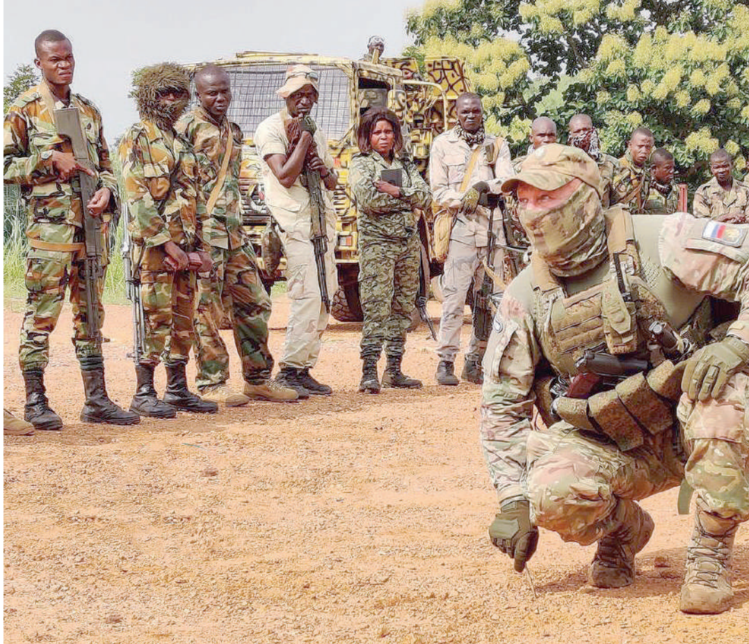
Mmoja wa kamanda wa Wagner akitoa maelekezo kwa wanajeshi katika moja ya nchi za Afrika

Idara ya ulinzi wa anga inasema imeziharibu ndege 11