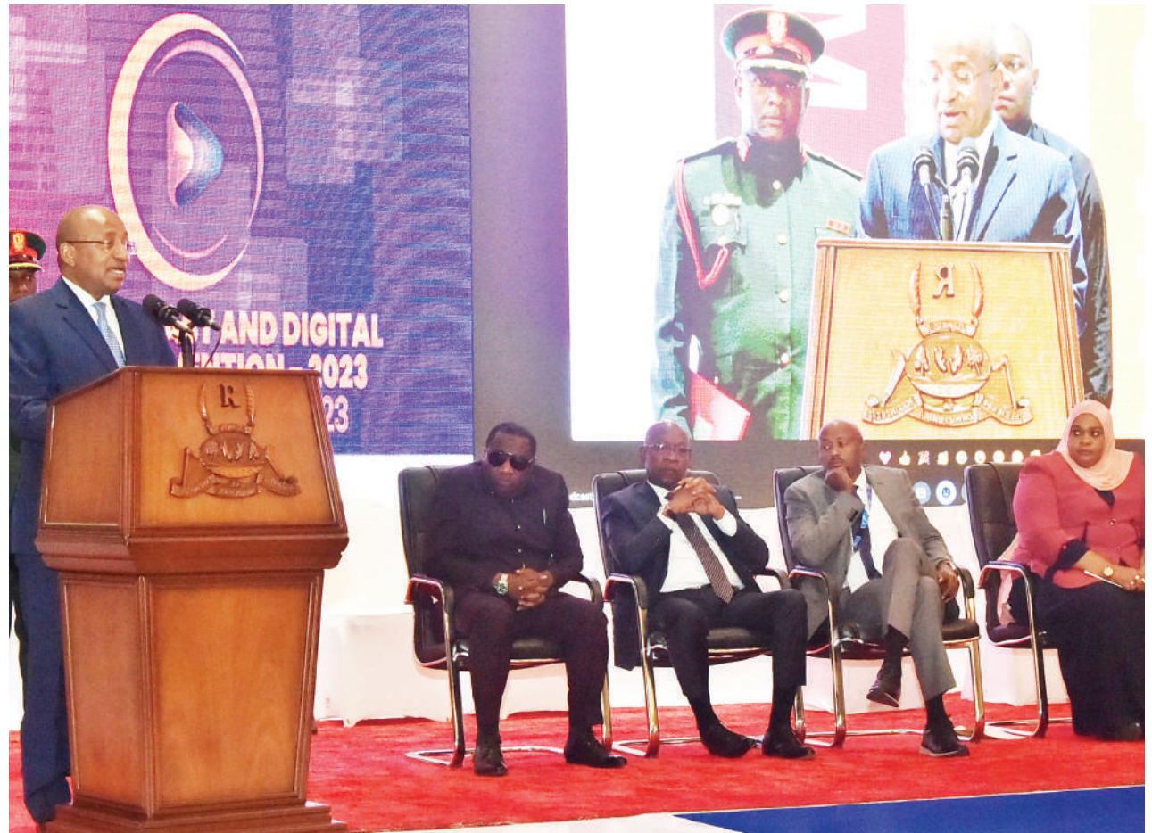
Rais wa Zanzibar, Dk. Hussein Ali Mwinyi, akizungumza wakati akifungua Mkutano Mkuu wa 30 wa Vyombo vya Utangazaji vya Umma Kusini mwa Afrika (SABA), Kiembesamaki, Mkoa wa Mjini Magharibi jana.

“Hata hivyo bado kwa upande wa malezi ya kwenye familia na wazazi pia imekuwa ikichangia kusababisha ugonjwa huo kutokana na walio wengi kujihusisha kwenye matumizi ya dawa za kulevya, unywaji wa pombe za kupindukia,” alisema.