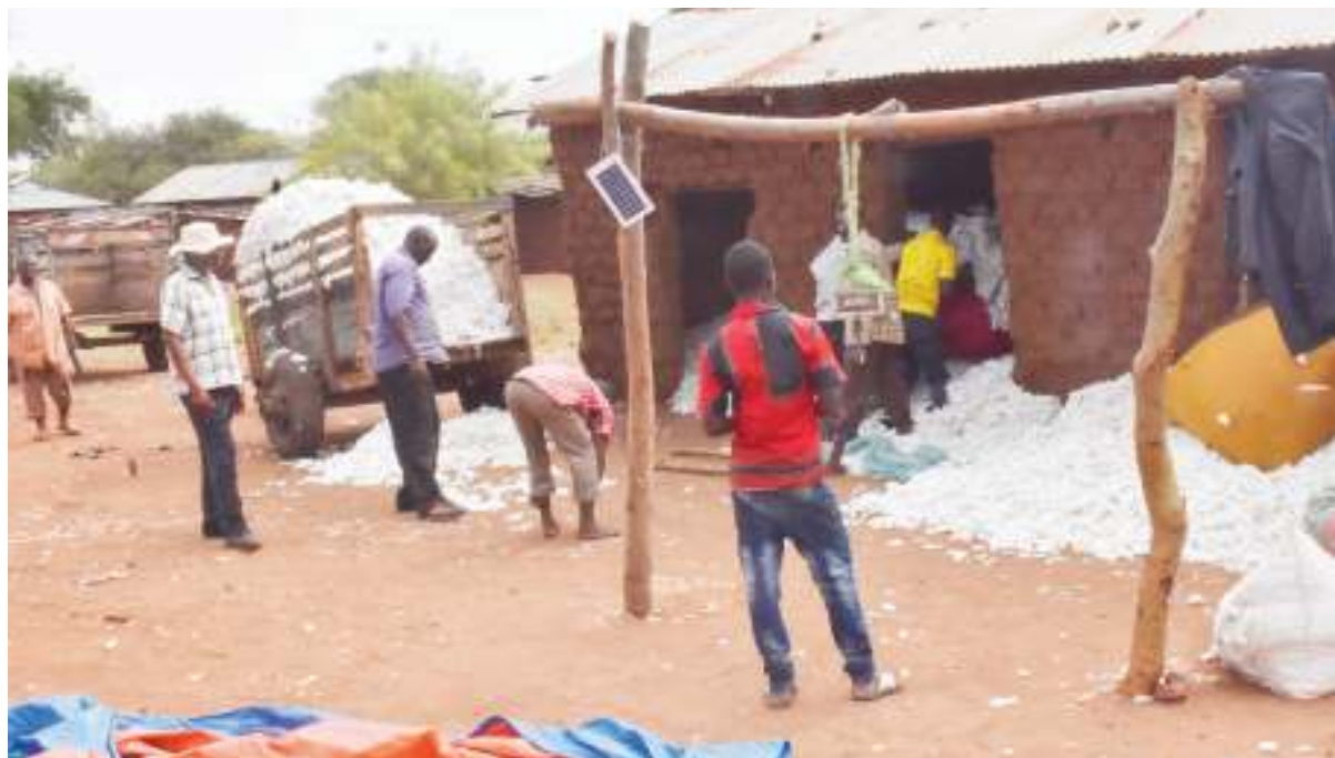
Wakulima wakipima pamba yao katika kituo cha kukusanyia pamba kijiji cha Gibeshi, wilayani Bariadi.

“Halmashauri inaweza isifikie malengo kutokana na pamba nyingi kutonunuliwa, kwani nyingi bado iko nyumbani. Tunaweza tusifikie malengo na kuifanya halmashauri yetu kuyumba.”