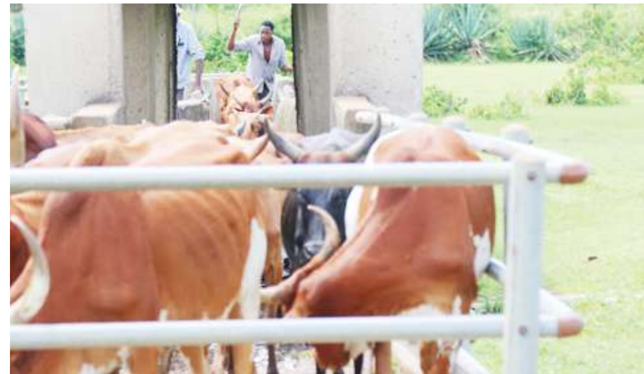
Mfugaji wilayani Misungwi, akiwaingiza ng'ombe wake kwenye josho kuwaoghesha dawa za kuua wadudu. Ni kati ya majosho yaliyofufuliwa kwa ufadhili wa mradi wa Dalberg 3D unaotekelezwa katika halmashauri nane za mkoa wa Mwanza.

Tulitumia mbinu shirikishi za kutatua mata-tizo huku tukijifunza kutokana na changamoto tulizokutana nazo katika utekelezaji.