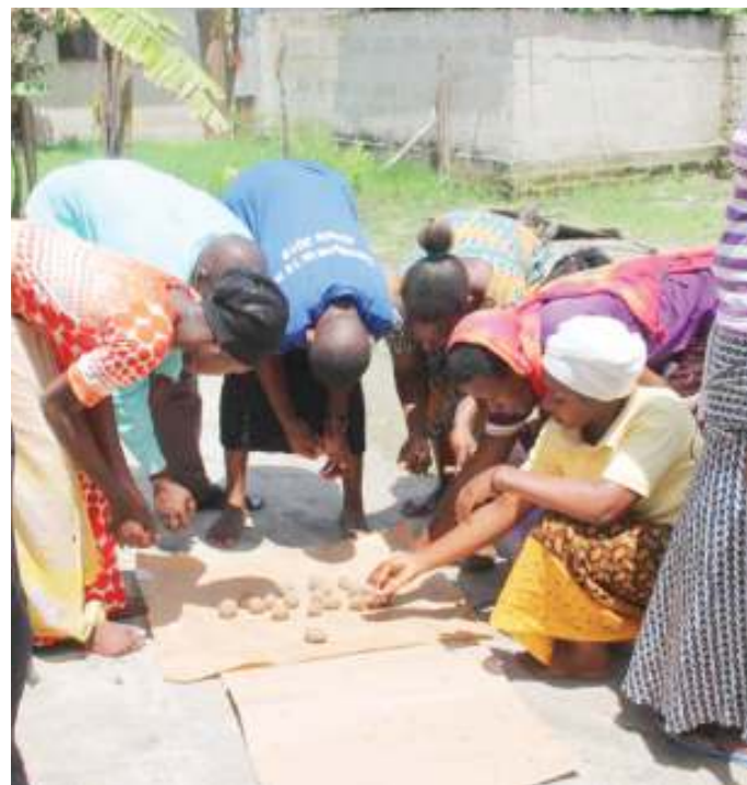
Washiriki wakiangalia mkaa ambao wamefanikiwa kuutengeneza.