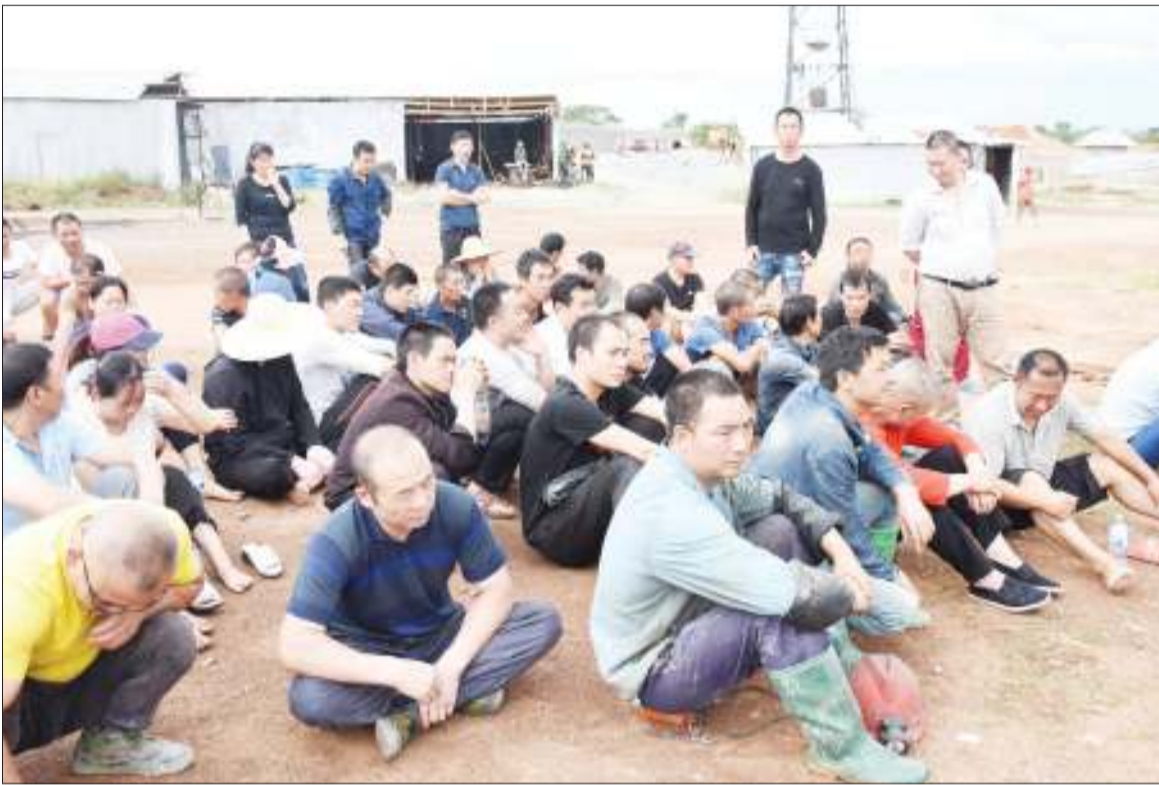
Baadhi ya raia 87 wa Kichina waliokamatwa katika mgodi wa dhahabu wa Eagle Bland Investment uliopo katika eneo la Nyamahuna, kijiji cha Magenge, Kata ya Magenge, wilayani Geita, mkoani Geita wakifanya kazi bila kibali, wakiwa chini ya ulinzi jana.