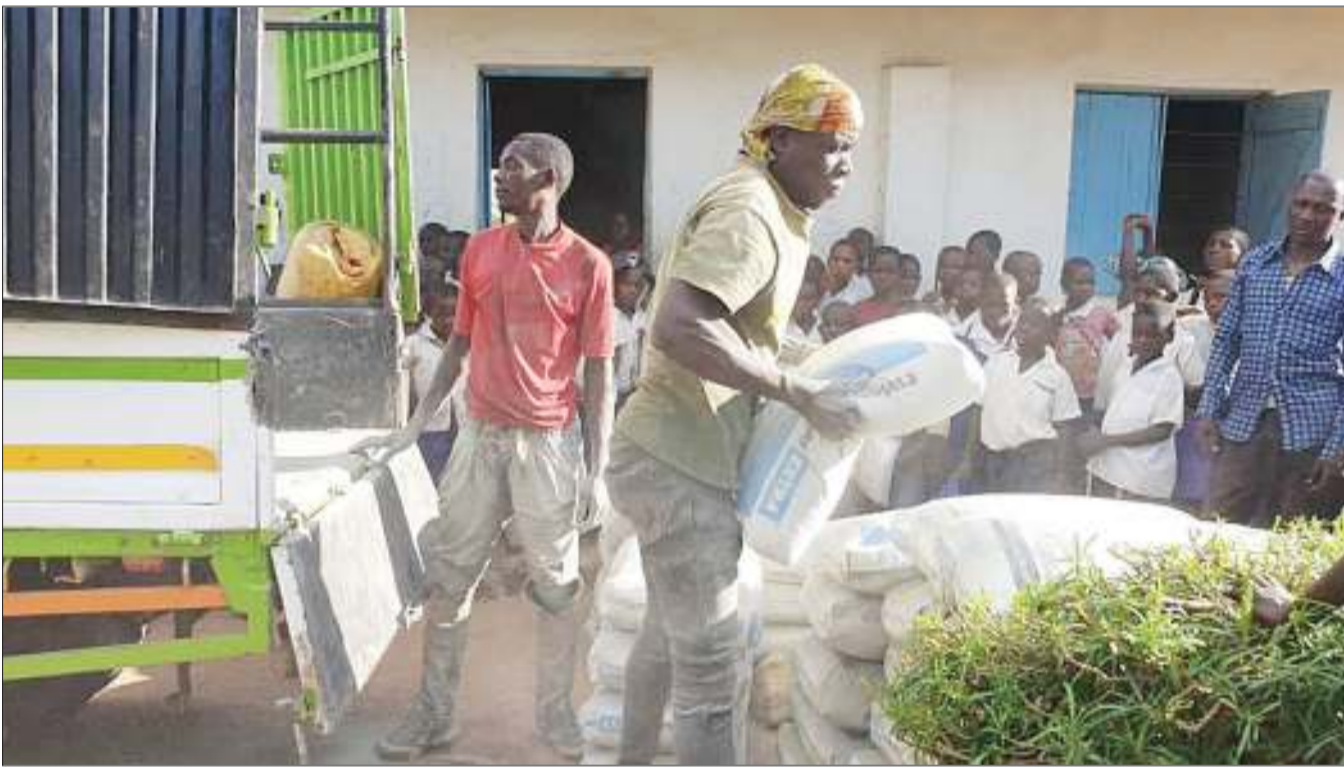
Wakazi wa Kijiji cha Nyaminyo mkoani Mara, wakishusha mifuko ya saruji iliyotolewa na Mbunge wa Musoma Vijijini, Prof. Sospeter Muhongo (hayupo pichani), juzi, zikiwamo fedha taslimu 300,000/- na milango mitatu kwa ajili ya kuboresha miundombinu ya Shule za Msingi za Nyaminyo A na B.