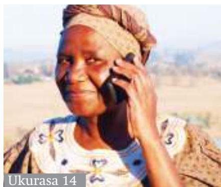
Ukurasa 14 Tija kiuchumi; Matumizi 'simu janja' yanashika nafasi gani katika uzalishaji?