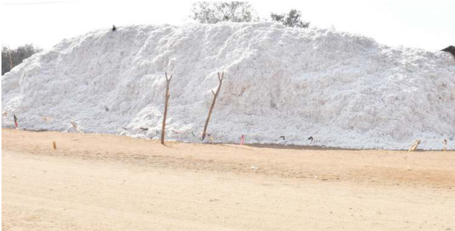
Pamba ikiwa nje katika kijiji cha Mwasengelea wilayani Meatu, ambayo bado haijanunuliwa.

“Kiuchumi tumeathirika, kwa sababu tumeshindwa kununua chakula kwa wakati na kupeleka