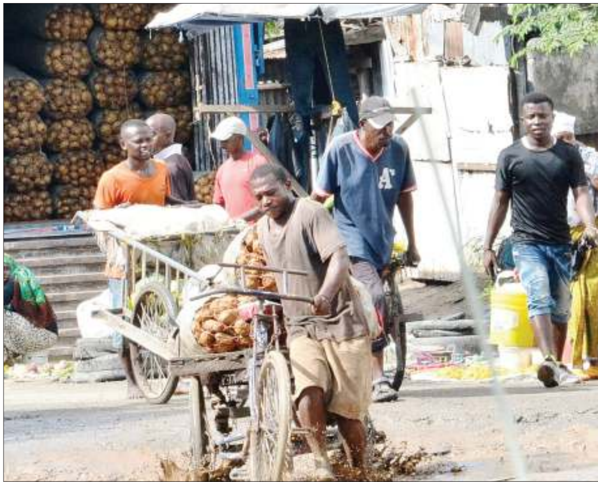
Mwendesha guta akipita kwa tabu kwenye matope kutokana na barabara kuharibika katika eneo la njia panda ya Mabibo, jijini Dar es Salaam jana.

Vitabu vitano vilivyozinduliwa ni pamoja na Sera ya Viwanda, Ripoti ya Tathmini ya Mazingira ya Ufanyaji wa Biashara, Daftari la Wafanyabiashara, Mwongozo wa Usafirishaji na Uagizaji pamoja na Taarifa za Wazalishaji wa Kazi za Mikono Zanzibar vinyototarajiwa kuuzwa kwa waiteja mbalimbali.