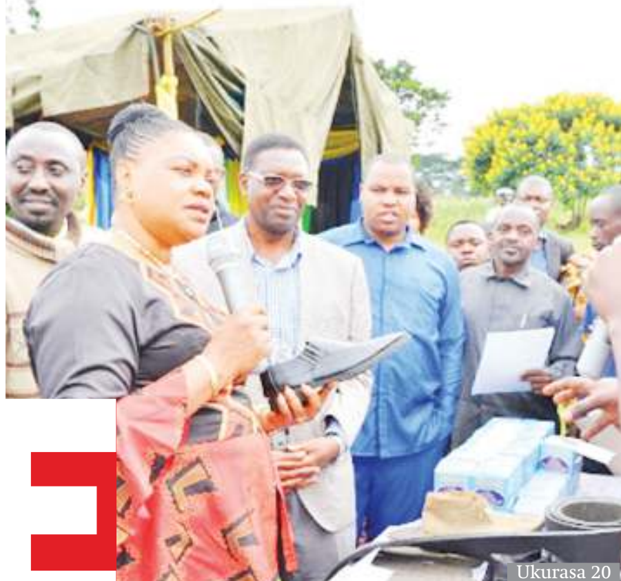
Ukurasa 20 'Shida ya vijana wazito kukubali mabadiliko ya kuwatoa walipo'