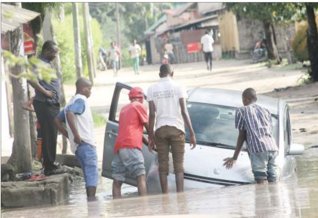
Wasamaria wema wakijaribu kulinasua gari lililokwama kwenye dimbwi la maji yaliyotuma barabarani katika eneo la Kitunda, jijini Dar es Salaam jana.

Mshtakiwa hakutakiwa kujibu chochote kwa kuwa mahakama hiyo haina mamlaka ya kusikiliza kesi hiyo.