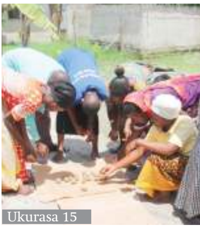
Ukurasa 15 Kipunguni Dar waja na mkaa wa maboksi