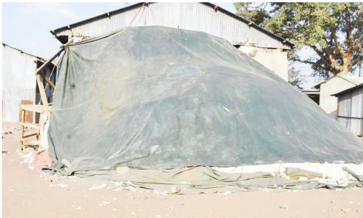
Ghala la kuhifadhi pamba katika kijiji cha Gibeshi wilayani Bariadi mkoani Simiyu, likionekana kubomoka upande, licha ya msimu wa mvua kukaribia.

Anasifu mkakati wa serikali kuanzisha vyama vya ushirika (Amcos) akikiri haikuwa na nia mbaya, isipokuwa anawalaumu anaowaita ‘matajiri wachache’ wali-