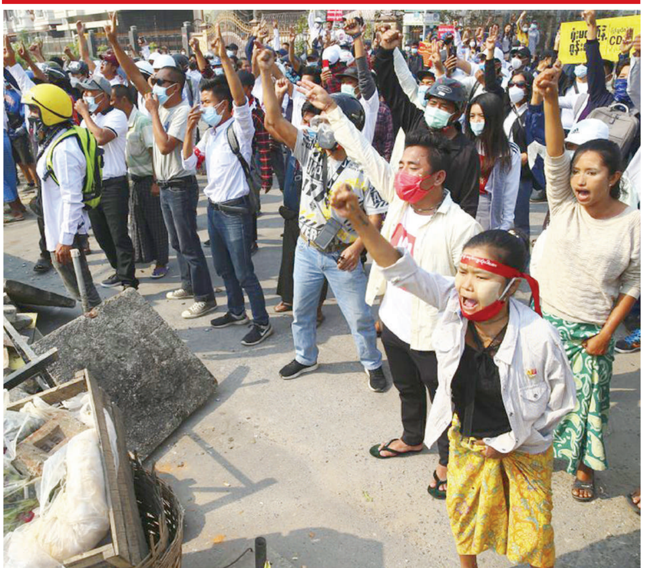
Waandamanaji wakipiga kelele katika viziwi walivyoweka wakati wa maandamano dhidi ya mapinduzi ya kijeshi Yangon, Myanmar, jana. Polisi walifyatua gesi ya kutoa machozi na mabomu ya maji na kulikuwa na ripoti za risasi.

Hakuna mtu aliyekamatwa kwa madai ya kuhusika na shambulizi hilo. TRT