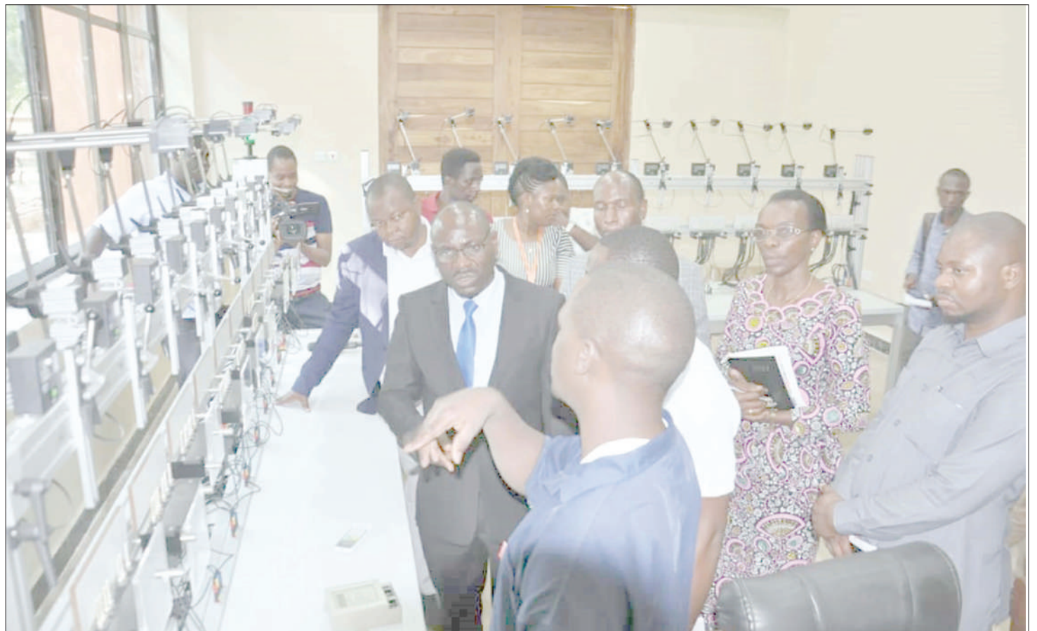
Naibu Waziri wa Viwanda na Biashara, Exaud Kigahe, akipata maelezo kutoka kwa ofisa vipimo wa Wakala wa Vipimo (WMA), kuhusu mtambo wa kupima mita za umeme unavyofanyakazi katika kituo cha Misugusugu Kibaha Mkoa wa Pwani, mwishoni mwa wiki.

“Viongozi, wananchi na watumishi wote wa umma naomba mui-tunze miundombinu hii pamoja na mingine ambayo imekuwa ikigharimu fedha nyingi za serikali na wahisani ili tuendelee kunufaika nayo,” alisema.