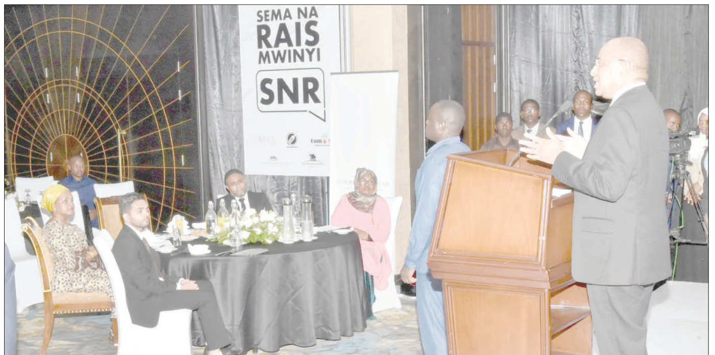
Rais wa Zanzibar, Dk. Hussein Mwinyi, akihutubia katika uzinduzi wa dirisha la 'Sema na Rais Mwinyi (SNRMWINYI)', kuwasilisha kero za wananchi kupitia APP hiyo na kuwafikia wahusika. Uzinduzi huo ulifanyika juzi usiku jijini Zanzibar.

Alisema tongo hilo ni siku 31 hadi 90 ni kundi la angalizo asilimia 10, siku 91 hadi 180 ni chini ya kiwango tongo lake ni asilimia 30, siku 181 hadi 365 ni mashaka na tongo ni asilimia tano huku siku 365 ni hasara na tongo lake ni asilimia 100.