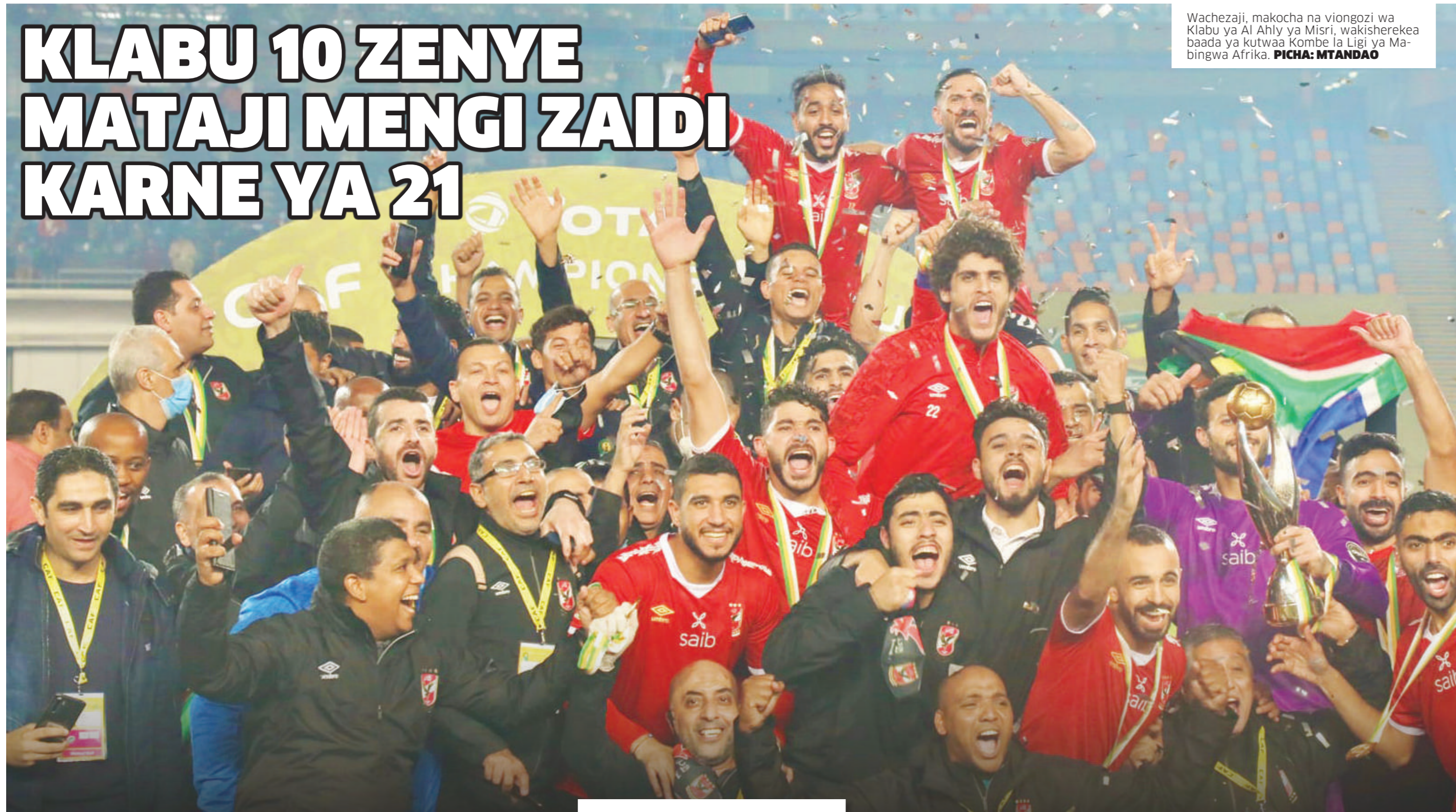
Wachezaji, makocha na viongozi wa Klabu ya Al Ahly ya Misri, wakisherekea baada ya kutwaa Kombe la Ligi ya Mabingwa Afrika.