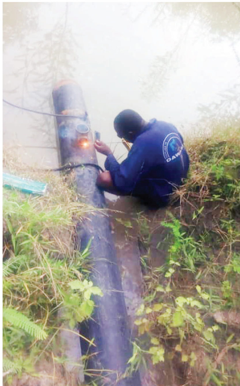
Fundi wa Mamlaka ya Majisafi na Usafi wa Mazingira Dar es Salaam (DAWASA) akirekebisha bomba la inchi 8 linalotoa maji kwenye tanki la Changanyikeni na kusambaza kwa wananchi wa maeneo Kibululu mpaka Goba jana.

"Lengo la Coca-Cola Kwanza ni kuboresha maisha ya Watanzania katika sekta mbalimbali ikiwamo elimu, na hii ni moja ya sababu ya kutoa madawati haya kwa Wilaya ya Ruangwa," alisema.