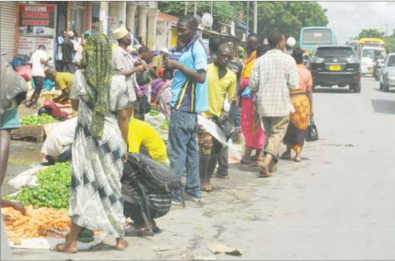
Wachuuzi wakiwa wametandaza bidhaa zao hadi katika Barabara ya Uhuru, eneo la Ilala Sokoni, jijini Dar es Salaam jana, kitendo kinachosababisha usumbufu kwa magari na waenda kwa miguu.