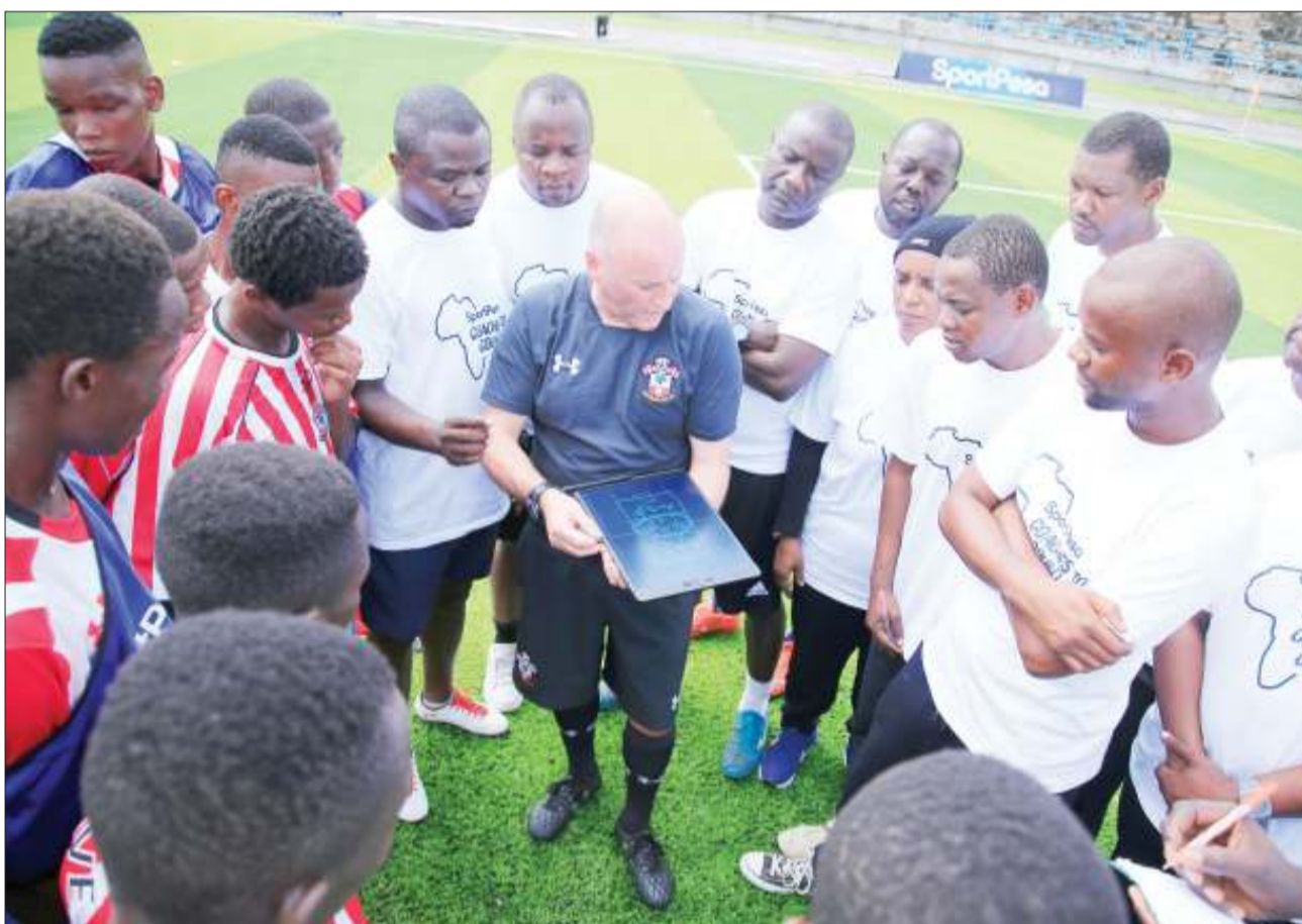
Mmoja wa makocha wa Southampton, akiwanoa makocha wa Tanzania katika Uwanja wa Uhuru jijini Dar es Salaam jana, wakufunzi hao wapo nchini chini ya udhamini wa SportPesa. NA MPIGAPICHA WETU

Serengeti Boys ilianza kwa kichapo cha mabao 5-4 dhidi ya Nigeria, kisha 3-0 na Uganda kabla ya kuhitimisha kwa kipigo cha mabao 4-2 kutoka kwa Angola.