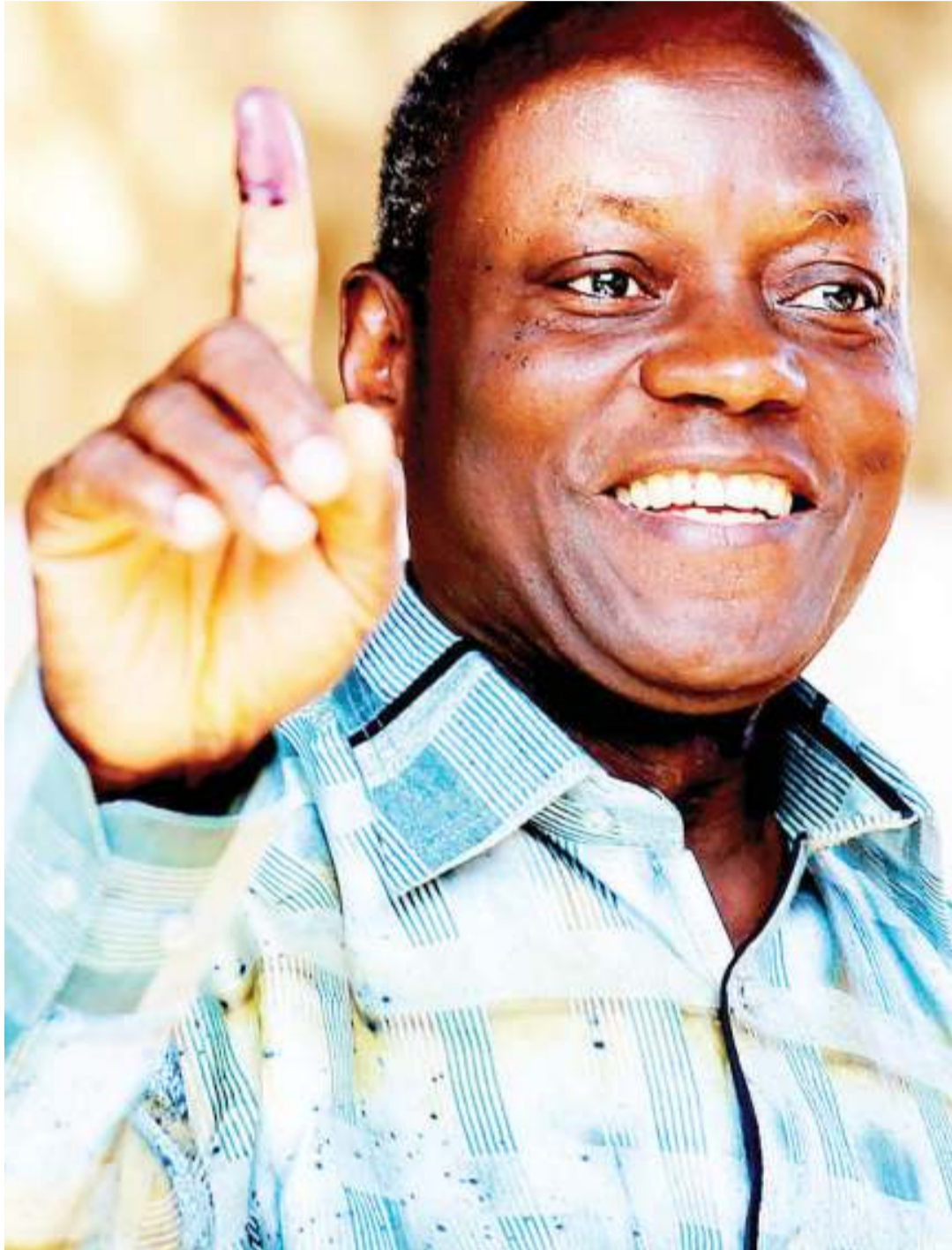
Rais Jose Mario Vaz wa Guinea Bissau.