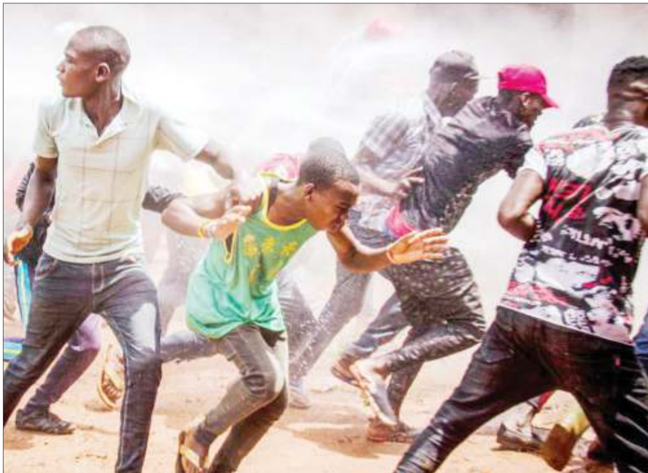
Wafuasi wa Bobi Wine wakitawanywa na polisi katika eneo la Busabala nchini Uganda. Kwa sasa kiongozi huyo anashikiliwa gerezani na amenyimwa dhamana.

Washukiwa hao sasa watafikishwa mahakamani na trei hizo za mayai zilizopatikana zitatumika kama uthibati au ushahidi kortini. BBC