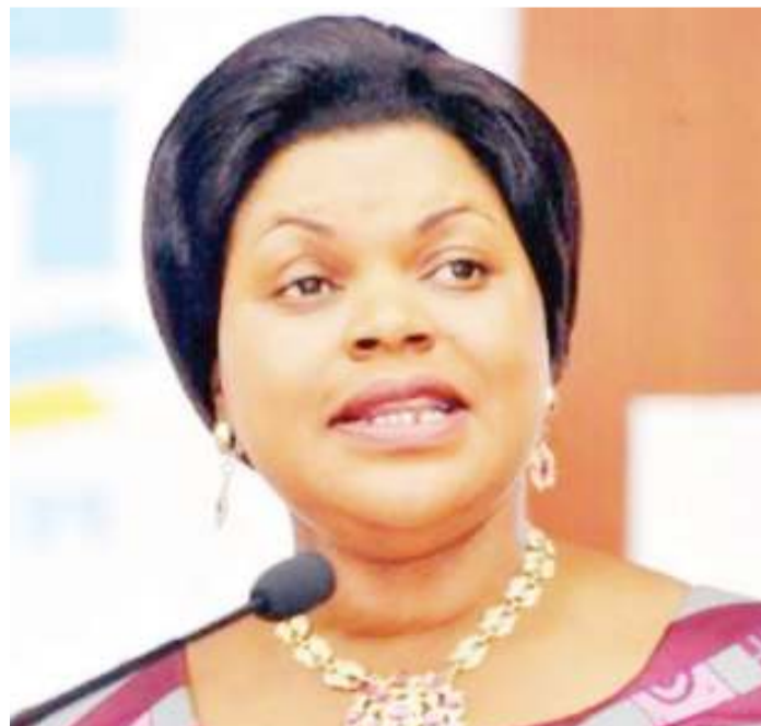
Waziri wa Nchi, Ofisi ya Waziri Mkuu, Sera, Bunge, Kazi, Vijana, Ajira na Walemavu Jenista Mhagama.

Viongozi Sudan Kusini bado wajitafuta licha ya 'mguso' wa Papa Francis Ukurasa 15