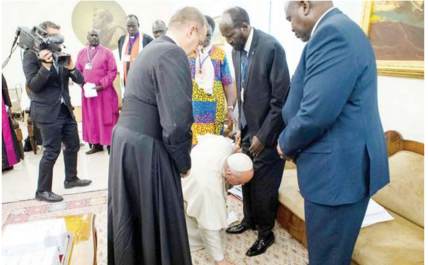
Papa Francis (aliyeinama), akishika miguu ya Rais wa Sudan, Salva Kiir (wa pili kulia). Kulia ni mpinzani wa Rais Kiir, Dk. Riek Machar.

Ni wazi kuwa kiongozi huyo wa upinzani hana raha na mpangilio