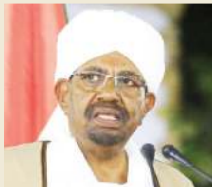
Aliyekuwa Rais wa Sudan, Omar al-Bashir.