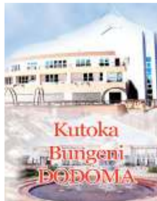
Habari zote na Augusta Njoji, DODOMA

wajengea uwezo na weledi wa kuzuia na kukabiliana na vitendo vya uvunjifu wa amani vinyojitokeza hususani wakati wa uchaguzi.