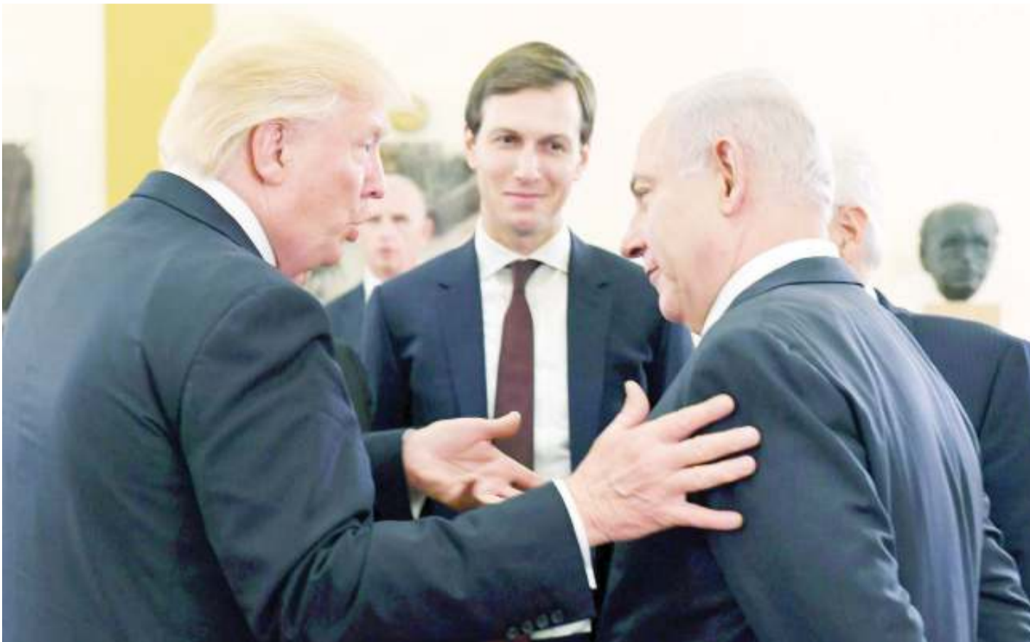
Mkwe wa Rais Donald Trump wa Marekani, Jared Kushner (katikati), akiwa na Rais Trump (kushoto) na Waziri Mkuu wa Israel, Benjamin Netanyahu.