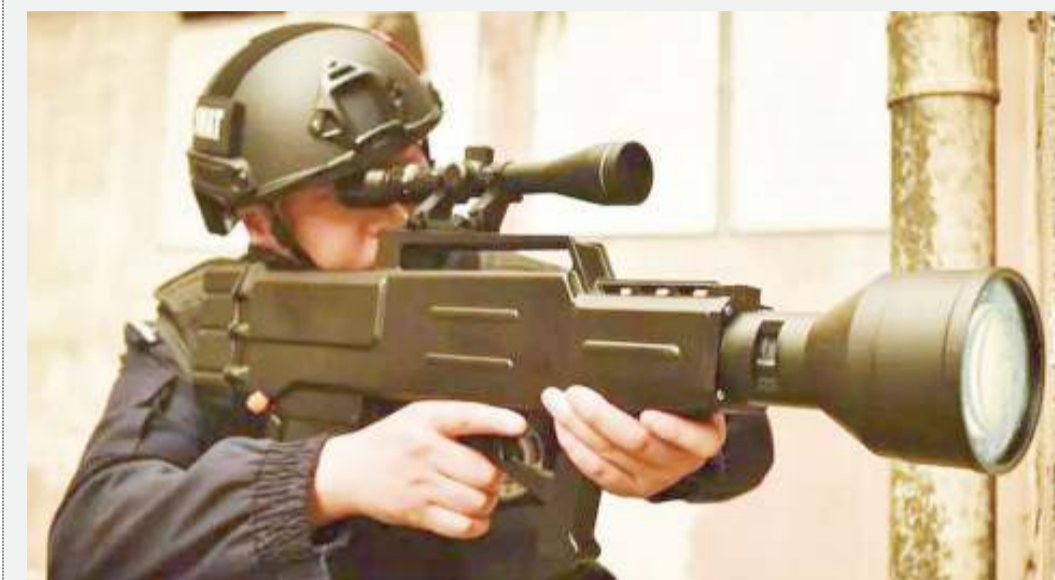
Moja ya silaha nzito katika medani za kivita. Utafiti unaonyesha kwamba matumizi ya kijeshi yaliiongezeka mwaka 2018.