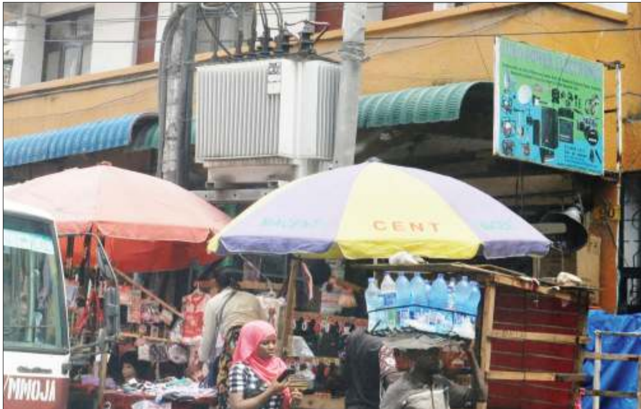
Wachuuzi wa bidhaa wakifanya shughuli zao chini ya transfoma ya umeme mkubwa, kando ya Barabara ya Uhuru, eneo la Kariakoo, jijini Dar es Salaam jana, kitendo ambacho ni hatari endapo itatokea hitilafu ya umeme.

"Tulikuta machujio mawili ya mafuta, kitabu chenye oda mbalimbali za wateja na mapipa mawili yenye ujazo wa lita 200 yakiwa na mafuta ya transfoma. Tunaendelea kuwasaka Praygod na Baraka," alisema. Alisema katika operesheni nyingine waliwakamata watuhumiwa wengine wawili wakiwa na vibati maalum vinavyokaa ndani ya transfoma vina vyosaidia kuzalisha umeme na mashine tano za kuchomea zilizotengenezwa kienyeji.