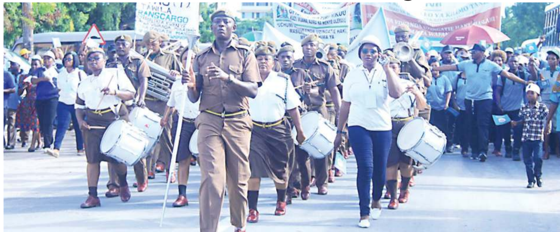
Bendi ya Jeshi la Magereza ikiongoza maandamano ya wafanyakazi katika kuadhimisha Siku ya Wafanyakazi Duniani (Mei mosi)