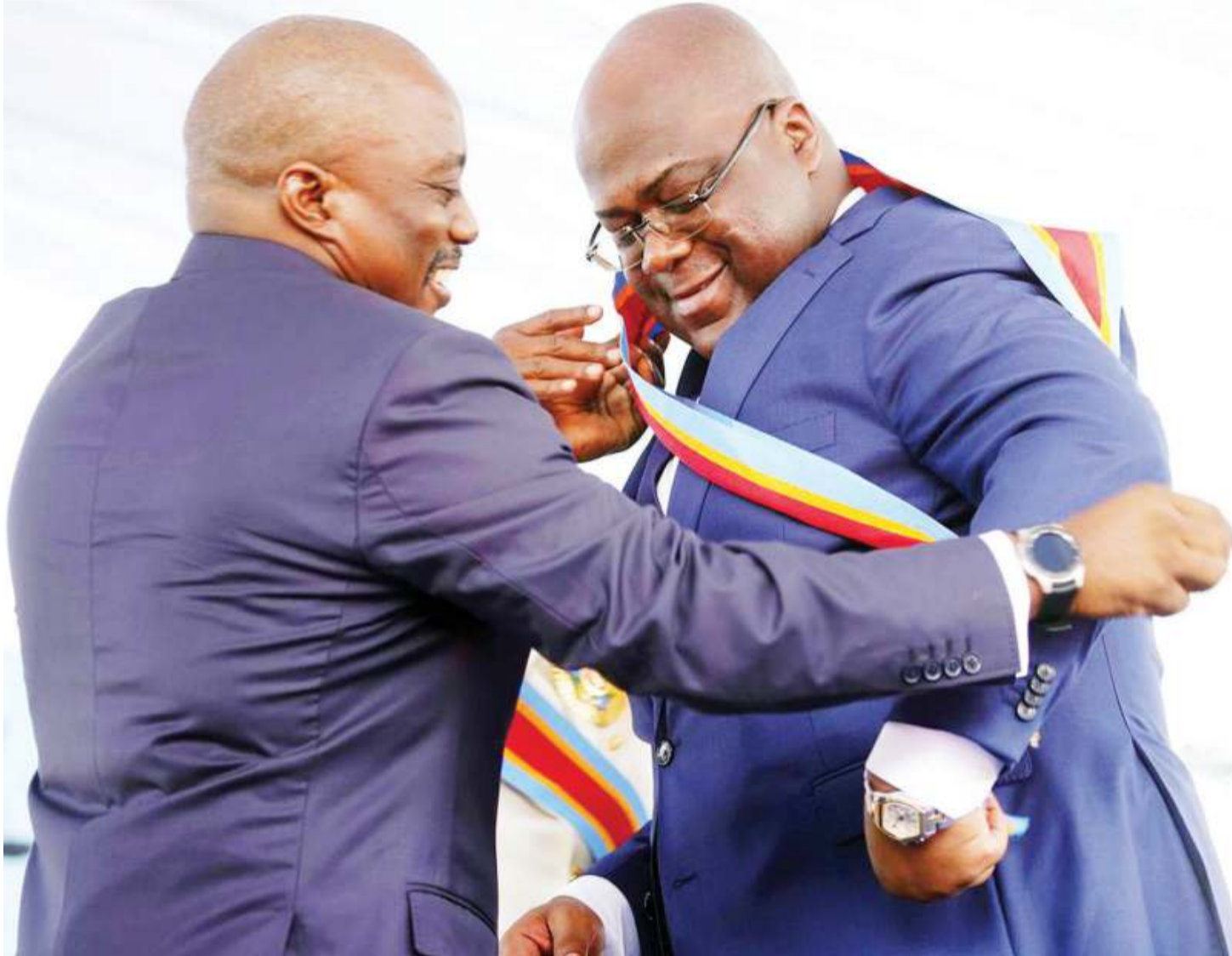
Rais Felix Tshisekedi wa DRC (kulia), akiwa na mtangulizi wake Joseph Kabila.

• Bado anawatumia 'mawaziri wa Kabila' kuiongoza DRC