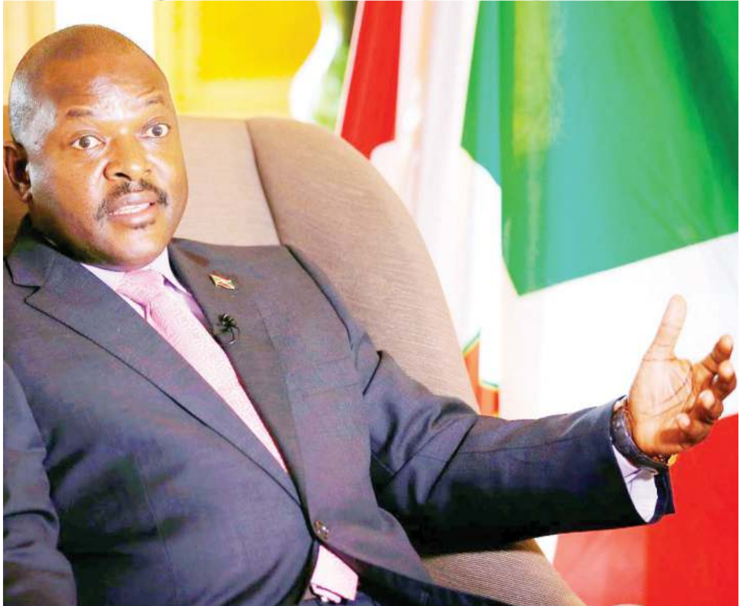
Rais Pierre Nkurunziza wa Burundi.

Ingawa Burundi ina kiu ya kujiunga SADC lakini uwezo wa kiuchumi wa taifa hilo kuchangia