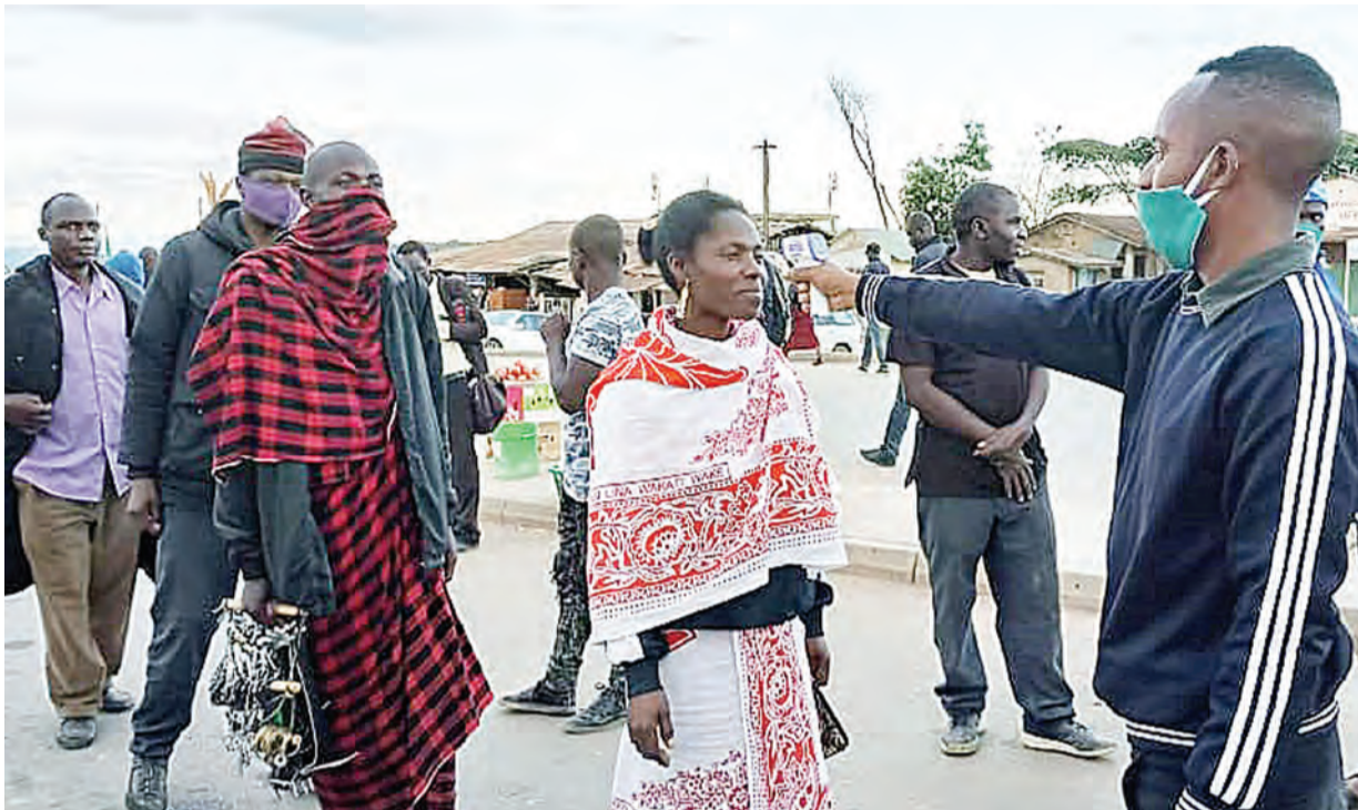
Vijana wanaofanya kazi ya kupiga debe stendi ya Mafinga wilayani Mufindi, mkoani Iringa, wakifanya majaribio ya kuwapima joto wasafiri katika stendi hiyo, mara baada ya kifaa hicho cha kupimia joto na vifaa kinga vingine vya corona kutolewa na kampuni ya nguzo za umeme ya Qwihaya General Enterprises Ltd juzi.