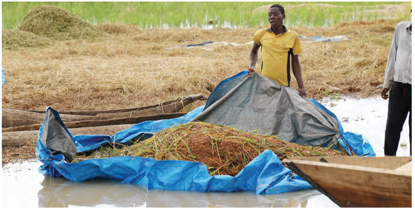
Mkulima wa mpunga katika skimu ya Kijiji cha Bahi Makulu akikusanya kwenye trubai sehemu ya mpunga kutoka kwenye maji yaliyofunika mashamba ya mpunga zaidi ya heka 11,000 wilayani Bahi mkoani Dodoma.