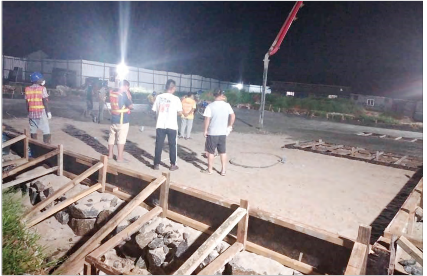
Mafundi wakiwa kwenye maandalizi ya ujenzi wa tangi la maji Kisarawe-Pugu, Pugu Kajiungeni. Mradi huo unatekelezwa na Mamlaka ya Majisafi na Usafi wa Mazingira Dar es salaam (DAWASA), tangi hilo litakuwa na uwezo wa kuhifadhi maji yenye ujazo wa lita milioni mbili.

"Mamlaka zote tukisimamia hili tutaepusha madhara kwa wananchi, mifugo na viumbe vingine vilivyomo katika mazingira yetu," alisema.