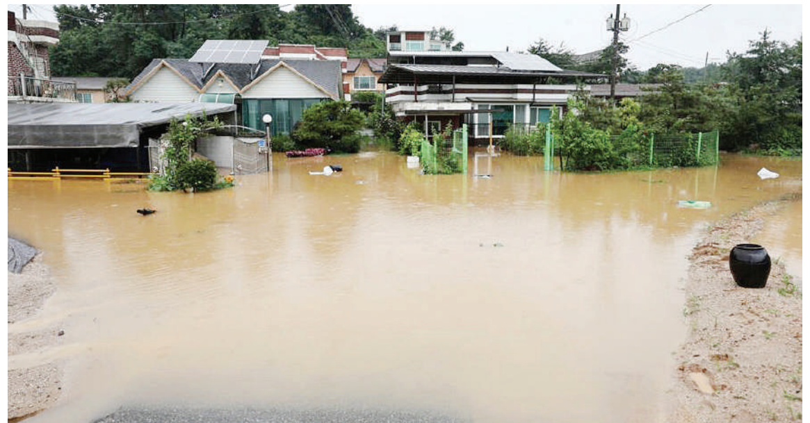
Maji ya mafuriko yakiwa yamejaa mbele ya makazi ya wananchi huko Korea Kusini baada ya mvua kubwa kunyesha, ikielezwa kuwa huenda idadi ya vifo vinavyotokana na mafuriko hayo vitaongezeka.