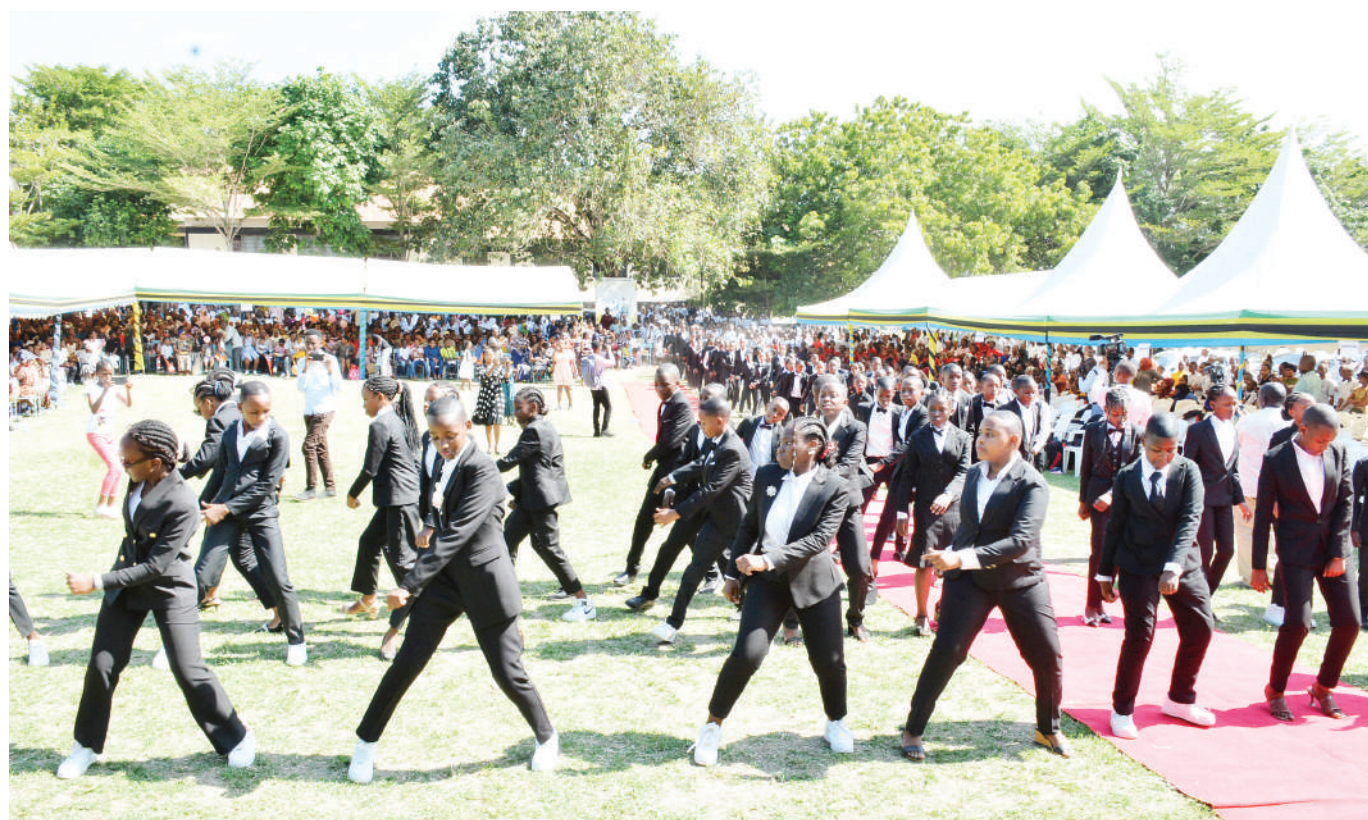
Wanafunzi wa Darasa la Saba wa Shule ya St. Anne Marie Academy Mbezi Kimara kwa Msuguri, Dar es Salaam, wakiwabarudisha wageni kwa nyimbo mbalimbali za Bongo Flewa wakati wa mahafali ya 20 ya shuleni hapo mwishoni mwa wiki.