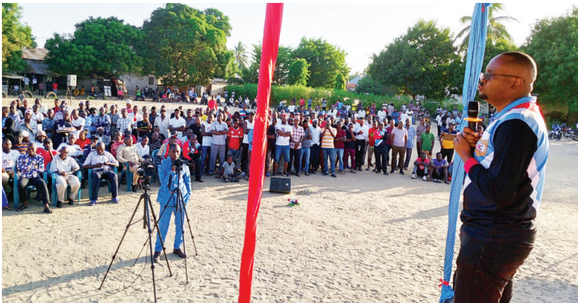
Katibu Mkuu wa Chama cha Demokrasia na Maendeleo (CHADEMA), John Mnyika, akizungumza kwenye mkutano wa hadhara katika uwanja wa stendi ya sokoni Zingiziwa, Chanika, Wilaya ya Ilala jijini Dar es Salaam jana.