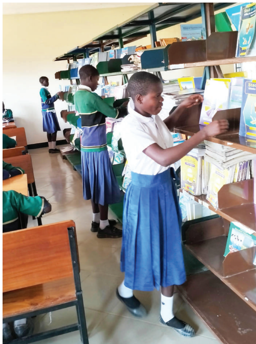
Baadhi ya wanafunzi wa Shule ya Msingi Butata, Musoma Vijijini mkoani Mara, wakiwa katika maktaba ya shule kwa ajili ya kujisomea mwishoni mwa wiki. Maktaba hiyo imejengwa kwa nguvu za wananchi, mbunge na Shirika la Kimataifa la Project Concern International (PCI).