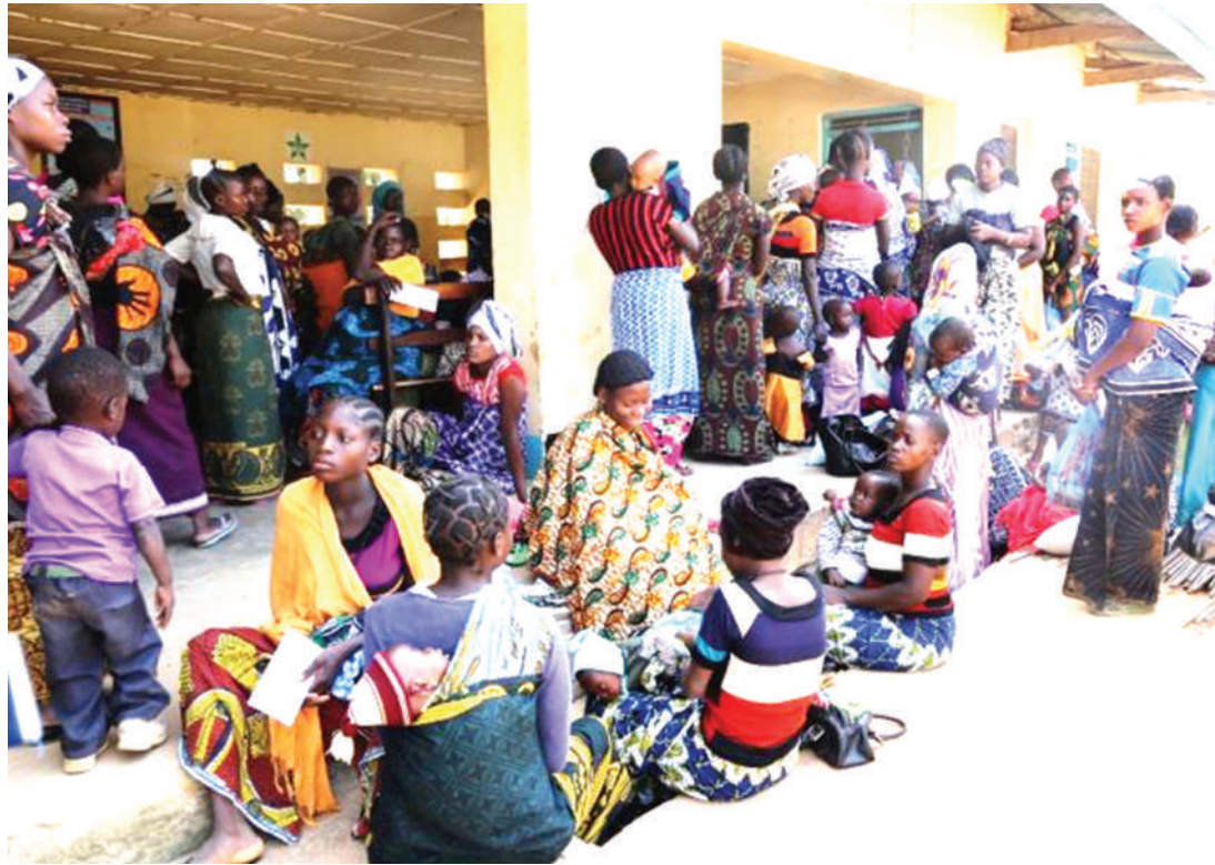
Kinamama wakiwa kliniki.

Ni aina ya madhara yanayojitokeza katika mazingira, pale ndu-