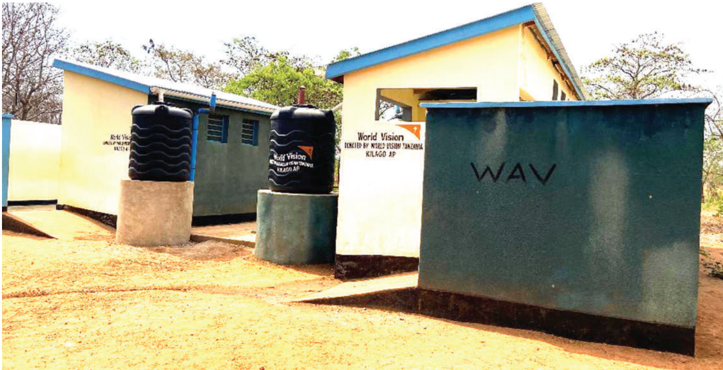
Vyoo vya wanafunzi vilivyojengwa katika Shule ya Msingi Nyanhembe, Manispaa ya Kahama.