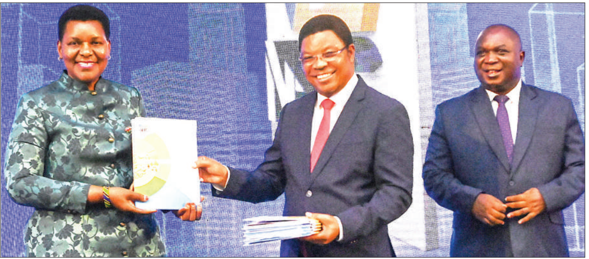
Waziri Mkuu, Kassim Majaliwa akimkabidhi Waziri wa Ardhi, Nyumba na Maendeleo ya Makazi, Dk. Angelina Mabula, nakala ya sera ya ubia ya Shirika la Nyumba la Taifa (NHC) baada ya kuizindua jijini Dar es Salaam jana. Kulia ni Mkuu wa Mkoa wa Dar es Salaam, Amos Makala.