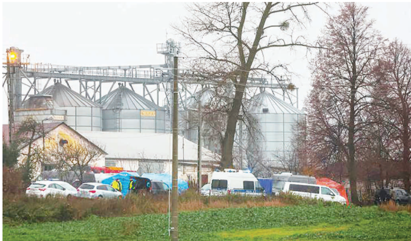
Magari ya maafisa wa polisi yakiwa katika eneo ulikotokea mlipuko wa bomu katika kijiji cha Przewodow, mashariki mwa Poland jana.

Serikali ya Congo inatazamiwa kuanza tena mazungumzo na wawakilishi wa makundi mbalimbali yenye silaha baadaye mwezi huu katika mji mkuu wa Kenya Nairobi. BBC