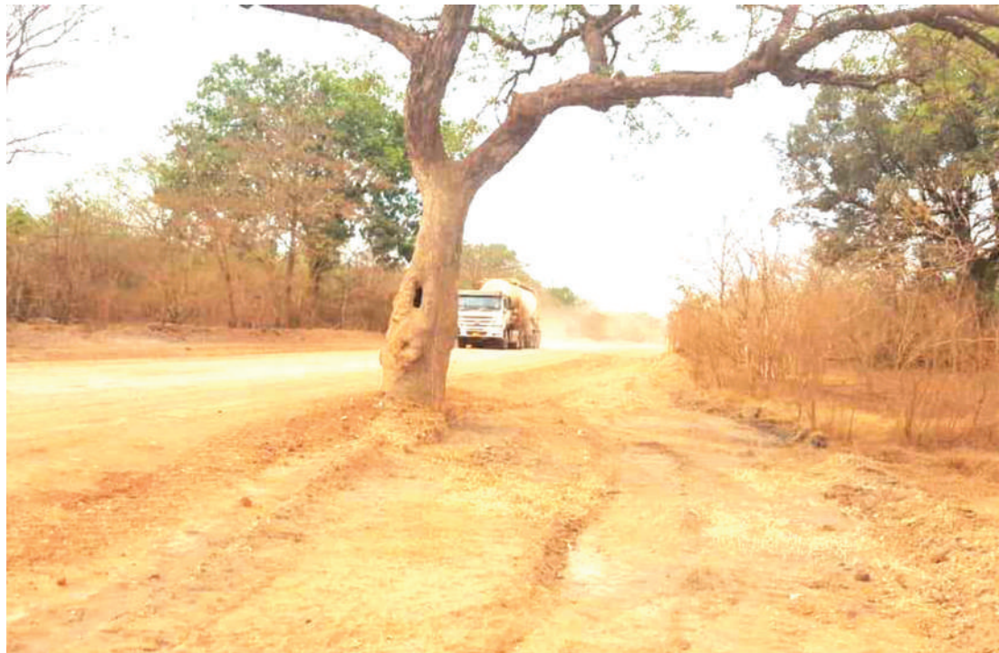
Mti wa ajabu unaoshindikana kung'oka kwa nyenzo zote.

Ofisa huyo anasema kuna zaidi ya aina 2000 za mimea anayotumia mfano miti ya mibuyu, migude, mpinga, mninga, mkon-