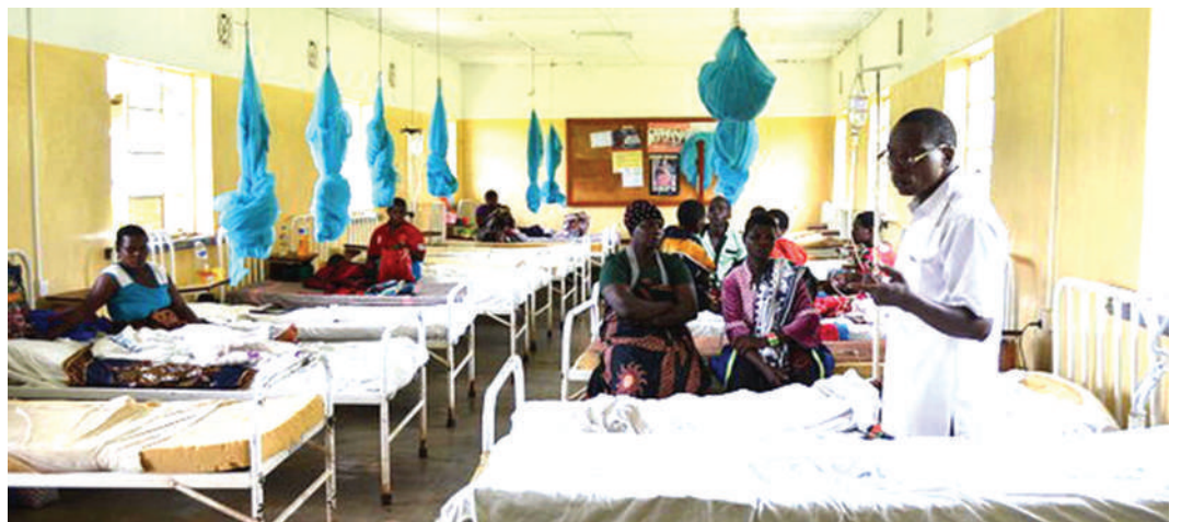
Wagonjwa wakiwa katika wodi na baadhi ya waliofika kuwaangalia, katika hospitali ya wilaya iliyoko mkoani Songwe.

Mwandishi ni Mhadhiri Msaidizi katika fani ya Usimamizi, Ufuatiliaji na Tathimini ya Miradi ya Afya, katika Chuo Kikuu cha Sayansi na Tiba Muhimbili (MUHAS) na anapatikana kwa simu: +255 757-645746.