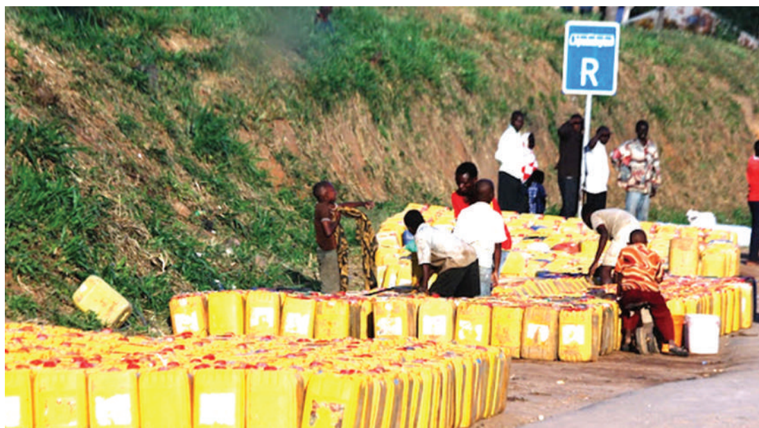
Wakazi wa Mkata, wilayani Handeni, mkoani Tanga wakihangaikia kupata maji.

Makala hii ni tathmini binafsi ya kitaalamu ya mwandishi, ambaye ni Mhadhiri Msaidizi katika fani ya Usimamizi, Ufuatiliaji na Tathimini ya miradi ya Afya, katika Chuo Kikuu cha Sayansi na Tiba Muhimbili anapatikana kwa simu: + 255 757 645746.