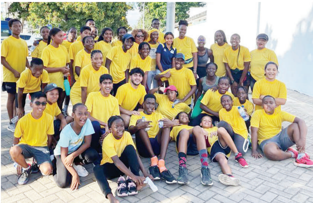
Waogeleaji wa Timu ya Taifa ya Tanzania wakiwa katika picha ya pamoja.

Kuhusu timu yake kuburuza mkia katika ligi hiyo, alisema ni kweli timu haipo katika nafasi nzuri kwenye msimamo na kwamba ni kawaida kwa klabu za soka duniani kukumbwa na upepo mbaya wa kutopata matokeo mazuri katika msimu, hivyo bado hawajakata tamaa kwa kuwa ipo nafasi nyingine ya kurekebisha makosa yaliyowakumba katika mzunguko huu wa kwanza.