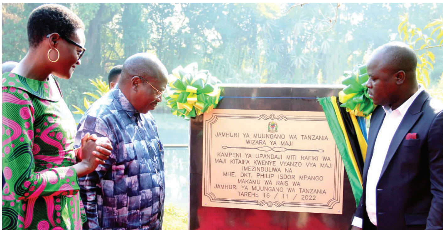
Makamu wa Rais, Dk. Philip Mpango (wa pili kushoto), akizindua kampeni ya kitaifa ya upandaji miti rafiki wa mazingira kwenye vyanzo vya maji katika Jiji la Mbeya jana. Kushoto ni Spika wa Bunge na Mbunge wa Mbeya Mjini, Dk. Tulia Ackson na Waziri wa Maji, Jumaa Aweso.

Mkuu huyo wa wilaya alisema hadi sasa zaidi ya watu 15 wamepoteza maisha kutokana na mapigano kati ya wafugaji na wakulima, tangu serikali iruhusu wafugaji kutoka Ithefu Mbeya kwenda mikoa ya Kusini.