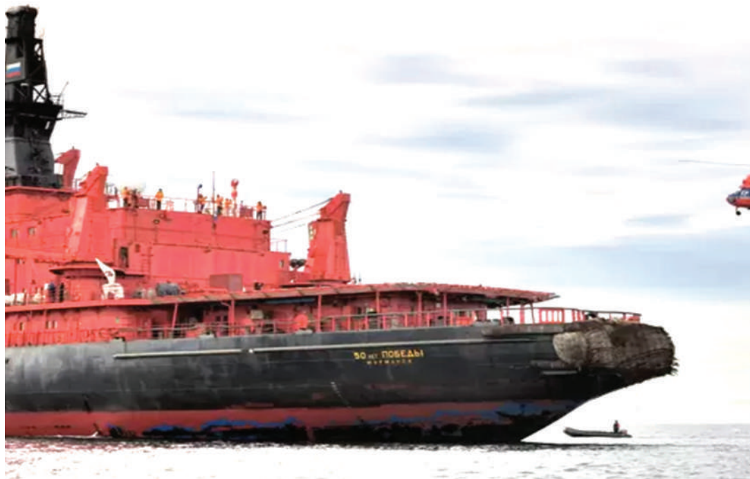
Mandhari ya kisiwa kisicho na mwenyewe.

Kwenye kuadhimisha uzinduzi wake, meli hiyo ilibeba mwenge wa Olimpiki hadi mahali hapo