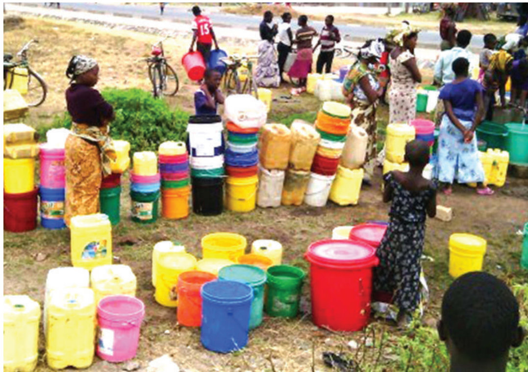
Hali ya foleni ya maji mkoani Dodoma.

Wananchi wengi wameipokea taarifa hiyo kwa mshtuko na hofu kubwa, hasa ikizingatiwa nchi imekuwa katika jitihada kuhakikisha inajitosheleza na kujinasua dhidi ya athari za janga la Uviko 19, lin-