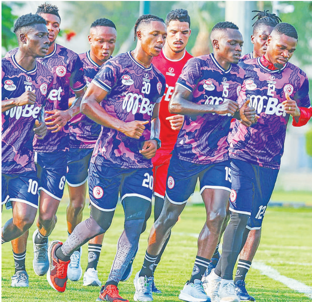
Wachezaji wa Simba wakiendelea na mazoezi yao ya kujiandaa na msimu mpya wa Ligi Kuu na michuano ya kimataifa katika jiji la Ismailia nchini Misri.