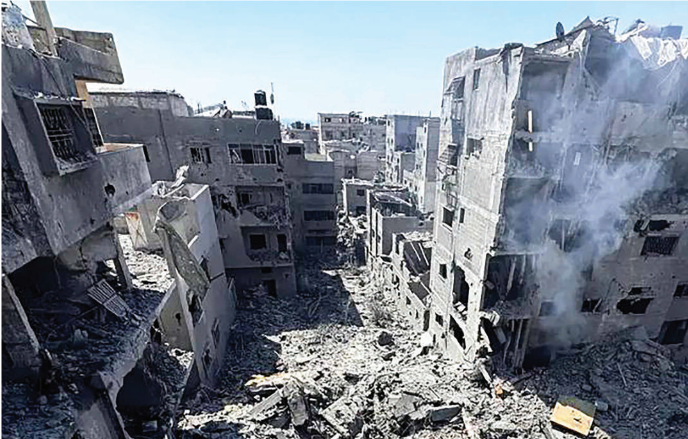
Taswira mpya ya mji wa Gaza ukionekana kama magofu baada ya mashambulizi makali ya jeshi la Israel juzi.