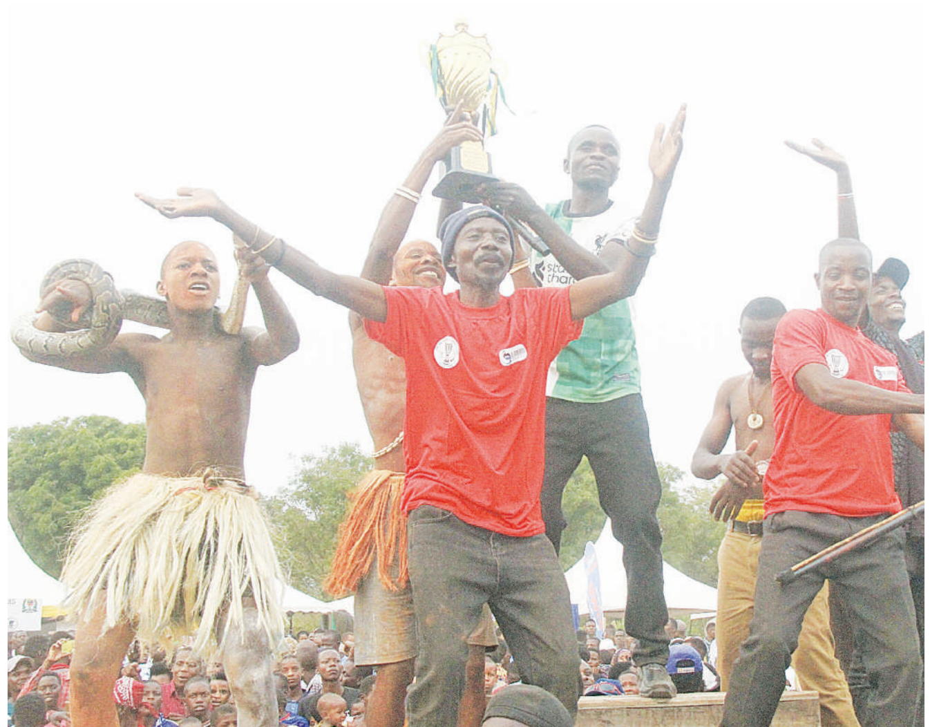
Kikundi cha ngoma cha Wagika, kikishangilia na kombe lao baada ya kuibuka washindi katika Tamasha la Kimataifa la Utamaduni na Utalii lililofanyika katika Uwanja wa CCM Bariadi mkoani Simiyu, ikiwa ni katika kuenzi utamaduni wa Wasukuma Kanda ya Ziwa.

Alisema kila kitu kinaweza kama na kusema mpinzani wake ana wachezaji wazuri hivyo amewataka wachezaji wake kuwa na tahadhari kubwa.