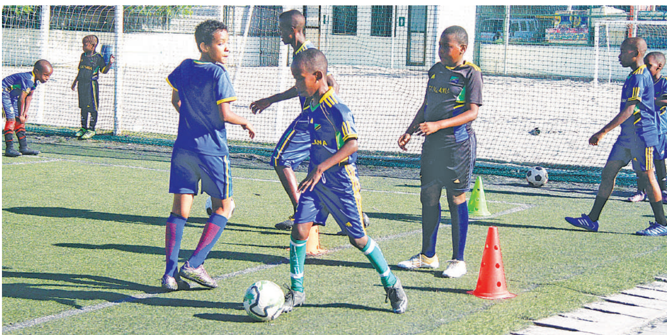
Vijana wakifanya mazoezi ya mpira katika Uwanja wa Jakaya Kikwete jijini Dar es Salaam juzi.

Kamara ambaye kwa sasa ana miaka 25 alianza kuichezea klabu ya kwao ya FC Johansen ambapo alitumika kwa msimu mmoja na baadae mwaka huo akajiunga na klabu ya East end Lions alipofuzu kwa miaka mitatu kabla ya Horoya FC ya Guinea kumsajili mwaka 2022 kwa mkataba wa miaka miwili unaomalizika mwaka huu.