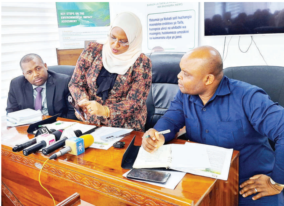
Waziri wa Nchi, Ofisi ya Makamu wa Rais (Muungano na Mazingira), Dk. Ashatu Kijaji (katikati), akimwonyesha Naibu wake, Khamis Hamza Khamis, ujumbe aliotumiwa na mwananchi kuhusu kurejea kwa mifuko ya plastiki, wakati akizungumza na menejimenti ya Baraza la Taifa la Hifadhi na Usimamizi wa Mazingira (NEMC), jijini Dar es Salaam jana.