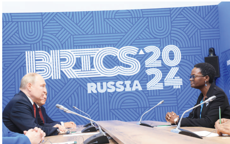
Rais wa Umoja wa Mabunge Duniani (IPU) na Spika wa Bunge, Dk. Tulia Ackson (kulia), akizungumza katika kikao maalum na Rais wa Russia, Vladimir Putin jijini St. Petersburg, nchini humoi jana.

Usiku wa Julai 10, 2021, soko hilo liliungua, wafanyabiashara 224 waki-poteza bidhaa zao na serikali kutangaza kulifanyia ukarabati na kujenga jengo jipya la ghorofa nne juu na ghorofa mbili chini.