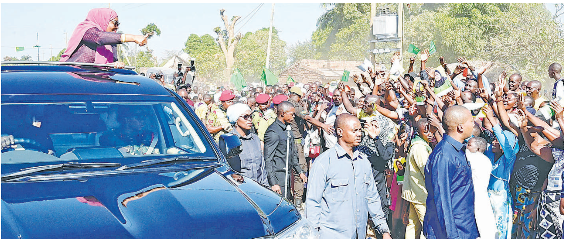
Rais Samia Suluhu Hassan akisalimbia wananchi baada ya kuwasili katika Uwanja wa Ndege wa Mpanda, Mkoa wa Katavi kwa ajili ya kuanza ziara ya kikazi mkoani humo jana.

Dk. Tulia, Rais Putin wateta vita vya Russia, Ukraine