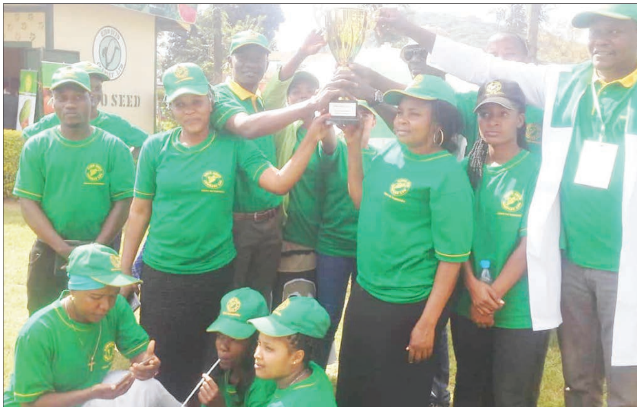
Wafanyakazi wa kampuni ya Mbegu ya Kibo Seed, wakifurahia kombe la mshindi wa kwanza wa kampuni za Mbegu Kanda ya Kaskazini, ushindi waliouputa wakati wa maonyesho ya Nanenane, Kanda ya Kaskazini, yaliyomalizika kwenye viwanja vya Themi Arusha wiki iliyopita.