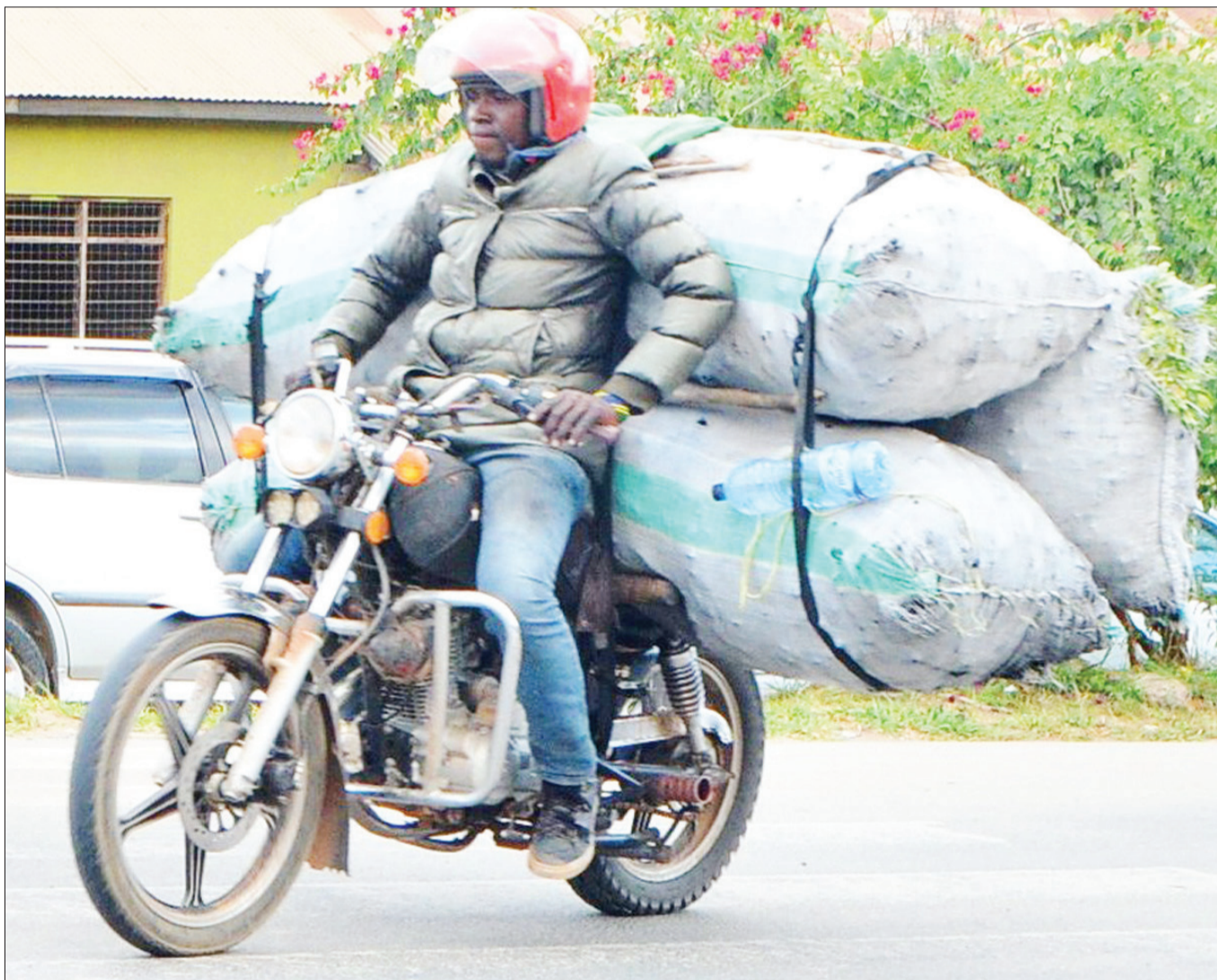
Dereva wa bodaboda akiwa ameisheheni magunia ya mkaa katika eneo la Goba, jijini Dar es Salaam jana, kitendo ambacho ni hatari kwa usalama barabarani.