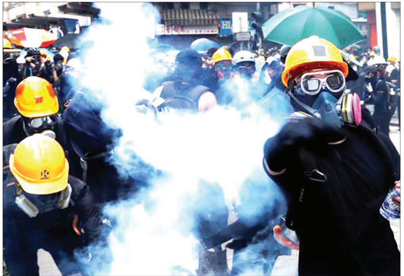
Waandamanaji Hong Kong wakipambana na Jeshi la Polisi jana katika Uwanja wa Ndege.