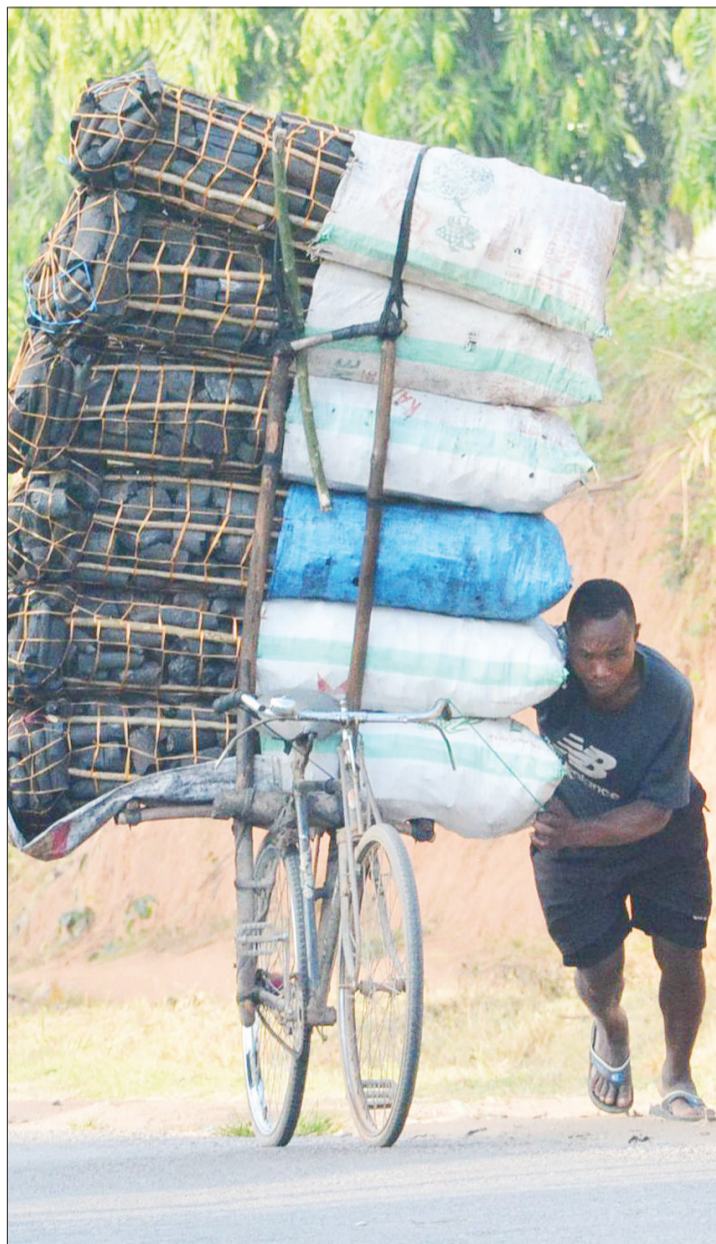
Mwendesha baiskeli akiwa ameisheni magunia ya mkaa, katika eneo la Zogowali Chanika, jijini Dar es Salaam jana, kitendo ambacho ni hatari kwa usalama barabarani.

Pia Prof. Kabudi kwa niaba ya serikali, ameleza kuridhishwa na kufurahishwa kwa namna vyombo vya habari nchini vinavyoripoti kizalendo mkutano unaoendelea wa SADC jambo ambalo limeongezwa uelewa wa wananchi kuhusu Jumuiya hiyo na kuvitaka kuen- delea kufanya hivyo katika masuala yote yanayohusu maendeleo ya nchi.