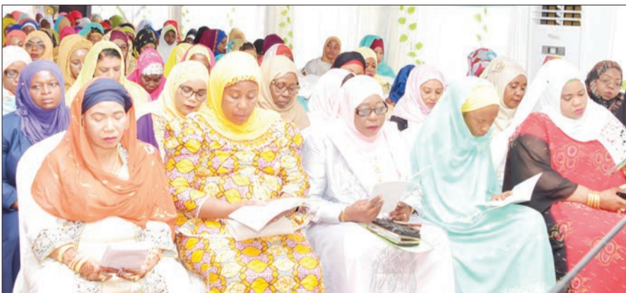
Baadhi ya viongozi na mawaziri wanawake pamoja na wananchi wakisikiliza hotuba iliyotolewa na Rais wa Zanzibar na Mwenyekiti wa Baraza la Mapinduzi, Alhaj Dk. Ali Mohamed Shein (hayupo pichani), katika sherehe za Baraza la Eid El Haji katika viwanja vya Langoni, Wilaya ya Magharibi A, Mkoa wa Mjini Magharibi jana.