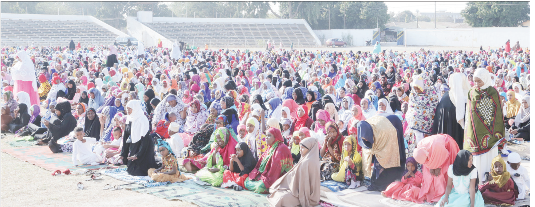
Baadhi ya waumini wa dini ya Kiislamu Mkoa wa Dodoma wakishiriki Swala ya Eid El Haji iliyoswaliwa jana katika Uwanja wa Jamhuri.