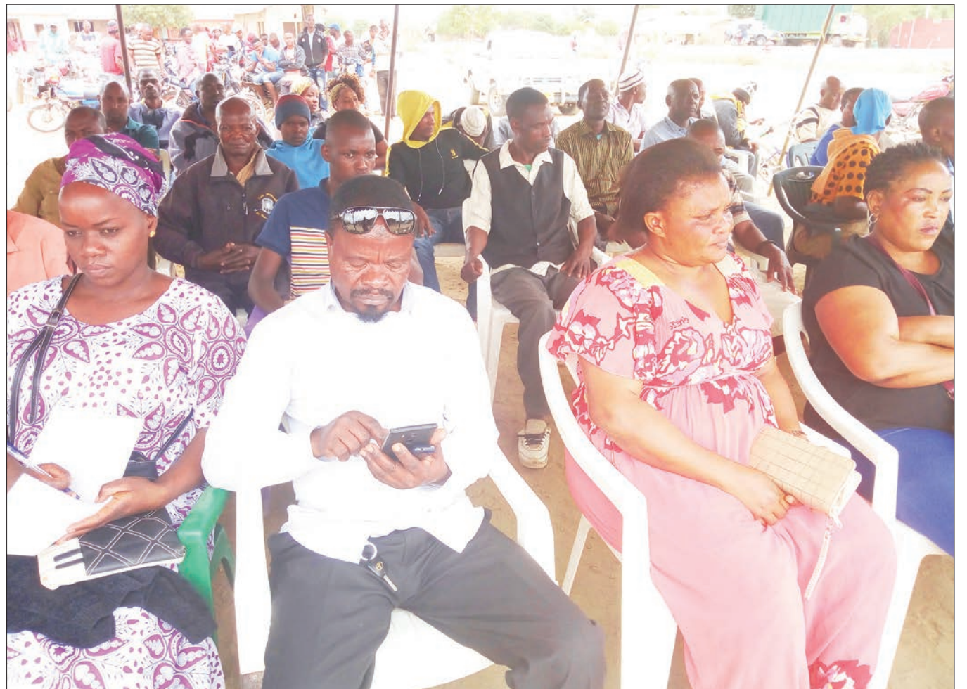
Wafanyabiashara na wadau wa madini wa Mji mdogo wa Mirerani, wilayani Simanjiro, Mkoa wa Manyara, wakifuatilia kikao cha elimu ya ulipaji kodi na ushuru juzi.

Mradi wa kuzalisha chumvi ulifufuliwa na wananchi baada ya kukwama kwa zaidi ya miaka 10 kwa sababu ya kukosekana kwa fedha za uendeshaji na sasa utakuwa miongoni mwa miradi ya kimkakati.