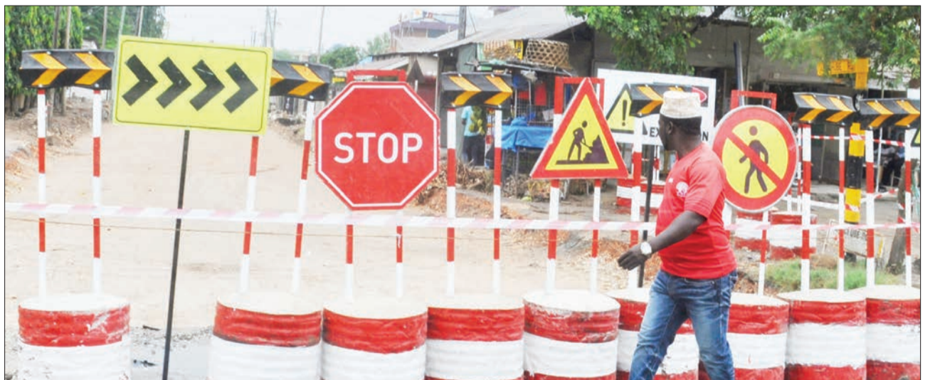
Mkazi wa Jiji la Dar es Salaam, akipita jirani na vibao vinavyoonyesha kufungwa kwa Barabara ya Akachube, kwa ajili ya ukarabati mkubwa unaendelea katika eneo la Kijitonyama, Manispaa ya Kinondoni, jijini humo jana.