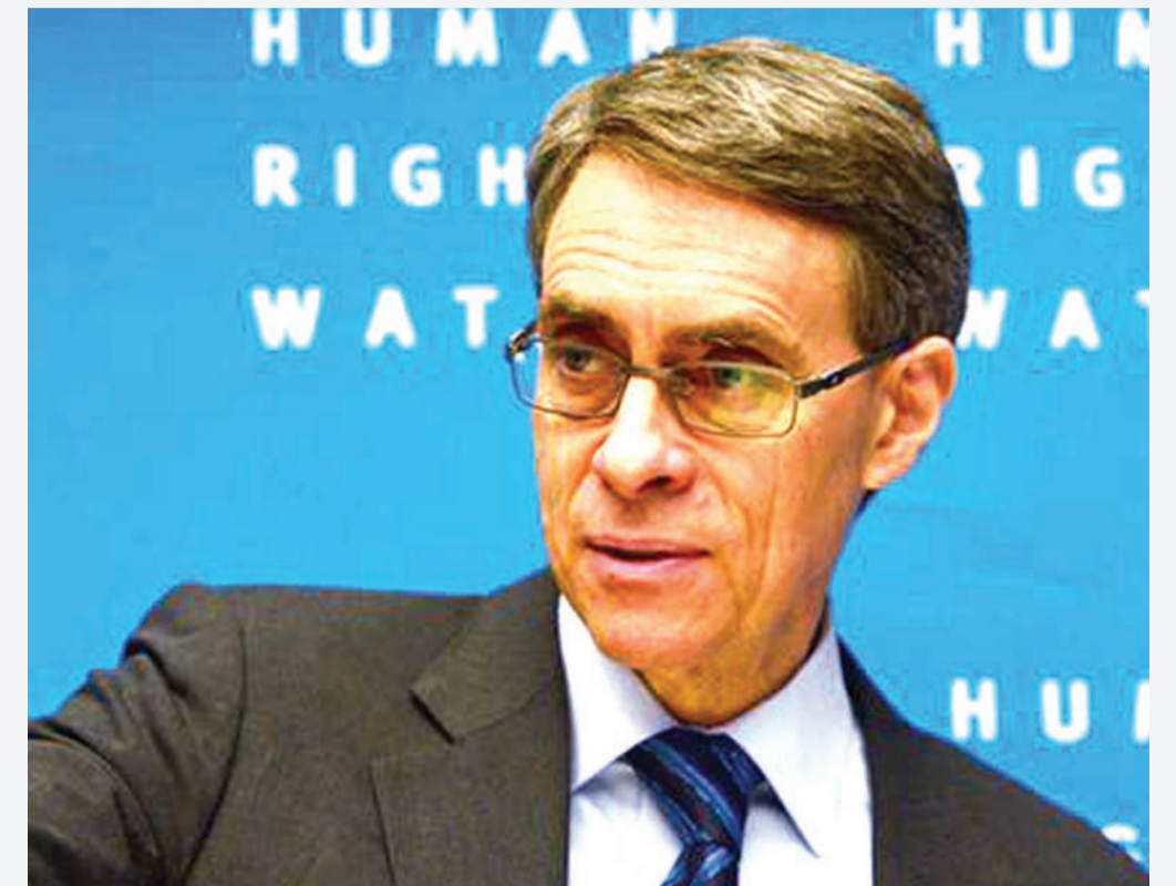
Mkurugenzi Mkuu wa Shirika la Kutetea Haki za Binadamu la Human Rights Watch, Kenneth Roth.

N I miaka 70 sasa tangu kusainiwa kwa mikataba minne ya Geneva, iliyoweka msingi wa sheria ya kimataifa ya kulinda haki za binadamu. Hata hivyo, ingawa nchi 196 zimetia saini mikataba hiyo, utekelezaji wake bado unasuasua.