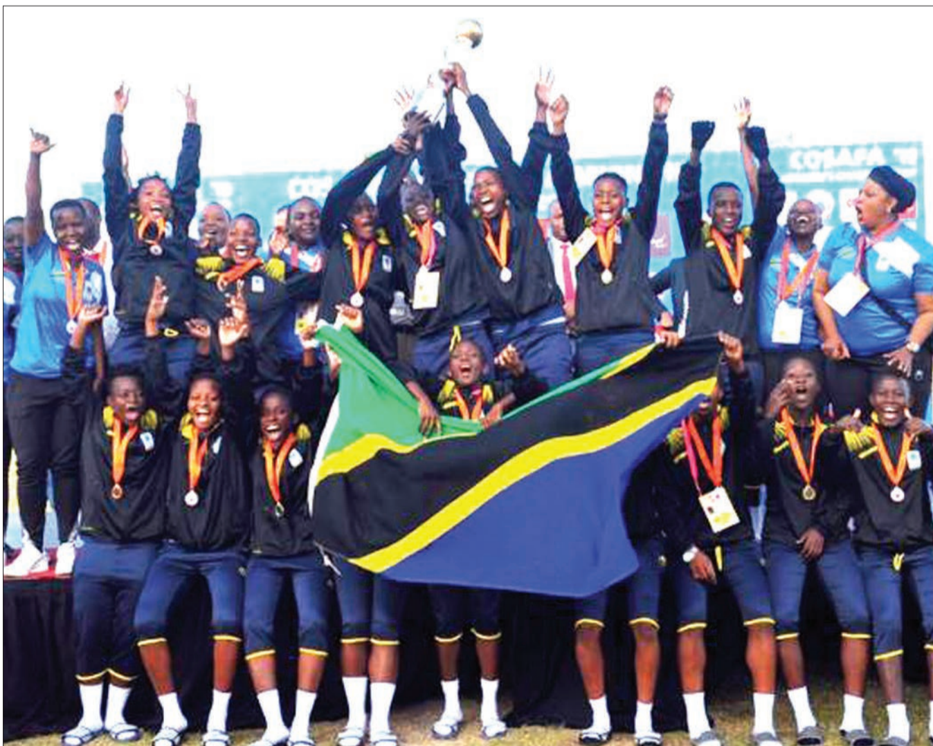
Mbingwa wa Cosafa U-20, Timu ya Taifa ya Wanawake ya Tanzania chini ya miaka 20 (Tanzanite), wakisherehekea na kombe lao baada ya kuitwaa nchini Afrika Kusini kwa kuifunga Zambia 2-1 kwenye mechi ya fainali juzi.