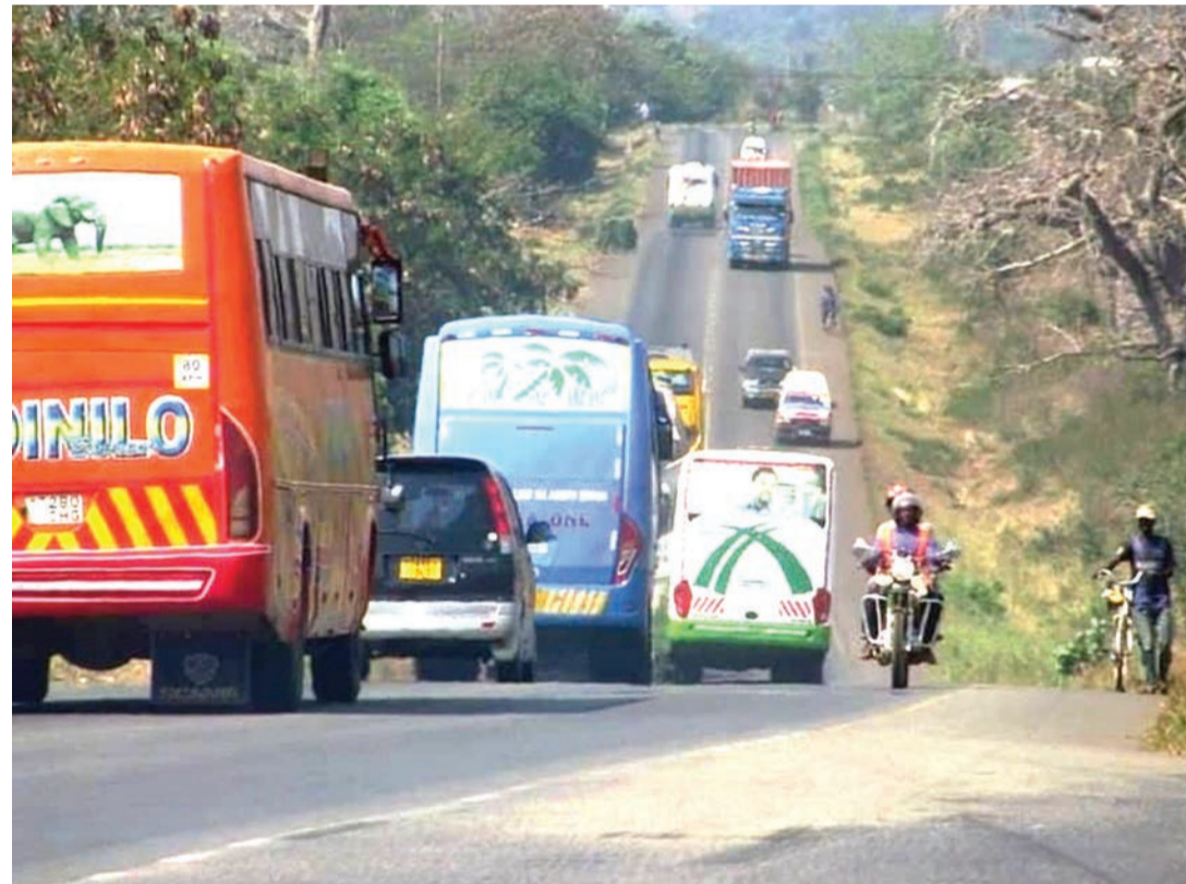
Ndiyo namna magari yasivyofuata sheria za usalama barabarani. PICHA ZOTE: MTANDAO

Mfumo huu unaohusisha kampuni binafsi zilizopewa kazi na LATRA kufunga vifaa maalum kwenye mabasi ili kuweza kusoma kuanzia namba za basi husika, mahali lilipo, linapopita pamoja na mwendo wake, umefanyiwa majaribio tangu mwaka 2017, na sasa unatumika rasmi kwenye mabasi zaidi ya 3.323 yanayofanya safari zake mikoja mbalimbali nchini.