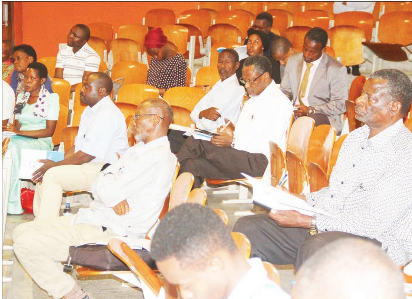
Wanahisa wa Kampuni ya TCCIA Investment PLC wakifuatilia mada katika Mkutano Mkuu wa 14 wa Mwaka uliolengea kujadili ukaguzi wa mahesabu na kutoa mapendekezo katika kuboresha utendaji wa kampuni hiyo ili kuongeza faida katika uwekezaji, jijini Dar es Salaam.

“Ni jambo la kushangaza tunafanikiwa kuuza hadi tani 2,000 huko Congo, tunatarajia kujitana zaidi kwenye nchi nyingine, wakati nchini kuna miradi mikubwa inaendelea tungeweza kuuza zaidi bidhaa zetu,” alisema.