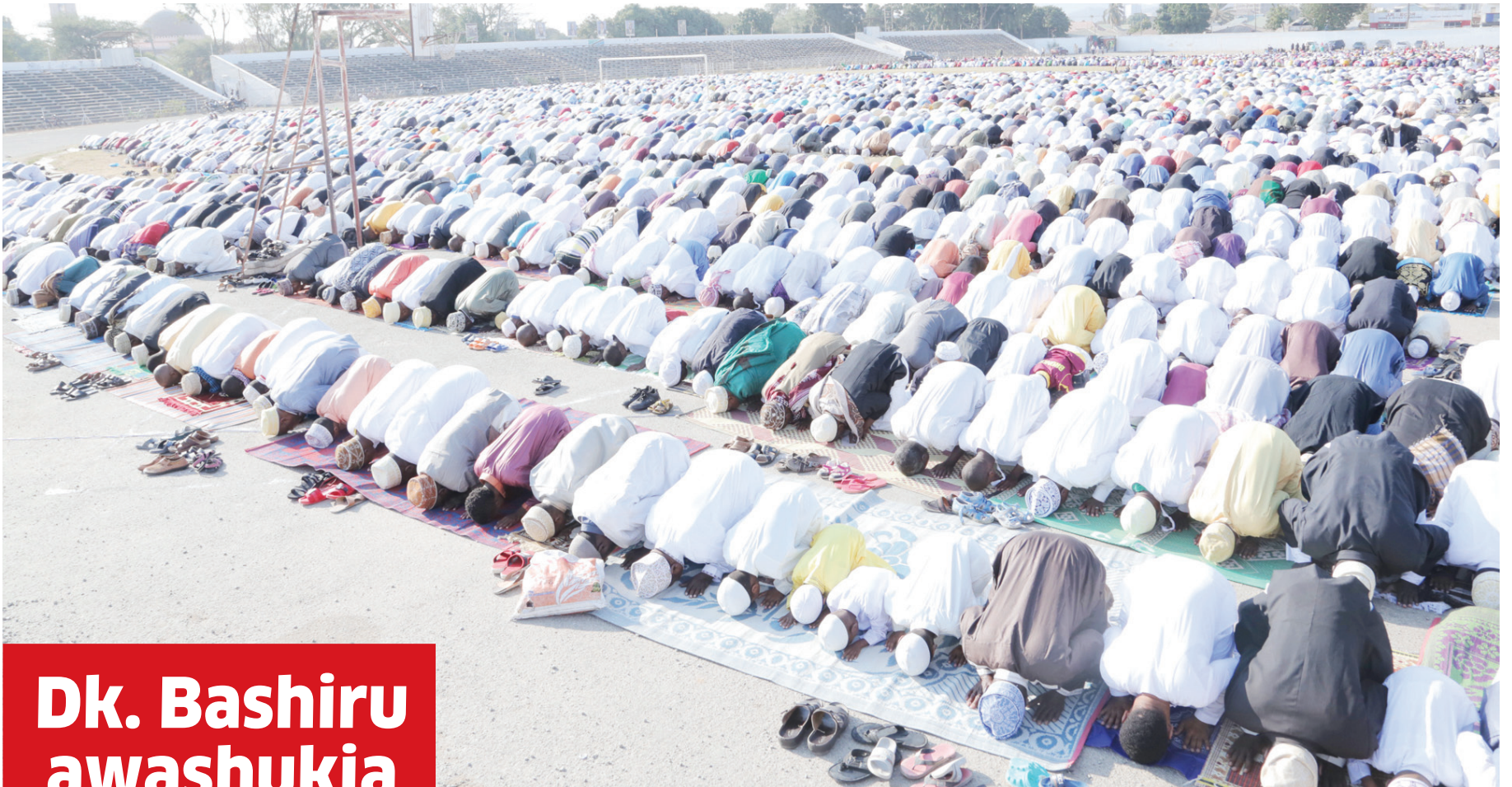
Baadhii ya waumini wa dini ya Kiislamu Mkoa wa Dodoma, wakishiriki Swala ya Eid El Haji, katika Uwanja wa Jamhuri, jana.

• Hoja mahsusi sasa kutinga bungeni, Wizara yakubali kupokea malalamiko, yataja hatua kuchukua... Endelea ukurasa wa 2