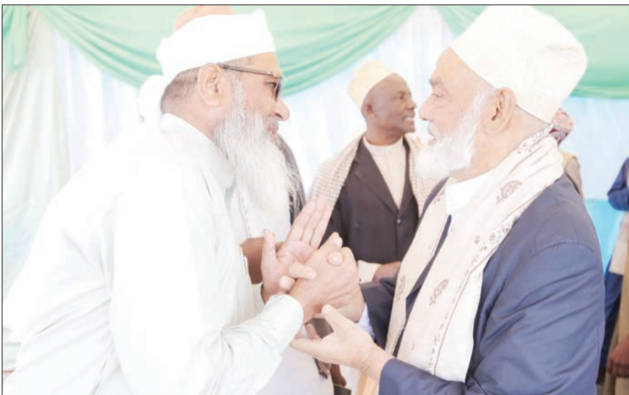
Waumini ya dini ya Kiislamu wakitakiana heri ya sikukuu ya Eid El Haji, baada ya kumalizika kwa swala, katika uwanja wa Jamhuri jijini Dodoma jana.