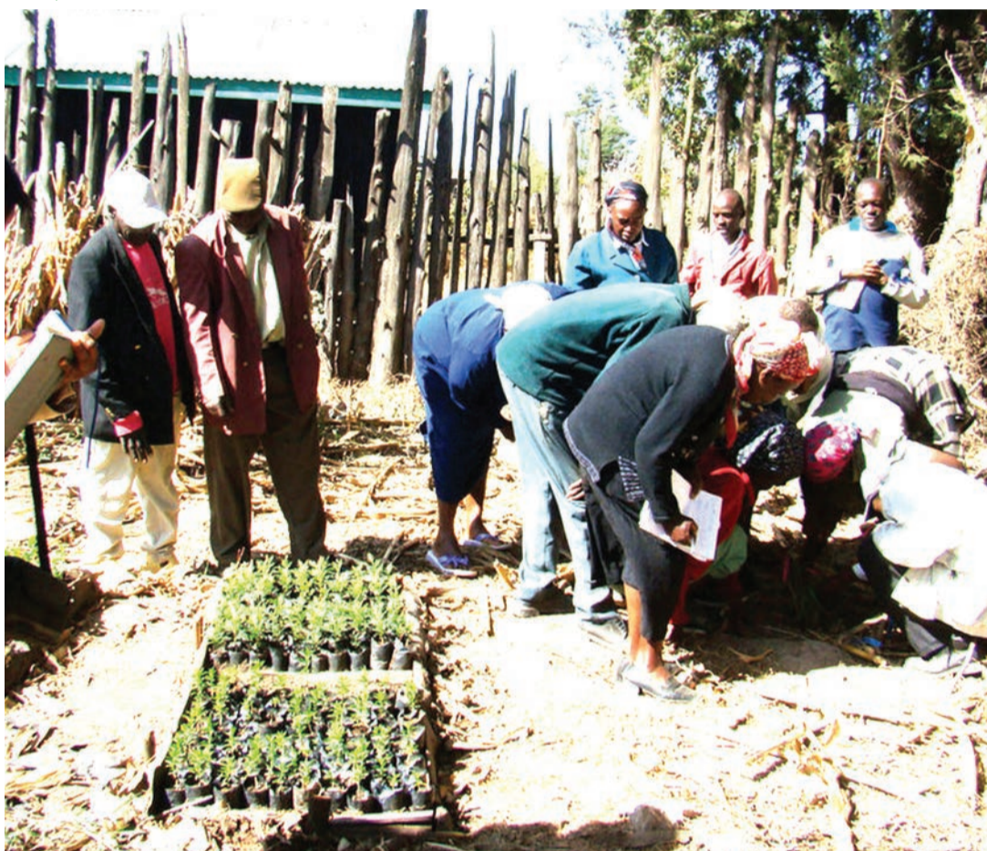
Vitalu vya miti ambayo inasaidia kukabiliana na mabadiliko ya tabianchi.