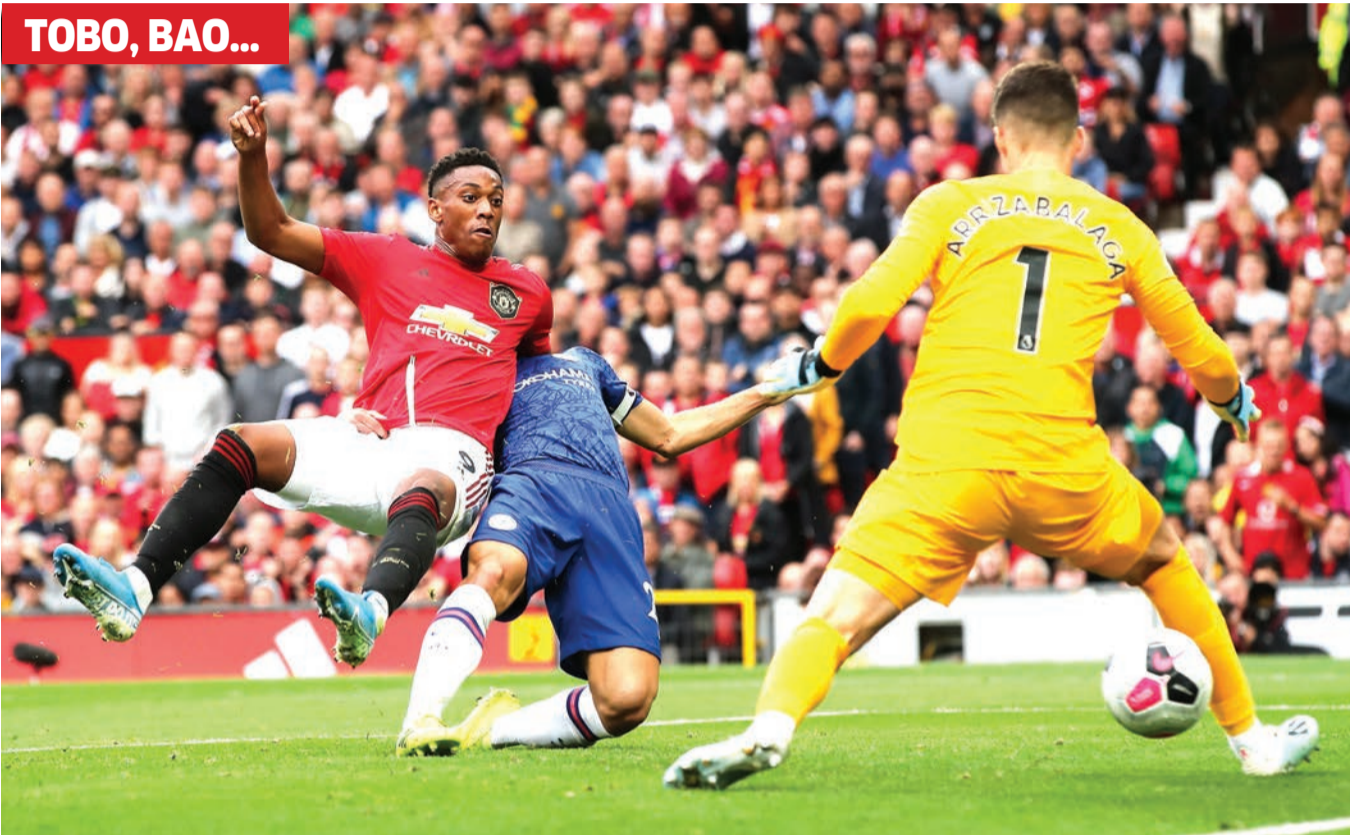
Mshambuliaji wa Manchester United, Mfaransa Anthony Martial, akizamisha mpira kimyani kwa kumpiga 'tobo' kipa wa Chelsea, Kepa Arrizabalaga kwenye mechi ya Ligi Kuu England iliyopigwa Uwanja wa Old Trafford juzi. HABARI UK. 29