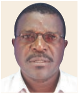
WADAU SABATO KASIKA

ZAMANI shule za msingi na sekondari zilitoa vipaji vya wanamichezo mbalimbali walioleta sifa kwa nchi kitaifa na kimataifa tofauti na sasa. Tatizo liko wapi na nini kifanyike kurejesha hadhi hiyo? Wadau wanajadili.