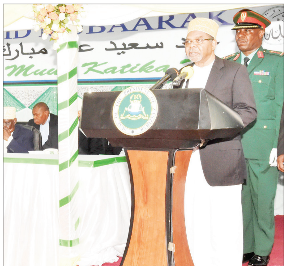
Rais wa Zanzibar na Mwenyekiti wa Baraza la Mapinduzi, Dk. Alhaj Ali Mohamed Shein, akihutubia Baraza la Eid El Haji, katika viwanja vya Dole, Wilaya ya Magharibi A Unguja jana.