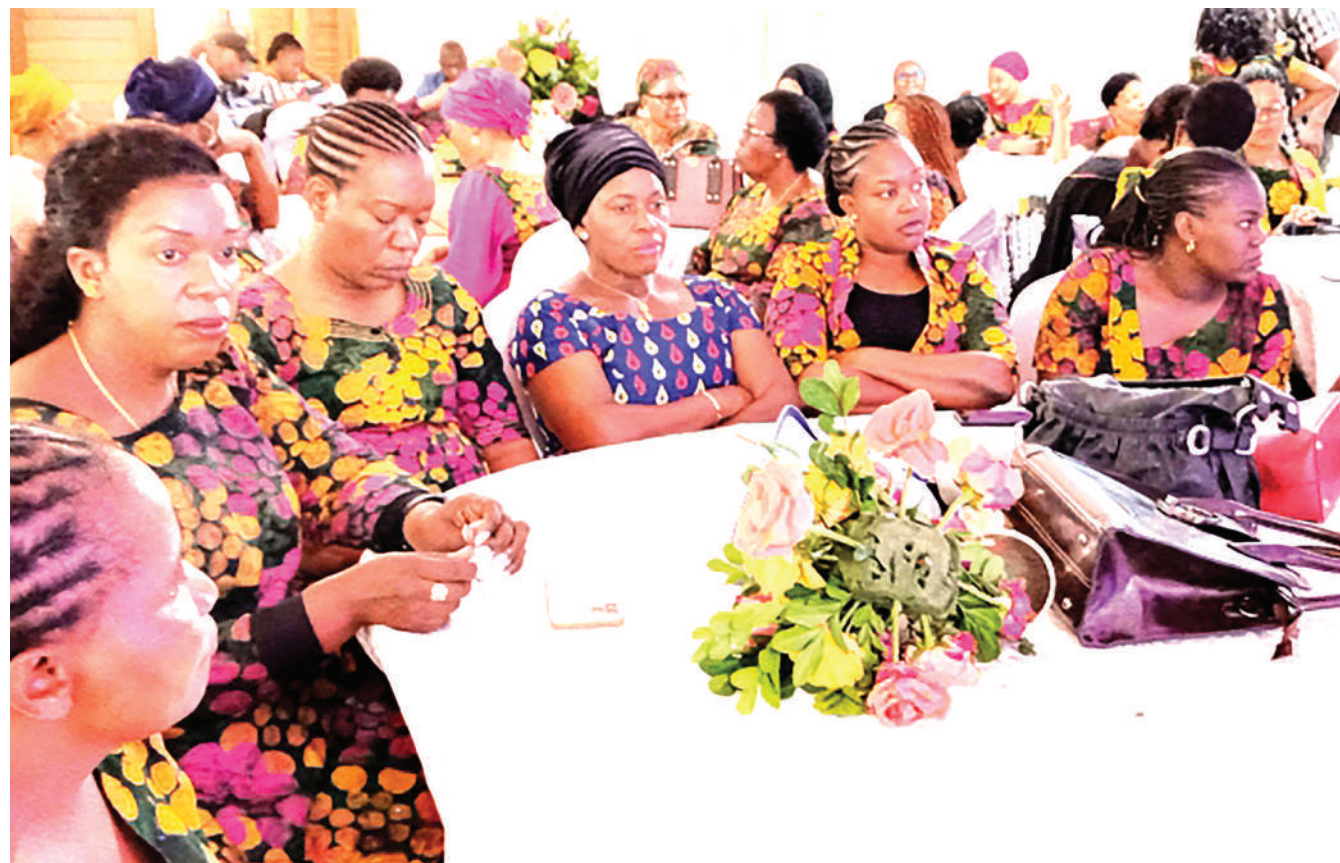
Sehemu ya wanachama 250 wa Jukwaa la Wanawake wa Saccos Taifa kutoka mikoa yote nchini, wakishiriki mkutano wa kujadili masuala mbalimbali yanayohusu ushirika, akiba, mikopo, elimu, kuimarisha mahusiano pamoja na kubadilishana uzoefu ili kujiimarisha kiuchumi na kupata fursa mbalimbali, jijini Mwanza jana.