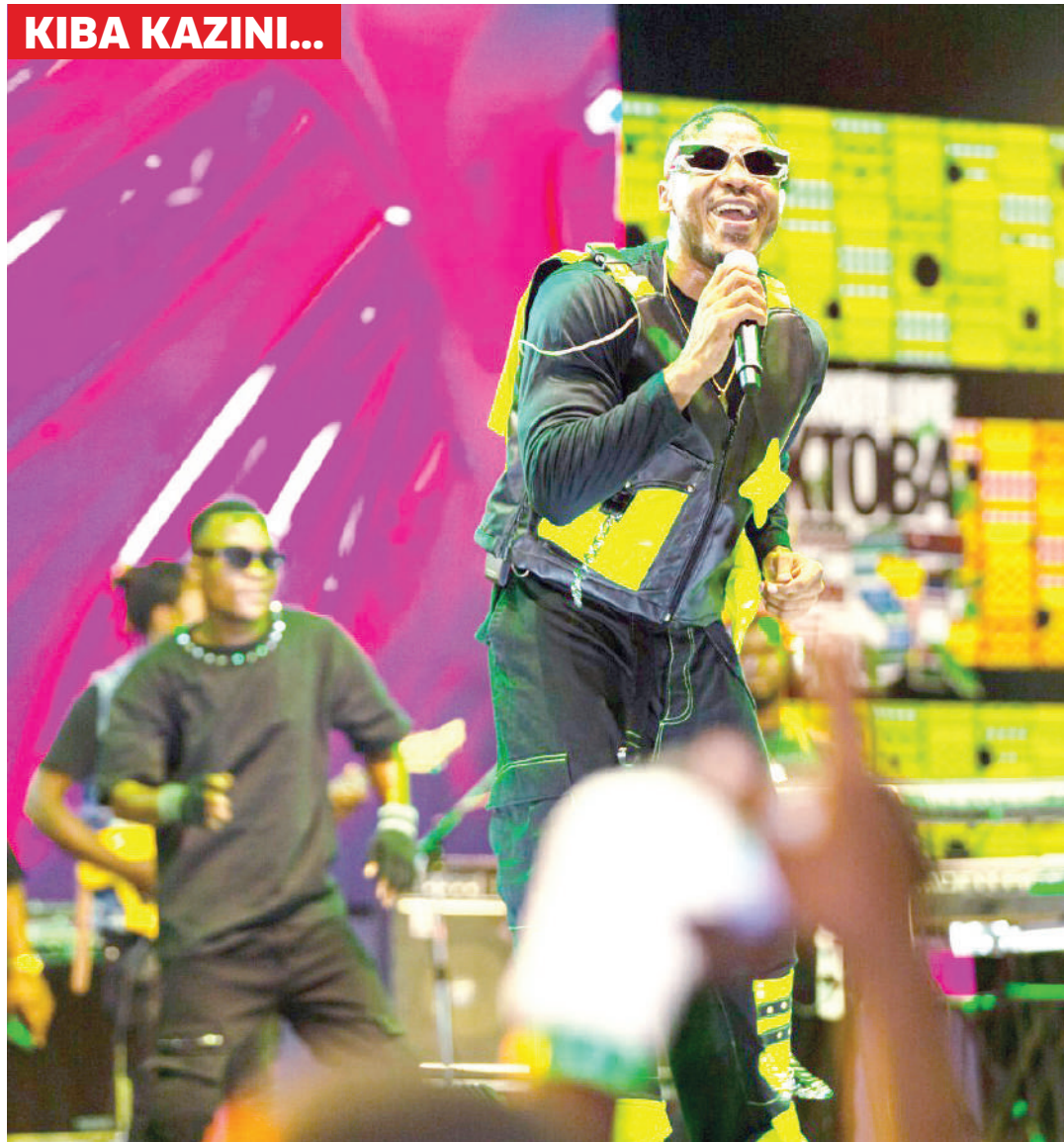
Msanii wa Bongo Flewa, Ali Kiba, akitumbuiza wakati wa Tamasha la Serengeti Lite Oktobafest, lililofanyika katika Fukwe za Coco Beach jijini Dar es salaam, mwishoni mwa wiki.