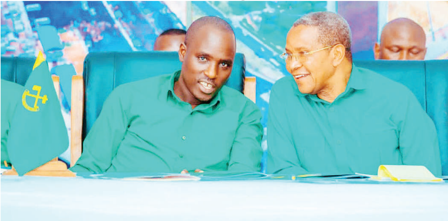
Naibu Waziri Mkuu na Waziri wa Nishati, Dk. Dotto Biteko, (kushoto), alipokutana na Rais mstaafu Jakaya Kikwete, jimboni Chalinze hivi karibuni.