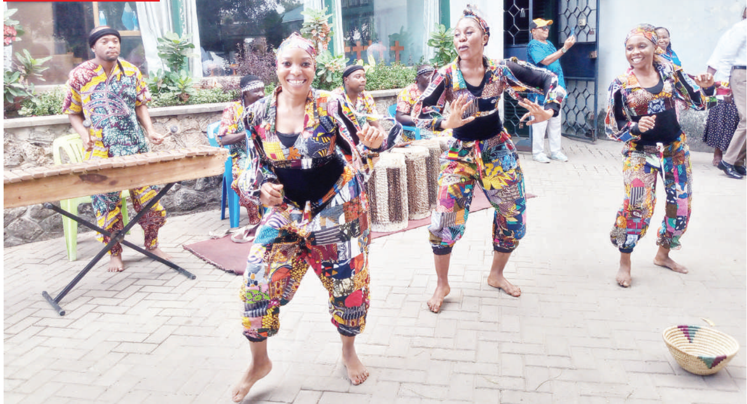
Wasanii wa Ngoma za Asili wa Kundi la Msanii Theatre, wakitoa burudani jana katika mkutano wa kimataifa wa siku tatu wa Mabibi unaoendelea katika viwanja vya Msimbazi Centre jijini Dar es Salaam.