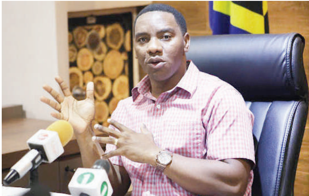
Paul Makonda, Katibu wa Halmashauri Kuu ya CCM, Itikadi na Uenezi.