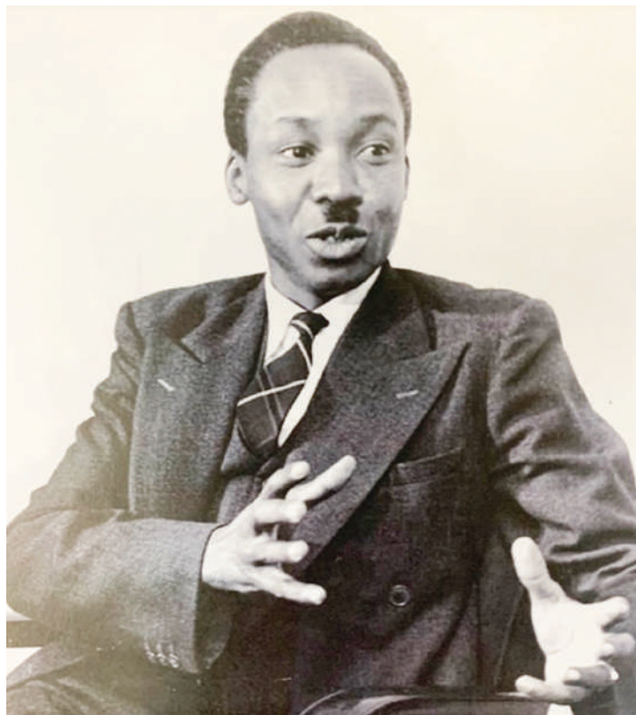
Baba wa Taifa, Mwalimu Julius Nyerere, mwasisi wa falsafa ya mambo manne yanayohitajika ili kupata maendeleo.

Kufanikiwa kwa haya yote yanategemea utendaji kazi wa viongozi wenye dhamira ya dhati ya kubadili maisha ya watu wanaowaongoza na kuwatumikia siyo kuwa kiongozi ili unufaike na wale unaowapenda.