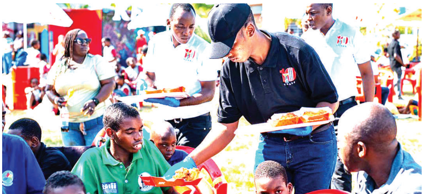
Wafanyakazi wa KFC, wakiwahudumia chakula watoto wakati wa sherehe za maadhimisho ya miaka 10 ya kampuni hiyo nchini, jijini Dar es Salaam juzi. Hafla hiyo, ilihudhuriwa na watoto 50 pamoja na walezi 10 kutoka Taasisi ya Baba Oreste, pamoja na watoto 50 na walimu 6 kutoka Shule ya Msingi na Awali ya Rightway.

Kwa upande wa Shule ya Sekondari Munduli, alisema ndani ya miaka mitatu ya uongozi wa Dk. Mwinyi ameshajenga madarasa 2,375 kati ya madarasa 525.