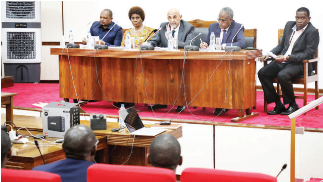
Naibu Spika wa Bunge, Mussa Azzan Zungu (katikati) akiongoza semina ya wabunge kuhusu matumizi ya matokeo ya Sensa ya Watu na Makazi ya Mwaka 2022 iliyofanyika jana katika Ukumbi wa Msekwa bungeni jijini Dodoma. Wa pili kushoto ni Spika mstaafu na Kamisaa wa Sensa ya Watu na Makazi, 2022, Anne Makinda.