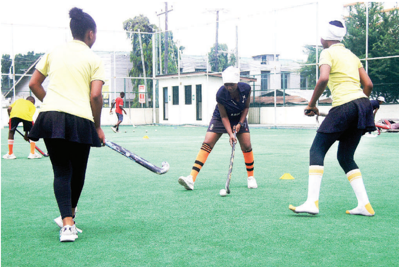
Wanafunzi wa Shule ya Sekondari Muza, wakifanya mazoezi ya mpira wa magongo katika viwanja vya Jakaya Kikwete jijini Dar es Salaam juzi.