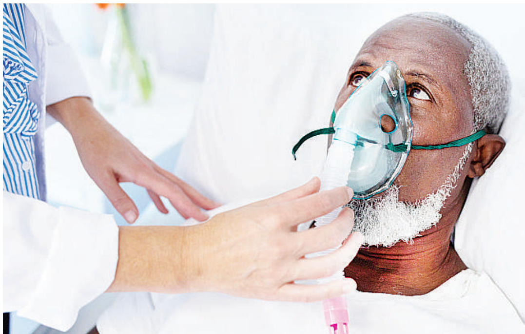
Mgonjwa wa UVIKO-19 akiwekewa mashine ya kupumulia.

Hata hivyo, baadhi ya mabadiliko yanaweza kuathiri mwenendo wa virusi, kama vile jinsi vinaoenea kwa kasi, urahisi, ukali wa ugonjwa unapoingia mwilini,