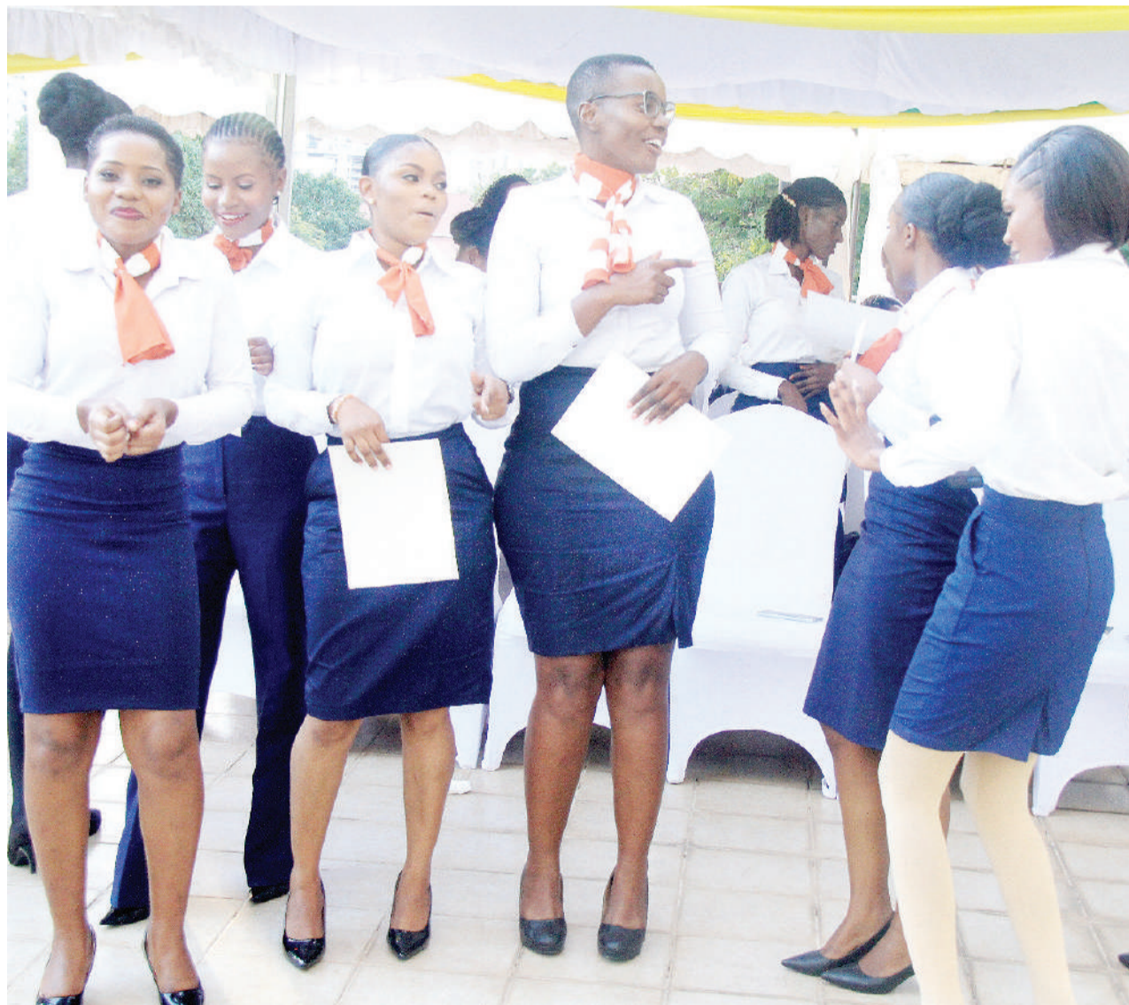
Wahitimu wa masomo ya Usalama katika ndege wakicheza muziki wakati wa mahafali ya sita ya Chuo cha Usalama wa Ndege cha Precision jijini Dar es Salaam juzi.