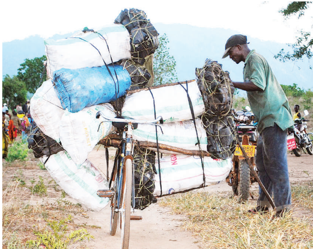
Mkaa kila mahali kwenye pikipiki, baiskeli na malori ni mamilioni ya miti yanayokatwa kwenye misitu ya asili.

Wakala au Mamlaka ilidhaniwa misitu ya asili itakuwa katika mikono salama, kwa mantiki kwamba uwezo wa kuisimamia na kuitunza utaongezeka kuliko ilivyokuwa chini ya idara.