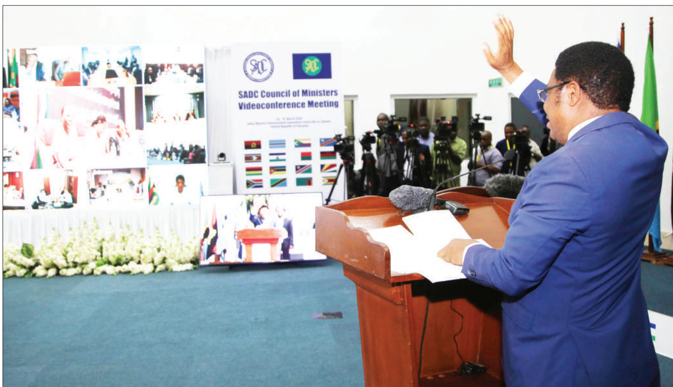
Waziri Mkuu, Kassim Majaliwa, akipunga mkono kuwaaga washiriki wa Mikutano wa Baraza la Mawaziri wa Jumuiya ya Maendeleo Kusini mwa Afrika (SADC), baada ya kufungua mkutano huo kwa njia ya video, kwenye Kituo cha Mikutano cha Kimataifa cha Julius Nyerere jijini Dar es Salaam jana.

"Tukifanya ukaguzi wa pamoja na taasisi za serikali unasaidia kuepuka mazingira ya rushwa kila taasisi ikienda kivyake kwa mwekezaji na kujitengeneza mazingira ya rushwa," alisema.