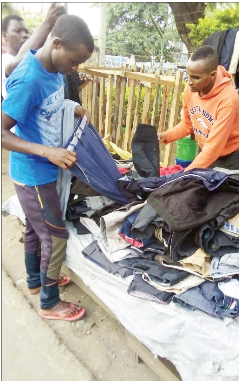
Mkazi wa Jiji la Arusha akichagua suruali za mtumba katika Barabara ya Idara ya Maji, jijini humo jana. Wananchi wengi wa kipato cha kati na chini hupendelea matumizi ya bidhaa za mitumba kutokana na unafuu wa bei.

Mafunzo hayo ya siku mbili yametolewa na Wizara ya Katiba na Sheria kwa kushirikiana na Mkoa wa Arusha, yaliwashirikisha viongozi wa dini na kimila kutoka mikoa ya Arusha na Manyara.