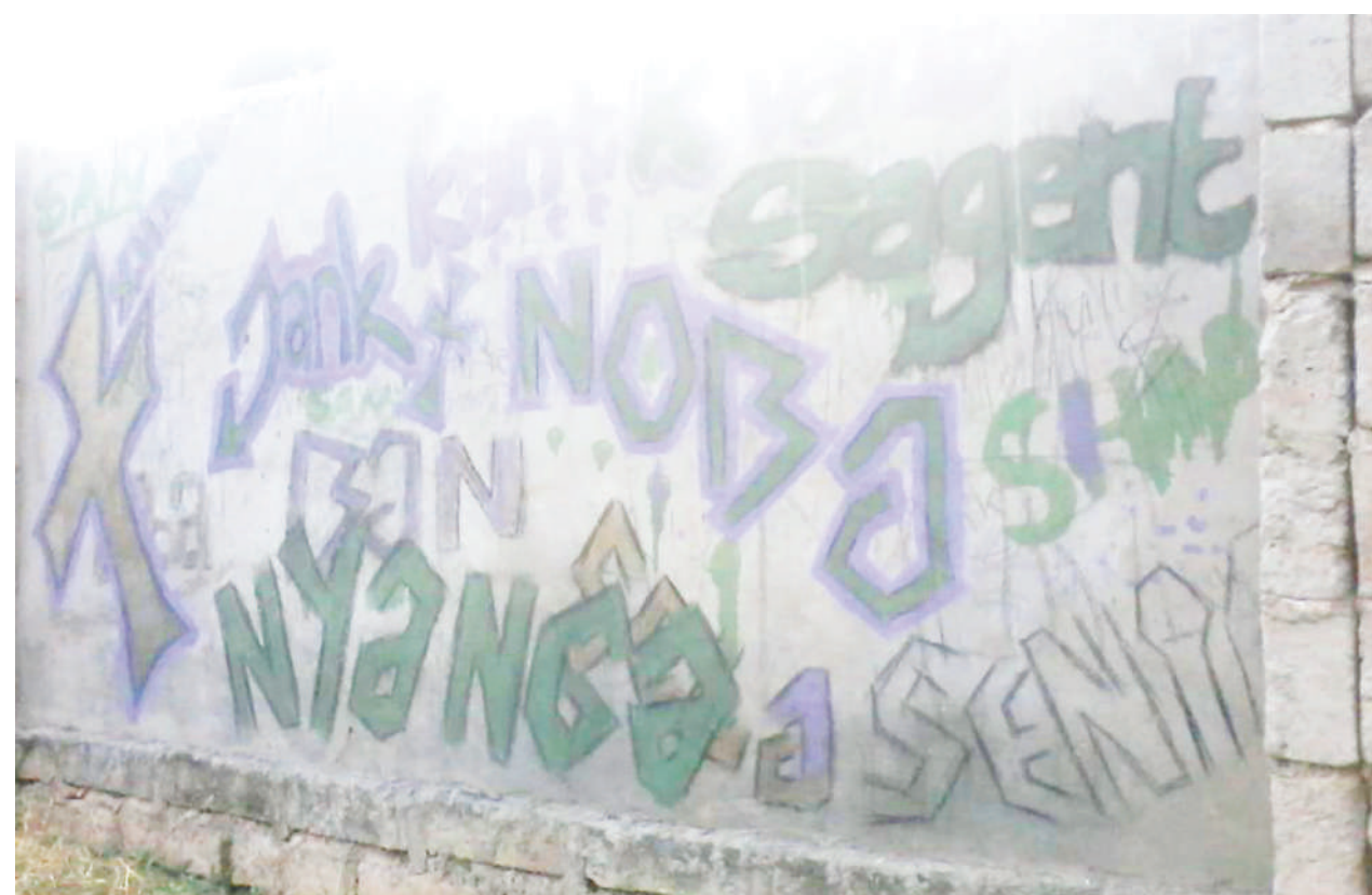
Majengo, ambayo yamechorwa na vijana watumiaji wa dawa za kulevya.

Ukizoea kutumia dawa hiyo unaweza kuwa 'addicted' (kuathirika) au kuandaa mateja wa baadae ambao mwisho wa siku hatari yake ni kuangukia kwenye dawa za kulevya.