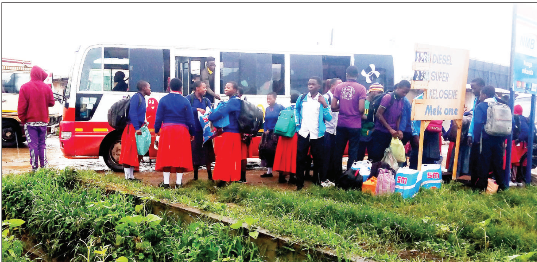
Wanafunzi wa shule mbalimbali za sekondari katika Halmashauri ya Wilaya ya Mbeya, wakihangaikia usafiri wa kurejea majumbani kwao kwenye kituo cha daladala katika Mamlaka ya Mji Mdogo wa Mbalizi, jana asubuhi, baada ya shule zote nchini kufungwa na Serikali kufuatia tishio la corona.