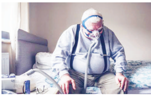
Mgonjwa mwenye maradhi hayo, akitumia mashine ya kupumua.