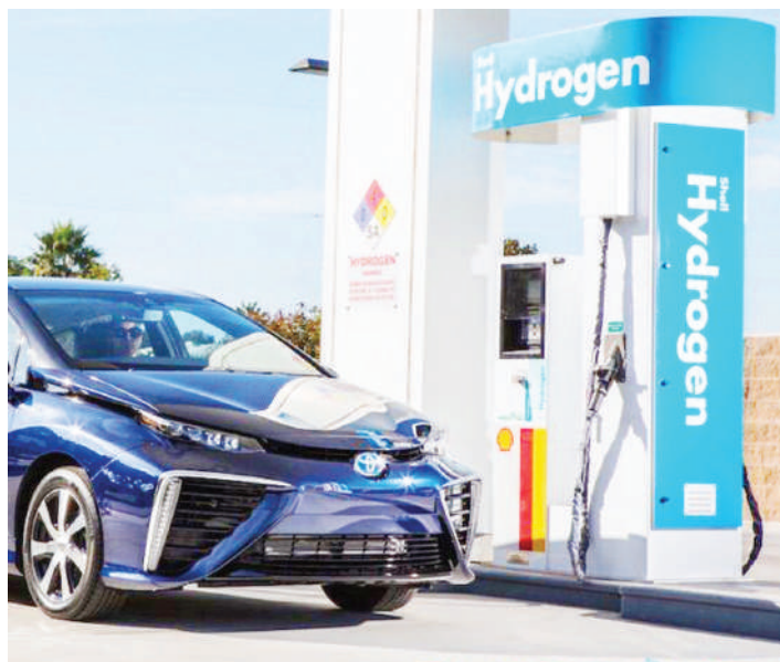
Gari inayotumia nishati ya mafuta.

Kuna wakati zilianza sera nchini Ufaransa, kutumia gari binafsi siku tatu kwa wiki na siku tatu na nyingine zilizobaki kwa wiki, inaachwa nyumbani.