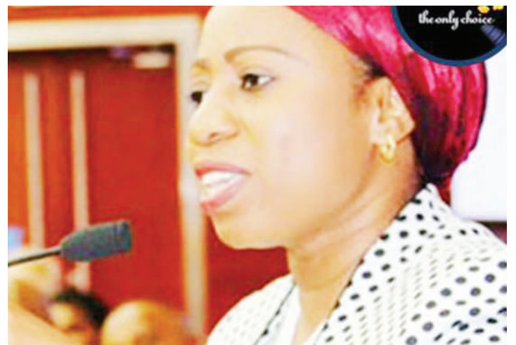
Waziri wa Afya, Maendeleo ya Jamii, Jinsia, Wazee na Watoto, Ummu Mwalimu, akinena jambo kuhusu corona kutua nchini.

JIBU: Haijathibitika kinga ya mwili ya muda mfupi inaweza kujengeka kwa virusi vya aina fulani vinavyosababisha ugonjwa wa COVID-19. Hata hivyo, bado