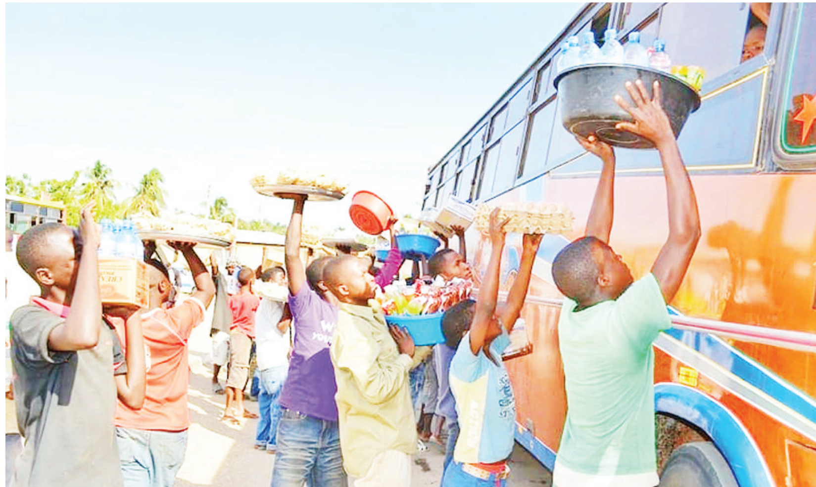
Vijana wanaofanya biashara Kimanzichana.

Ni mambo yanayofanyika ili walewe na na kuopata ujasi wa kutekeleza wanayotua, hususani