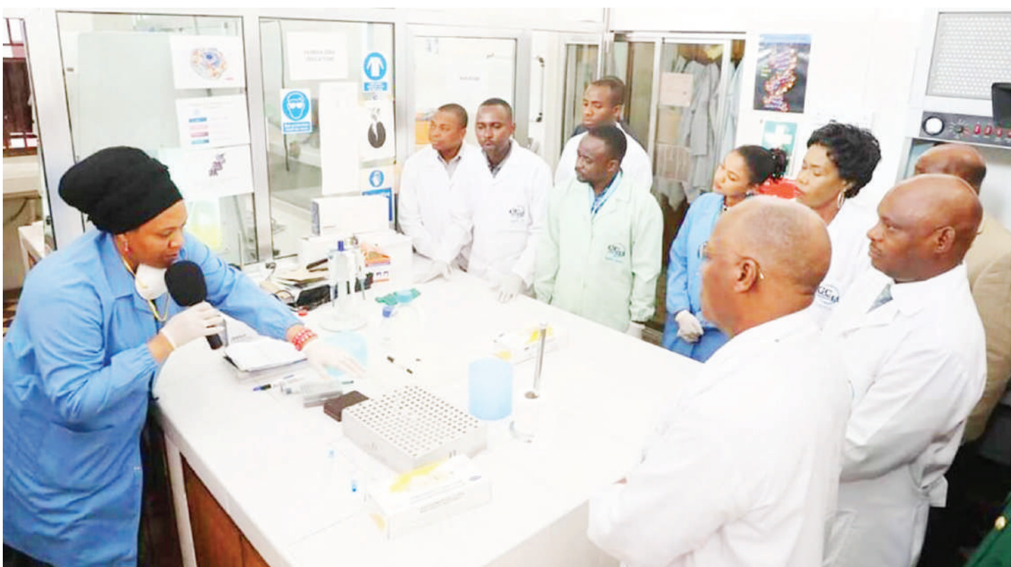
Rais Dk. John Magufuli, alipotembelea na kukagua utendaji kazi wa Maabara ya Mkemia Mkuu wa Serikali, jijini Dar es Salaam.