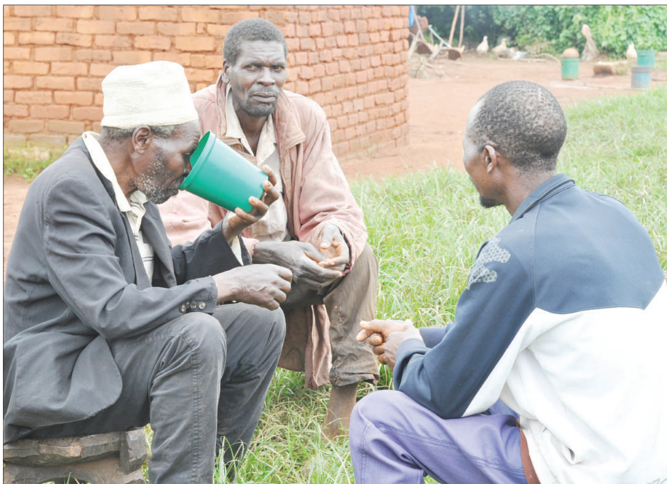
Wakazi wa Kijiji cha Isoliwaya, Kata ya Ihimbo, wilayani Kilolo, mkoani Iringa, wakiendelea na utamaduni wa kunywa pombe aina ya ulanzi kwa kupokezana kikombe cha lita maarufu kama "kilita" licha ya kuwapo kwa tishio la maambukizi ya virusi vya corona nchini.