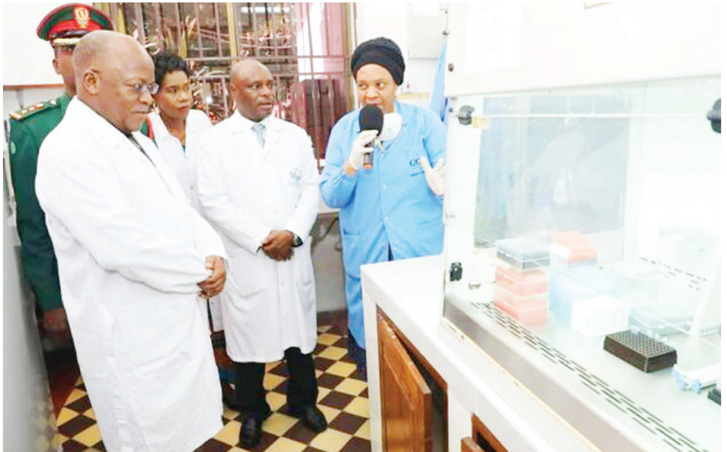
Rais Dk. John Magufuli akikagua maabara ya Mkemia Mkuu wa Serikali jijini Dar es Salaam.