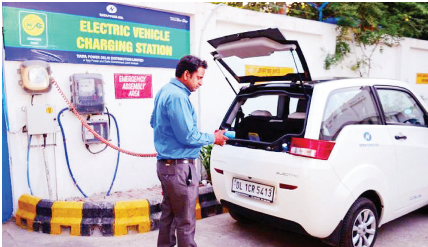
Gari inayotumia nguvu za nishati umeme, ikijaziwa nishati hiyo katika kituo maalum.