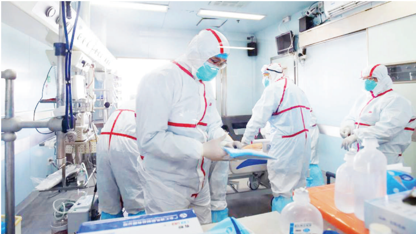
Matibabu hospitali kwa wagonjwa wa corona..