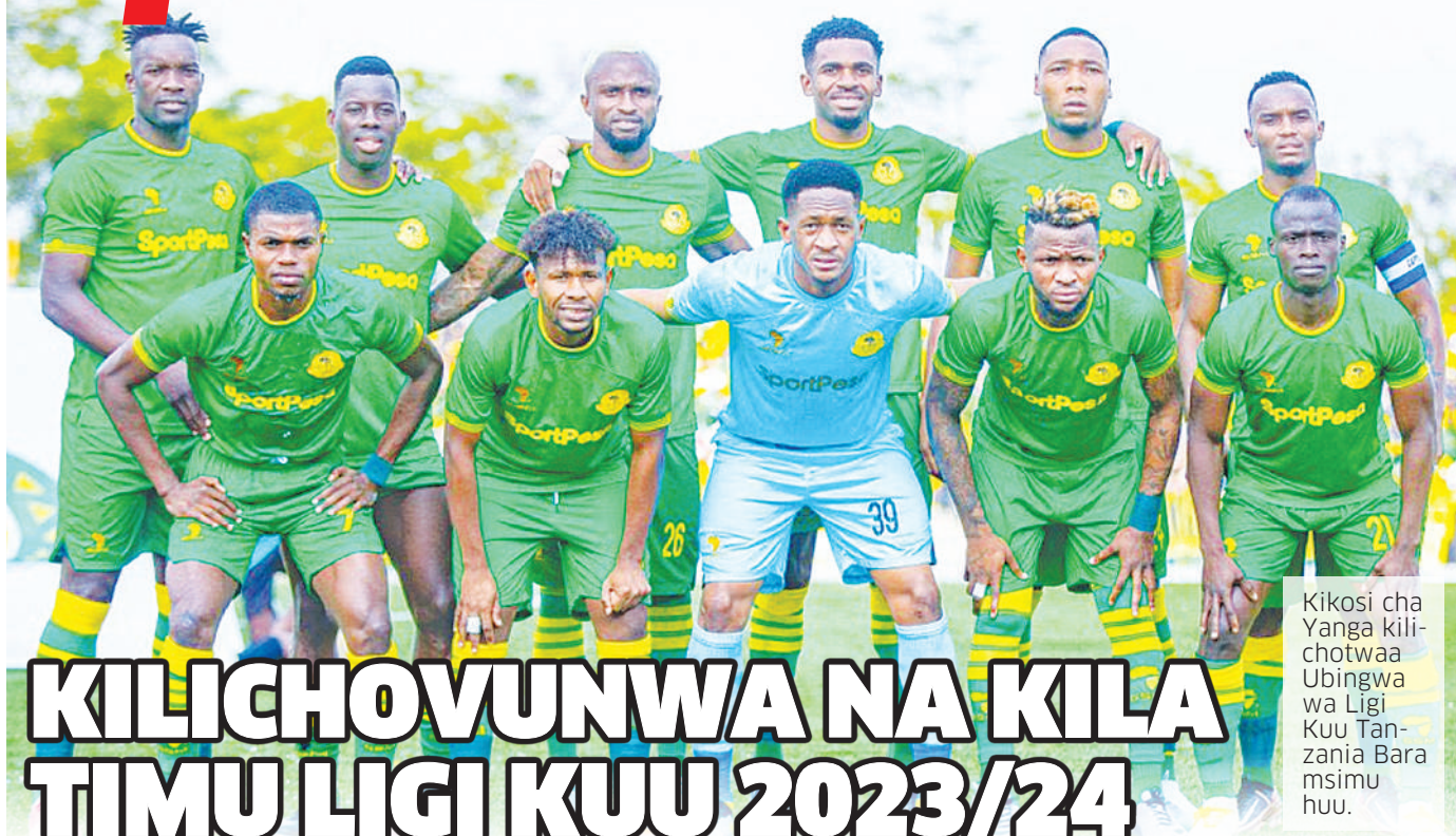
Kikosi cha Yanga kili- chotwaa Ubingwa wa Ligi Kuu Tanzania Bara msimu huu.