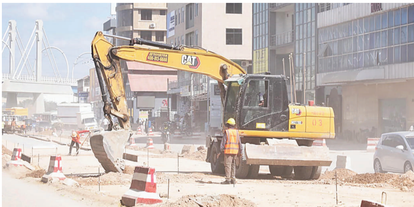
Mafundi Ujenzi wa Kampuni ya Synohyo Cooperation Limited kutoka nchini China wakiendelea na ujenzi wa Barabara ya Mabasi yaendayo Haraka (BRT) Awamu ya Tatu kutoka Gongo la Mboto kuelekea Posta kupitia Mnazi Mmoja kwa urefu wa Kilometa 23 ambapo tayari umefikia zaidi ya asilimia 83.

Malisa baada ya kuachiwa, alisema misukosuko aliyoipata haitamrudisha nyuma kwenye harakati za kutetea haki wananchi kwa kile alichodai kuwa yuko sahihi na alichokifanya.