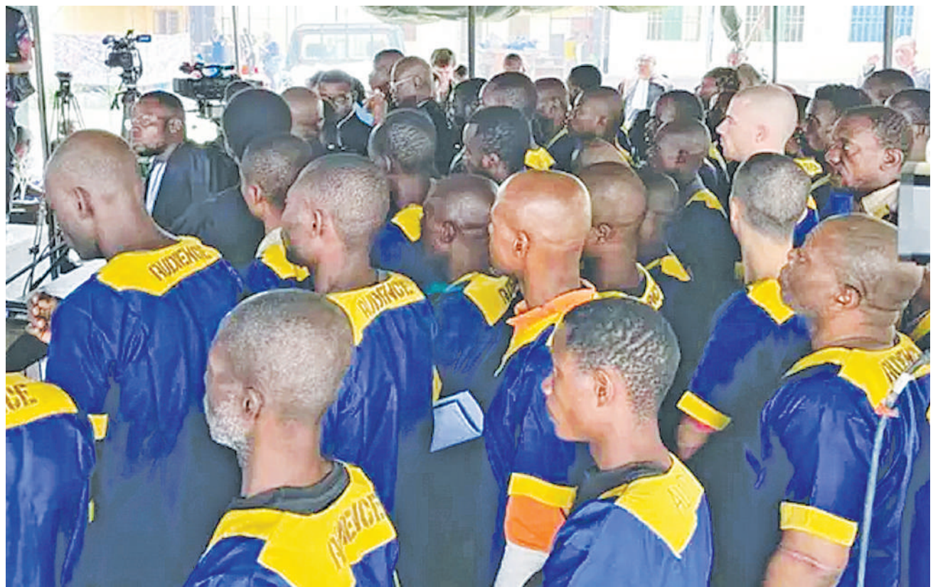
Wanaotuhumiwa kujaribu kumpindua rais wa Jamhuri ya Kidemokrasia ya Congo, wakiwa katika mahakama ya kijeshi katika mji mkuu wa Kinshasa.

Pia Oktoba 29, 2022, mabomu mawili yaliyotegwa ndani ya gari yalilipuka huko Mogadishu, na kuuwa watu 121 na wengine 333 kujeruhiwa. Ikielezwa kuwa lilikuwa shambulio baya zaidi kuwahi kutokea katika kipindi cha miaka mitano katika nchi hiyo. RFI