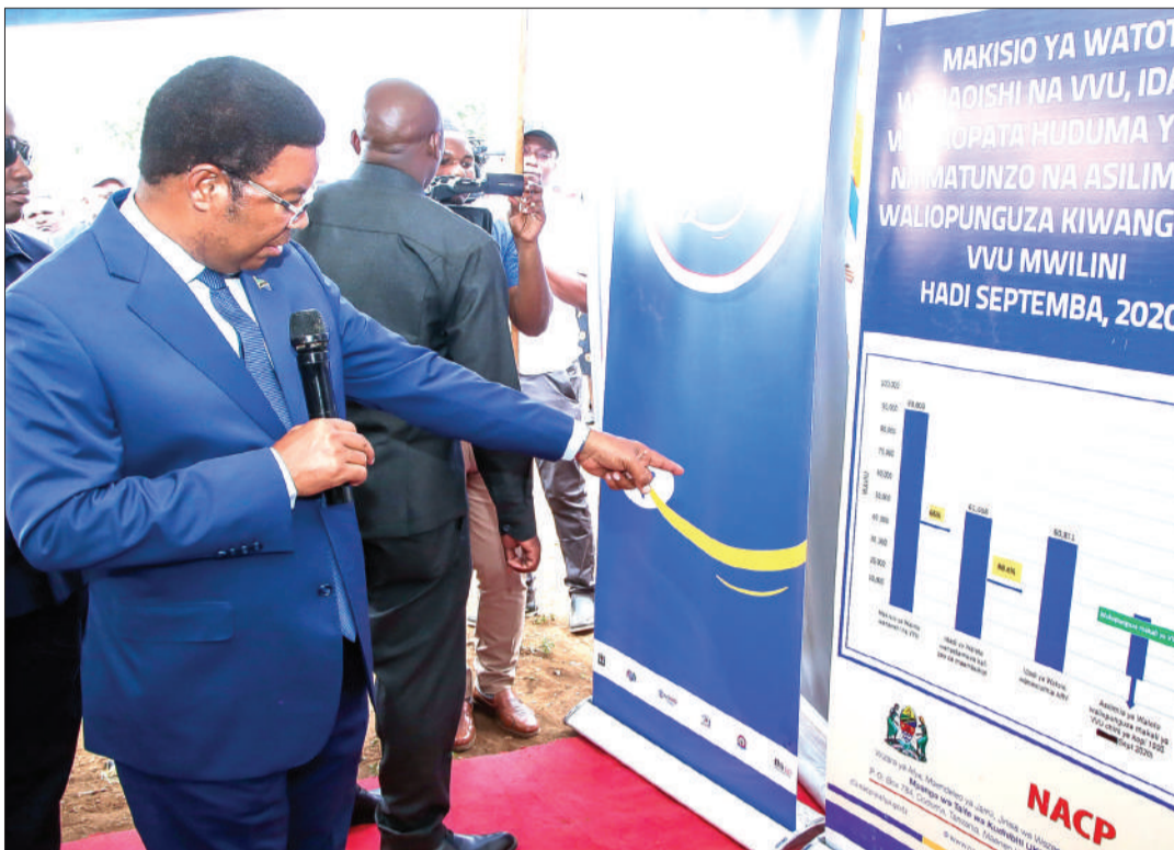
Waziri Mkuu, Kassim Majaliwa akiangalia mchoro unaoonyesha makisio ya watoto wanaoishi na VVU, kwenye banda la Kitengo cha Tiba na Mafunzo wa Mpango wa Taifa wa Kudhibiti Ukimwi (NACP), katika Maadhimisho ya Siku ya Ukimwi Duniani, yaliyofanyika kitaifa katika Uwanja wa Mandela, Manispaa ya Moshi, mkoani Kilimanjaro, jana.