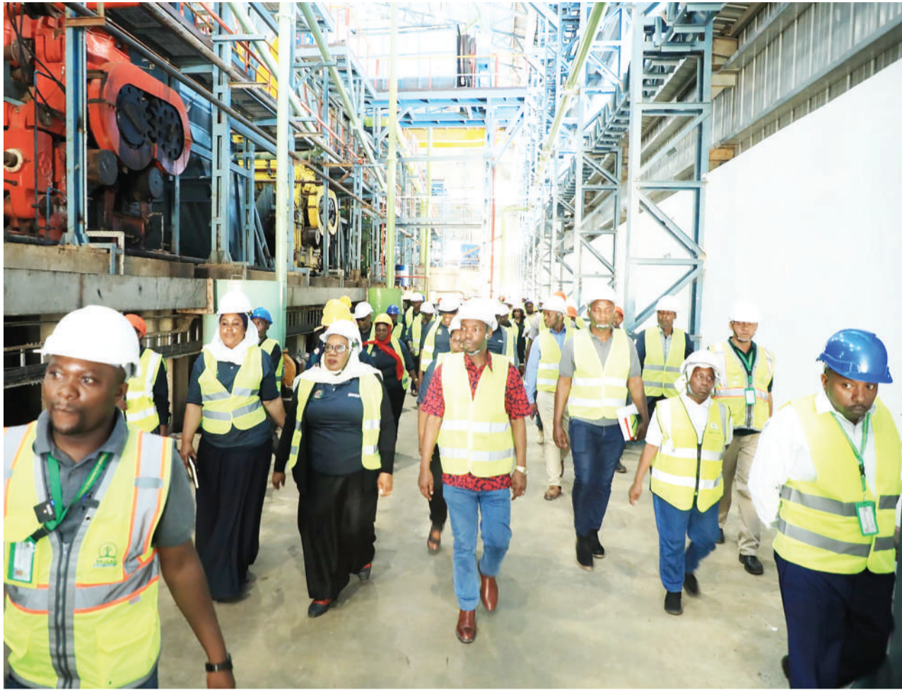
Wajumbe wa Kamati ya Kudumu ya Bunge, Ustawi na Maendeleo ya Jamii wakitembelea mradi wa kiwanda cha sukari Mkulazi, mkoani Morogoro juzi.