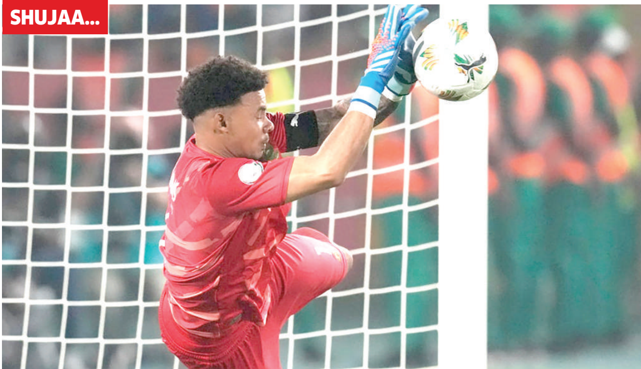
Kipa na nahodha wa Timu ya Taifa ya Afrika Kusini, Ronwen Williams, akicheza moja kati ya penalti nne alizookoa wakati wakishinda kwa mikwaju ya penalti 2-1 dhidi ya Cape Verde juzi kwenye mechi wa robo fainali ya michuano ya Mataifa ya Afrika (AFCON) 2023, zinazoendelea nchini Ivory Coast.