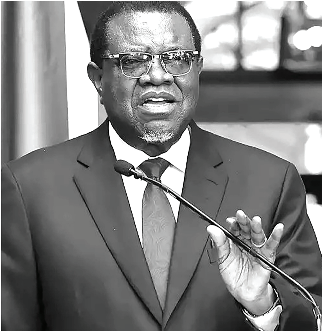
Aliyekuwa Rais wa Namibia, Hage Geingob.