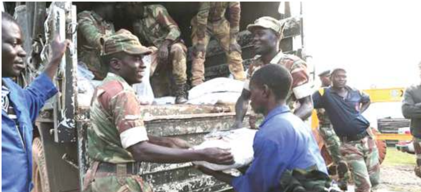
Jeshi la Msumbiji likigawa msaada wa chakula kwa wananchi wa nchi hiyo, ambao wameathirika na mafuriko pamoja na kimbunga.