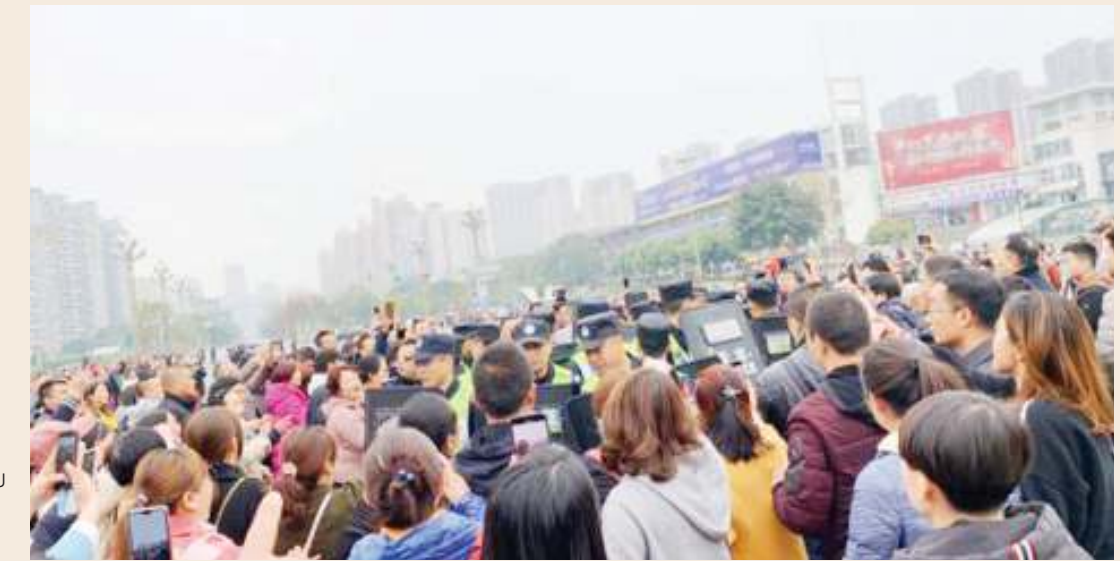
Wazazi wakiandamana. Picha ndogo ni: Sehemu ya vyakula vilivyooza.