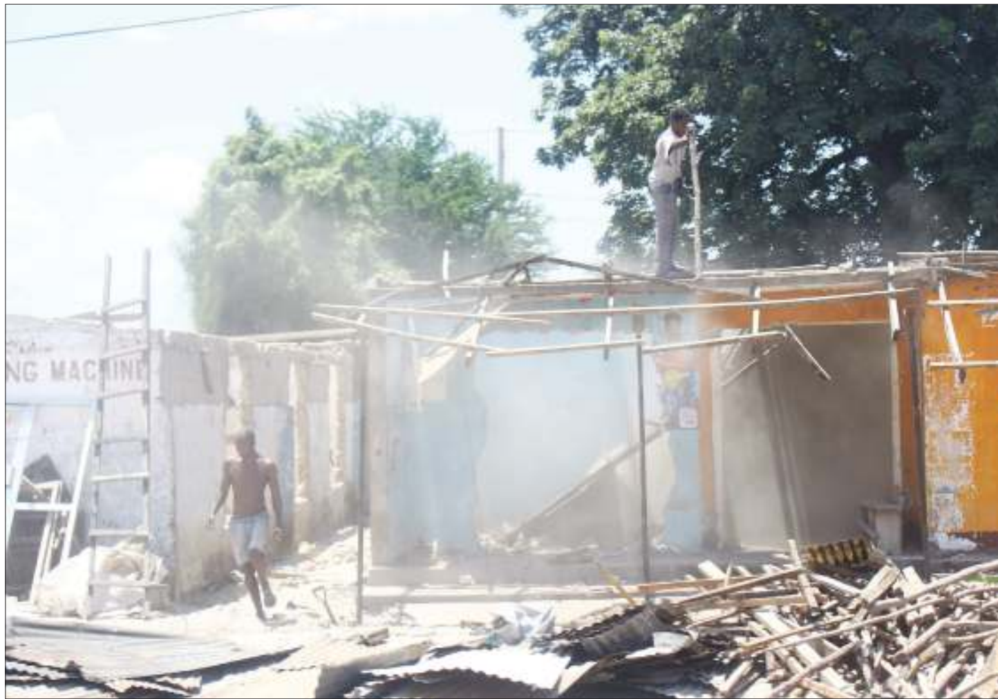
Mafundi wakibomoa nyumba ili kupisha ujenzi wa reli ya kisasa ya Standard Gauge katika eneo la Ukonga, jijini Dar es Salaam jana.