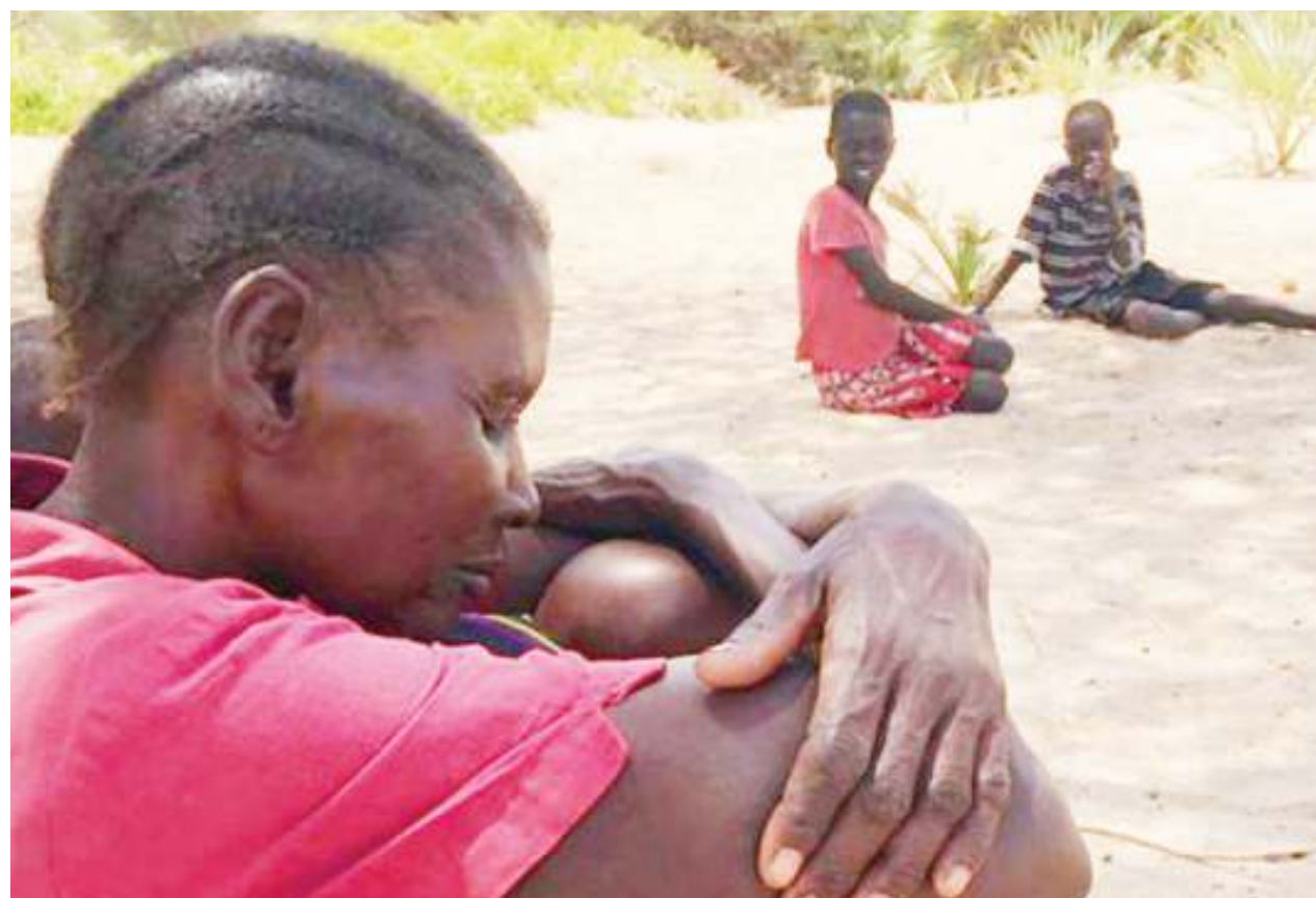
Mama mwenye simanzi ya janga la njaa, akiwa na wanawe.

Kwa sababu ya ukosefu wa chakula, wanafunzi wengi wanajiunga na wazazi wao kutafuta chakula popote watakapopata. Kwa hiyo, hawawezi kufika shuleni.