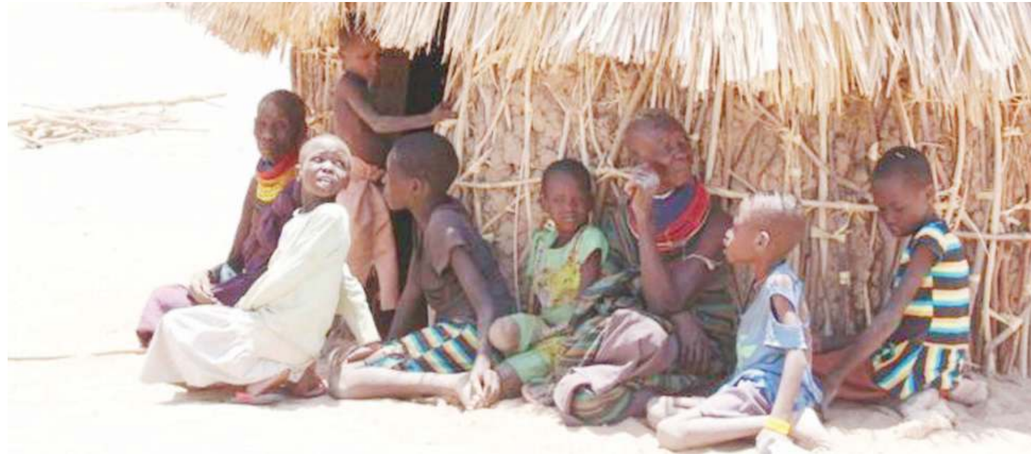
Familia ikiwa nje ya nyumba yao wakijitafakari kuhusu njaa.