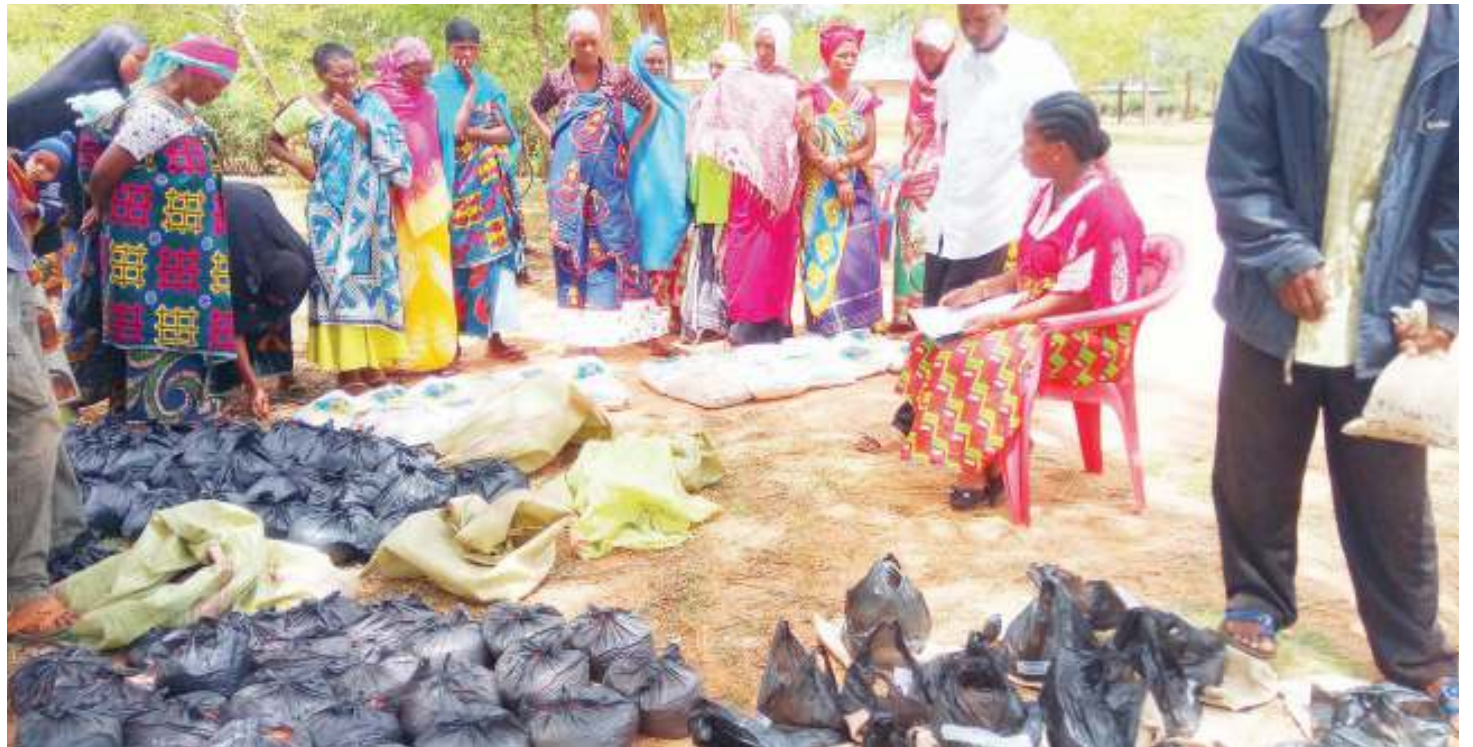
Wananchi wa kijijini Kibaoni, wakipatiwa mbegu za jamii ya mikunde kutoka shirika la ActionAid Tanzania, kwa ajili ya kilimo mseto.