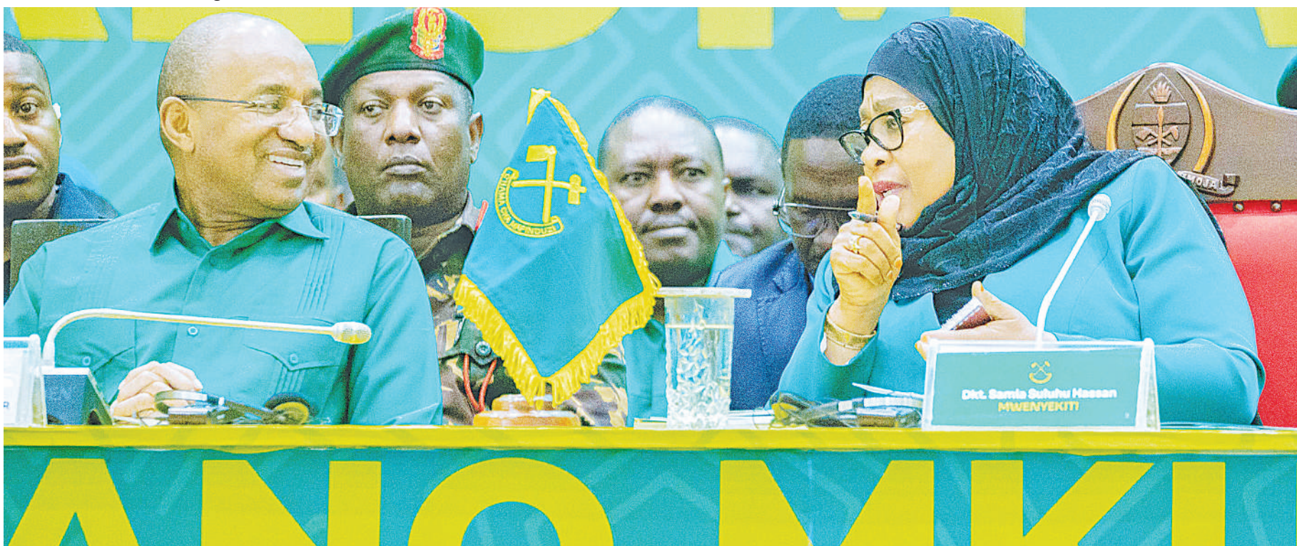
Mwenyekiti wa Chama Cha Mapinduzi (CCM) Taifa, Rais Dk. Samia Suluhu Hassan (kulia), akijadiliana jambo na Makamu Mwenyekiti Zanzibar, Rais Dk. Hussein Ali Mwinyi, wakati wa siku ya pili ya Mkutano Mkuu Maalumu wa Chama hicho, jijini Dodoma jana.

• CCM yawapitisha Samia, Mwinyi kuwania urais 2025, miradi ya kimkakati yawabeba... Endelea ukurasa 2 & 3