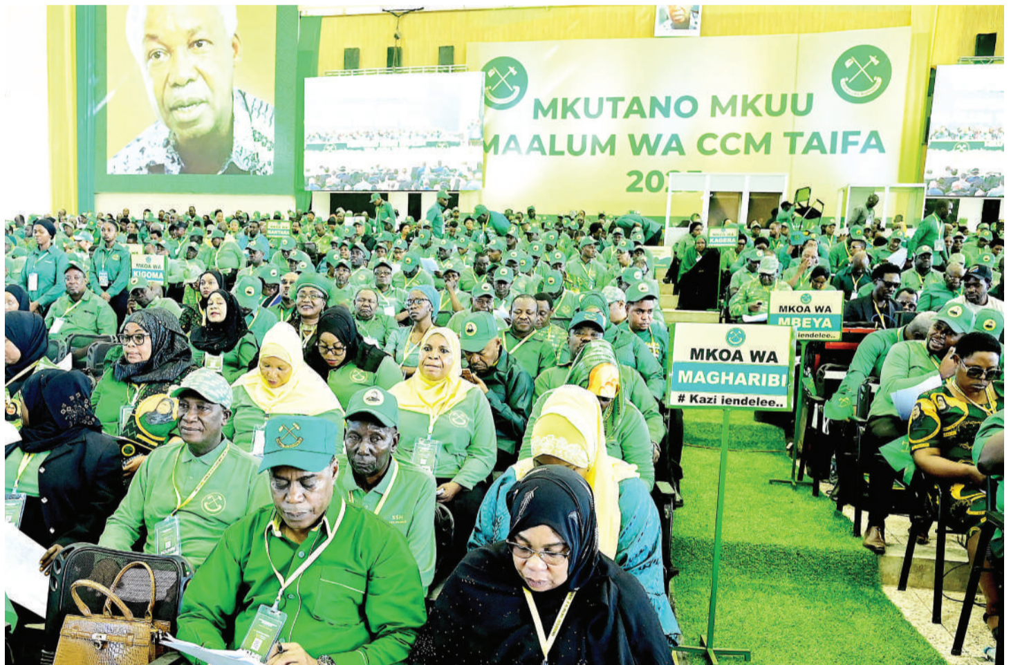
Sehemu ya Wajumbe wa Mkutano Mkuu Maalum wa CCM Taifa, wakiwa kwenye Mkutano huo, jana.