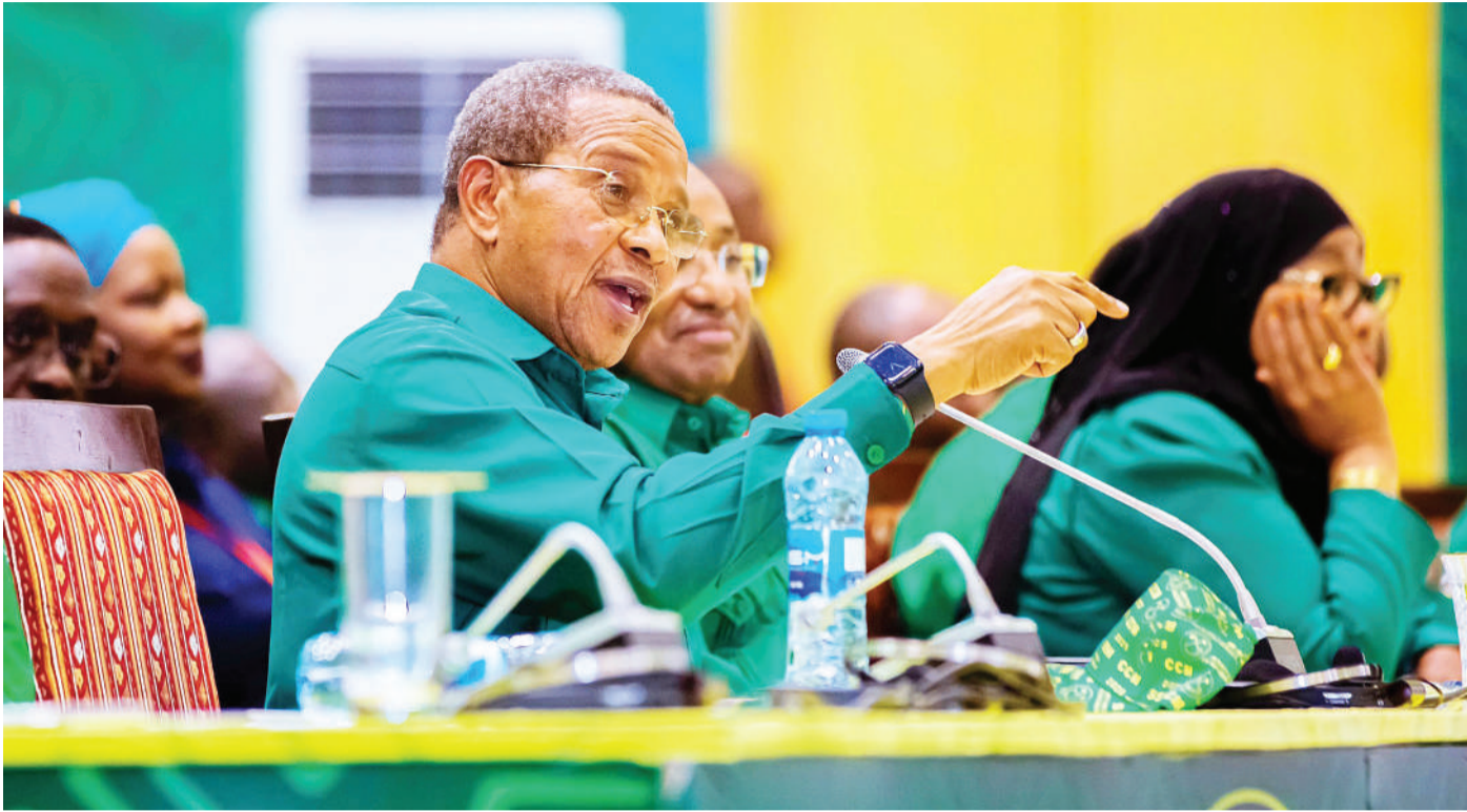
Mwenyekiti mstaafu wa Chama Cha Mapinduzi (CCM) Taifa na Rais mstaafu, Jakaya Kikwete akitoa ushauri kwenye mkutano Mkuu maalumu wa chama hicho, jijini Dodoma, jana.