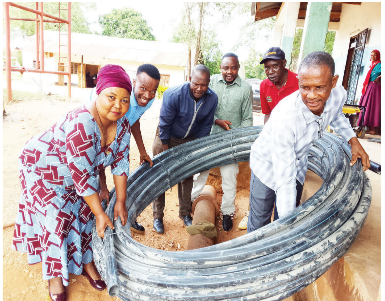
Mafundi wa Wakala wa Maji na Usafi wa Mazingira Vijijini (RUWASA) Wilaya ya Muheza, mkoani Tanga, wakibeba bomba la maji ili kulipakia kwenye gari kwa ajili ya kwenda kusambaza huduma ya maji kwa wananchi, wilayani humo juzi.

Katika jitihada za kupunguza gharama za matumizi ya nishati mbadala, serikali ime-saini makubaliano ya awali na wawekezaji kuhusu ruzuku ya Sh. bilioni 8.64 kwenye nishati safi ya kupikia mbapo jumla ya majiko 452,455 yamepata ruzuku.