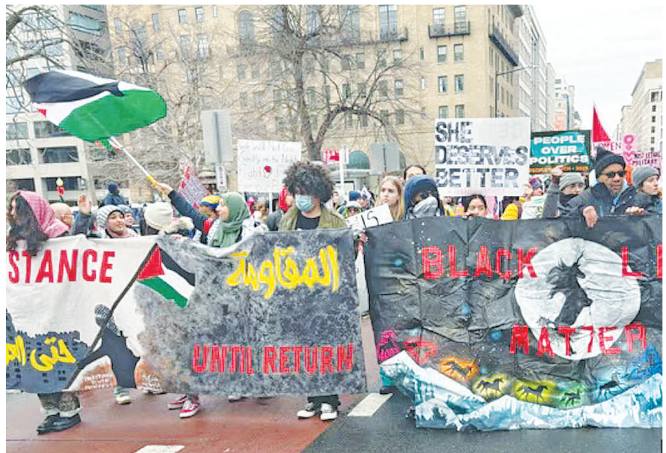
Maandamano ya wananchi wa Marekani yalipoanza kutoka uwanja wa Farragut, Washington, wakidai haki ya wanawake kuelekea kuapishwa kwa rais mteule Donald Trump, jana.

Pia ilielezwa kuwa vuguvugu la kutetea haki za wanawake Marekani limegawika baada ya Trump kumshinda makamu wa rais Kamala Harris mwezi Novemba. VOA