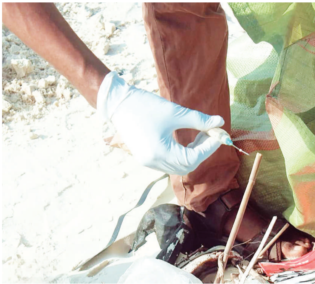
Sehemu ya taka hatarishi za hospitalini zilizookotwa katika ufukwe wa Rainbow, Manispaa ya Kinondoni na wadau wa mazingira waliokuwa wanafanya usafi kwenye ufukwe huo hivi karibuni.

"Ni changamoto kubwa zaidi katika Manispaa ya Kinondoni ambako asilimia 71 ya vituo vya afya hubeba taka hatarishi kwa