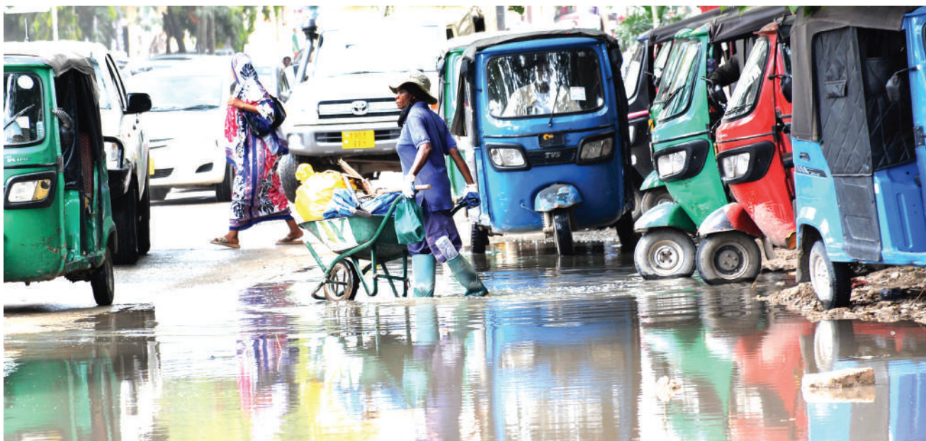
Bajaji zikiwa zimeegeshwa kusubiri abiria pembeni ya maji machafu yaliyotumama eneo la Mtaa wa Kisutu, jijini Dar es Salaam mapema wiki hii na kusababisha kero na usumbufu kwa abiria wanaotumia usafiri huo.

Alisema suala la ukosefu wa lishe limetambulika katika mikoa mbalimbali ukiwamo Mkoa wa Iringa ambapo kupitia elimu waliyoipata, wanaamini jamii itabadilika kwa kutumia kitaalamu mazao wanayolima katika kuboresha lishe za familia zao.