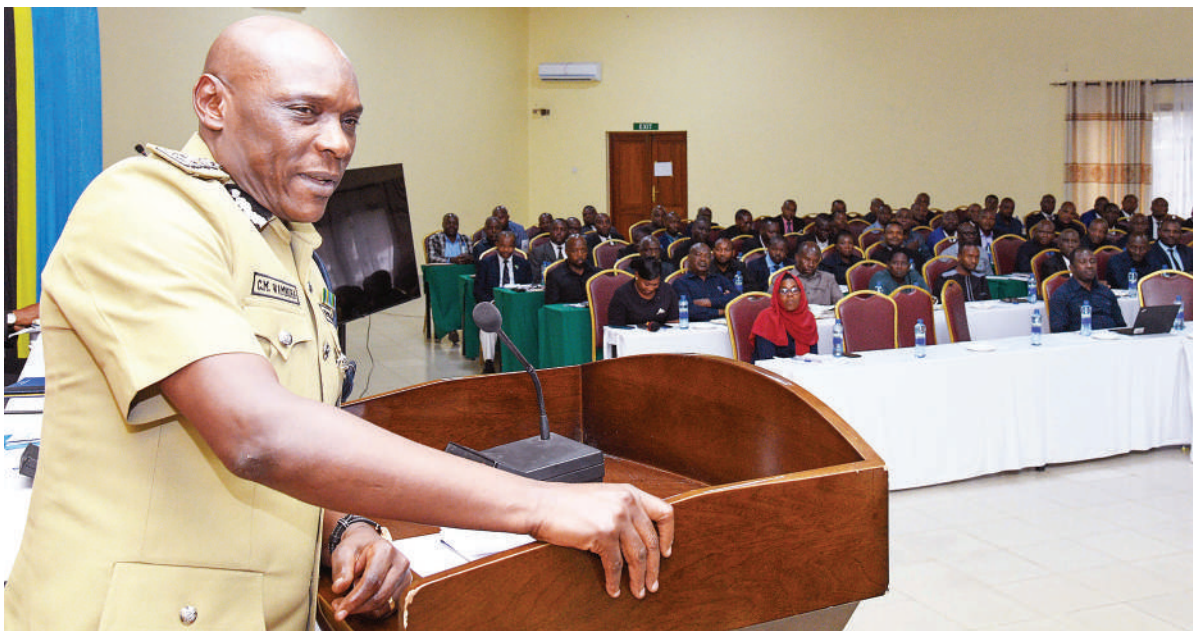
Mkuu wa Jeshi la Polisi nchini, IGP Camillus Wambura akizungumza na Wakuu wa Upelelezi wa Makosa ya Jinai wa Wilaya katika kikao kazi, jijini Dodoma jana.

Alisema ndoa ya wawili hao ilidumu kwa kipindi cha miaka 10 na kupata watoto wawili lakini baadaye mwanamke aliamua kutengana na mumewe akimtumia kuzidisha ulevi na kusahau majukumu ya familia.