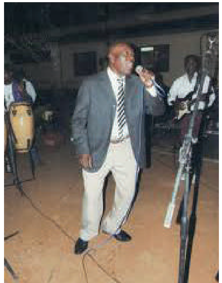
Mwimbaji, mtunzi na mwanamuziki wa zamani wa bendi ya TP OK Jazz, iliyokuwa ikiongozwa na Luambo Luanzo Makiadi, Franco, aliyefariki dunia Jumanne iliyopita nyumbani kwao nchini Congo Brazzaville, akiwa na miaka 84.