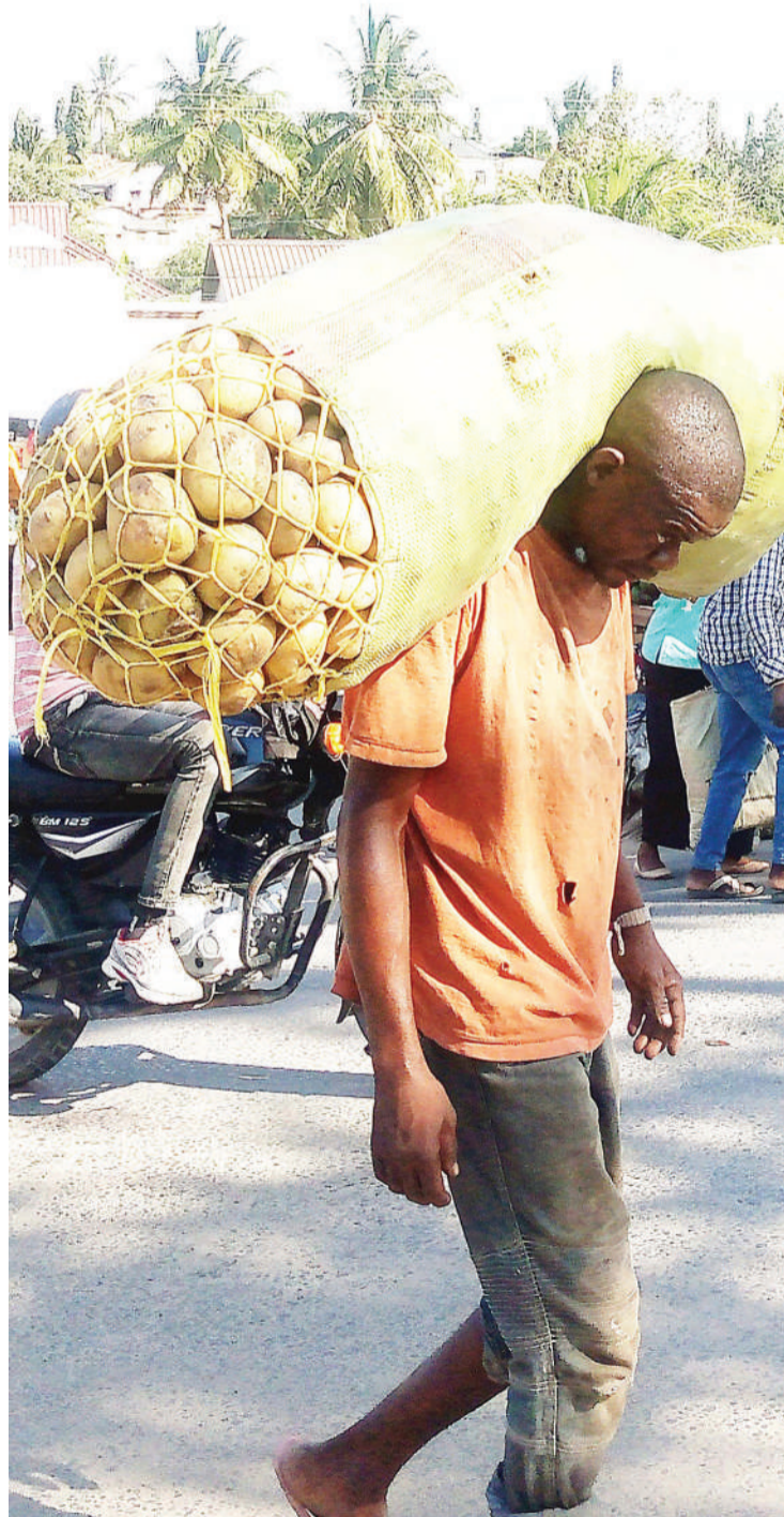
Mbeba mizigo akiwa amebeba kiroba cha viazi katika kituo cha daladala cha Mbezi Luis, Dar es Salaam jana, kwa ajili ya kujipatia ujira wa siku.

Washiriki wa kongamano hilo ni wanazuoni kutoka nchi za Uganda, Zambia, Jamaica, Uswisi, Uholanzi, Jamhuri ya Kidemokrasia ya Kongo (DRC), Nigeria, Kenya na wenyeji ni Tanzania Bara na Visiwani.