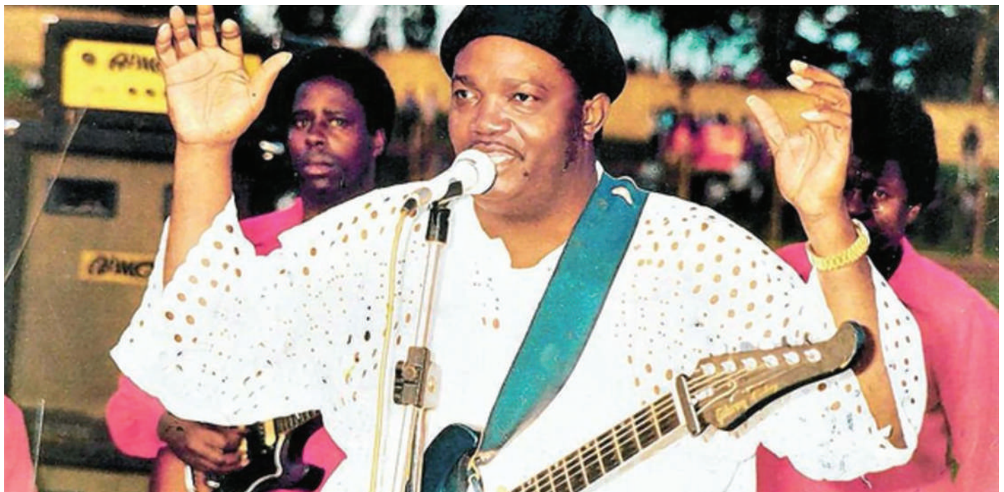
Mwanamuziki, kiongozi wa bendi ya TP OK Jazz, ambaye Oktoba 12 mwaka huu, alifikisha miaka 35 tangu alipofariki dunia 1989 nchini Ubelgiji.

na shabiki yoyote wa muziki aliyesikia wala kujua habari zake, kutokana na matatizo ya afya, lakini mashabiki wake wa muda mrefu wataendelea kukumbuka uhodari wake akiwa jukwaani, hasa umahiri kwenye uchezaji wake hasa kwenye kutikisa mwili na miguu, kiasi cha kuleta burudani.