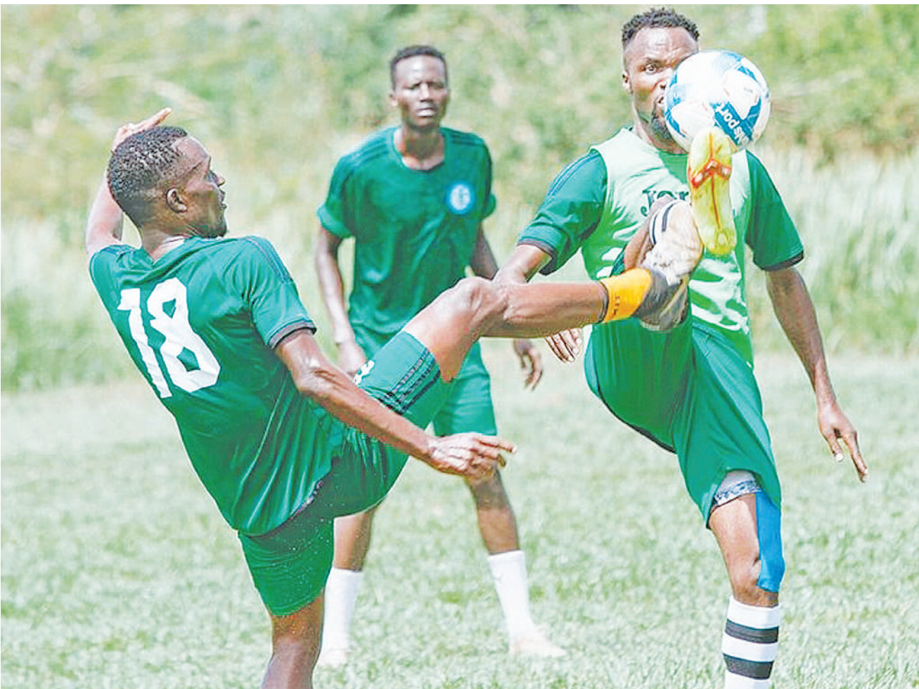
Wachezaji wa Kagera Sugar wakifanya mazoezi kwa ajili ya kujiandaa na mechi ya Ligi Kuu Tanzania Bara dhidi ya Pamba Jiji FC itakayochezwa kesho kwenye Uwanja wa CCM Kirumba jijini Mwanza.

Ligi Kuu Tanzania Bara inatarajia kuendelea leo kwa Simba kuikaribisha Yanga wakati mechi nyingine itakayochezwa kesho ni kati ya Singida Black Stars dhidi ya Namungo FC.