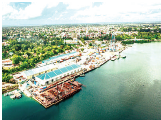
Bandari ya Tanga