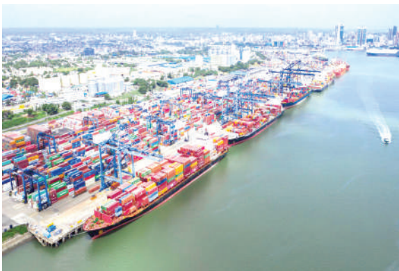
Bandari ya Dar es Salaam eneo la kuhudumia Makasha

Shehena ya Uganda kupitia bandari ya Dar es Salaam iliongezeka hadi tani za metriki 191,282 mwaka 2020/2021, kutoka tani metriki 140,269 zilizorekodiwa mwaka uliopita.