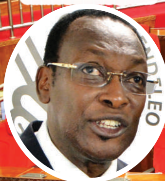
Mwenyekiti wa Chadema, Freeman Mbowe

Mwonekano wa viti upande wanaokaa wabunge wa kambi ya upinzani Bungeni, vikiwa wazi kutokana na wabunge 19 wa viti maalumu wa Chama cha Demokrasia na Maendeleo (CHADEMA), kutoonekana kwenye kikao cha 21 cha mkutano wa saba wa Bunge, jijini Dodoma jana.