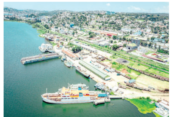
Bandari ya Mwanza