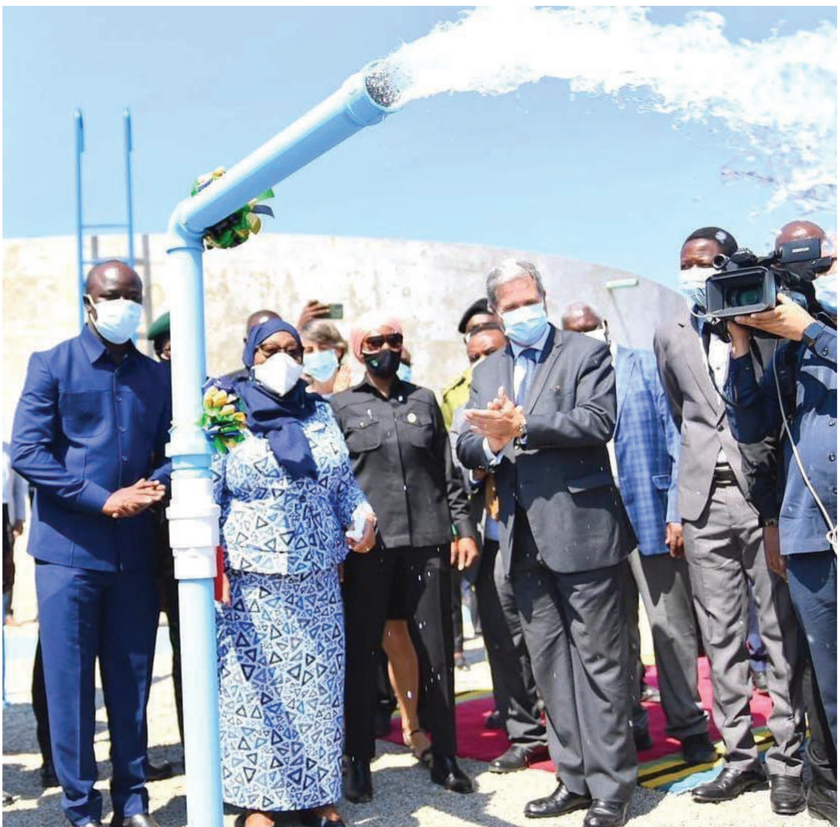
Mhe. Samia Suluhu Hassan, Rais wa Jamhuri ya Muungano wa Tanzania akizindua mradi wa maji wa Misungwi