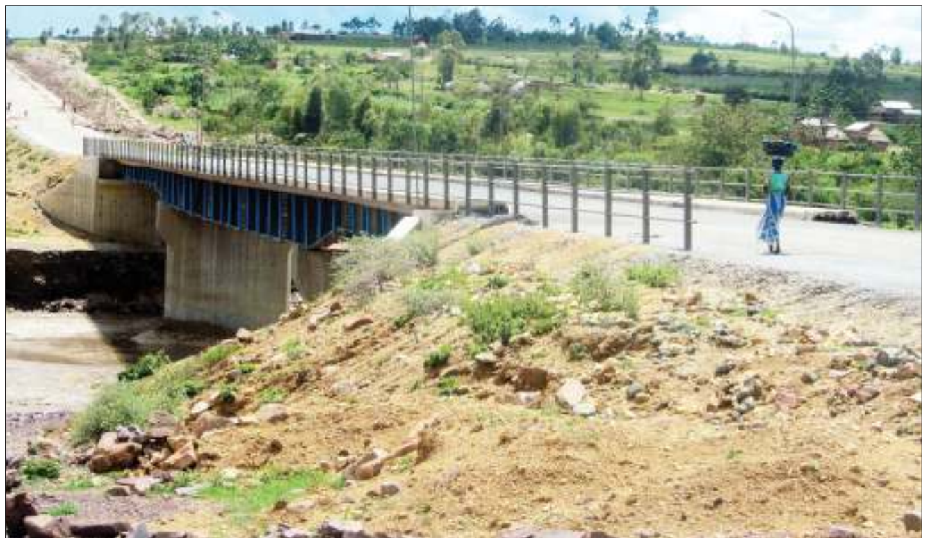
Mwananchi akipita kwenye daraja jipya la Mto Mara, lililopo mpakani mwa wilaya za Serengeti na Tarime mkoani Mara juzi, ambalo limekamilika ujenzi wake, hatua ambayo imesaidia kuwaondolea madereva usumbufu kusubiri kupishana kwenye daraja la zamani ambalo lilikuwa ni dogo.

Mtuhumiwa huyo yuko nje kwa dhamana, baada ya kutimiza masharti ya dhamana yaliyomtaka kuwa na wadhamini wawili kila mmoja akisaini bon- di ya Sh. milioni moja.