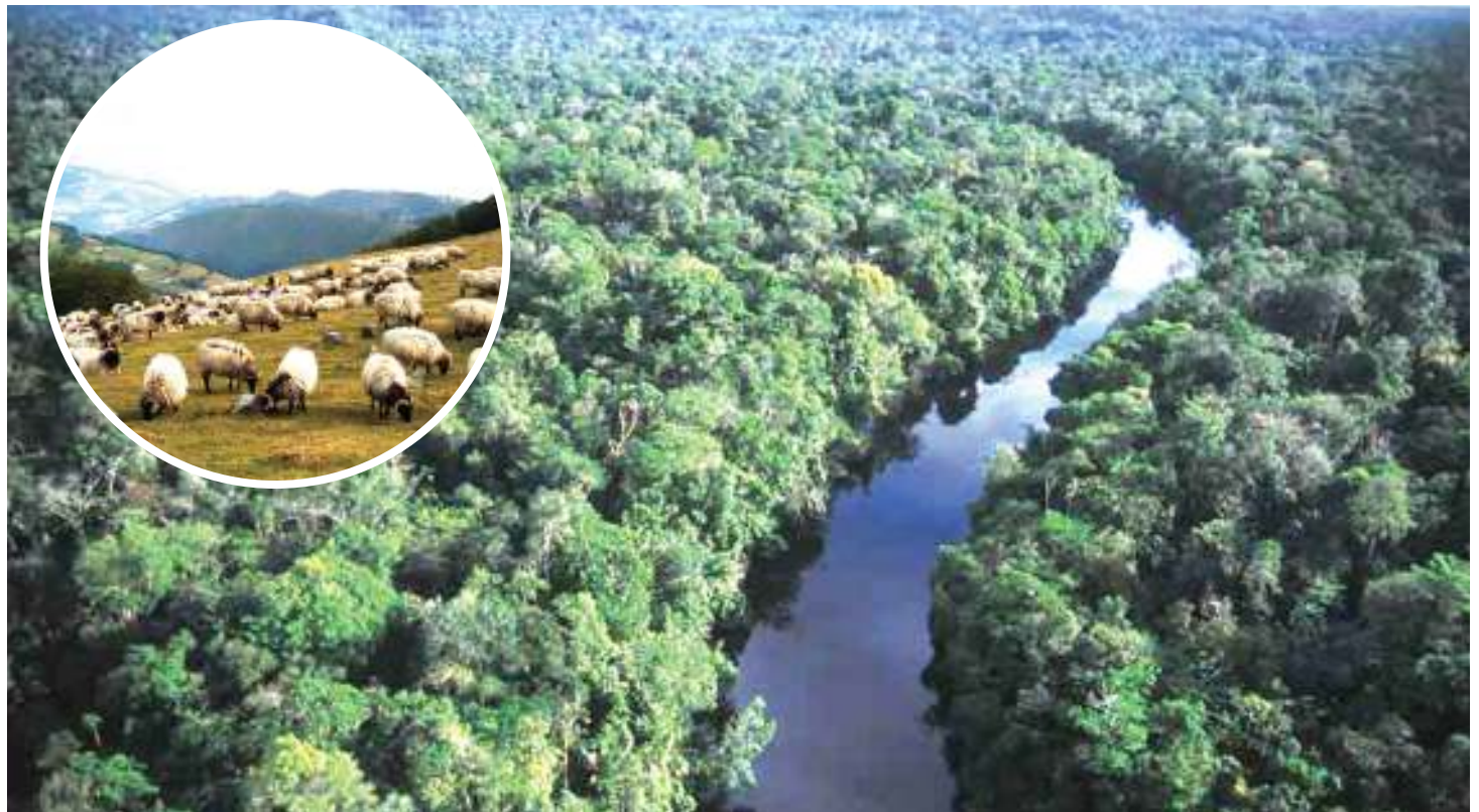
Sehemu ya msitu ulioko nchini Israeli. Picha ndogo, wanyama wakineemeka na mlo, pia hewa safi ya oksijeni. PICHA ZOTE: MTANDAO.

Taarifa zinasema kuna upana zaidi wa jitihada hizo, kwani suala halisi ni jinsi ya kutumia hewa hiyo ya ukaa inayoharibu mazingira, kwa kuongeza joto katika