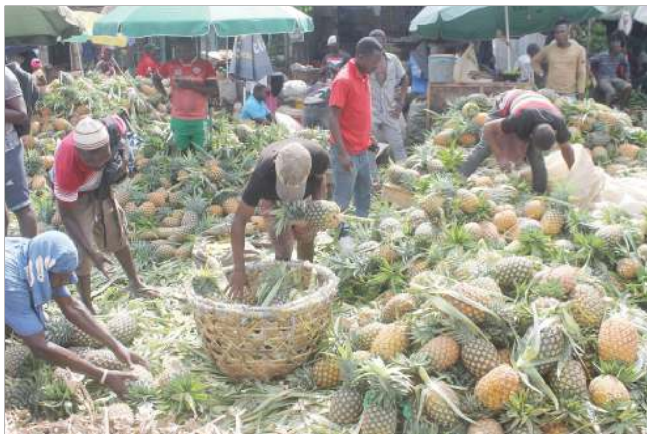
Wakazi wa Jiji la Dar es Salaam, wakichagua mananasi katika Soko la Buguruni, jijini humo, jana. Kutokana na tunda hilo, kuwa katika msimu wake, bei ya nanasi moja imeshuka na kuuzwa kwa 500/- hadi 1,500/- kulingana na ukubwa wake.