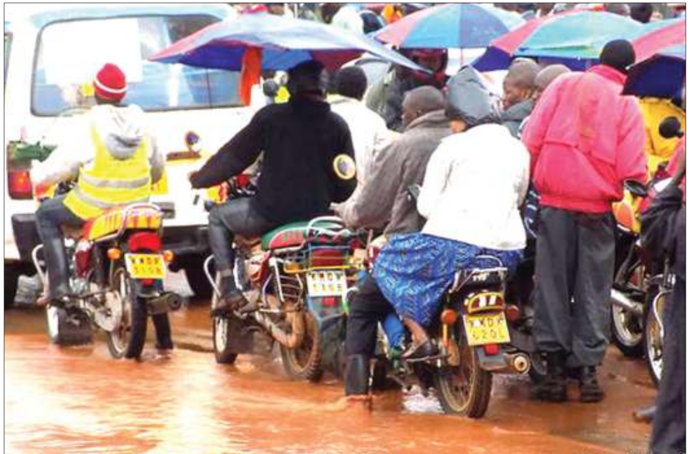
Mvua zinazoendelea kunyesha nchini Kenya zimeleta usumbufu kwa wakazi hususani wanaotumia vyombo vya usafiri.