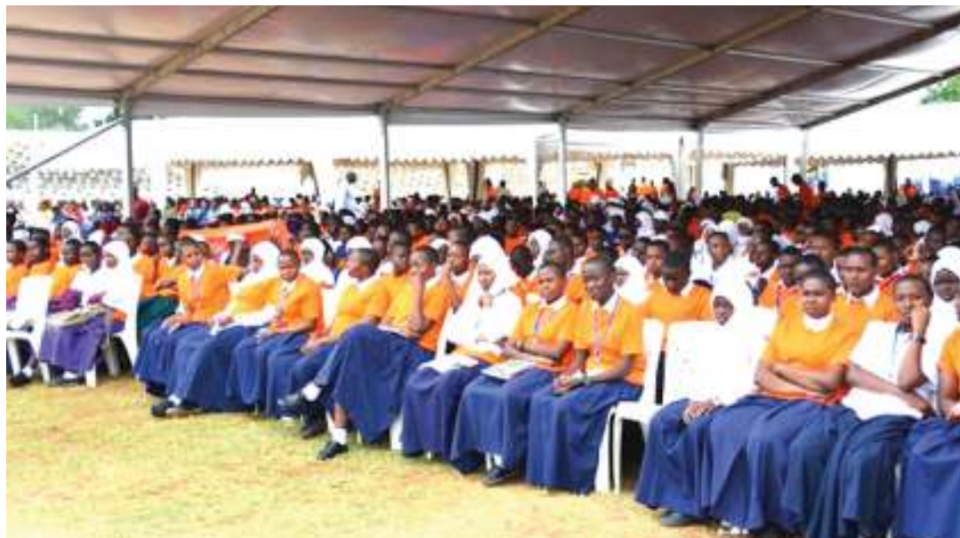
Baadhi ya wanafunzi kutoka Shule za Sekondari za Mkoa wa Dodoma wakiwa katika uzinduzi wa siku 16 za Kampeni ya kupinga ukatili wa kijinsia iliyofanyika kitaifa jijini Dodoma.

Anasema, wanaume wanaofanyiwa vitendo vya ukatili wa kijinsia na wake zao kuacha kuona aibu kuomba msaada na badala yake watoe taarifa kwenye madawati ya kijinsia, wasaidiwe kupata haki zao.