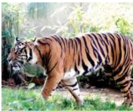
Mnyama Tiger, katika nyendo zake.