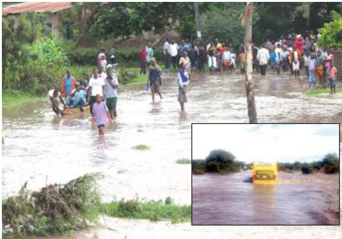
Abiria wakisubiri maji yapungue kwenye daraja la Tirina.

Hata hivyo, dereva wa lori aina ya Scania lenye trela, ambaye alikuwa akitokea Mugumu, alilazimisha kupita kwenye maji hayo. Hapo ni ghafla mithili ya tamthilia, gari lake ilizolewa na maji likalala upande.