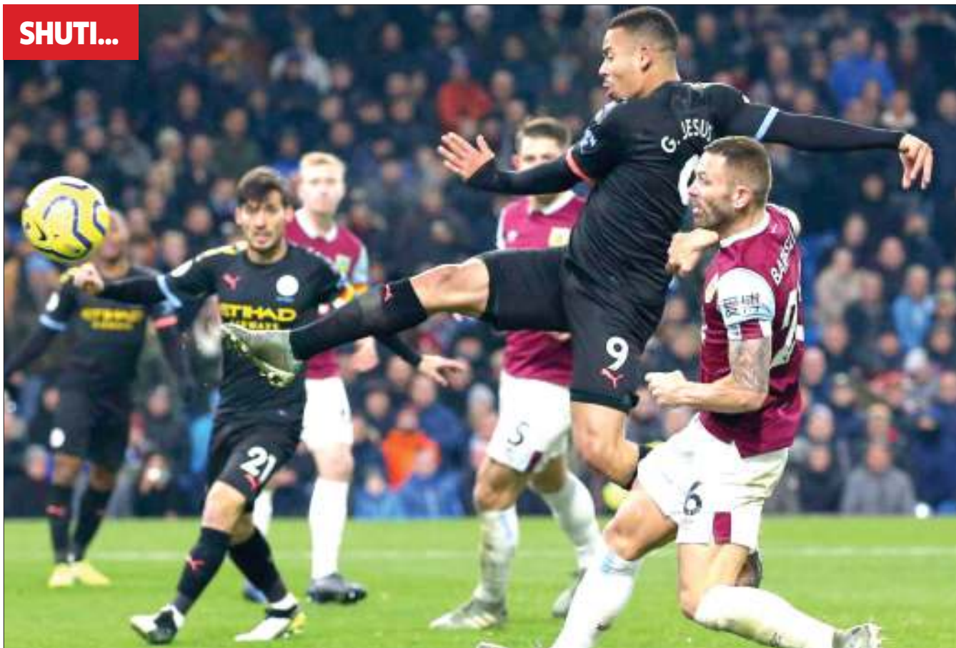
Mshambuliaji wa Manchester City, Gabriel Jesus aliyefunga mabao mawili wakati wakishinda 4-1 dhidi ya Burnley juzi usiku, akiachia shuti langoni mwa wapinzani wao hao, huku akizongwa na mabeki wa timu hiyo kwenye mchezo huo wa Ligi Kuu uliopigwa katika Uwanja wa Turf Moor. HABARI UK. 28