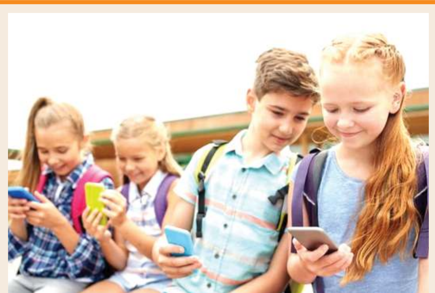
Mazingira ya 'magonjwa' ya kutumia simu.

MINYOO TUMBO Dk. Thobias, anataja aina tatu