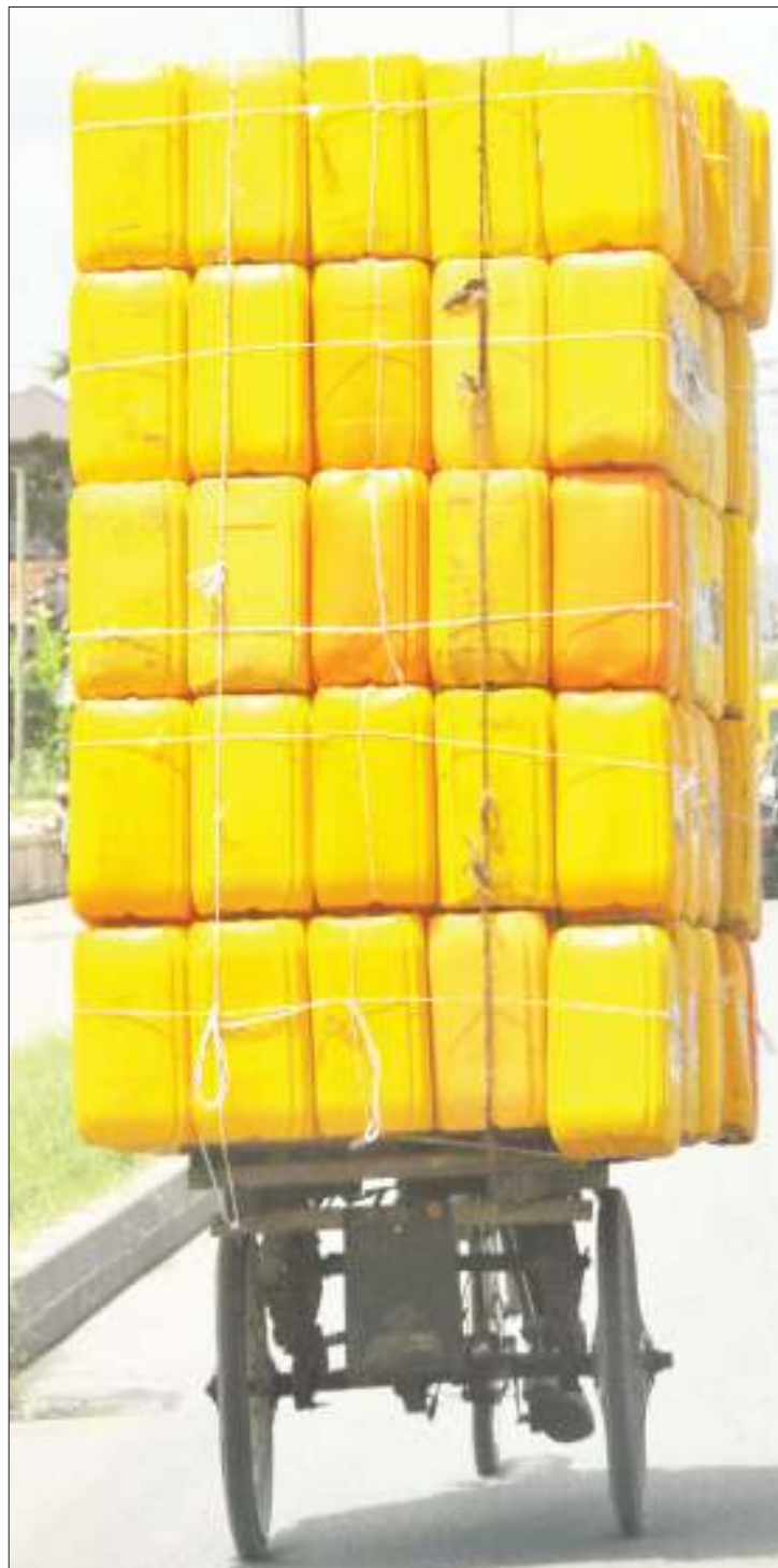
Mwendesha guta akiwa amesheheni mzigo wa madumu matupu ya plastiki, katika Barabara ya Morogoro, eneo la Jangwani, jijini Dar es Salaam jana, kitendo kinachomfanya ashindwe kuona magari yanayokuja nyuma jambo ambalo ni hatari kwa usalama barabarani.

Aliongeza kuwa kwa kutambua umuhimu wa kipindi hiki ndio maana amesimamisha kwa muda likizo za Maofisa Ugani na Kilimo ili waweze kutoa ushauri utakaomsaidia mkulima kulima kisasa.