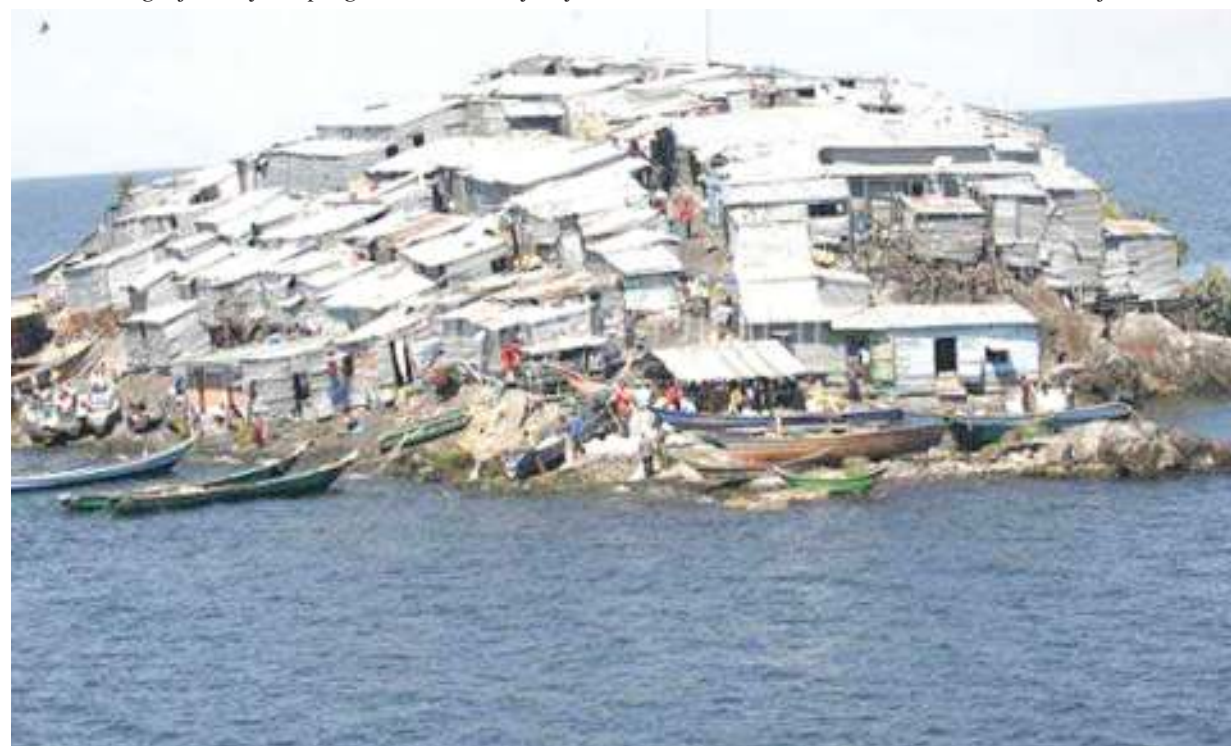
Makazi ya aina yake wilayani Sengerema: Picha zote: MPIGAPICHA WETU.

afya zao, badala ya kubuni matibabu wakiwa nyumbani na kutumia dawa za miti shamba, akihitimisha kwamba ‘kinga ni bora kuliko tiba.’ Mwandishi anapatikana Kanda ya Ziwa kwa amwani ya barua pepe: anthonygervas@yahoo.com na simu (+255) 0682 86 92 44.