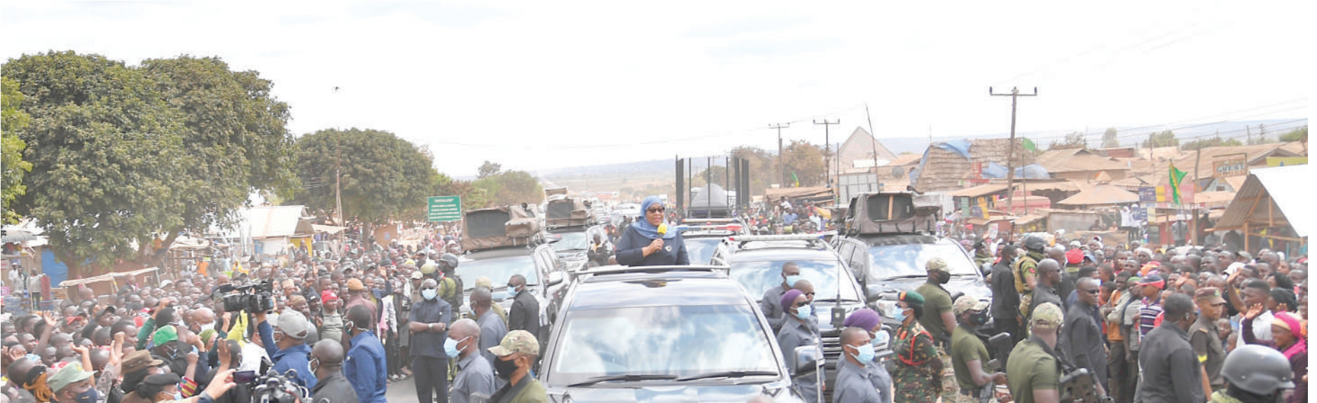
Rais Samia Suluhu Hassan akizungumza na wananchi wa Kibaigwa, mkoani Dodoma jana, akiwa safarini kuelekea mkoani Morogoro kwa ajili ya ziara ya kikazi siku mbili.