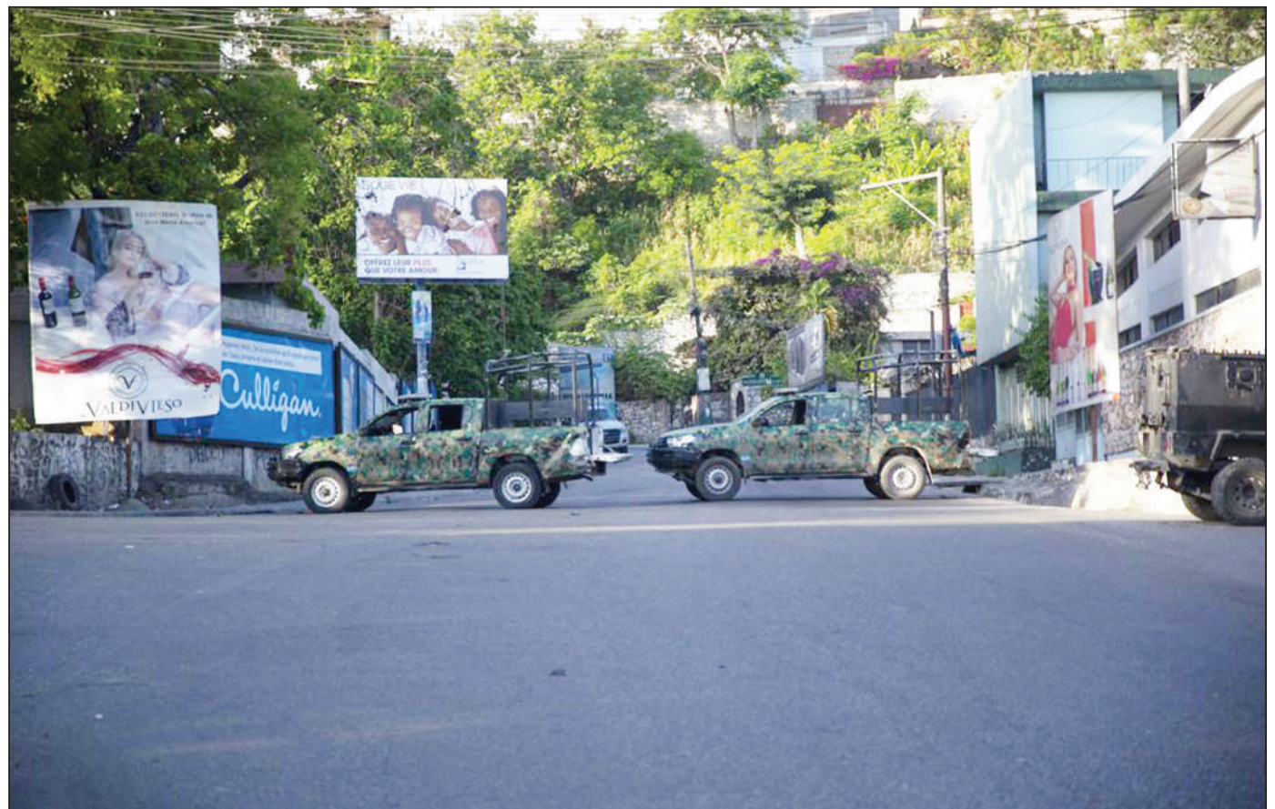
Magari ya jeshi yakiwa yameweka zuiu kwenye lango la kuingilia Petion Ville, jirani na makazi ya Rais Jovenel Moise, mji mkuu Port-Au-Prince, jana. Moise aliuawa jana akishambuliwa nyumbani kwake huku mke wake, Martine Moise akijeruhiwa na kulazwa hospitalini.