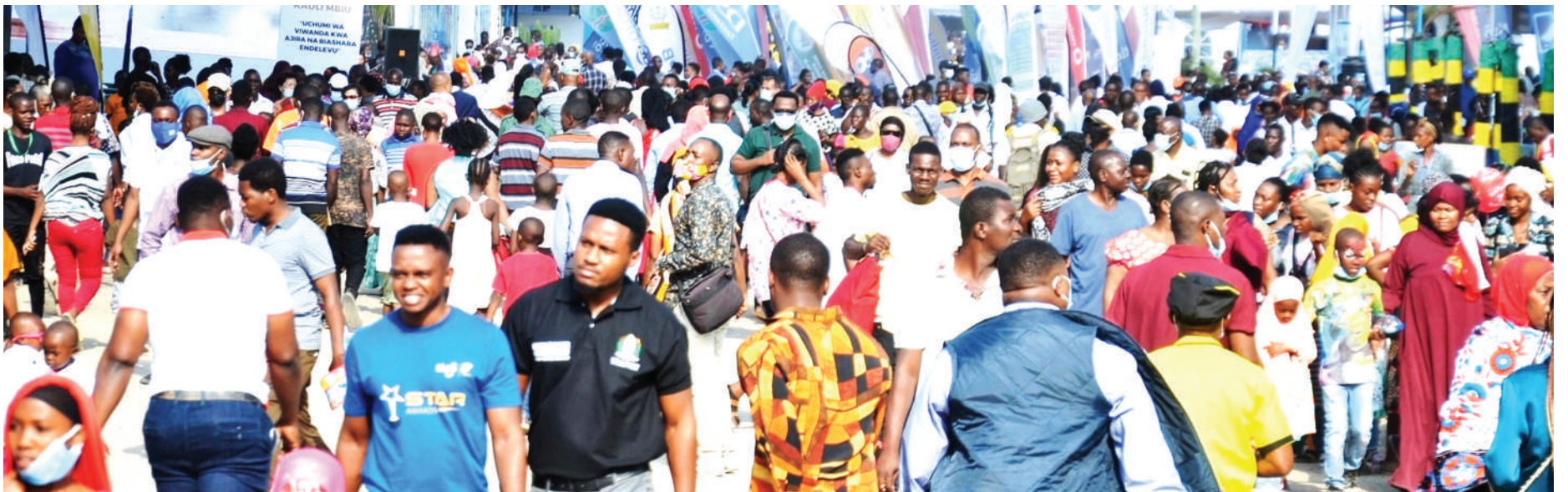
Wananchi wakiwa katika Maonyesho ya 45 ya Biashara ya Kimataifa ya Dar es Salaam, katika Uwanja wa Mwalimu Nyerere jana, huku wachache wakiwa wamechukua tahadhari za kujikinga na maambukizi ya virusi vya ugonjwa wa Corona kwa kuvaa barakoa.

Samia aonya kupuuza hadhari dhidi ya corona, wizara yaanika mikakati kuikabili, TMDA yajipanga... Endelea Uk. 2, 3 & 4