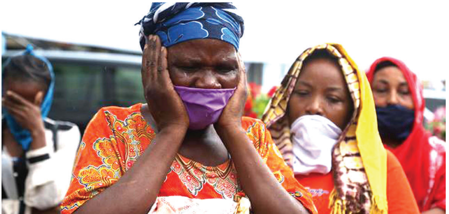
Namna ilivyo vita dhidi ya corona.

•Barakoa, maji tiririka... kituo afya muhimu