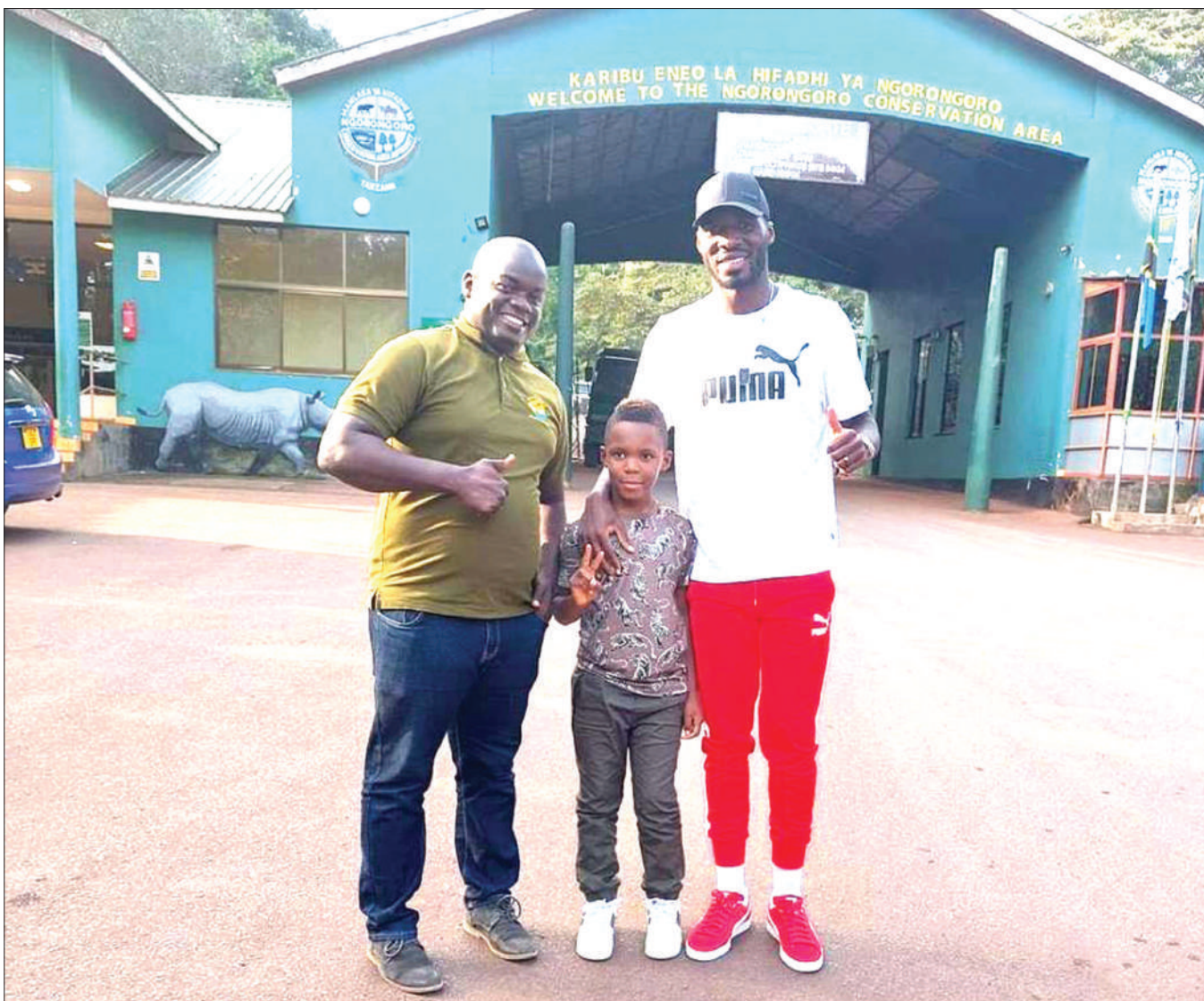
Mshambuliaji wa Ubelgiji na Klabu ya Crystal Palace ya Ligi Kuu England, Christian Benteke (kulia), baada ya kuwasili katika lango kuu la Hifadhi ya Ngorongoro.

Benteke alikuwa miongoni mwa wachezaji waliokuwamo kwenye kikosi cha Ubelgiji kwenye michuano hiyo inayoendelea ikiwa imefika katika hatua ya fainali.