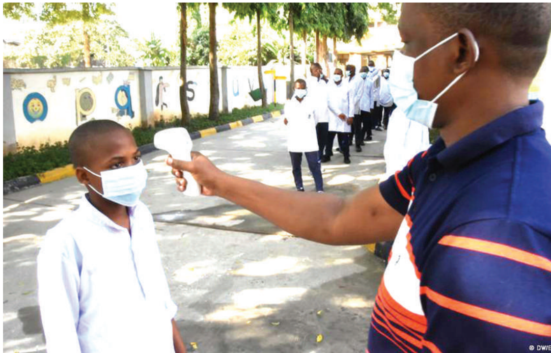
Aina ya hatua za kujihami dhidi ya corona kwa wanafunzi shuleni.

Katibu Mkuu anasema serikali inawakumbusha viongozi wa taasisi za elimu, kuboresha mifumo ya malezi mabwenini, kupitia ukaguzi na ufuatiliaji wa kila mara