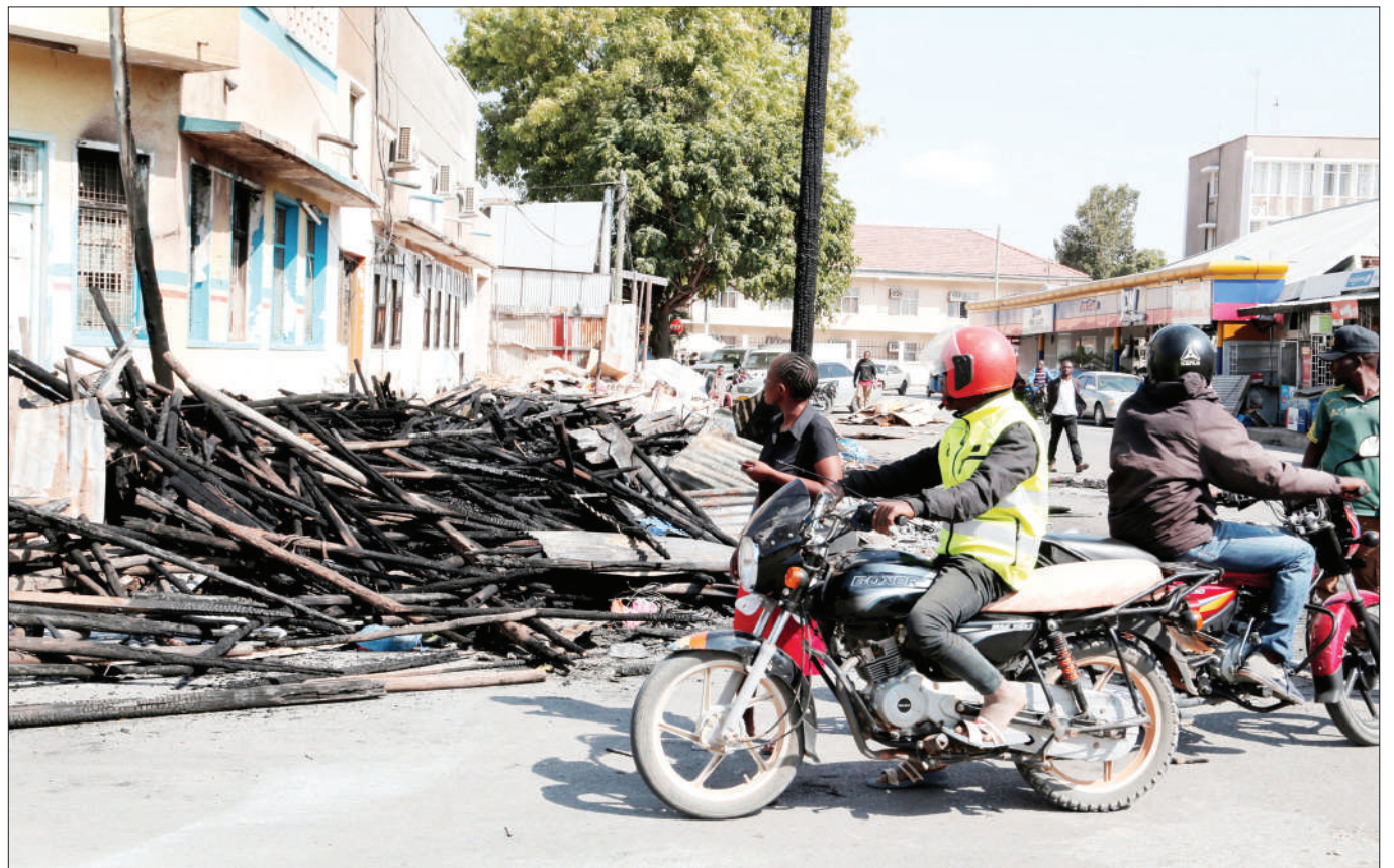
Wananchi wakiangalia mabaki ya vibanda vilivyoyungua moto katika Barabara ya Tabora, jijini Dodoma juzi usiku na kuteketeza mali za wafanyabiashara.

Alisema watu wenye ulemavu wa ukoma wamesahaulika kisera na kujikuta wako katika mateso kwenye maisha yao kutokana na kukosa mahitaji muhimu.